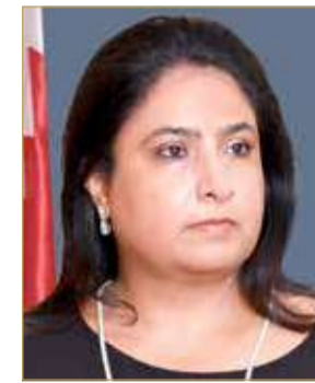
الشيخة رنا بنت عيسى

لمجلس التعليم العالي في دعم مؤسسات التعليم العالي ولتمكينها من أداء مهامها ورسالتها التعليمية والعلمية ومتمنيا لها دوام التوفيق لكل ما يسهم في تطوير التعليم العالي والارتقاء به وتحسين مخرجاته.