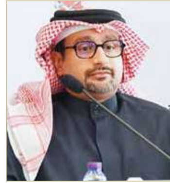
الشيخ سلمان بن محمد

المتزايدة والناجمة عن التقنيات الناشئة أو المبتكرة والمستخدمة في القطاع. وفيما يخص محور دعم الاقتصاد الرقمي، أوضح الشيخ سلمان أنه سيتم إطلاق استراتيجية وطنية للأمن السيبراني بهدف توفير بيئة إلكترونية آمنة وموثوقة في جميع القطاعات الحيوية بالبحرين، ورفع الوعي والكفاءات في المجال ومستوى الاستعداد والجاهزية في مجال الأمن السيبراني، وتنسيق الجهود وفق أفضل الممارسات المحلية والعالمية، وتعزيز الشراكة مع الدول الأخرى واغتنام الفرص للابتكار الاقتصادي، وتأمين مستوى أمن عالٍ ومرن وحوكمة معايير فعالة، وتعزيز الشراكة والتعاون، وتنمية القوى العاملة في المجال، وتحليل ما يتم رصده من حوادث وهجمات سيبرانية، والتطوير المستمر للتشريعات والقواعد والأنظمة.