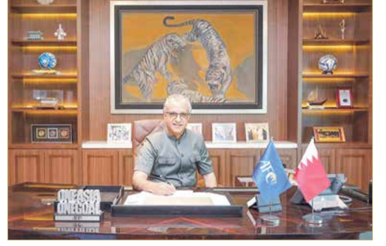
سلمان بن إبراهيم

وشدد رئيس الاتحاد الآسيوي لكرة القدم النائب الأول لرئيس الاتحاد الدولي لكرة القدم الشيخ سلمان بن إبراهيم آل خليفة على ضرورة رعاية وحماية اللاعبين الأطفال والشباب كواجب أساس للاتحاد، وقال: أطفالنا وشبابنا هم المستقبل، وهم يمثلون آمالنا وطموحاتنا؛ من أجل إرث أفضل وأكثر إشراقاً لكرة القدم