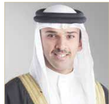
علي بن خليفة

أكد رئيس مجلس إدارة الاتحاد البحريني لكرة القدم الشيخ علي بن خليفة آل خليفة تسخير إمكانيات الاتحاد كافة لإنجاح المعسكر التدريبي الذي يقمه نادي قرطبة الإسباني في مملكة البحرين ويستمر حتى 18 يناير الجاري.