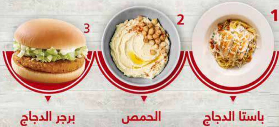
1. باستا الدجاج 2. الحمص 3. برجر الدجاج