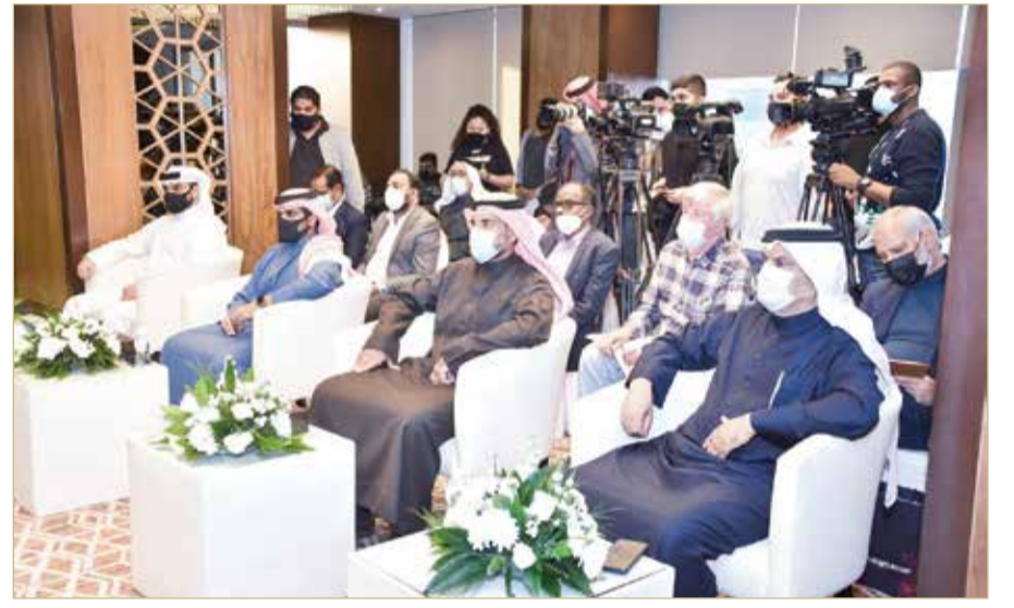
سمو الشيخ سلمان بن محمد يشهد الإعلان الرسمي لبطولة كأس السوبر