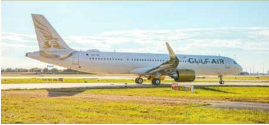
دعوات للتعاون مع الناقل الوطني لتفعيل رحلات الطيران العارض