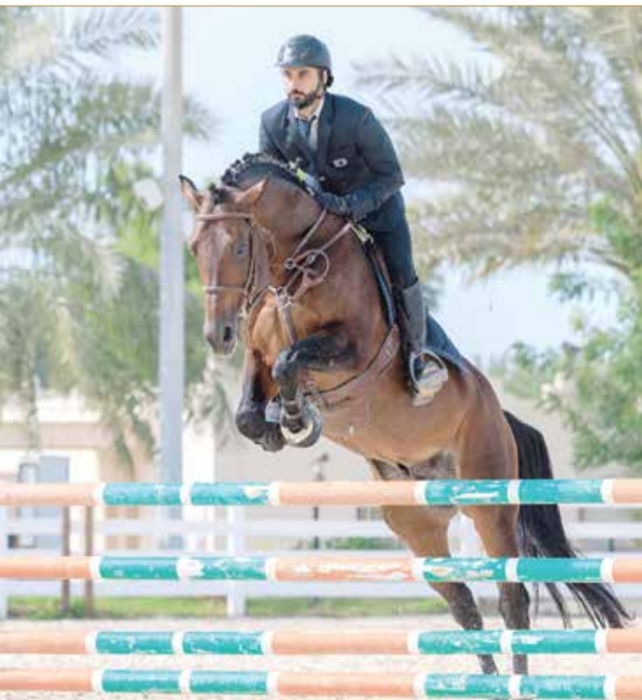
من مسابقة قفز الحواجز

للفرسان الناشئين في الميدان، فقد وصلنا مع البطولة الثالثة لارتفاعات بلغت 140 سم خلال البطولة الماضية بالنسبة لمسابقات الكبار، وهذا الموسم مميز أيضاً في جانب آخر، فلدينا مجموعة ووجوه جديدة من الفرسان يشاركون في مسابقات وبطولات القفز لأول مرة أو بعد توقف فترة، وهذا يدل على نجاح الخطة في تطوير رياضة القفز بالمملكة الحبيبة". وأشار مدير بطولات قفز الحواجز أن اللجنة المنظمة قد أنهت كافة التجهيزات الخاصة لانطلاق بطولة سمو الشيخ خالد بن حمد آل خليفة