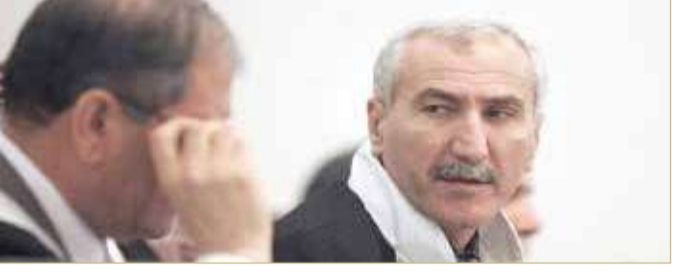
القاضي زكارا يترشح لرئاسة العراق

عن صدور 98 أمر قبض واستقدام خلال ديسمبر الماضي، مشيرة إلى أن تلك الأوامر صدرت بحق 85 من كبار المسؤولين، بينهم وزير حالي. وأفادت دائرة التحقيقات في هيئة النزاهة في العراق أن أوامر القبض والاستقدام التي أصدرتها الجهات القضائية جاءت على خلفية قضايا حققت فيها مديريات ومكاتب تحقيق الهيئة في بغداد والمحافظات وأحالتها إلى القضاء.