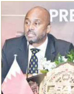
رئيس الاتحاد الدولي لفنون القتال المختلطة