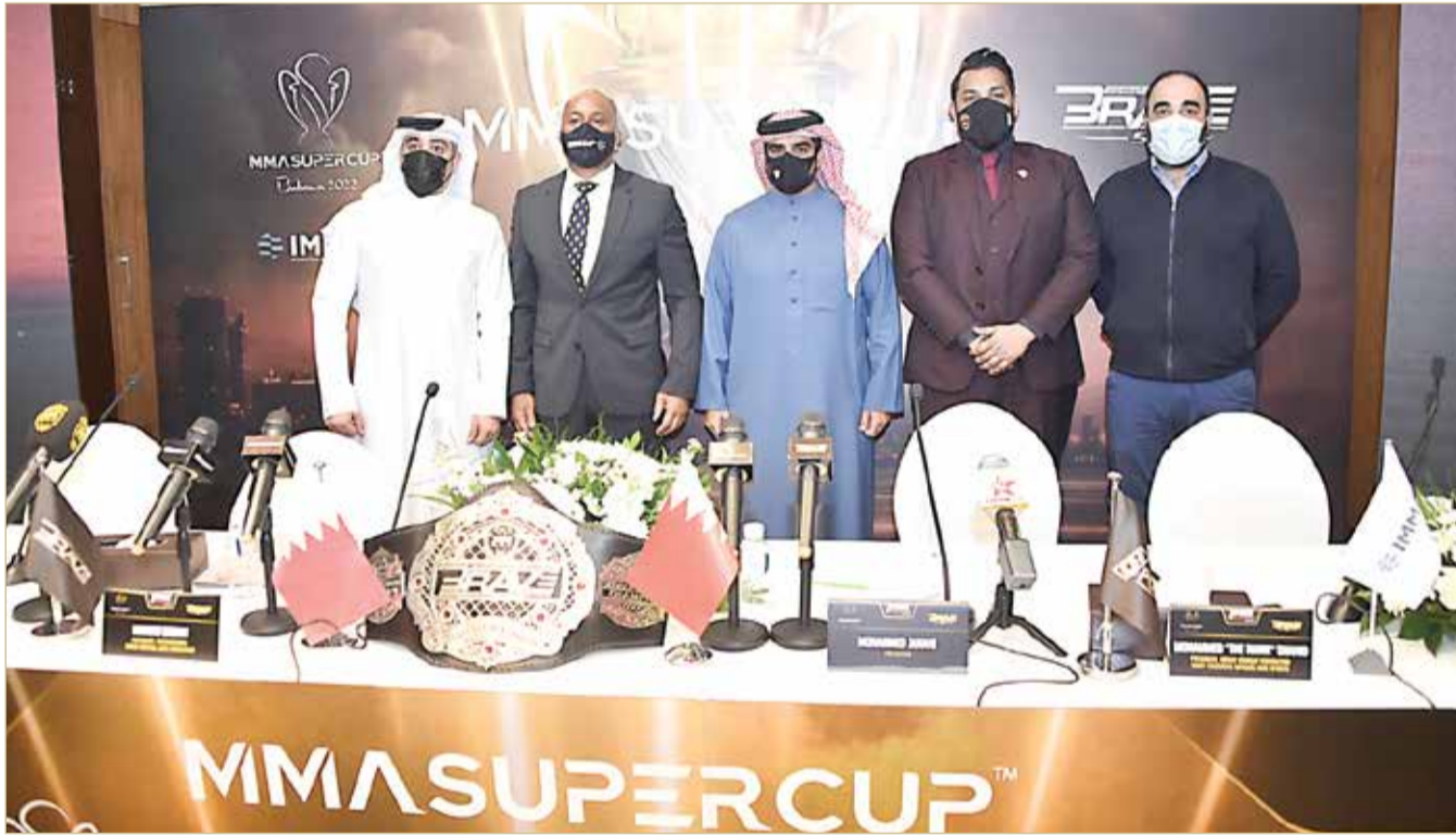
سمو الشيخ سلمان بن محمد