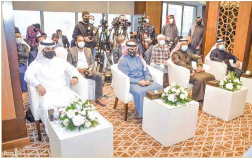
سمو الشيخ سلمان بن محمد خلال المؤتمر الصحفي