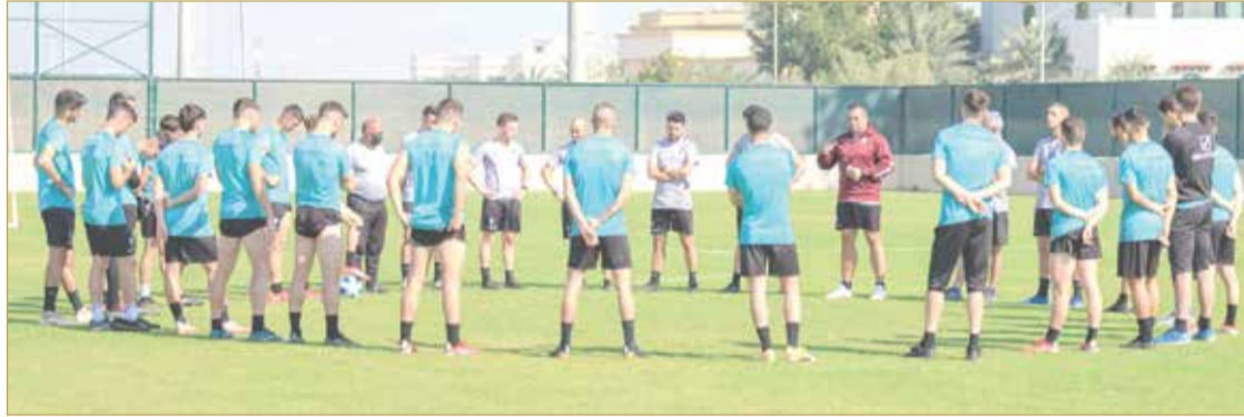
جانب من تدريبات الفريق

وفي إطار البرنامج السياحي؛ للتعرف على معالم البحرين والأماكن السياحية، سيقوم الفريق اليوم بزيارة إلى محمية العرين في جولة سياحية، ثم سينتقل إلى حلبة ومرافقها، إضافة إلى إقامة برنامج خاص للفريق عبارة عن سباق في رياضة الكارتغ للسيارات.