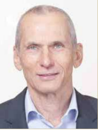
وزير الأمن الداخلي بدولة إسرائيل