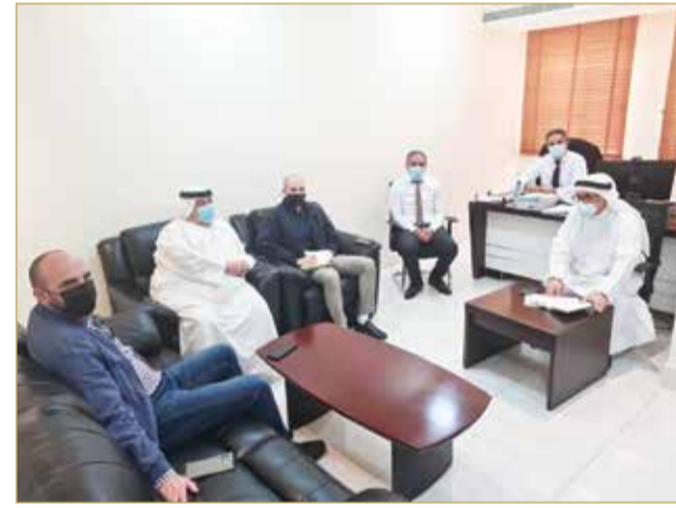
إحدى الزيارات الميدانية للمنطقة