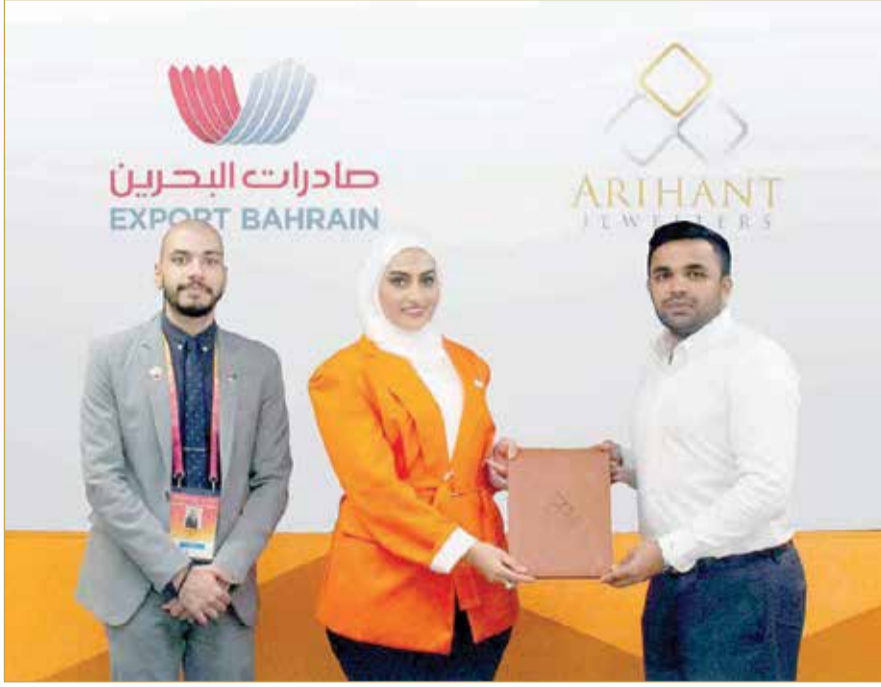
عقب توقيع الاتفاقيات

ساعدت صادرات البحرين المؤسسات الصغيرة والمتوسطة في مملكة البحرين بشكل استراتيجي لتصدير أكثر من 56 فئة مختلفة من المنتجات والخدمات عبر مختلف القطاعات الاقتصادية. ومنذ إنشائها في نوفمبر 2018، قامت صادرات البحرين بدعم المنتجات والخدمات التي يتم تصنيعها في البحرين لتصل إلى أكثر من 57 سوقاً في دول مجلس التعاون الخليجي، وآسيا، وإفريقيا، وأوروبا، وأستراليا، والمملكة المتحدة والولايات المتحدة الأميركية.