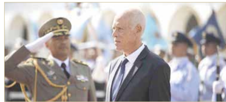
الرئيس التونسي بريد القطع مع سياسة الإفلات من العقاب

كذلك خلال العشر سنوات الأخيرة من حكم الرئيس التونسي الراحل زين العابدين بن علي.