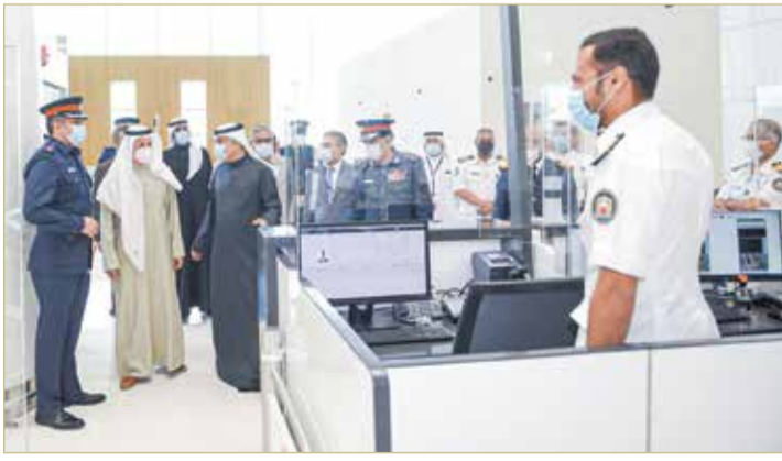
أثناء الجولة في المطار

وأشاد وكيل وزارة الداخلية لشؤون الجنسية والجوازات والإقامة، بتوجيهات وزير الداخلية الفريق أول الشيخ راشد بن عبد الله آل خليفة، التي تؤكد على سهولة حركة المسافرين وتقديم التسهيلات اللازمة في هذا الشأن، مثنياً الشراكة القائمة مع وزارة المواصلات وشركة مطار البحرين في مجال تقديم خدمات عالية الجودة للمسافرين.