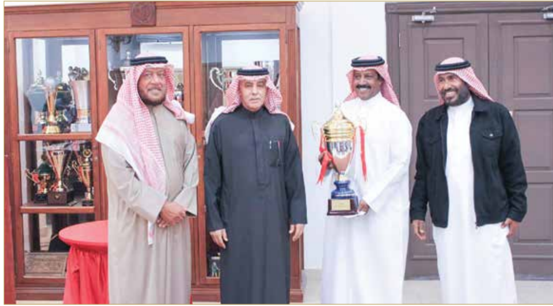
جانب من التتويج

تحت رعاية كريمة من صاحب السمو الملكي الأمير سلمان بن حمد آل خليفة ولي العهد رئيس مجلس الوزراء، اختتمت مؤخراً بطولة كأس سمو ولي العهد السنوية للجولف التي أقيمت على ملعب نادي البحرين للجولف في الحنيينة، بمشاركة جميع أعضاء النادي بمختلف الفئات.