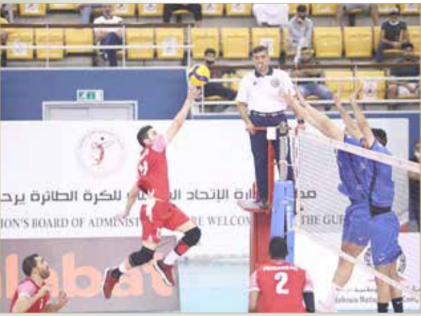
من لقاء المحرق والنصر لكرة الطائرة