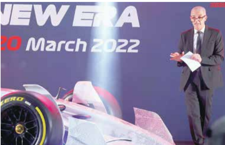
لقطات من المؤتمر الصحفي