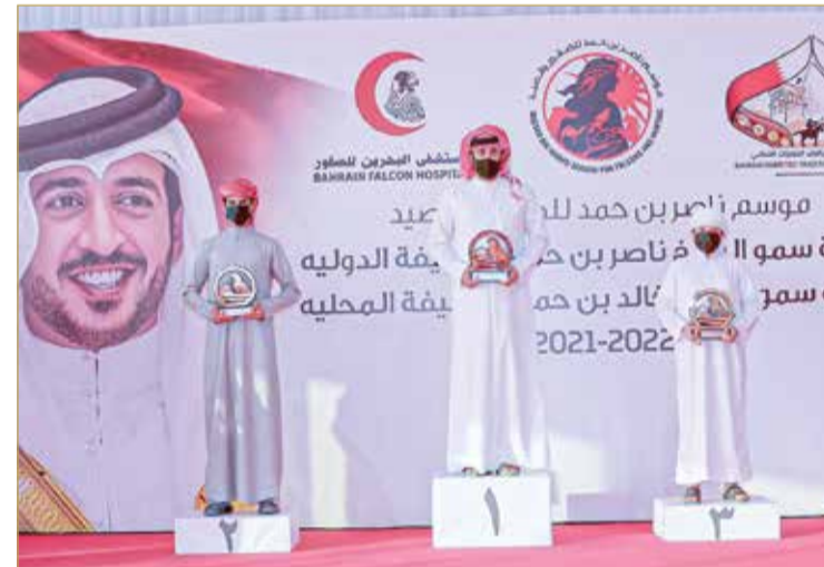
جانب من التتويج

توج الفائزين في بطولة خالد بن حمد للصقور بعد انتهاء كافة أشواط العموم والمحترفين ضمن المنافسات التابعة لموسم ناصر بن حمد للصقور والصيد في نسخته الثامنة. وجرى تتويج الفائزين الثلاثة الأوائل في كل شوط من قبل اللجنة البحرينية لرياضات الموروث الشعبي التابعة للمجلس الأعلى للشباب والرياضة وهي الجهة المسؤولة عن تنظيم موسم ناصر بن حمد للصقور والصيد، علماً أن كل شوط يشهد فوز المتسابقين العشرة الأوائل.