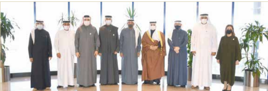
ناس مستقبلاً السفير البحريني لدى السعودية

من جانبه، أعرب سفير البحرين المعين لدى السعودية الشيخ علي بن عبدالرحمن آل خليفة عن اعتزازه بالثقة الملكية بهذا التكليف، مؤكداً حرصه على تعزيز آفاق التعاون المشترك ومواصلة الجهود؛ لتوطيد وتوثيق العلاقات التجارية والاقتصادية وتطويرها لما يخدم مصالح البلدين الشقيقين، مشيداً بجهود غرفة تجارة وصناعة البحرين وحرصها على تطوير التعاون المشترك بين الدول الشقيقة والسعي نحو الارتقاء بالاستثمارات والتبادل التجاري وتسويق مملكة البحرين.