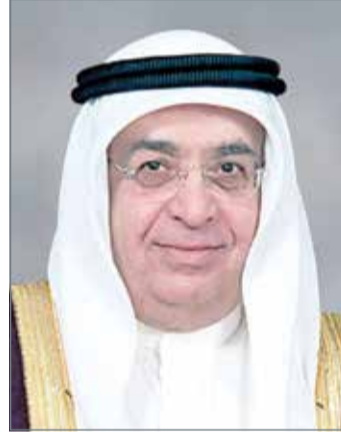
سمو الشيخ محمد بن مبارك

في بداية الاجتماع، أشاد المجلس بتفضل ولي العهد رئيس مجلس الوزراء صاحب السمو الملكي الأمير سلمان بن حمد آل خليفة، بافتتاح المبنى الجديد لمعهد البحرين للدراسات المصرفية والمالية في منطقة خليج البحرين، منوها بالدور الذي تضطلع به المؤسسات التعليمية والتدريبية بقطاع الخدمات المالية الداعمة لأولويات خطة التعافي الاقتصادي، ومنها معهد البحرين للدراسات المصرفية والمالية، وما يربطه بالمعاهد الدولية المتخصصة من علاقات وشراكات فاعلة بهذا المجال وبالأخص شراكته مع معهد لندن للدراسات المصرفية والمالية (LIBF) الذي تم التوقيع معه على 3 اتفاقيات مما يساهم في تطوير رأس المال البشري على المستويين المحلي والعالمي. ثم تابع المجلس الإجراءات التي اتخذتها الجهات المعنية واستجابتها للتعامل مع تجمعات المياه بسبب أمطار الخير التي هطلت على المملكة مؤخراً، وكلف المجلس وزارة الأشغال وشؤون البلديات والتخطيط العمراني باستمرار متابعة الأماكن التي شهدت تجمع مياه الأمطار في الأحياء السكنية والطرق ووضع الحلول المناسبة لها. بعد ذلك، أكد المجلس على المتابعة