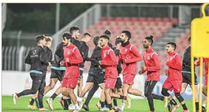
لقطات من التدريب المشترك

الفريق الاسباني قام بزيارة إلى أكاديمية تيكيزر