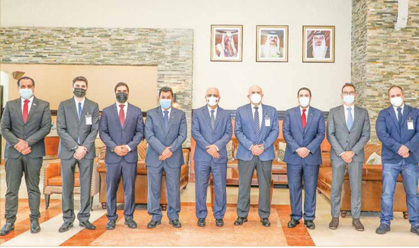
استقبال “ألبا” لوفد “ألياستر” الإسبانية