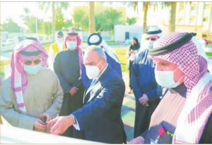
أحد جولات وزير الأشغال الميدانية

صنع الإنجازات. عصام بن عبدالله خلف، وزيراً للأشغال وشؤون البلديات والتخطيط العمراني، أمانة يشفق من حملها الأبطال، وتستسلم لتحدياتها الصعبة أصلب الإيرادات، فكان الفارس الذي أخضع جموحها، وقاد مسؤولياتها بكفاءة واقتدار. (04)