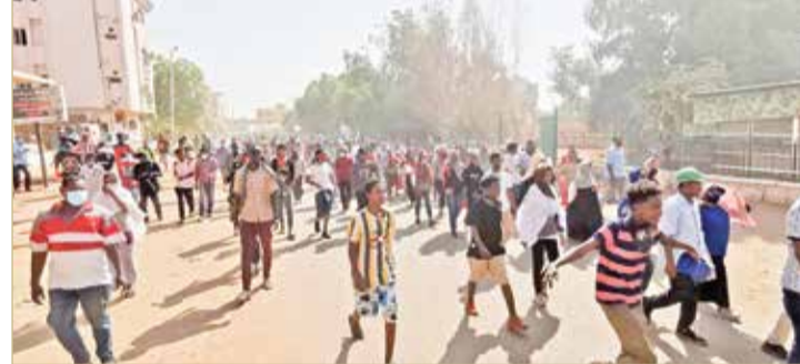
الآلاف السودانيون خرجوا في مسيرات جديدة

أطلقت قوات الأمن السودانية، أمس الاثنين، الغاز المسيل للدموع لتفريق المتظاهرين بمحيط شارع القصر في الخرطوم، مع اندلاع احتجاجات جديدة تطالب بإعادة المدنيين إلى السلطة واستكمال الانتقال الديمقراطي الذي بدأ العام 2019. وتأتي هذه الاحتجاجات في ظل توتر أمني كبير، بعد مقتل قائد قطاع الخرطوم في قوات الاحتياطي المركزي العميد علي بريمة.