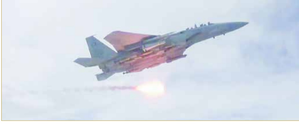
التحالف العربي يعلن تدمير 8 طائرات مسيرة أطلقت باتجاه السعودية

وأفادت الشرطة في بيان أن حريقا اندلع صباح الاثنين وأدى إلى انفجار 3 صهاريج لنقل المحروقات البترولية في منطقة مصفح أيكاد 3 بالقرب من خزانات أدنوك. في موازاة ذلك، أعلن التحالف اعتراض وتدمير 8 مسيرات أطلقت باتجاه السعودية أمس. (08)