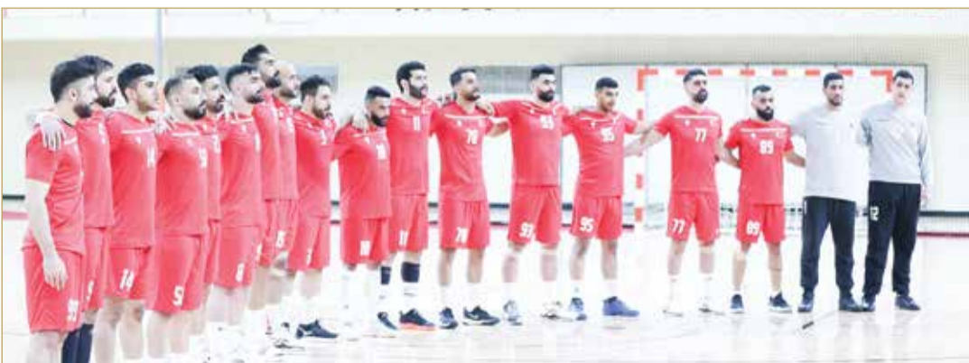
منتخبنا الوطني الأول لكرة اليد

وأعد الأحمر عدته لموقعة اليوم بقيادة مدرب المنتخب أرون كريستانتسون، من خلال التدريبات المحلية التي سبقت ذهابه للمملكة العربية السعودية وفي معسكره الخارجي الذي أقامه في المجر مؤخرًا وقبل ذلك في السعودية والتي لعب من خلالها بعض المباريات التجريبية. واختار الجهاز الفني 19 لاعباً في