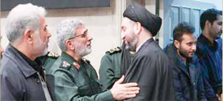
قآني يجتمع مع الإطار التنسيقي في بغداد

في ظل الظرف الحساس وأزمة تشكيل حكومة عراقية، أفادت وسائل إعلام عراقية، أمس الاثنين، أن قائد فيلق القدس بالحرس الثوري الإيراني إسماعيل قآني اجتمع مع قادة الإطار التنسيقي في العاصمة بغداد.