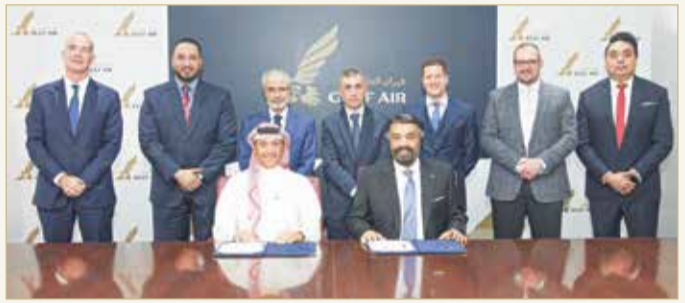
أثناء توقيع مذكرة التفاهم

وشركة (DHL) وتعزيز علاقاتنا مع إحدى شركات الطيران المفضلة في المنطقة. تخدم طيران الخليج حالياً شبكتها بمزيج من الأسطول العريض والضيقة المكون من طائرات بوينج وإيرباص. تشتهر طيران الخليج بضافتها العربية الأصيلة، وتلتزم بريادتها في الصناعة من خلال تطوير المنتجات والخدمات التي تعكس الاحتياجات والتطلعات المتغيرة لعملائها. كادر (DHL) المؤلف من أكثر من 400,000 موظف في أكثر من 220 دولة ومنطقة يعمل يوميًا لمساعدة العملاء على عبور الحدود والوصول إلى أسواق جديدة وتنمية الأعمال التجارية.