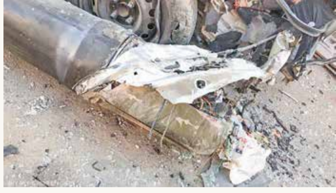
الإمارات: تدمير صاروخين باليستيين أطلقهما الحوثيون