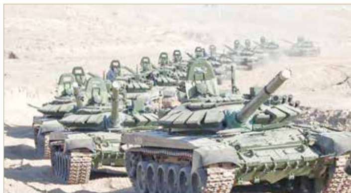
روسيا حشدت قوات ضخمة على حدود أوكرانيا

وتفني روسيا أنها تخطط لشن هجوم لكنها تقول إنها قد تقوم بعمل عسكري لم تحدده إذا لم يتم تلبية قائمة