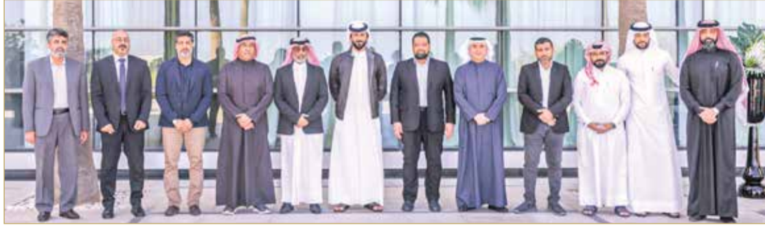
سمو الشيخ ناصر بن حمد في لقاء مع النقابات العمالية التابعة للشركة القابضة للنفط والغاز