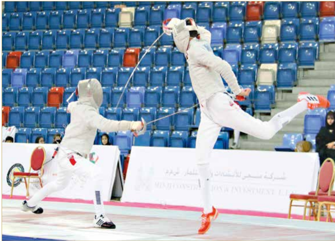
لقطة من منافسات البطولة