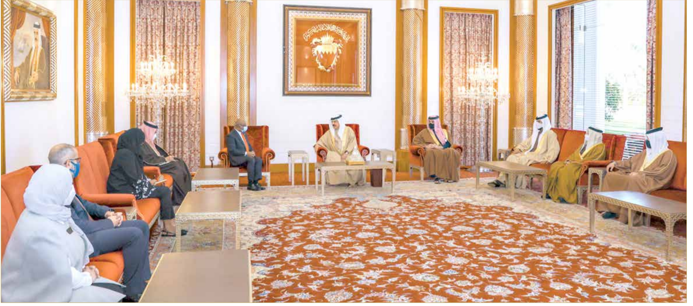
جلالة الملك مستقبلاً رئيس الدورة السادسة والسبعين للجمعية العامة للأمم المتحدة وزير خارجية جمهورية المالديف