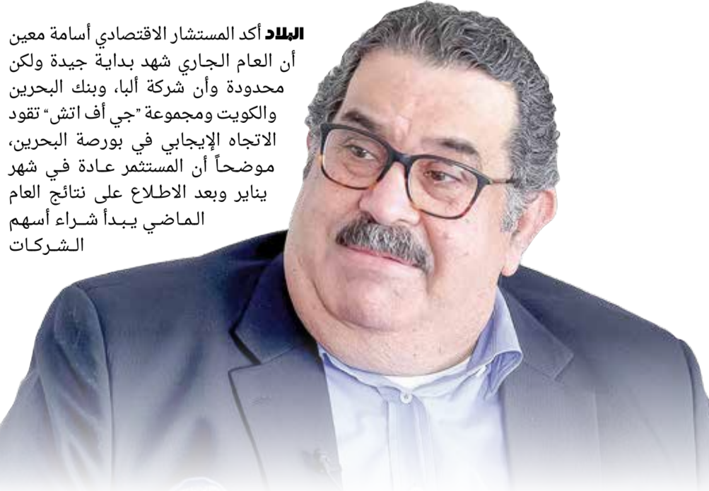
فريق ملحق الاقتصاد

البلاد أكد المستشار الاقتصادي أسامة معين أن العام الجاري شهد بداية جيدة ولكن محدودة وأن شركة ألبا، وبنك البحرين والكويت ومجموعة “جي أف اتش” تقود الاتجاه الإيجابي في بورصة البحرين، موضحاً أن المستثمر عادة في شهر يناير وبعد الاطلاع على نتائج العام الماضي يبدأ شراء أسهم الشركات