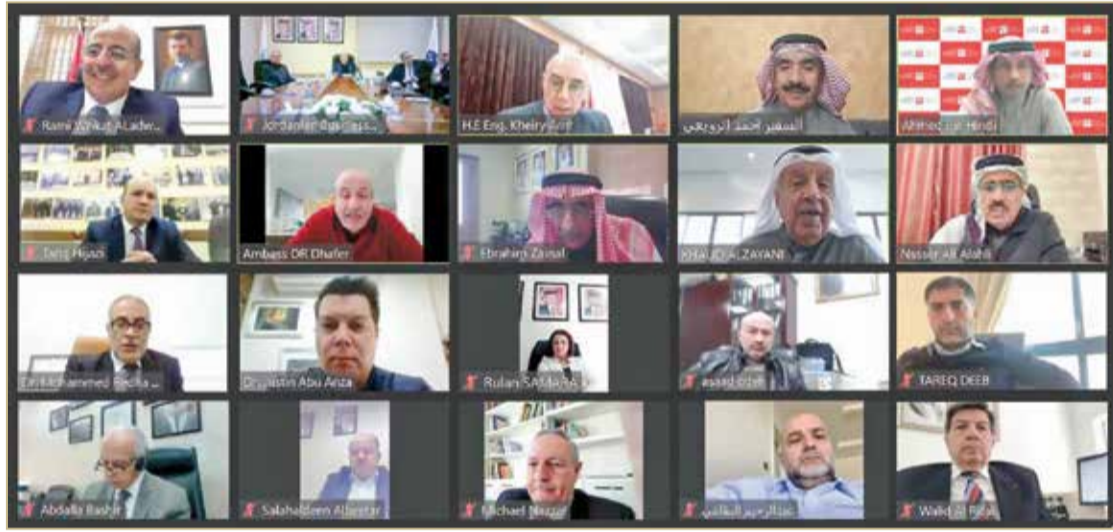
الاجتماع الأول لمجلس الأعمال البحريني الأردني

العلاقات البحرينية الأردنية، إذ أشار إلى أن حجم الاستثمارات البحرينية في بورصة عمان بلغ حوالي 714 مليون دينار أردني في العام الماضي حيث احتلت البحرين في المرتبة الخامسة كأحد أبرز المستثمرين في البورصة الأردنية على مستوى العالم العربي. واتفق الجانب البحريني والأردني خلال الاجتماع على أهمية تذليل كافة العقبات والمعوقات التي تواجه قطاع الأعمال في كلا البلدين من أجل تيسير حركة الاستثمار والتجارة البينية.