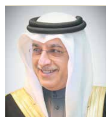
سلمان بن إبراهيم

الهيئة العامة للرياضة رئيس اللجنة الأولمبية البحرينية سمو الشيخ خالد بن حمد آل خليفة على هذا الإنجاز الكبير، مشيداً بدعم سموه الواضح للمنتخبات الوطنية وتحفيزها الدائم لها؛ من أجل بلوغ أعلى مراتب الإنجاز في مختلف التظاهرات الرياضية. وأشار الشيخ سلمان بن إبراهيم آل خليفة أن تأهل المنتخب الوطني إلى نهائيات كأس العالم للمرة السادسة يثبت مجدداً علو كعب كرة اليد البحرينية ويرسخ مكانتها الرائدة على الساحة القارية، ويؤكد أن البحرين غنية بالطاقات القادرة على التميز والتفوق ورفع علم المملكة عالياً حقاً في مختلف المحافل الرياضية.