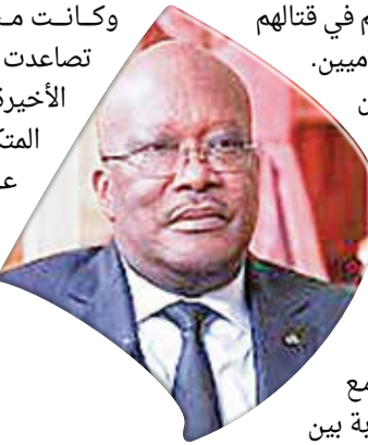
رئيس بوركينافاسو روك كابوري

ضد متشددين إسلاميين. ونفت الحكومة أن يكون الجيش قد استولى على السلطة. ولم يعرف كابوري أو وضعه صباح الاثنين، مع تداول تقارير متضاربة بين