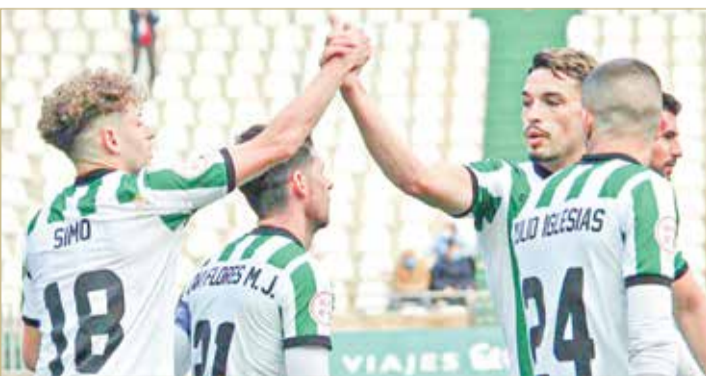
فرحة لاعبي قرطبة الإسباني