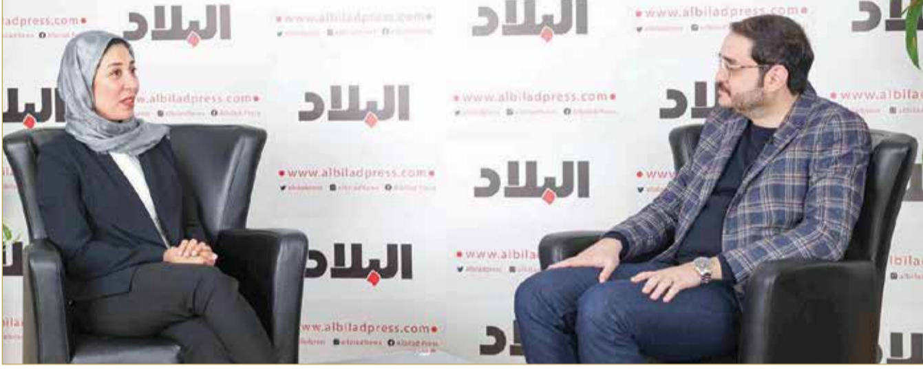
أبو الحسن متحدثة لـ “البلاد”

◆ تسخير الاستثمارات الملائكية والجماعية لدعم المؤسسات الصغيرة والمتوسطة