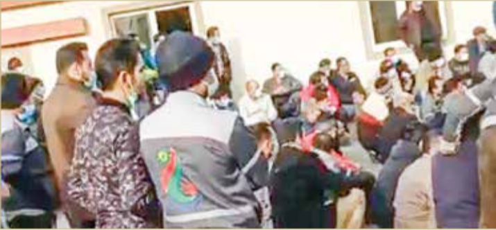
إضراب عمال البتروكيماويات

الشركة بعد مشاركتهم في نوفمبر الماضي باحتجاجات دامت عدة أيام تنديداً بتدني الرواتب والمستحقات. ويطالب عمال البتروكيماويات في إيران بشكل عام بتسديد مستحقاتهم ليتناسب دخلهم مع ظروف عملهم الشاق والوضع المعيشي عامه.