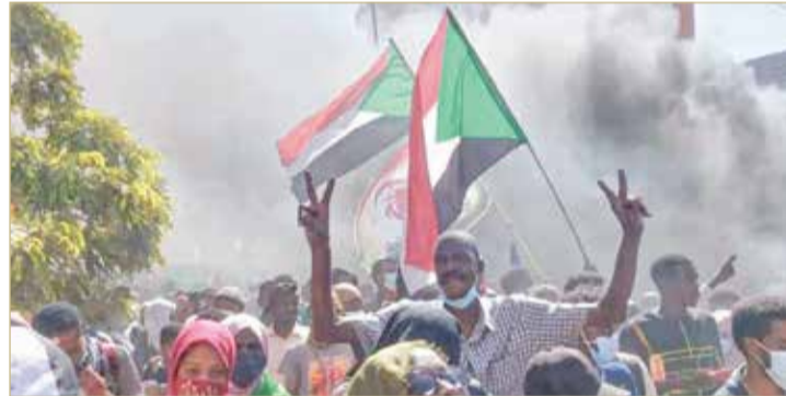
أطلق ناشطون على هذه التظاهرات اسم "مليونية 24 يناير"

والتي أمنت على دعم مبادرة "فولكر" مع التأكيد على أهمية أن يكون الحل سودانياً. وفي وقت سابق من أمس كان حزب الأمة القومي السوداني قد أعلن أنه قرر المشاركة بكثافة في التظاهرات لإنهاء الحكم الحالي في البلاد.