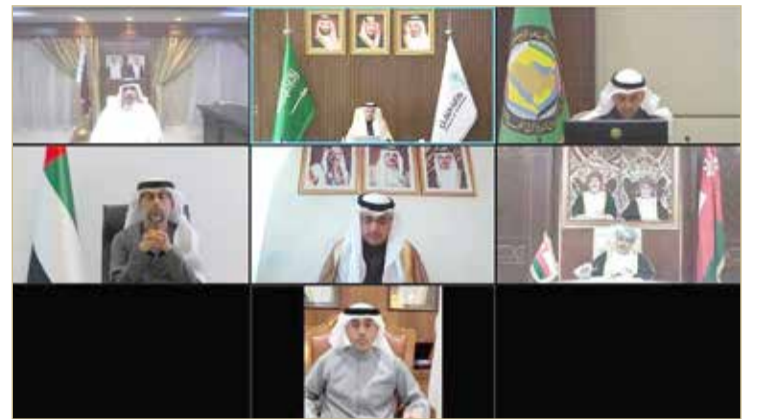
الاجتماع عقد عن بعد

أعلن بنك البحرين الوطني عن تمديد عرضه لمستفيدي تمويل مزايا العقاري أو تمويل الرهن العقاري المشترك وذلك للراغبين بشراء وتملك الفلل السكنية المندرجة ضمن المرحلة الأخيرة من مشروع “ديرة العيون” السكني، إذ سيحظى 50 عميل بجوائز نقدية فورية بقيمة 500 دينار بحريني. ويقع المشروع العقاري لبنك الإسكان في قلب مدينة “ديار المحرق” وهو يضم 1,061 فيلا مصممة خصوصاً لتلبية احتياجات الأسرة البحرينية. ويُعد عرض بنك البحرين الوطني امتداداً لنجاح الحملة الأولى التي تم إطلاقها في شهر نوفمبر الماضي والتي منحت