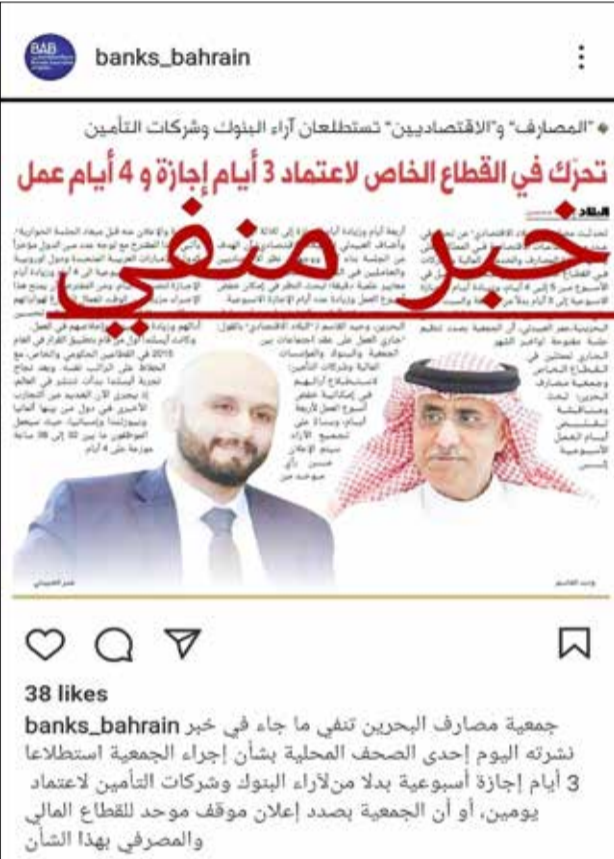
جمعية المصارف تؤكد خبر “البلاد” صباحاً وتنفيه لاحقاً!