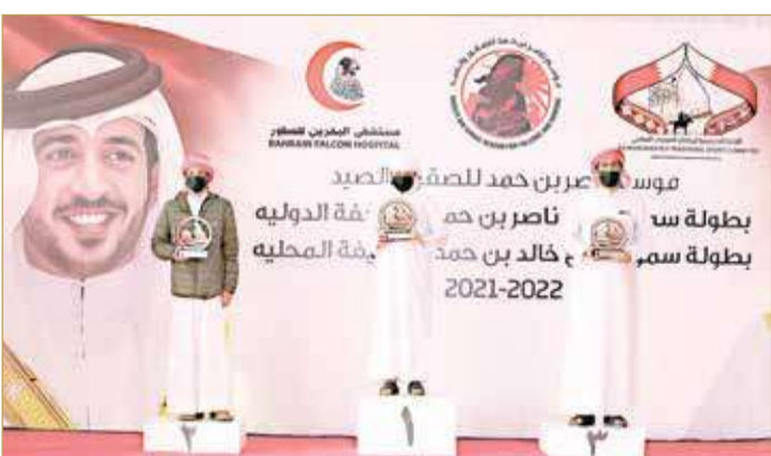
جانب من التتويج

وتوجت اللجنة البحرينية لرياضات الموروث الشعبي أبطال شوطي الصقار الصغير.