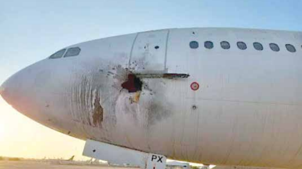
الطائرة المتضررة جراء قصف مطار بغداد

ذكرت مصادر أمنية عراقية أن هجوما صاروخيا استهدف فجر الجمعة مطار بغداد الدولي، وسقطت بضعة صواريخ قرب قاعدة جوية أميركية مجاورة دون وقوع ضحايا، مسببا أضراراً مادية بما في ذلك لطائرة مدنية كانت متوقفة على أرض المطار. وازدادت وتيرة الهجمات الصاروخية على مجمع المطار في الآونة الأخيرة، ويلقي المسؤولون الأميركيون دأماً باللائمة على فصائل شيعية عراقية موالية لإيران. وتوعد رئيس الوزراء العراقي مصطفى الكاظمي بأنه ”سيكون لقوات الأمن رد حاسم على العمليات الخطيرة التي تقف خلفها أجنات لا تريد للعراق خيراً“.