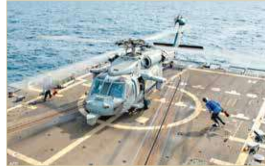
واشنطن تناهب عسكرياً لاحتمال إقدام روسيا على غزو أوكرانيا

وأضاف بالقول: ”نريد من الغرب أن يتعامل معنا بشكل نزيه.. إذا كنتم تؤيدون الدبلوماسية نفذوا تهديداتكم“. وما زالت الأزمة الأوكرانية في حال من المد والجزر، في ظل تعثر الجهود الدبلوماسية الساعية إلى الحؤول دون إقدام روسيا على غزو أوكرانيا المجاورة، وسط تحذيرات شديدة اللهجة من دول غربية، على رأسها الولايات المتحدة. ودافعت وزارة الدفاع الأميركية ”البنتاغون“ عن تأهيبها واستعدادها لاحتمال إقدام روسيا على غزو أوكرانيا، مؤكدة تقديم دعم من ملايين الدولارات للبلد الأوروبي.