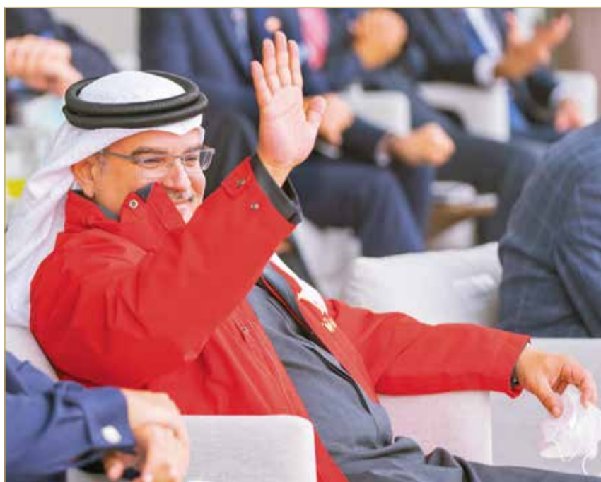
سمو ولي العهد رئيس مجلس الوزراء يحضر مهرجان سباق الخيل الكبير على كأس سموه

جاء ذلك لدى تفضل سموه امس بحضور مهرجان سباق الخيل الكبير على كأس سمو ولي العهد والذي يقام تحت رعاية سموه على مضمار سباق نادي راشد للفروسية وسباق الخيل بمشاركة ملاك ومدربين وفرسان وجياد من مختلف الإسطبلات من مملكة البحرين وخارجها.