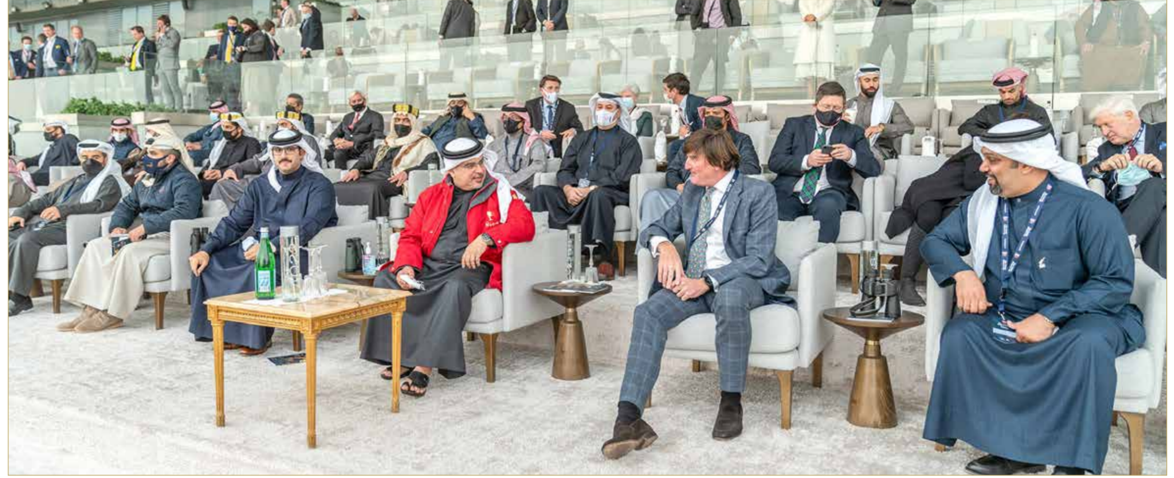
سمو ولي العهد مجلس رئيس الوزراء يحضر مهرجان سباق الخيل الكبير على كأس سمو ولي العهد