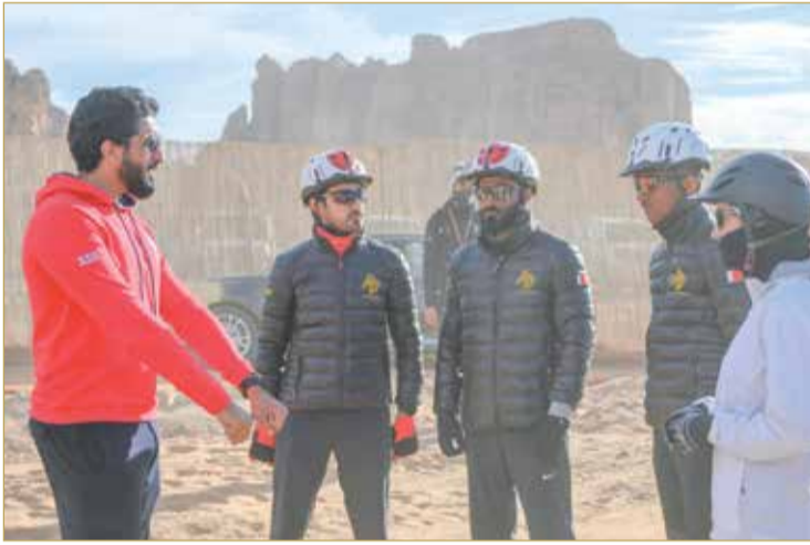
سمو الشيخ ناصر بن حمد يتحدث مع أفراد الفريق الملكي

وسيشهد كأس خادم الحرمين الشريفين للقدرة والتحمل مشاركة 200 فارس وفارسة من 30 دولة، وهي: مملكة البحرين، المملكة العربية السعودية، دولة الإمارات العربية المتحدة، جمهورية مصر العربية، دولة الكويت، جمهورية العراق، سلطنة عمان، دولة قطر، المملكة الأردنية الهاشمية، تشيلي، الهند، إسبانيا، بريطانيا، المغرب، السويد، الأوروغواي، البرتغال، النمسا، الجزائر، إيطاليا، الأرجنتين، فرنسا، ألمانيا، بلغاريا، رومانيا، بلجيكا، بولندا، ليتوانيا، سويسرا، سلوفاكيا.