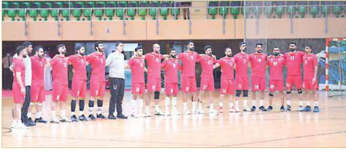
منتخبنا الوطني الأول لكرة اليد