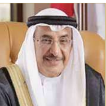
الشيخ خالد بن عبدالله

كشف نائب رئيس مجلس الوزراء رئيس اللجنة الوزارية للمشاريع التنموية والبنية التحتية الشيخ خالد بن عبدالله آل خليفة أن عدد رخص صيد الروبيان بواسطة (الكراف) سارية المفعول قبل تنفيذ برنامج إلغائها مقابل تحويلها إلى رخص صيد أسماك وعدة (الكراف) أو شراء الأصول كان يبلغ 276 رخصة، وذكر أن عدد رخص صيد الروبيان بواسطة (الكراف) التي تم إلغاؤها بلغت 220 رخصة، كما تم تحويل 56 رخصة إلى رخصة صيد أسماك وشراء عدة الصيد من المرخص لهم بناء على رغبتهم. وجاء في رده على السؤال البرلماني للنائب أحمد السلوم أن التكلفة الإجمالية لشراء أصول الصيادين وعدد الكراف بلغت 5,838,000 مليون دينار.