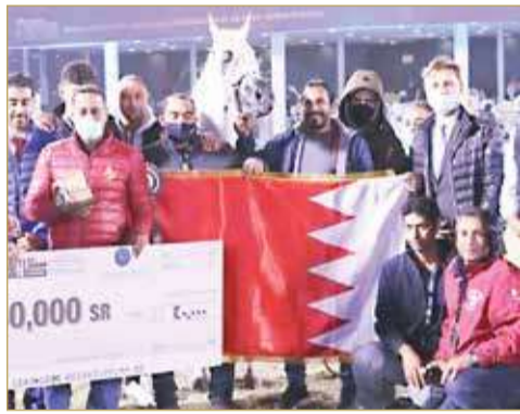
جانب من التتويج

المركز التاسع عشر بمعدل 88.40. وفي فئة الأفلح عمر 4-6 سنوات، احتل