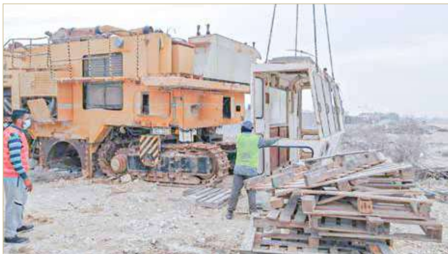
الرفاع - بلدية الجنوبية

نفذت بلدية المنطقة الجنوبية ممثلة في قسم الرقابة والتفتيش على التراخيص، بالتعاون مع مديرية أمن المنطقة الجنوبية والجهات المختصة، حملة واسعة تمت فيها إزالة 60 طناً من المواد الثقيلة و30 آية ضمن حملة إشغالات الطريق العام المخالفة التي تم تنفيذها في منطقة السكراب. وتضمنت هذه الأعمال إزالة المخلفات الكبيرة مثل الآليات والمعدات والعربات والحاويات وغيرها من المواد الثقيلة.