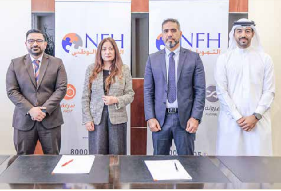
أثناء توقيع الاتفاقية بين الجانبين