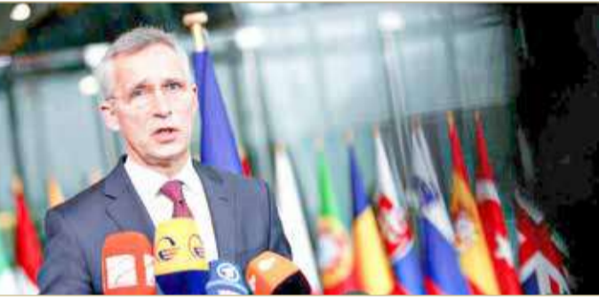
الأمين العام لحلف شمال الأطلسي ينس ستولتنبرغ

وأوضح المصدر، بحسب وكالة الأنباء اليمنية الرسمية، أن مدفعية الجيش الوطني استهدفت بشكل دقيق تعزيزات المليشيات الحوثية وقصفت التحركات القادمة من مناطق المليشيا إلى الجبهة ذاتها. يذكر أن الجيش اليمني، مدعوماً من قوات تحالف دعم الشرعية بقيادة