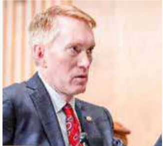
السناتور الجمهوري جيمس لانكفورد

مضيفاً: "علينا أن نتخذ موقفاً حازماً من النظام الإيراني الإرهابي وطموحاته النووية". وتابع لانكفورد: "إيران تتظاهر بتطوير مواد نووية لأغراض سلمية بينما هي تخصص اليورانيوم بنسبة تتجاوز الحاجة لذلك". بدوره، قال السناتور الجمهوري جوش هاولي إنه يأمل ألا تعود إدارة بايدن إلى الاتفاق النووي مع إيران. وأضاف هاولي: "هذا ليس الوقت المناسب لتسريع برنامج إيران النووي