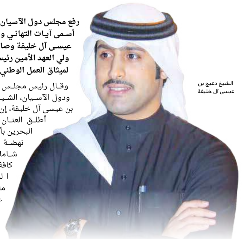
الشيخ دعيج بن عيسى آل خليفة

وقال رئيس مجلس البحرين ودول الآسيان، الشيخ دعيج بن عيسى آل خليفة، إن الميثاق أطلق العنان لمملكة البحرين بأن تُحقق نهضة تنموية شاملة في كافة مناحي الحياة، مثمناً عالياً ما