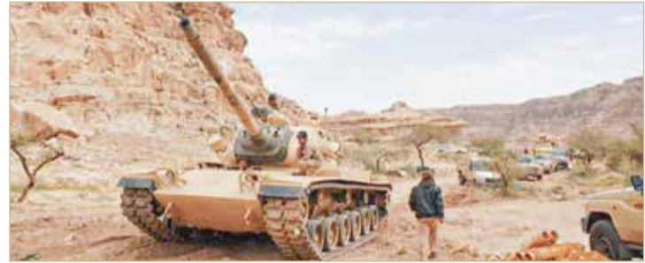
الجيش اليمني في جبهات القتال في صعدة

قال الأمين العام لحلف شمال الأطلسي "النانو" ينس ستولتنبرغ أمس الأربعاء إن الحلف "يستعد للأسوأ بشأن الأزمة الأوكرانية" مع روسيا. وقال ستولتنبرغ إن الحلف لا يرى إشارات إلى خفض التصعيد "حتى الآن" من جانب موسكو، بينما تستمر روسيا "بالتصعيد وبحشد قوات قرب أوكرانيا". وأضاف: "نحن مستعدون للحوار مع روسيا، ومستعدون أيضاً لأي احتمالات أخرى، معرباً عن أمله في "أن تنخرط روسيا في المسار الدبلوماسي". كما أكد ستولتنبرغ أن "روسيا تحافظ على قدرات تمكثها من شن غزو شامل لأوكرانيا"، مؤكداً أن الحلف "سيرحب بأي خفض للقوات الروسية عند الحدود الأوكرانية". لكنه حذّر من أن "أعداد القوات الروسية عند الحدود الأوكرانية تزداد"، مضيفاً: