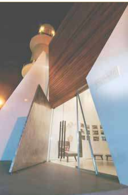
قاعة محمد بن فارس

وتقدم هذه النسخة من المهرجان العديد من المعارض الفنية المحلية، بدءاً من معرض "المرأة بين الحقيقة والخيال" في مركز الفنون للفنان إبراهيم خليفة، الذي يفتح أبوابه يوم 27 فبراير،