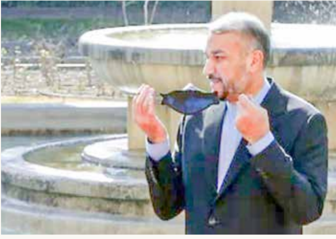
وزير خارجية إيران حسين أمير عبد الهيمان

وخلال محادثات فيينا الهادفة لإنقاذ الاتفاق النووي المبرم عام 2015، طلبت إيران ضمانات ثابتة تنص على عدم انسحاب إدارة أميركية في المستقبل من اتفاق محتمل كما حصل عام 2018. وقال وزير الخارجية الإيراني حسين أمير عبدالهيمان في مقابلة مع صحيفة "فايننشال تايمز" أمس الأربعاء نشرت على موقع وزارة الخارجية الإلكتروني "لا يمكن للرأي العام في إيران قبول تصريح رئيس دولة كضمانة، لا سيما من رئيس الولايات المتحدة التي انسحبت من الاتفاق النووي" عام 2018. وكشف وزير الخارجية الإيراني أنه طلب من المفاوضين الإيرانيين أن يقرحوا على الأطراف الغربية "أن تعتمد برلماناتها أو رؤسائها على الأقل بما يشمل الكونغرس