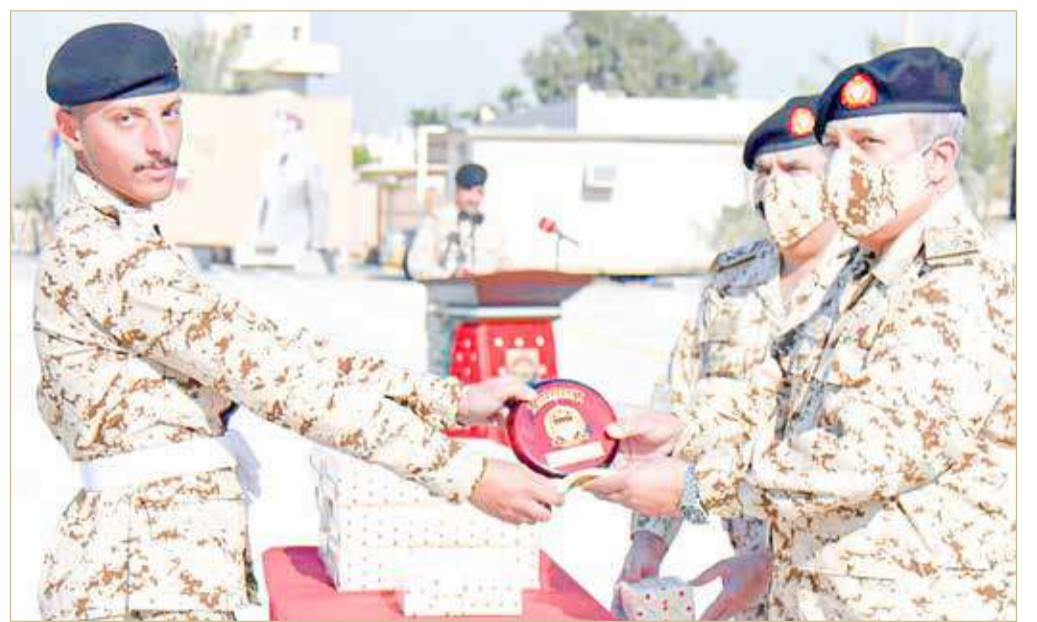
المنامة - بنا

أقيم بإحدى وحدات قوة دفاع البحرين صباح أمس، حفل تخريج دورة للأفراد المستجدين بحضور مساعد رئيس هيئة الأركان للقوى البشرية اللواء الركن الشيخ علي بن راشد آل خليفة. واستهل الحفل بتلاوة آيات عطرة من الذكر الحكيم بعدها أقيمت كلمة بهذه المناسبة، وقدم إيجازاً عن الدورة وما اشتملت عليه من مراحل تدريبية ومواد نظرية عسكرية، بعدها قدم الخريجون عرضاً عسكرياً ميدانياً للمشاة.