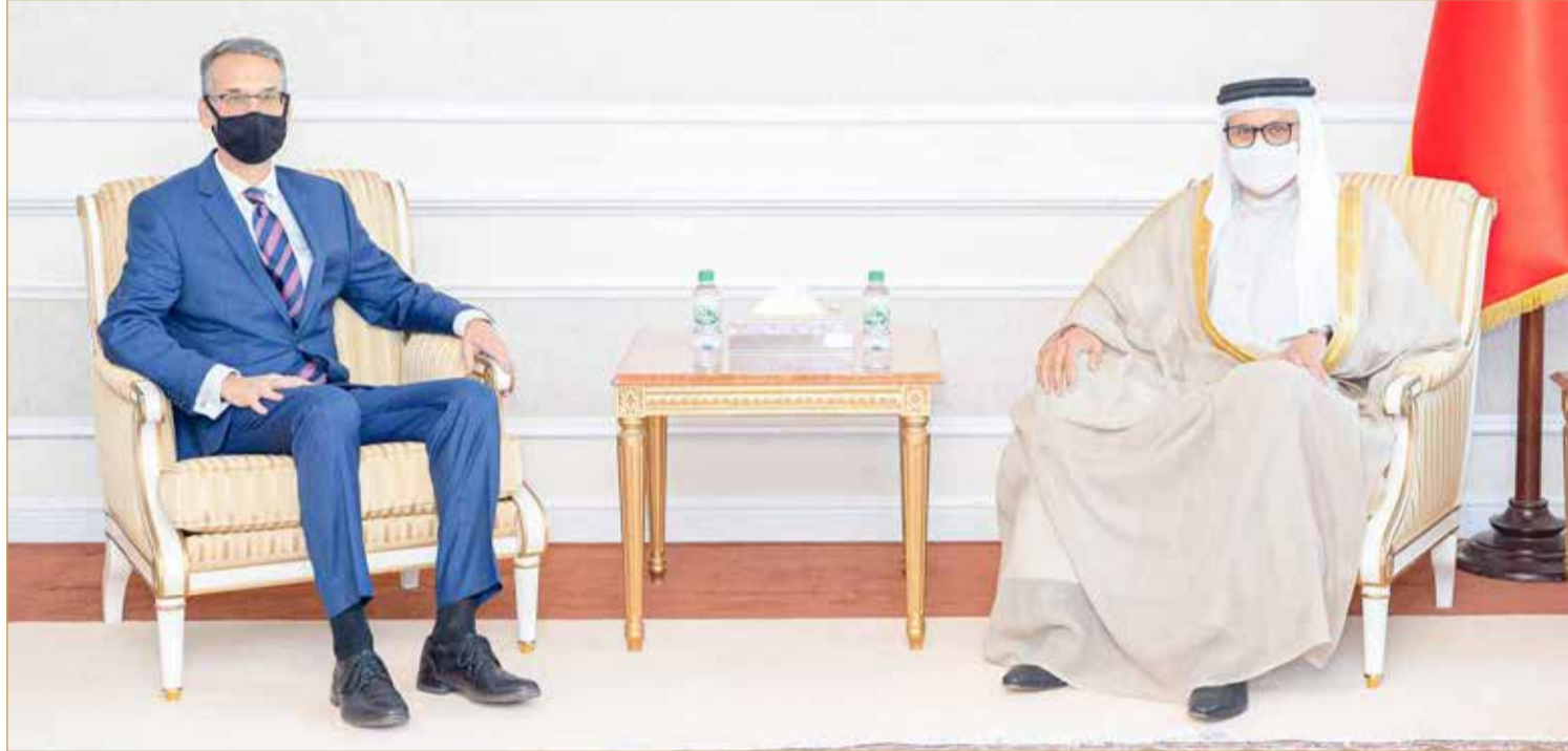
وزير الخارجية يجتمع بسفير الولايات المتحدة الأميركية لدى مملكة البحرين

المنامة - وزارة الخارجية اجتمع وزير الخارجية عبداللطيف الزياتي بسفير الولايات المتحدة الأميركية لدى مملكة البحرين ستيفن بوندي، على خلفية اللقاء الذي جمع السفير في منزله مع عدد من ممثلي الجمعيات الأهلية لبحث الشؤون الداخلية لمملكة البحرين، حيث أبلغه بتحفظ المملكة على اللقاء الذي جرى بما يحمله من دلالات لا تتفق مع القوانين والأعراف الدولية في هذا الشأن.