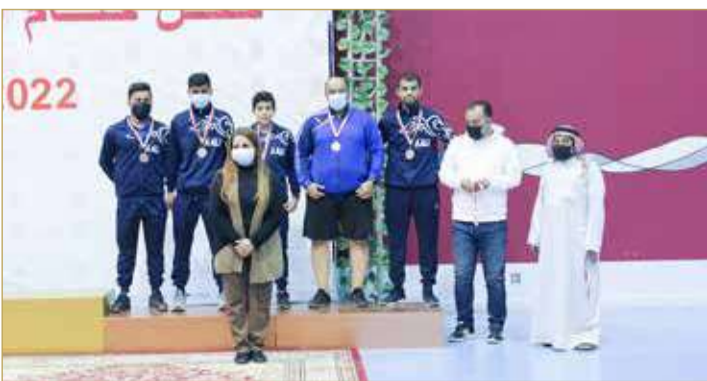
تتويج عالي بالمركز الثالث