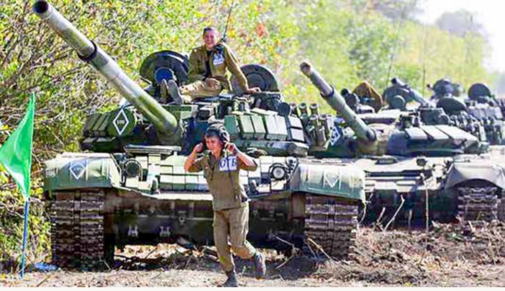
رتل من الدبابات الروسية في دونيتسك

ردًا على العقوبات الأميركية التي فرضت خلال الساعات الماضية على وقع التصعيد الروسي في الشرق الأوكراني، أكدت روسيا أنها لن تغير سياستها في الدفاع عن مصالحها.