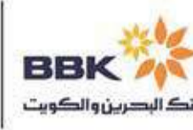
مراد علي مراد