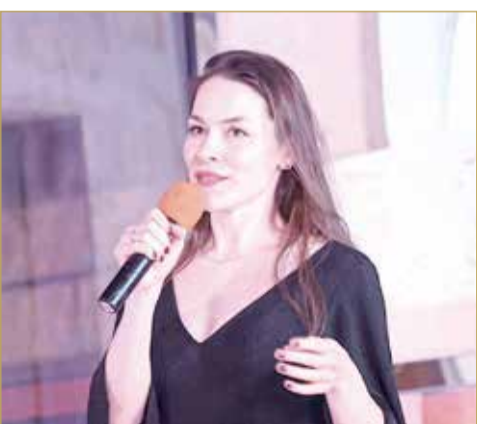
الروسية لبيدا تلقي كلمتها