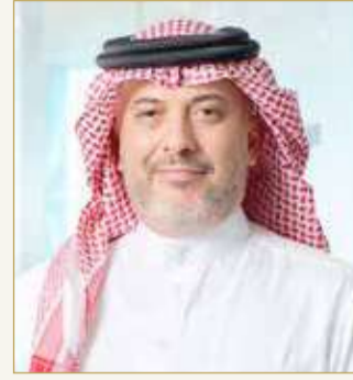
الشيخ خليفة بن إبراهيم

تنطلق فعاليات المؤتمر السنوي لاتحاد أسواق المال العربية، يومي 29 و30 مارس عام 2022، إذ ستشهد فعاليات المؤتمر تسليم السوق المالية السعودية "تداول" الرئاسة إلى بورصة البحرين، لتتولى الأخيرة قيادة الاتحاد خلال عام 2022، لاستكمال جهود التطوير والتنمية وتمكين الاتحاد من تحقيق رؤيته المستقبلية. تستضيف بورصة البحرين، السوق متعددة الأصول ذات التنظيم الذاتي، فعاليات المؤتمر السنوي لاتحاد أسواق المال العربية وذلك باستخدام الوسائط التكنولوجية.