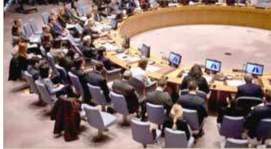
مجلس الأمن يغلق ملف تعويضات العراق للكويت

أعلن العراق خروجه من إجراءات الفصل السابع من ميثاق الأمم المتحدة، الذي يتيح استخدام القوة العسكرية بعد دفع ما يزيد على 52 مليار دولار لتعويض الكويت عن الغزو في العام 1990.