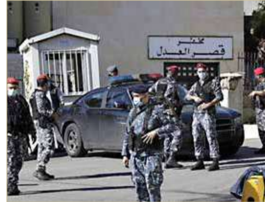
عناصر من قوى الأمن اللبناني

قصفت إسرائيل مجدّدًا أمس (الأربعاء)، مواقع في محيط محافظة القنيطرة، جنوب غرب سوريا.