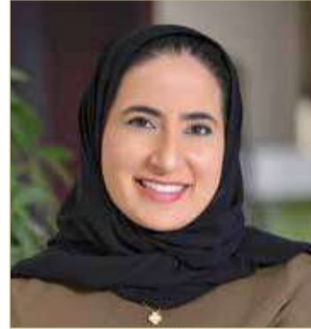
الشيخة نورة بنت خليفة

خليفة على أهمية تكثيف الأنشطة والفعاليات الهادفة لتمكين طلبة المرحلة الثانوية المتوقع تخرجهم على تحديد المسارات العلمية والمهنية المناسبة لهم والتي تتفق مع قدراتهم واتجاهاتهم