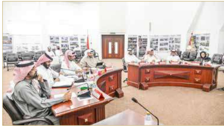
من جلسة بلدي الجنوبية