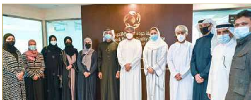
زيارة الوفد العماني

مجلس التعاون الخليجي في جميع القضايا، والتحديات، وتحقيق الأهداف المشتركة". وذكر السندي خلال حديثه أن الاطلاع على تجارب الدول الشقيقة بكل شفافية ومصداقية، يمكن من خلاله تكوين قاعدة علمية من التجارب والمعلومات؛ يُستفاد منها في تطوير آليات وإستراتيجيات العمل والأداء المؤسسي بشكل عام، لافتاً إلى أن هيئة جودة التعليم والتدريب التي تشكل اليوم بيتاً للخبرة في مجال عملها تقدم بذلك للدول الشقيقة صورة واضحة وواقعية عن قطاعي التعليم والتدريب في مملكة البحرين، بناءً على تقارير المراجعات الصادرة عن الهيئة، وعمليات الإطار الوطني