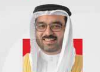
النائب أحمد السلوم رئيس اللجنة المالية والاقتصادية بمجلس النواب