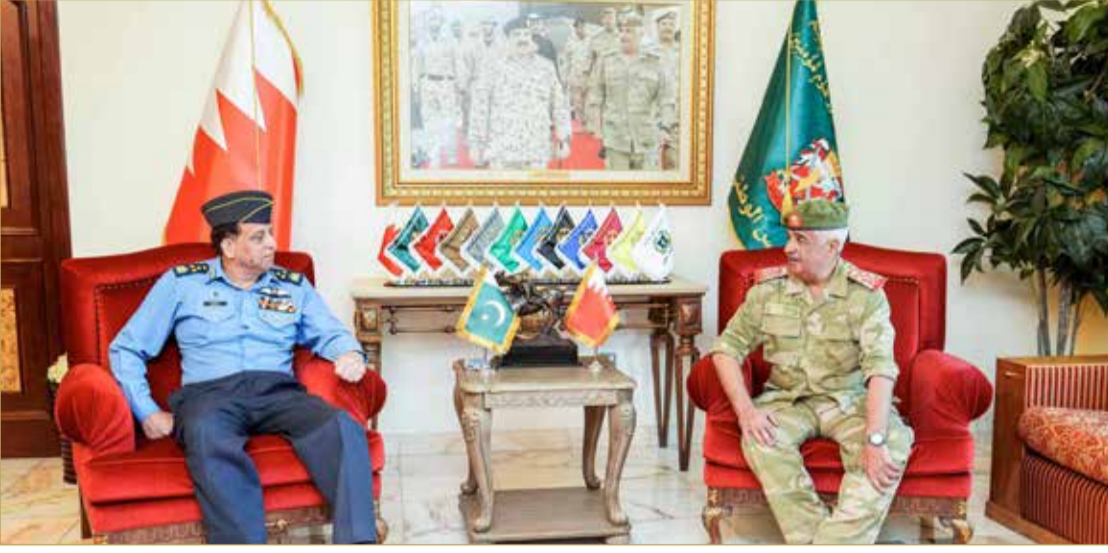
سمو رئيس الحرس الوطني يستقبل رئيس هيئة الأركان للقوات الجوية الباكستانية