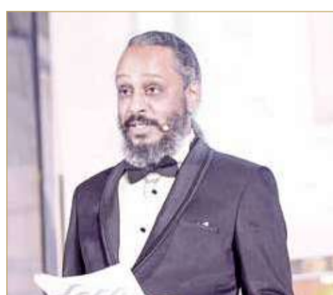
الروبيعي يستعرض برنامج المركز