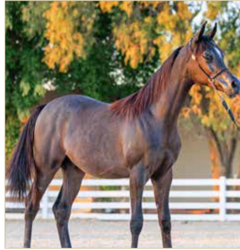
من منافسات جمال الخيل