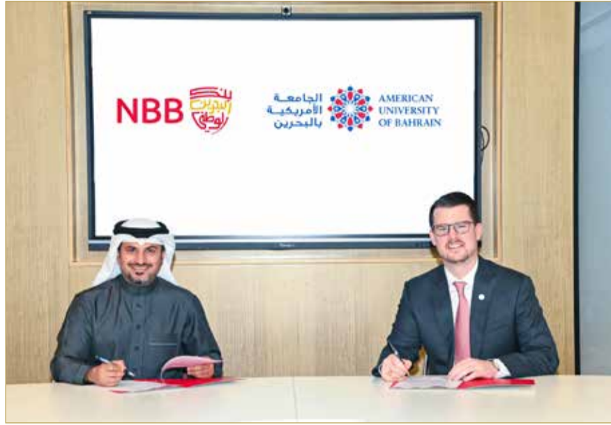
توقيع مذكرة التفاهم بين الجانبين

للمزيد من المعلومات حول حلول وخدمات التمويل في البنك، يرجى زيارة أي من فروع بنك البحرين الوطني أو زيارة الموقع الإلكتروني الخاص بالبنك، أو الاتصال على الرقم 17214433.