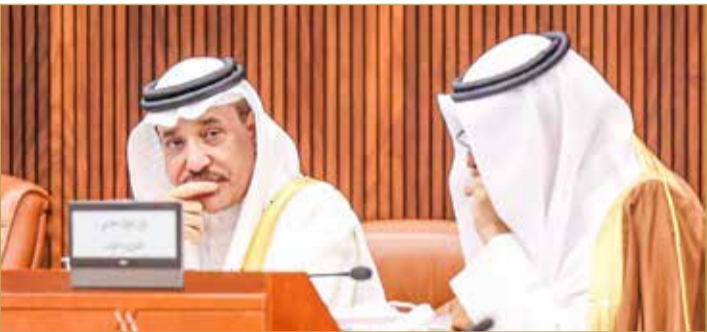
وزير العمل والتنمية الاجتماعية

باحثون عن عمل يسعون للمكافأة وليس الوظيفة