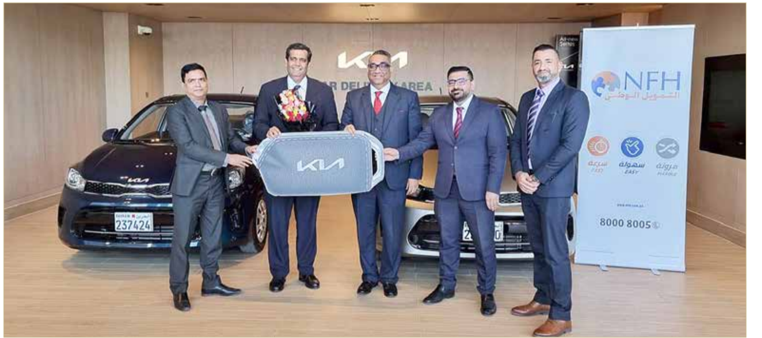
أثناء توقيع اتفاقية الشراكة

بلورة إستراتيجية فاعلة ترتقي بالعمل في القطاع الخاص. وتأتي الاتفاقية في سبيل إرساء قواعد الشراكة وضبط أطر التعاون بين الشركات، وحرص الجهات الموقعة على الاتفاقية في تنشيط حركة البيع والدفع بمشاريع القطاع الخاص والنهوض بها من خلال اعتماد آليات تمويل أكثر تلاؤماً مع ما هو مطلوب، والحرص على خطة عمل مشتركة بين الأطراف الثلاثة لإرساء مبدأ الربح للجميع.