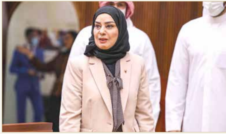
الرئيسة فوزية زينل متجهة للمنصة

البلاد وافق مجلس النواب على اقتراح برغبة مستعجل بشأن منح قرض بمقدار 3 آلاف دينار للمواطن المستفيد من الوحدات السكنية، بشرط أن يتم إضافة مبلغ القرض الممنوح للمواطن من قبل وزارة الإسكان مع المبلغ الإجمالي للوحدة السكنية التي يتم دفعها على أقساط شهرية. وقال النائب أحمد الأنصاري إن المقترح يساعد المواطن على تأهيل الوحدة السكنية الحاصل عليها بما تتطلبه من حاجات ومستلزمات أساسية ضمانا للعيش الكريم للأسر البحرينية. وأضاف أن الأوضاع الاقتصادية وارتفاع الأسعار تثقل كاهل المواطن البحريني بسبب الالتزامات الملقاة على عاتقه ولاسيما عند حصوله على الوحدة السكنية، حيث لا يستطيع المواطن تجهيز مسكنه بالأساسيات لمحدودية دخله.