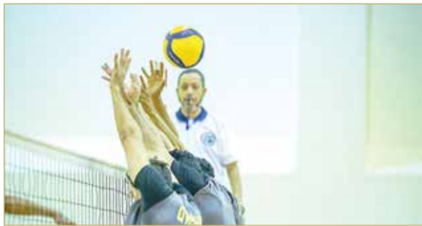
من لقاء القادسية الكويتي والنجمة