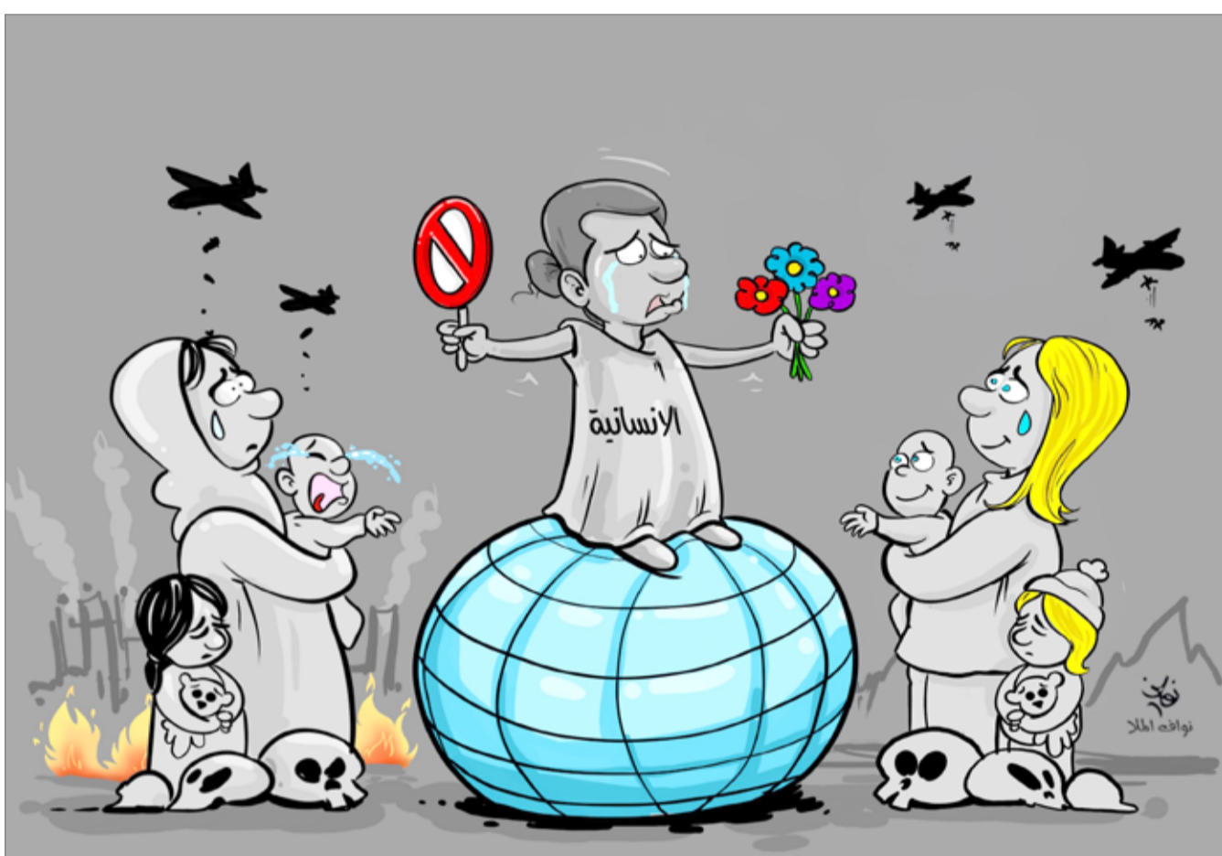
كاركاتير فاخاف العالم البلاد

يوم أمس الأول طالعتنا الصحافة بخبر أصاب القارئ بجنون مؤقت، يشبه الحادث الأليم، هو: "تلقت النيابة العامة بلاغا من وزارة الصناعة والتجارة والسياحة مفاده ضبط أحد المحلات التجارية الخاصة ببيع المواد الغذائية، ولديه منتج غذائي تمت إزالة تاريخ الصلاحية منه، ومعرض للبيع، كما تم تغيير بيانات منتج آخر وإعادة تعبئته، وبإجراء المزيد من التحريات تبين وجود مخازن تابعة للمحل وتزاول نشاط تخزين المواد الغذائية بدون ترخيص، وبتفتيش تلك المخازن رصدت بها اختتام خاصة بتواريخ الإنتاج والانتهاء، وضبطت أكثر من تسعة آلاف من المنتجات الفاسدة ومنتھية الصلاحية وبدون تواريخ صلاحية، فتم غلق المحل إدارياً.