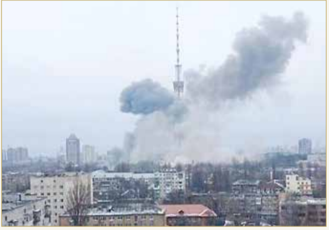
انقطع بث التلفزيون الأوكراني عقب قصفه مباشرة