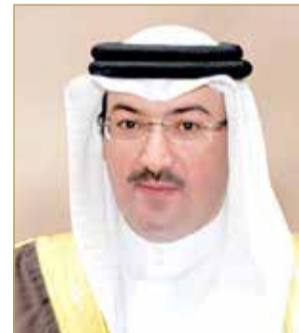
الشيخ محمد بن خليفة

أكد الرئيس التنفيذي لمؤسسة التنظيم العقاري الشيخ محمد بن خليفة آل خليفة أن تدشين خدمات التراخيص العقارية إلكترونياً بحيث لا يتطلب الحضور الشخصي إلى مكاتب المؤسسة، يُشكل نقلة نوعية في عمل المؤسسة، وبما يسهم في تحقيق رؤى وتطلعات عاهل البلاد صاحب الجلالة الملك حمد بن عيسى آل خليفة، كما أنه يأتي تنفيذاً لتوجيهات الحكومة برئاسة ولي العهد رئيس مجلس الوزراء صاحب السمو الملكي الأمير سلمان بن حمد آل خليفة، وبدعم ومساندة مجلس الإدارة برئاسة رئيس جهاز المساحة والتسجيل العقاري الشيخ سلمان بن عبدالله آل خليفة، لتسهيل الإجراءات، وتعزيز الجهود المبذولة نحو التحول الرقمي الذي تشهده المملكة في العديد من الخدمات المقدمة من قبل الجهات الحكومية المختلفة عبر البوابة الوطنية للحكومة الإلكترونية. وتابع أن التحول الإلكتروني لخدمة إصدار وتجديد رخص مزاولة العهن العقارية بمؤسسة التنظيم العقاري، والذي من شأنه أن يساهم في خفض متوسط وقت تقديم الخدمة وتوفيرها على مدار الساعة، يأتي ضمن إطار التوسع