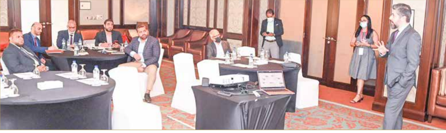
جانب من جلسات المؤتمر