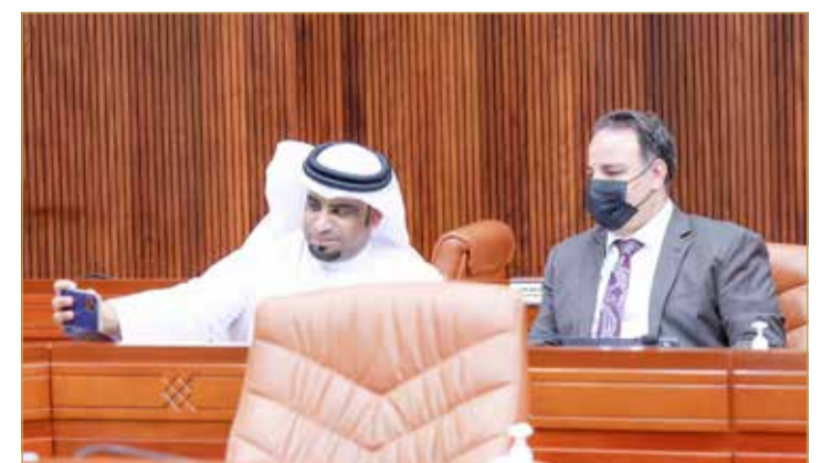
العشيري وآل عباس

الذي لا يصب في مصلحة المواطن ويحرمه من حق الانتقال من وظيفة إلى أخرى. وذكر النائب فلاح هاشم أنه لا توجد عدالة اجتماعية في المقترح بين صاحب العمل والموظف، مبيّناً أن مبررات مشروع القانون غير مقنعة والتي تؤكد فرض هذه المدة لندرة تخصصات بعض الموظفين. وبيّنت النائب سوسن كمال أن مشروع القانون يقيد