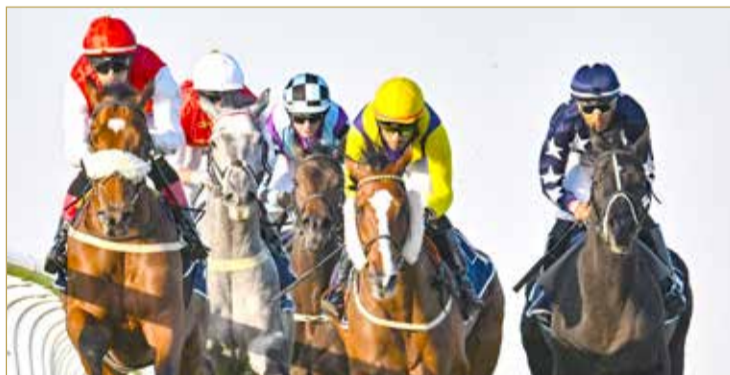
لقطة من السباقات

وجاءت قائمة الجياد المشاركة في السباق على النحو التالي: الشوط الأول يقام لخيال البحرين العربية الأصلية المسجلة في "الواهو" مسافة 1200 متر والجائزة 1500 دينار وبمشاركة 15 جوادًا هي: "حيلة العاديات 1782 - الحمدانية 1804 - الجلابية 1752 -