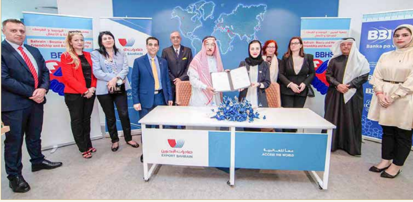
عقب توقيع مذكري التفاهم بين الجانبين