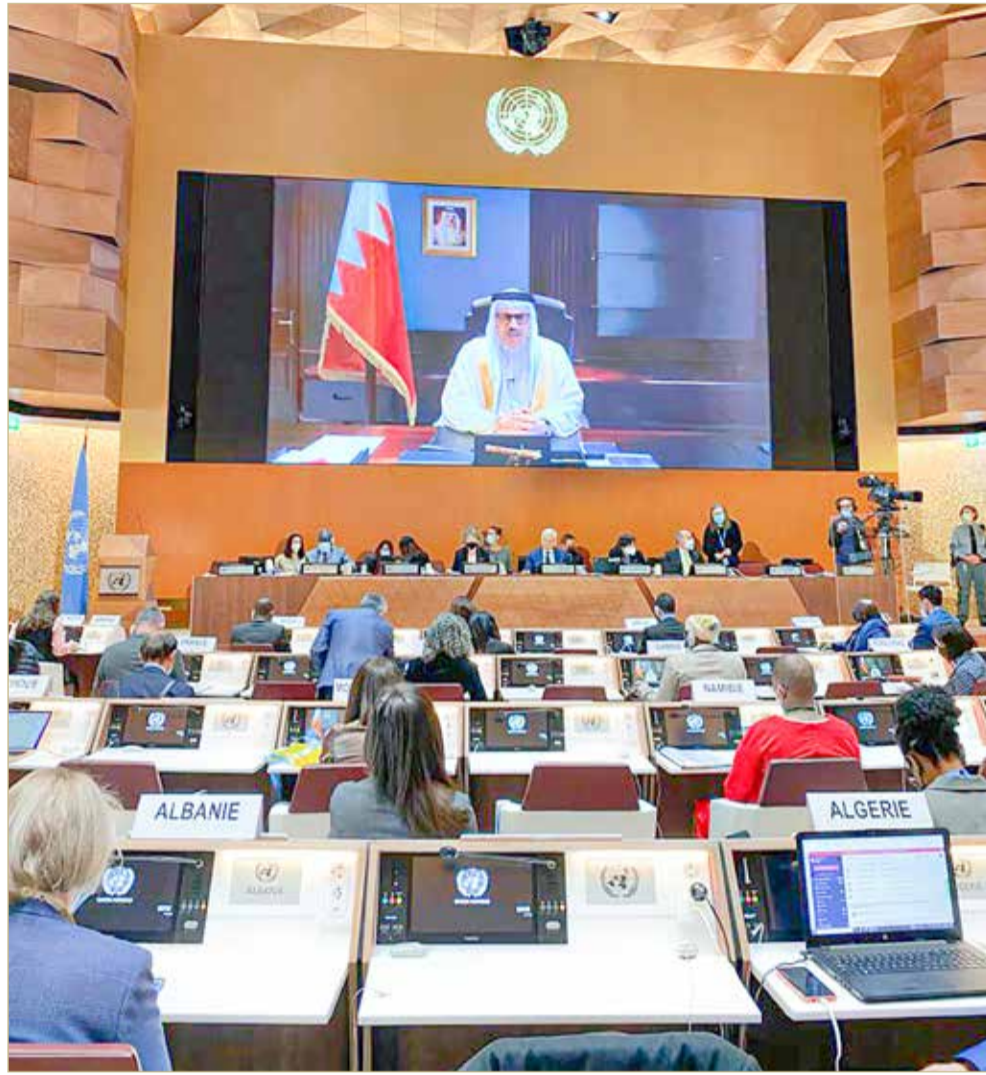
المنامة - وزارة الخارجية

♦ 46% نسبة تولي المرأة وظائف تنفيذية في "العام" وفي "الخاص" 34%