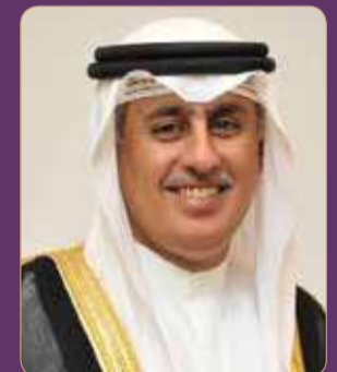
زايد الزباني وزير الصناعة والتجارة والسياحة