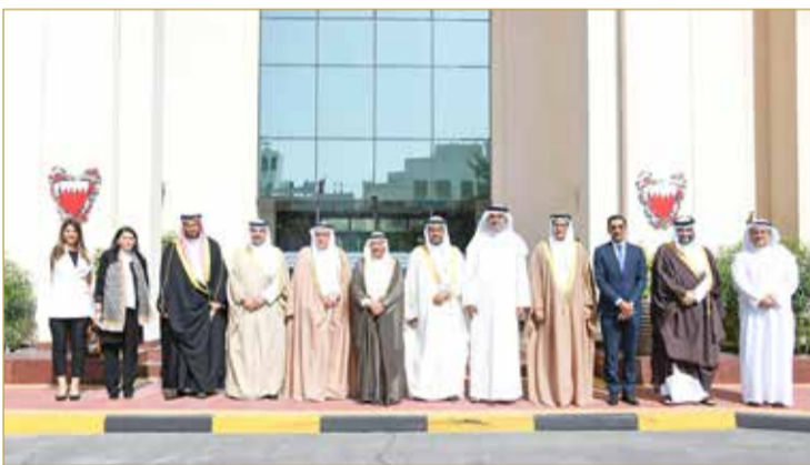
رئيس مجلس الشورى ملتقى رؤساء تحرير الصحف المحلية

في البرلمان الأوروبي، مؤكداً أن هذه اللقاءات والاجتماعات حملت طابعاً إيجابياً، مردفاً أن مثل هذه الزيارات المتبادلة والاجتماعات المشتركة من شأنها أن تزيج زيف المعلومات المغلوطة والبيانات غير الصحيحة التي زودت بها هذه المنظمات الإقليمية والدولية، والتي تستند إلى مصادر منوثة وغير نزيهة، بمعاذته للدبلوماسية الرسمية لملكة البحرين. وأضاف أن مثل هذه الزيارات المتبادلة والاجتماعات المشتركة من شأنها أن تزيج زيف المعلومات المغلوطة والبيانات غير الصحيحة التي زودت بها هذه المنظمات الإقليمية والدولية، والتي تستند إلى مصادر منوثة وغير نزيهة، بمعاذته للدبلوماسية الرسمية لملكة البحرين. وأضاف أن مثل هذه الزيارات المتبادلة والاجتماعات المشتركة من شأنها أن تزيج زيف المعلومات المغلوطة والبيانات غير الصحيحة التي زودت بها هذه المنظمات الإقليمية والدولية، والتي تستند إلى مصادر منوثة وغير نزيهة، بمعاذته للدبلوماسية الرسمية لملكة البحرين.