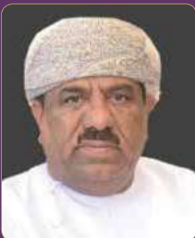
رضا جمعة آل صالح رئيس غرفة تجارة وصناعة عمان