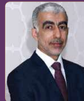
إبراهيم الحواج وكيل الزراعة والثروة البحرية