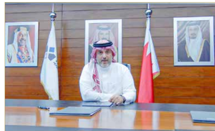
الشيخ خليفة بن إبراهيم

اختتمت بورصة البحرين فعاليات المؤتمر السنوي لاتحاد أسواق المال العربية تحت مسمى “المؤتمر السنوي لاتحاد أسواق المال العربية: البحرين 2022” الذي عقد عن بعد تحت رعاية وزير المالية والاقتصاد الوطني، الشيخ سلمان بن خليفة آل خليفة، في تاريخ 29 و30 من شهر مارس 2022. وقد سلت المؤتمر الضوء على دور أسواق المال وأهميتها في دعم وتمويل المشاريع الإستراتيجية خلال الجائحة. كما ناقش المؤتمر الجهود التي تبذلها بورصة البحرين لاستقطاب الاستثمارات الأجنبية، وآخر التطورات المتعلقة بخدمات التقاص والإيداع المركزي بهدف تقديم المزيد من المنتجات والخدمات للمستثمرين. وتناول المؤتمر أهمية توفير معلومات الإفصاح البيئي والاجتماعي والحوكمة (الاستدامة)