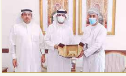
اجتماع الوفد التجاري البحريني مع نائب محافظ مسقط

شأنها المساهمة في رفع معدلات التجارة البينية بين البلدين الشقيقين وتوسيع حجم الاستثمارات المشتركة من خلال استكشاف الفرص التجارية المتوفرة في الجانبين لاسيما في قطاع الصناعات الغذائية والاستزراع السمكي. بدوره، رحب نائب محافظ مسقط بأعضاء الوفد التجاري البحريني وكشف عن أهم الفرص الاستثمارية التي تمتلكها محافظة مسقط والقوانين المعمول بها في سلطنة عمان في مجال الاستثمارات الخليجية والأجنبية، داعيًا قطاع الأعمال البحريني إلى الاستفادة من المقومات التي تفردها بها العاصمة العمانية والدخول في شركات تجارية مع نظرائهم العمانيين؛ من أجل تعزيز التكامل التجاري بين الاقتصاد البحريني والعماني.