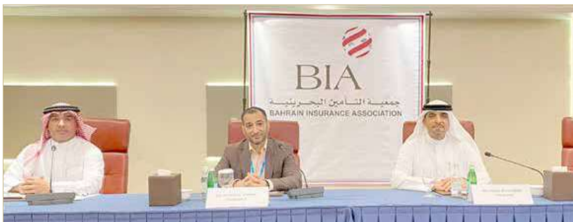
اجتماع جمعية التأمين البحرينية

ضمن مشروع تأمين العمالة المنزلية والذي يهدف إلى توفير الحماية والتعويض اللازمين لصاحب العمل وتعويضهم في حالة حدوث أي خسارة. وفيما يتعلق بالتحول الرقمي، فمن الواضح أن التكنولوجيا من الأمور المهمة لشركات التأمين والتي تتنافس في تقديم خدماتها عبر القنوات الرقمية كما برزت أهمية الرقمنة خلال الفترة الماضية خاصة في ظل الإجراءات الاحترازية التي فرضتها جائحة كورونا. تماشياً مع أهداف ورؤية مملكة البحرين 2030 فقد استكملت الجمعية مشروع e-KYC مع شركة، وسعت شركات التأمين في البحرين للاستفادة من التحولات الرقمية في تأمين السيارات فأصبح