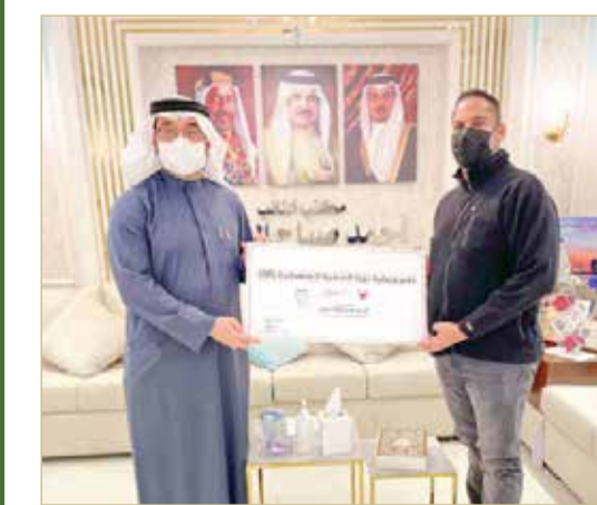
جانب من تقديم الرعاية

والشباب بممارسة الرياضة في هذه الملاعب، مشيرًا إلى أن الدائرة الخامسة شهدت افتتاح ملعبين في الدائرة وذلك في حديقتي عين قصاري وأبوغزال بدعم من بنك البحرين الوطني، ونأمل كذلك أن تشمل هذه المبادرة لتشمل كل المناطق في الدائرة.