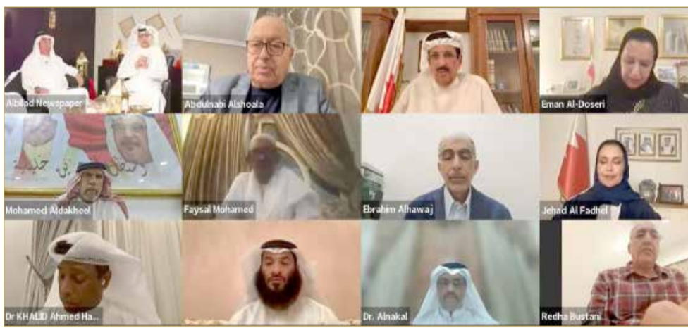
جانب من المشاركين بمجلس "البلاد" الرمضاني