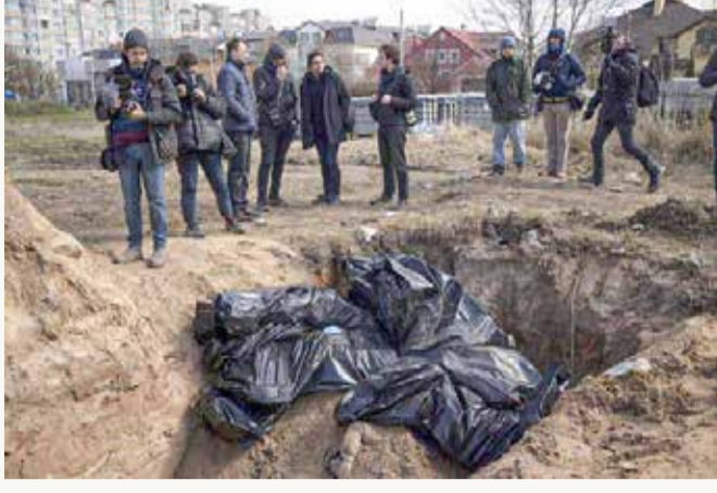
مقبرة جماعية وجثث مقيدة للأشخاص قتلوا بالرصاص من مسافة قريبة في بوتشا