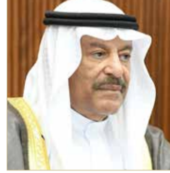
رئيس مجلس الشورى

البلاد، والجهود المثمرة والبارزة التي تقوم بها الحكومة الموقرة برئاسة ولي العهد رئيس مجلس الوزراء صاحب السمو الملكي الأمير سلمان بن حمد آل خليفة، مشيداً بمتابعة واهتمام سموه بكافة أوجه ومسارات تطوير الأداء الحكومي وترجمة توجيهات جلالته الملك، بما يعزز النجاحات البحرينية في المجالات كافة. وذلك في تصريح للصالح بمناسبة اليوم الدولي للضمير، الذي تحتفل به دول العالم في الخامس من شهر أبريل كل عام، استجابة لمبادرة المغفور له بإذن الله تعالى صاحب السمو الملكي الأمير خليفة بن سلمان آل خليفة طيب الله ثراه.