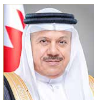
عبد اللطيف الزباني

من المبادرات الداعمة لأمن البشرية وسلامتها وازدهارها. وشدد وزير الخارجية على أن التحديات والمخاطر الدولية الراهنة تفرض على العالم تحكيم الضمير الإنساني في وقف الحروب والصراعات ومسبباتها، وإخلاء المنطقة والعالم من أسلحة الدمار الشامل، وتوجيه الموارد والثروات لأغراض التنمية المستدامة، ومعالجة مشكلات الفقر والجوع والأوبئة، لاسيما في الدول الأقل نمواً، وترسيخ قيم التسامح والإخاء والعدالة والتعايش بين الأديان والثقافات والحضارات، والتضامن الدولي باعتباره، كما أكد صاحب الجلالة الملك المفدى، السبيل الوحيد نحو توفير حياة آمنة مزدهرة ومستدامة للبشرية جمعاء.