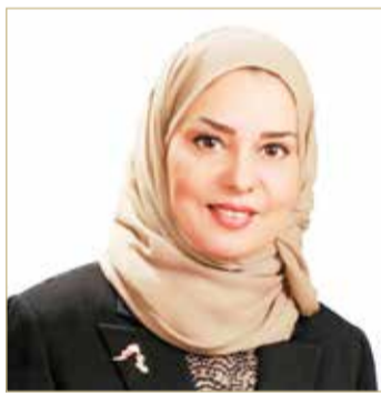
رئيسة مجلس النواب

العالمي، وإيجاد حلول للصراعات والنزاعات ونشر روح التعايش الإنساني بين الشعوب والمجتمعات، انطلاقاً من بنية تشريعية متينة، وبرامج واستراتيجيات متنامية تقوم بها السلطة التنفيذية برئاسة ولي العهد رئيس مجلس الوزراء صاحب السمو الملكي الأمير سلمان بن حمد آل خليفة، واعتبار تلك القيم أولويات ضمن جهود التنمية الوطنية المستدامة. وذلك بمناسبة الاحتفال بيوم الضمير الدولي، الذي جاء بمبادرة بحرينية واعتمده الأمم المتحدة ليكون الخامس من أبريل من كل عام.