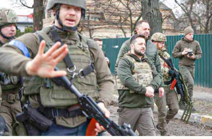
زليلنكي في شوارع بوتشا