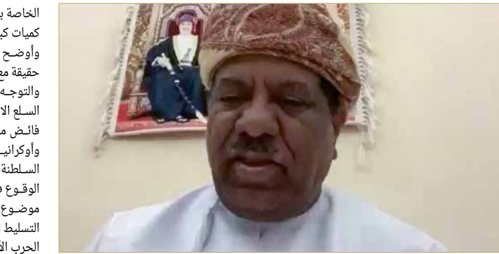
رئيس غرفة الصناعة والتجارة في عمان

وأضاف "أنا نعمل سوية مع إخواننا الأشقاء في دول مجلس التعاون، للبحث على بدائل مناسبة حول موضوع استيراد القمح وغيره من المواد الأساسية".