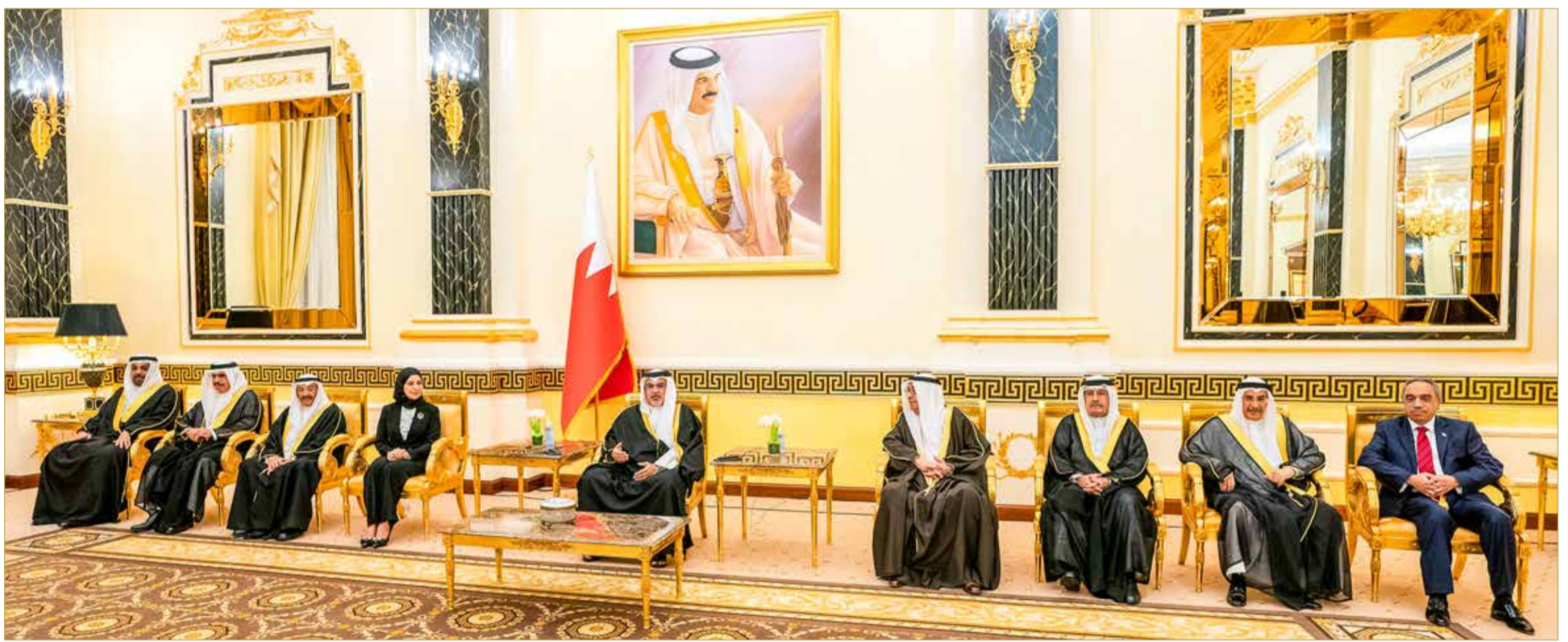
سمو ولي العهد رئيس الوزراء مستقبلاً رئيسي مجلسي النواب والشورى

سموه بإسهامات الأمير خليفة بن سلمان آل خليفة رحمه الله في قيادة العمل الحكومي لتنفيذ هذا البرنامج.