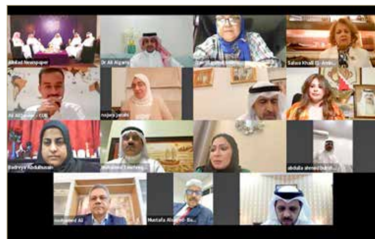
جانب من المشاركين بمجلس "البلاد" الرمضاني