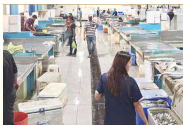
عزوف عن شراء الأسماك أمس

سمك الصافي، متوقعًا أن يكون السبب هو الإقبال على شراء الصافي من الباعة المتجولين في الشوارع، وعدم الشراء من سوق المنامة المركزي. وذكر أن كيلو سمك الصافي يتوفر بأحجام متفاوتة ويبدأ سعره من دينار واحد تقريبًا في الأسواق المحلية، إلا أن الأحجام المتوفرة في سوق المنامة المركزي يبدأ سعرها من 1.5 دينار ويصل إلى دينارين.