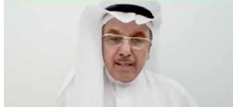
النائب عيسى القاضي

البلاد أكد عضو مجلس النواب ورئيس جمعية زخر البحرين عيسى القاضي أن العمل التطوعي يرتبط بالعباء ويخلق السعادة لدى الفرد والمجتمع، ويعد غريزة ودافعا للشعور بالرضا ومساعدة الناس وحب الخير، وهذه دوافع مغروسة وتربى عليها أهل البحرين منذ قديم الزمان، إذ تميزت البحرين كونها أولى الدول التي تأسست فيها مؤسسات المجتمع المدني، وشهدت نشاطا في مختلف المجالات والأصعدة. وأشار وهو الرجل المعطاء في العمل