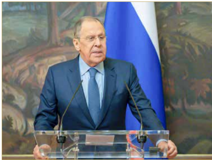
وزير خارجية روسيا الاتحادية

وأعرب سيرجي لافروف عن التقدير لمبادرة عاهل البلاد صاحب الجلالة الملك حمد بن عيسى آل خليفة، التي قدمت في اجتماع وزراء خارجية الدول الأعضاء في منظمة التعاون الإسلامي لبذل جهود إضافية للتسوية السلمية، مشيراً إلى أن هذه المبادرة تأتي في سياق إدراك أهداف الأمن الشامل في أوروبا، مبيّناً أن الوضع الحالي ليس مرتبطاً بالوضع في أوكرانيا فقط بل أيضاً بتلك الأسس التي ينبغي أن تضمن الأمن في عموم القارة الأوروبية.