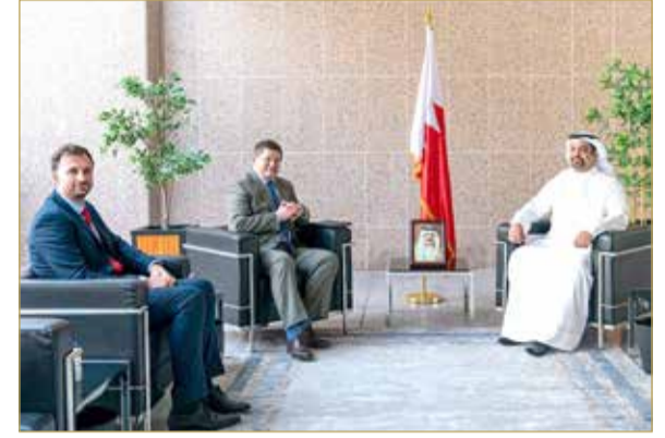
المنامة - وزارة المالية والاقتصاد الوطني

أكد وزير المالية والاقتصاد الوطني الشيخ سلمان بن خليفة آل خليفة على عمق العلاقات التاريخية الوطيدة بين مملكة البحرين والمملكة المتحدة الصديقة وما تستند إليه من مرتكزات راسخة عززت التعاون والشراكة الاقتصادية بين البلدين، بما يحقق مزيداً من الفرص الاستثمارية الواعدة لصالح البلدين وشعبيهما الصديقين، مشيراً إلى ما تحظى به تلك العلاقات من حرص