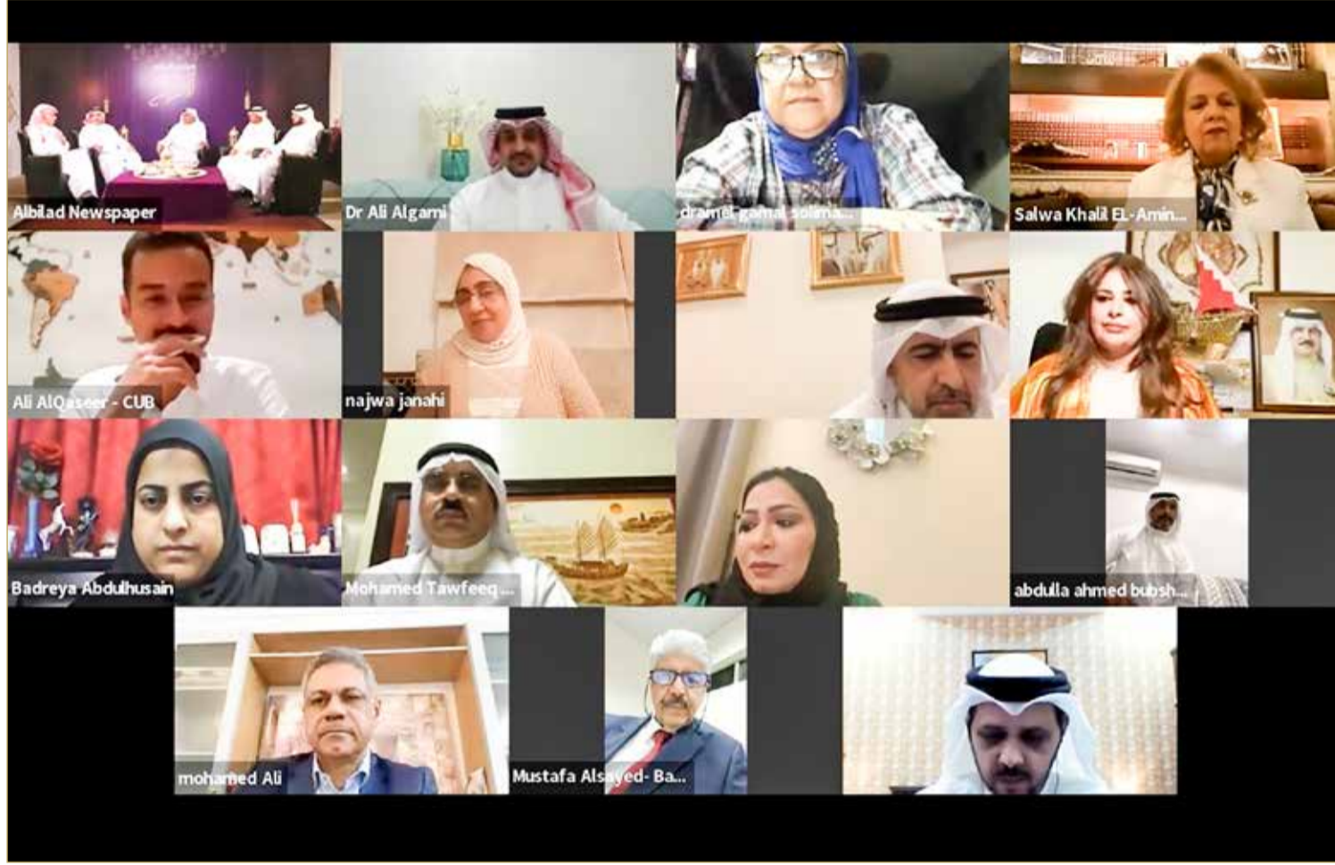
جانب من المشاركين بمجلس "البلاد" الرمضاني