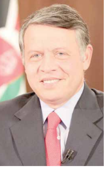
ملك المملكة الأردنية الهاشمية