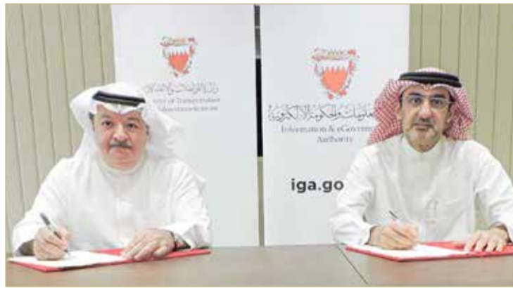
من مراسم توقيع مذكرة التفاهم

ركزت جهودها على أتمتة معظم عملياتها وخدماتها وتوفيرها إلكترونياً، مؤكداً بأنه قد أصبح بإمكان العملاء اليوم من إجراء معاملات بطاقة الهوية إلكترونياً عبر البوابة الوطنية وتوصيلها عبر البريد إلى منازلهم، بما يفنيهم عن زيارة مراكز الخدمة، وهو ما تحقق بفضل جهود فرق العمل بالهيئة وبتضافر