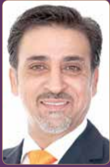
النائب عيسى الكوهجي