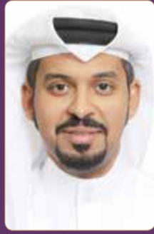
النائب إبراهيم النفهجي