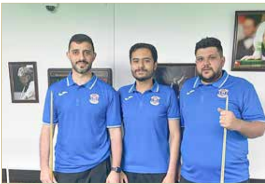
فريق نادي المنامة