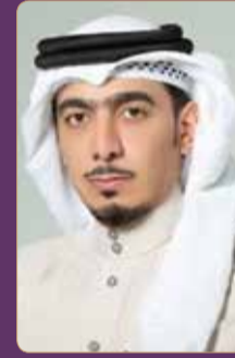
النائب حمد الكوهجي