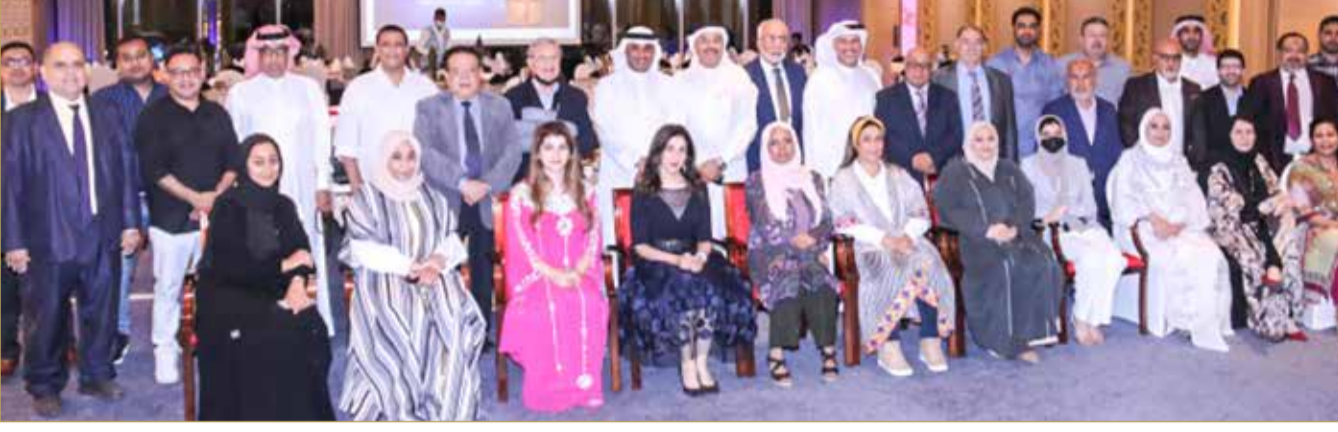
جانب من حفل الغبقة الرضائية