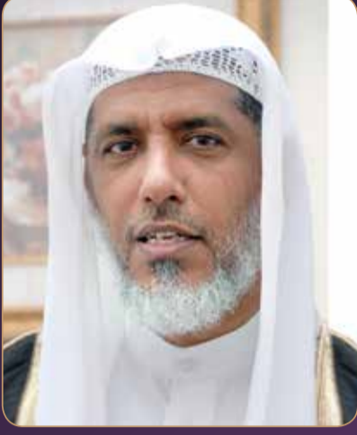
فضيلة الشيخ صلاح الجودر