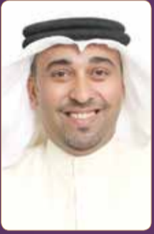
النائب محمد العباسي