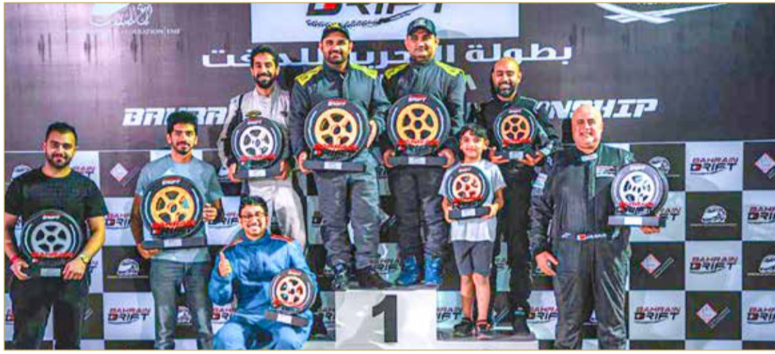
جانب من تتويج المتسابقين في الفئات المختلفة

المنظمة للبطولة المتسابقين لإنهاء إجراءات التسجيل خلال المواعيد التي سيتم الإعلان عنها ومتابعة جميع أخبار البطولة والمعلومات الخاصة بها من خلال حساب البطولة عبر موقع الانستغرام @Bahraindrif.