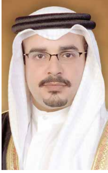
سمو ولي العهد رئيس مجلس الوزراء