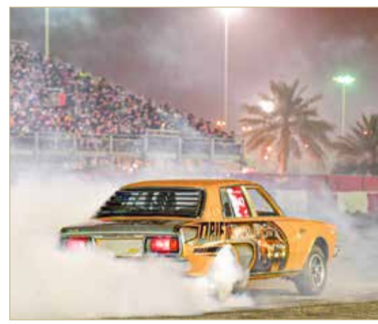
جانب من الفعالية

السابقة نجاحاً منقطع النظير بمشاركة نخبة من المحترفين والهواة في أجواء مثيرة وسط حضور جماهيري كبير وفي بيئة آمنة من خلال احترازاات السلامة التي اتخذتها اللجنة المنظمة بالتعاون مع الحلبة.