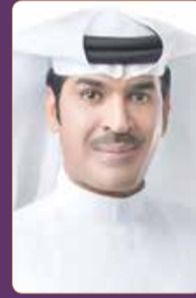
النائب يوسف الذواذي