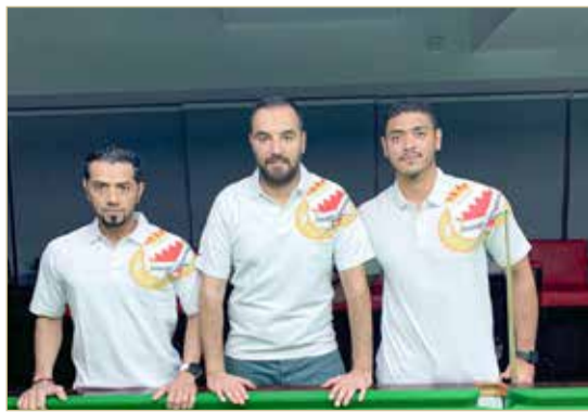
فريق "وزارة الداخلية A"

أجل تحقيق الانتصار وحصد بطاقتي التأهل لدور الثمانية، والتي ستكون لصاحب المركزين الأول والثاني. ورصدت اللجنة المنظمة للبطولة مكافآت مجزية للفائزين بالمراكز الثلاثة الأولى وأيضاً لأعلى معدل للقاط.