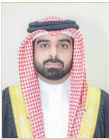
سمو الشيخ سلمان بن محمد

ومن جانبه، تقدم رئيس مجلس إدارة الاتحاد البحريني الرياضي للضم، باسم ميرزا المؤذن، بالشكر وعظيم الإمتنان إلى سمو الشيخ خالد بن حمد آل خليفة على دعم سموه المستمر لجميع الرياضيين، وإلى سمو الشيخ سلمان بن محمد آل خليفة على جهود سموه في تطوير الألعاب القتالية، وإلى الشيخ محمد بن دعيج آل خليفة رئيس اللجنة البارالمبية البحرينية على ما يبذله من جهود لتمكين وتطوير ذوي العزيمة في المحيط الرياضي، معبراً عن اعتزازه بالإنجاز الذي تحقق، وعن شكره لنادي الروح الحرة على دعمه الفني والتدريبي الذي ساهم في الوصول لهذه النتيجة.