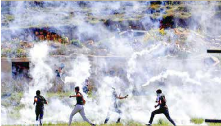
الجيش الإسرائيلي اعتقل فلسطينيين وصادر اسلحة في الضفة الغربية

وأضاف الجيش أن "جنودا من الجيش الإسرائيلي وقوات أمن اسرائيلية القوا القبض على عشرين مطلوباً من المشتهة بهم خلال الليل وفي الصباح الباكر". وبحسب نادي الأسير الفلسطيني