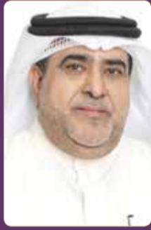
النائب خالد بوعنق