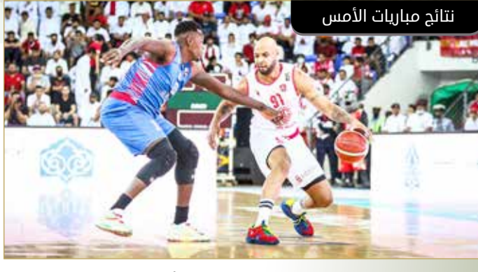
نتائج مباريات الأمس

من لقاء المنامة والمحرق في النهائي الأول لدوري زين