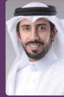
النائب عمار قمبر