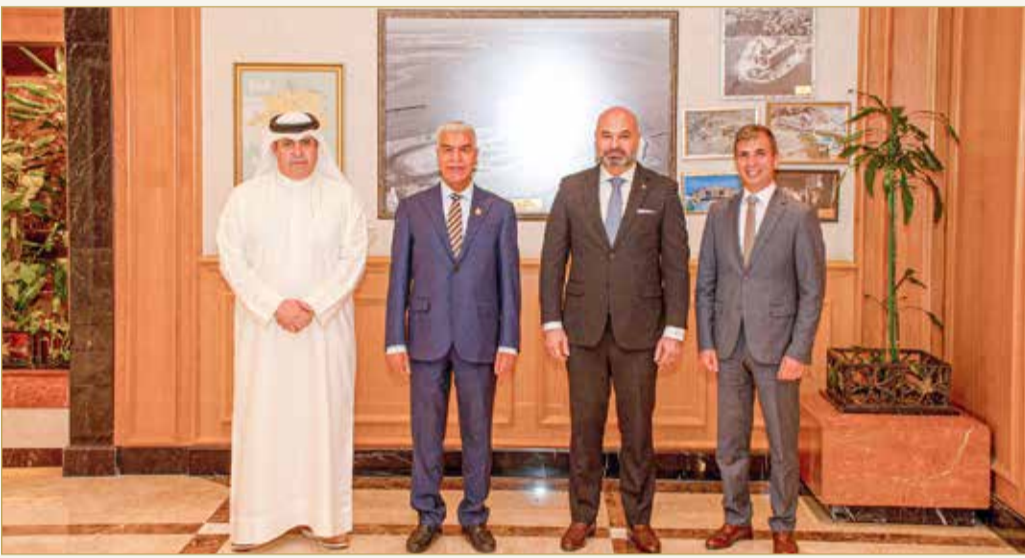
الاجتماع بين الجانبين

البارزة في مملكة البحرين لسنوات عديدة. وأضاف فردان "يمثل شهر رمضان المبارك وقتاً ذا أهمية كبيرة للمناسبات في البحرين، ولهذا نحاول دعم عدد متنوع من الأنشطة التي تضيف قيمة لعملائنا وجميع المقيمين في البحرين".