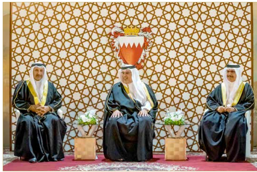
سمو ولي العهد رئيس الوزراء مستقبلاً عدداً من المواطنين من أصحاب المجالس

أكد ولي العهد رئيس الوزراء صاحب سمو الملكي الأمير سلمان بن حمد آل خليفة على أهمية تكاتف الجميع لتنفيذ مسارات العمل المختلفة التي تعمل عليها المملكة ومنها الإستراتيجيات والخطط الهادفة إلى تحقيق النماء والازدهار للوطن والمواطنين، لافتاً سموه إلى أن مملكة البحرين بعزم أبنائها تخرج دائماً من كل تحدٍّ وهي أشد منعة وقوة، واليوم بعد التحدي الصحي الذي مر به العالم أجمع فإننا ننظر لما هو مقبل بتفاؤل، فالجميع اليوم يعمل من أجل مزيد من النمو الاقتصادي بما يعزز التنافسية واستدامة التنمية، وهو ما عكسه التحسن في أداء المؤشرات الاقتصادية التي دعمتها خطة التعافي الاقتصادي. جاء ذلك لدى استقبال سموه بقصر الرفاع أمس، بحضور سمو الشيخ محمد بن سلمان بن حمد آل خليفة وعدد من أصحاب المعالي والسعادة من كبار المسؤولين، عددًا من المواطنين من أصحاب المجالس الرمضانية. (02)