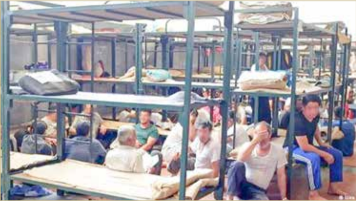
السجون الإيرانية مكتظة بالنزلاء

ملاسات و وفاة 92 رجلاً وأربع سيدات في الحجز في 30 سجنًا في 18 محافظة عبر إيران منذ يناير 2010، إلى توثيق منظمة العفو الدولية لمجموعة مختارة من الحالات التوضيحية.