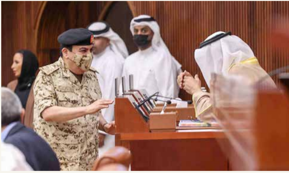
رئيس القضاء العسكري رئيس محكمة التمييز العسكرية محبياً وزير شؤون المجلسين