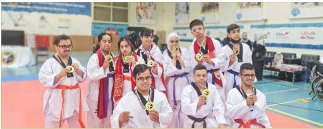
أبطال البحرين من ذوي العزيمة