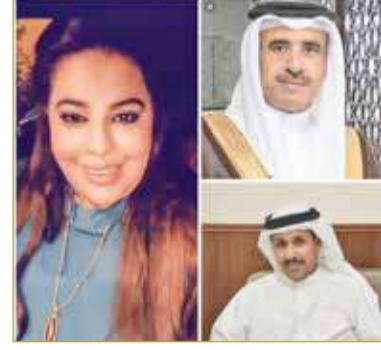
صورة من مقطع الفيديو

الحيدان وكل الموظفين والعاملين في الوزارة. وأوضحت النائب أن عدد الوحدات التي تم توزيعها في سادسة العاصمة، بلغ 227 وحدة سكنية، مشيرة إلى أن الدائرة حظيت بالعدد الأكبر من الوحدات الموزعة في محافظة العاصمة من أصل 1314 وحدة.