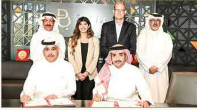
توقيع اتفاقية الرعاية الرسمية

المنطقة الخليجية، ومن جانبه، أعرب الشيخ عبدالله بن خليفة آل خليفة عن سروره بشراكة بتلكو الإستراتيجية لمعرض البحرين الدولي للطيران على مدى السنوات الماضية، منوهاً بأن المعرض أصبح من المعارض العالمية التي تحظى بسمعة مرموقة وتستقطب المتابعين والزوار من مختلف أنحاء العالم، وأن هذه الشراكة تتماشى مع إستراتيجية بتلكو في دعم الفعاليات الوطنية التي لها صدى عالمي حرصاً منها على عكس صورة مشرفة للمملكة، معرباً عن اعتزازه بكون شركة بتلكو الشريك الاستراتيجي والحصري لتزويد خدمات اتصالات مبتكرة وذات مستوى عالٍ للمعرض لضمان التغطية الجيدة للشبكة التي يستفيد منها الزوار، بالإضافة إلى تلبية احتياجات اتصالات البيانات لإدارة العمليات التشغيلية خلال فترة المعرض.