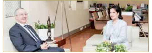
المنامة - هيئة الثقافة والآثار

استقبلت رئيسة هيئة البحرين للثقافة والآثار الشيخة مي بنت محمد آل خليفة في مقر الهيئة أمس، سفير الجمهورية الجزائرية الديمقراطية الشعبية لدى مملكة البحرين عبدالحميد خوجة، وتأتي هذه الزيارة بهدف بحث مجالات التعاون والتكامل الثقافي بين البلدين الشقيقين.