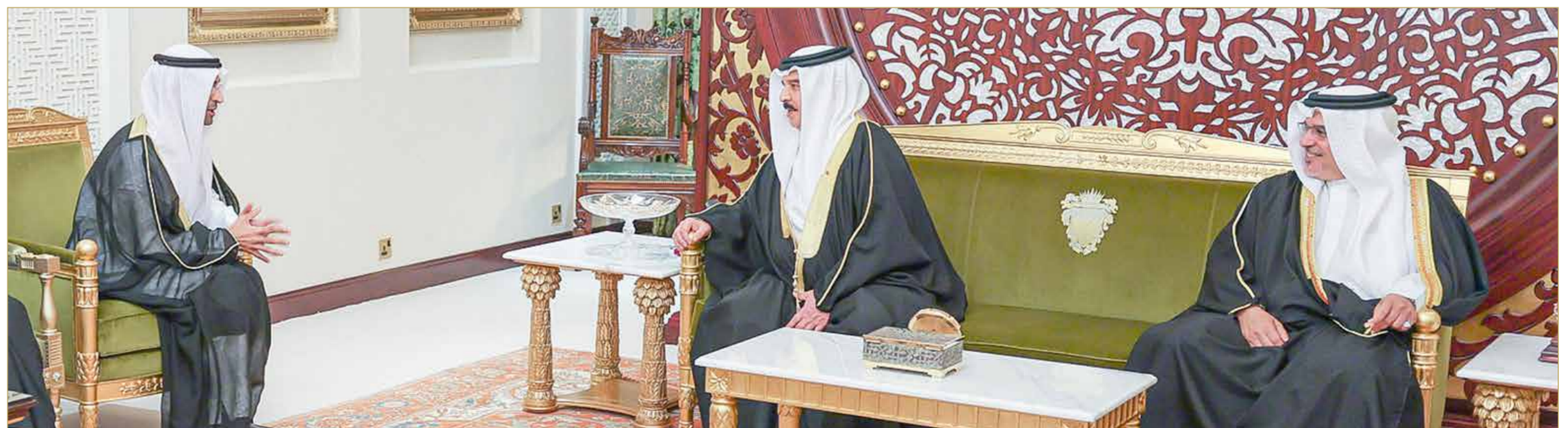
جلالة الملك مستقبلاً الأمين العام لمجلس التعاون