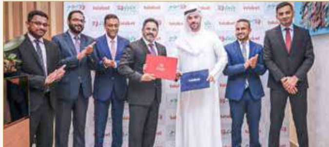
عقب إبرام الشراكة بين "لولو" و"طلبات"

لتوفير جميع الخيارات المريحة لزبائننا، ووجود اللولو على طلبات سيوفر تجربة متميزة لهم". وقال مدير مجموعة لولو، جوزيف روباوالا "تعد مجموعة لولو دائماً في الطليعة لجعل تجربة البيع بالتجزئة أكثر متعة، وبأسعار معقولة بقيمة عالية من حيث الجودة لمتسوقينا. وتفتح هذه الشراكة مع طلبات آفاقاً جديدة خلال تواجدها للبيع بالتجزئة في البحرين، تنهج القنوات المتعددة لتجارة الإلكترونية".