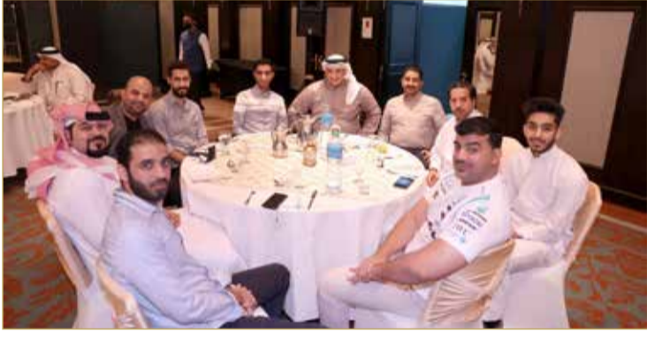
كوادر "البلاد" من أقسام عديدة

الحواج على جهود الزملاء، مشيراً لما يتلقاه من رسائل إعجاب وتقدير من المتابعين للصحيفة.