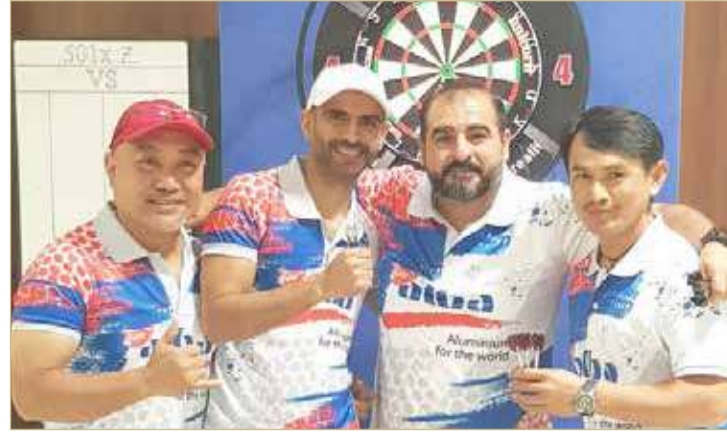
فريق "ألبا 1"

تعرض حرسهم على المشاركة الفاعلة في مسابقات الاتحاد البحريني للبيارد والسنوكر والدارتس. مؤكداً في الوقت ذاته، أن اللجنة المنظمة للبطولة قد أنهت جميع ترتيباتها الإدارية لإقامة المباراة الختامية وسخرت إمكانياتها من أجل تحقيق أعلى معدلات النجاح لهذا الحدث.