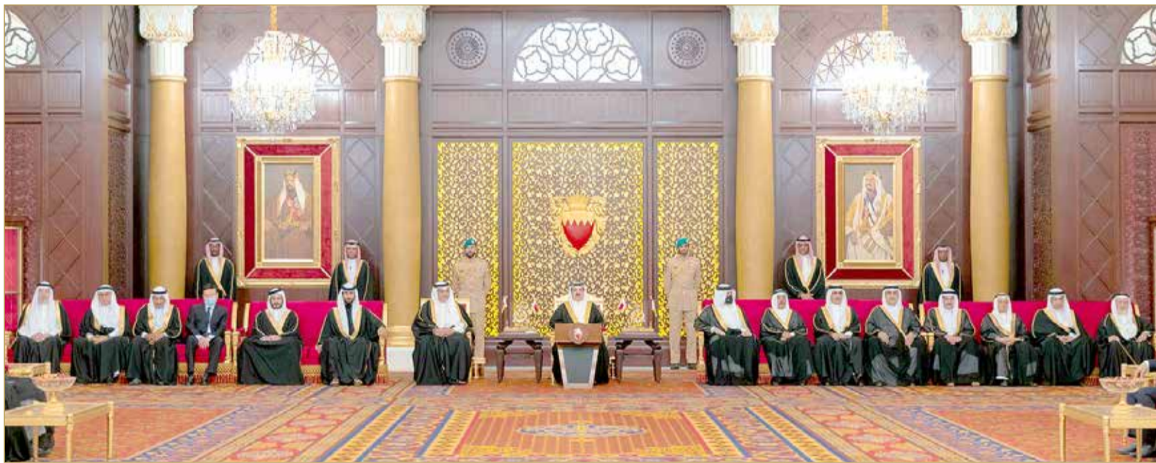
جلالة الملك مستقبلاً المهنيين من أهالي العاصمة بمناسبة رمضان