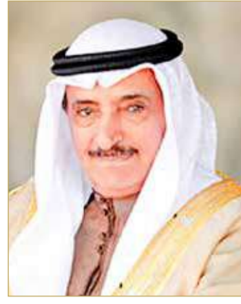
الشيخ سلمان بن عبدالله آل خليفة

5705 معاملات بالتسجيل العقاري خلال العام 2021