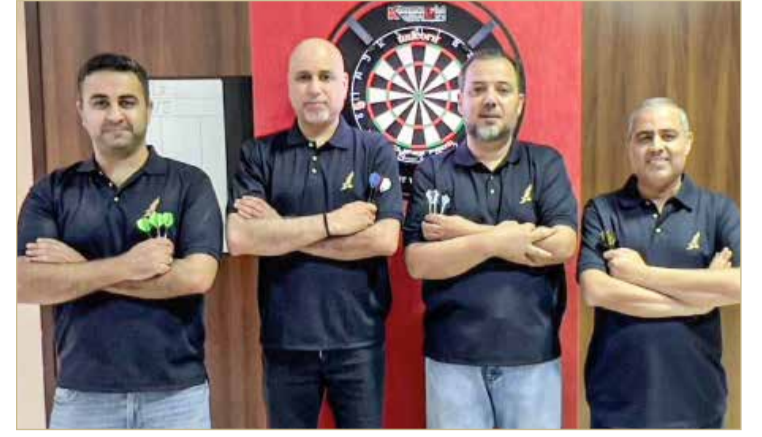
فريق "طيران الخليج"

الطرف الآخر، طفر فريق طيران الخليج بالبطاقة النهائية الثانية بعد ما اجتاز فريق ألبا 4 (1/3). من جانبه، أشاد رئيس لجنة الدارتنس راشد الدوسري بالمستويات التي ظهرت عليها البطولة والتنافس القوي فيما بين اللاعبين على مدار أيامها الماضية، مشيراً إلى أن المشاركة الواسعة من قبل الأندية والشركات