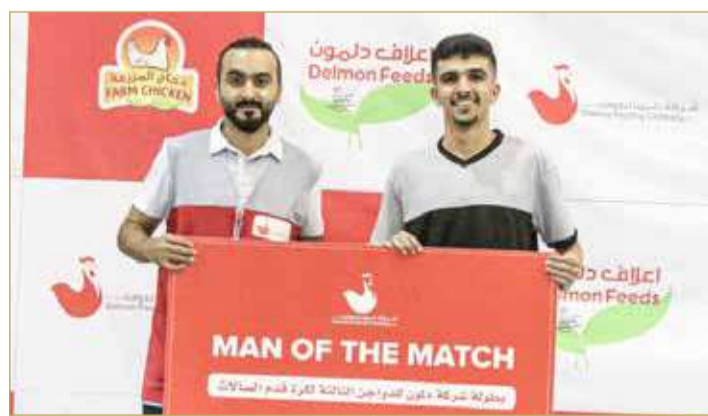
تكريم أفضل في المباراة

بصورة أقوى من خلال رغبته في التسجيل والخروج منتصراً في المباراة، إلا أن التعادل هو ما حسم الموقف وتقسام الفريقان نقاط الطرفين، وظهر الفريق السعودي