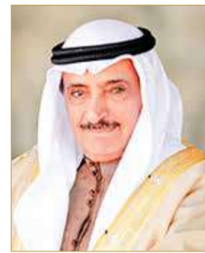
الشيخ سلمان بن عبدالله

9 %، إذ كانت عدد المعاملات خلال نفس الفترة من العام الماضي 2021 حوالي 5705 معاملات.