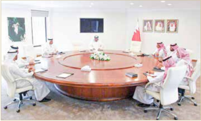
وزير الإعلام يستقبل مدير عام جهاز إذاعة وتلفزيون الخليج

استقبل وزير الإعلام علي الرميحي، أمس، مدير عام جهاز إذاعة وتلفزيون الخليج مجري القحطاني، بحضور بحضور وكيل وزارة الإعلام عبد الرحمن بحر والوكيل المساعد لشؤون الإذاعة والتلفزيون عبدالله الدوسري. وتم أثناء اللقاء مناقشة الاستعدادات والترتيبات اللازمة لاستضافة مهرجان الخليج للإذاعة والتلفزيون في دورته الخامسة عشرة، مشيداً الوزير بجهود جهاز إذاعة وتلفزيون الخليج في الإعداد والتجهيزات لهذا الحدث الخليجي المهم.