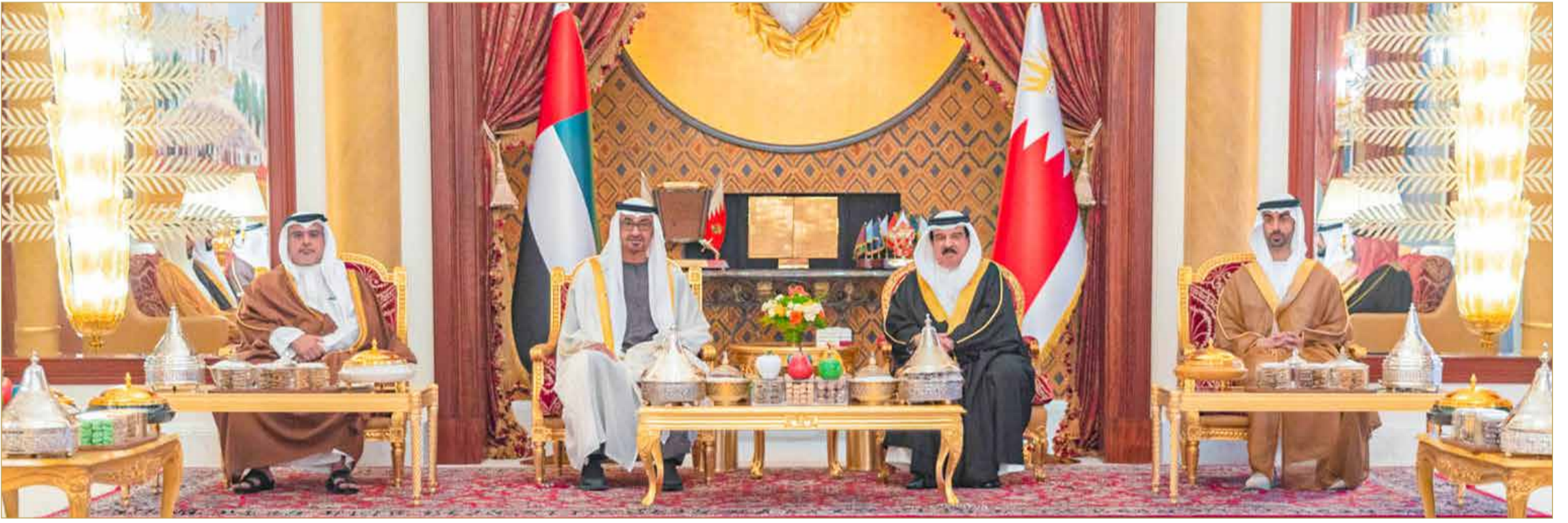
جلالة الملك وسمو ولي عهد أبوظبي يبحثان في قصر الصخبر العلاقات الأخوية

من وحدة التاريخ والهدف والمصير المشترك بما يحقق الخير والتقدم والازدهار لمواطني دول المجلس، كما شجدا على أهمية وحدة الصف العربي وتضافر الجهود لتحقيق التضامن العربي وتعزيز مسيرة العمل العربي المشترك لما من شأنه تلبية تطلعات شعوبنا العربية لتحقيق الأمن والاستقرار والازدهار.