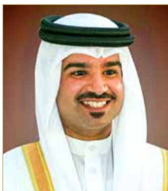
خليفة بن علي