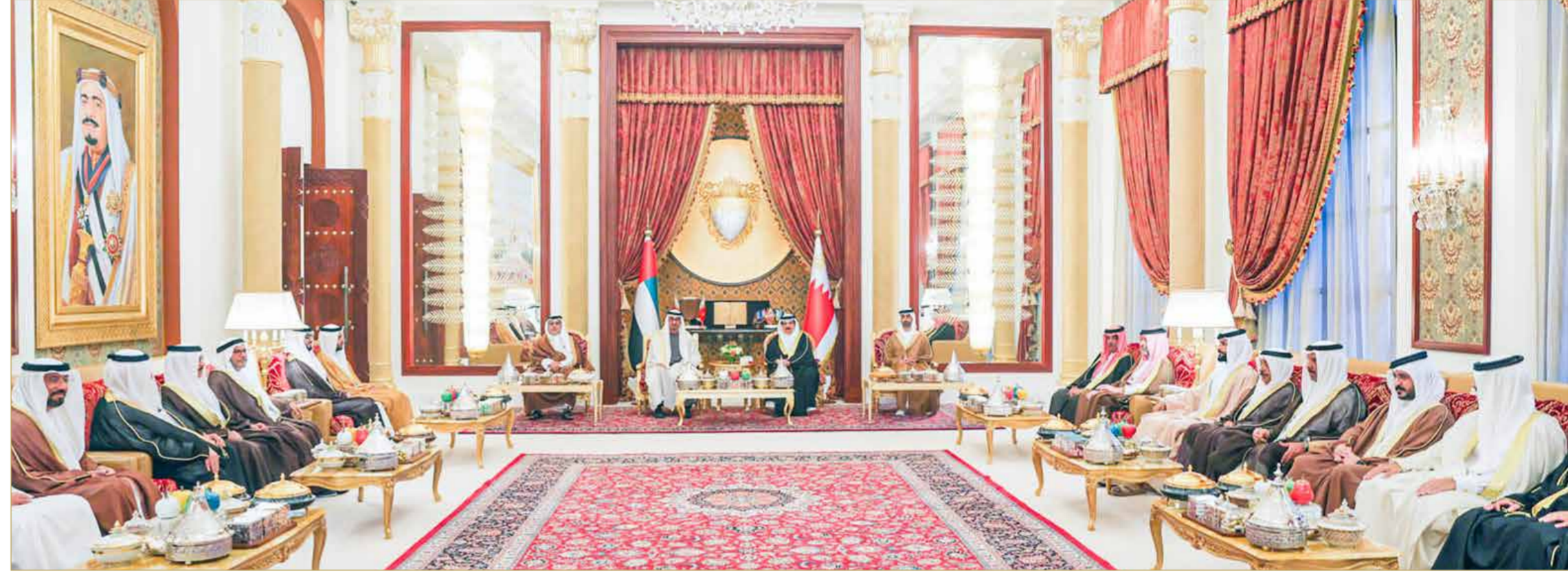
جلالة الملك مستقبلاً سمو ولي عهد أبوظبي