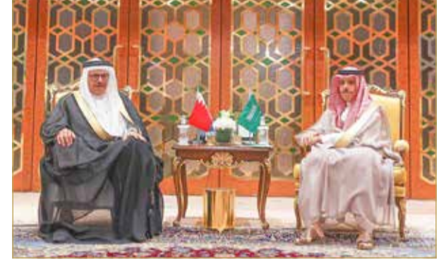
وزير الخارجية يجتمع مع وزير خارجية المملكة العربية السعودية

وخلال الاتصال، تم استعراض مسار علاقات التعاون الثنائي القائمة بين مملكة البحرين وجمهورية طاجيكستان الصديقة وما تشهده من تطور ونمو في مختلف المجالات، وسبل تعزيز العلاقات والارتقاء بها إلى مستويات أرحب بما يحقق مصالح البلدين، بالإضافة إلى القضايا ذات الاهتمام المشترك.