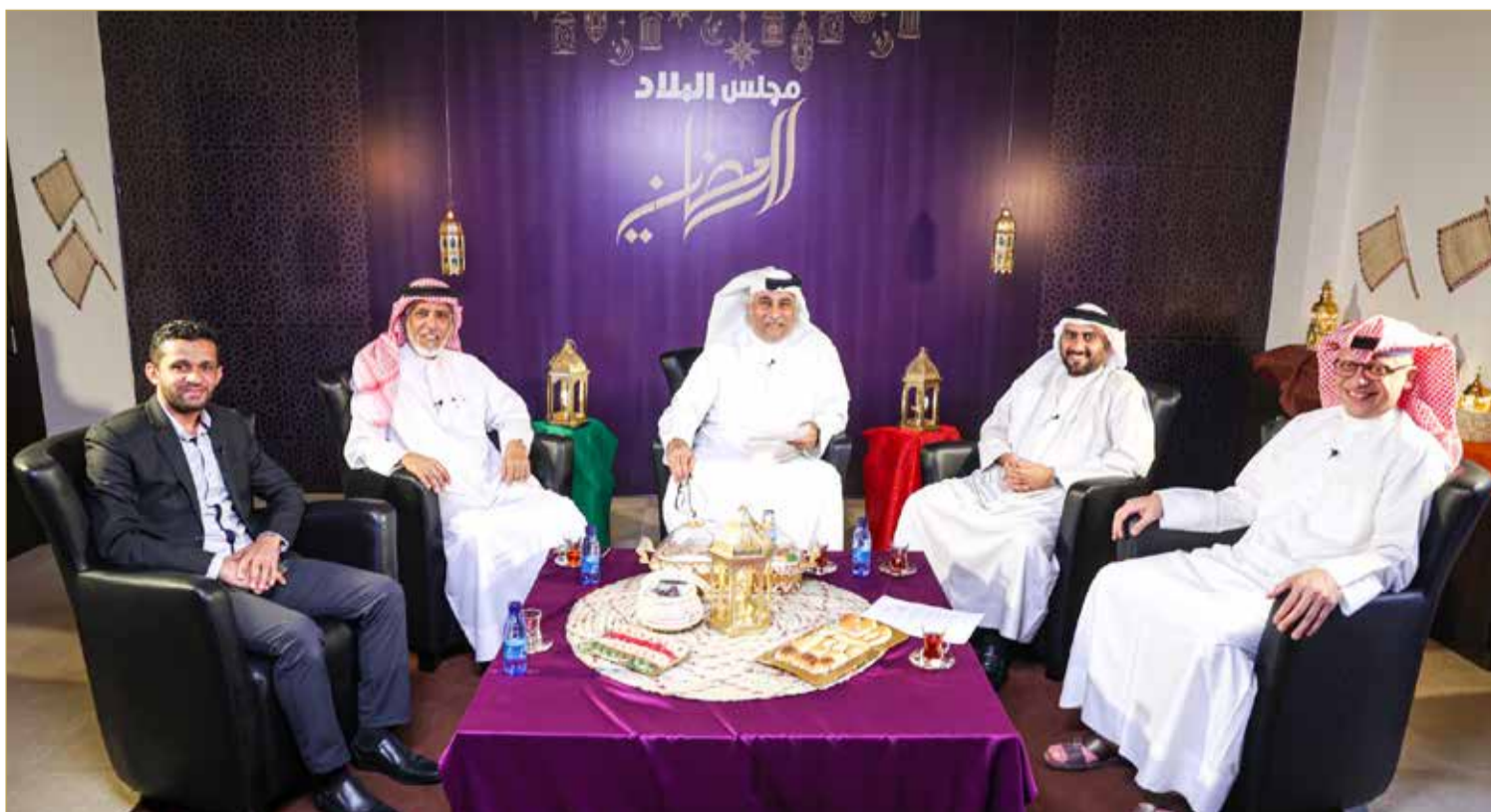
جانب من الحضور بالاستوديو

المجلس عن المحرق الجميلة العريقة وتاريخها وحاضرها وهمومها أيضًا. وأشار المردي إلى أن العاميين الماضين خلال فترة جائحة الكورونا (كوفيد - 19) كانت فترة عصيبة عاشها الجميع، وسوق المحرق ليس بمنأى عن ذلك، متسائلًا عما إذا عادت الحياة إلى سوق المحرق، وما هو المطلوب لزيادة الحركة في سوق المحرق.