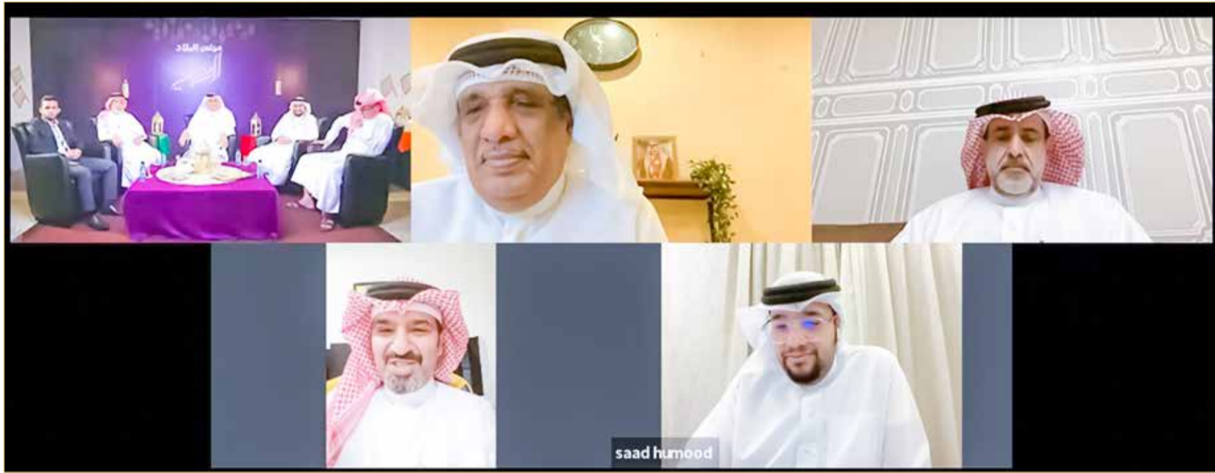
جانب من المشاركين في المجلس الرمضاني

بشكل عام والمحرق بشكل خاص كونه ممثلًا عن محافظة المحرق. وأضاف أنه "يسعى عبر مجلس النواب وضمن مشروع جلالة الملك لإحياء فرجان لول القديمة الذي تم تكليف وزارة الإسكان للقيام به منذ العام 2014 وإلى اليوم ولا يزال ننتظر وضع حجر الأساس لمشروع جلالة الملك". وأشار إلى أن "جامع الشيخ حمد بن عيسى بمحافظة المحرق منذ صدر قرار صاحب السمو الملكي ولي العهد رئيس مجلس الوزراء وحتى يومنا هذا لم نر الجهات المعنية تعمل في هذا الجامع، رغم أن القرار صدر منذ شهرين". وذكر أنه "منذ أطلق سمو الشيخ ناصر بن حمد آل خليفة مشروع ملاعب الفرجان وحتى يومنا هذا لإنشاء 100 ملعب، لم نر ملعبًا واحدًا أنشئ في فرجان المحرق"، متسائلًا أين ذهب الاهتمام بالمحرق. وقال النفيعي إن وزارة الإسكان ترغب في إخراج ساكني الشقق المؤقتة بمحافظة المحرق القديمة، ويتم عرض مبلغ 200 دينار عليهم لمدة سنتين من أجل البحث عن شقق أخرى لهم، مشيرًا إلى أنه في حال وجدوا لهم شققًا فإنهم لن يستمروا في البقاء في الشقق القديمة التي يتساقط سقفها على قاطنيها، داعيًا للاهتمام من خلال منصة المجلس الرمضاني وإيصال صوت ساكني شقق العمارات