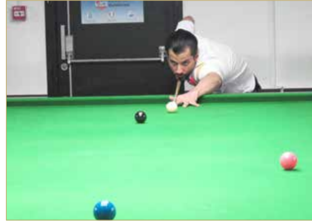
جانب من المنافسات

مواجهتي هذه المرحلة أكثر سخونة في ظل وصول أسماء لامعة في سماء اللعبة وأيضاً للوجوه الصاعدة والتي تزيد إثبات مكانها وقدرتها في هذه البطولة.