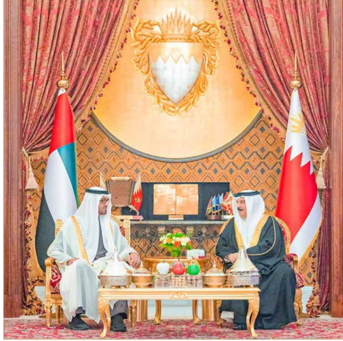
جلالة الملك يجري مباحثات مع سمو ولي عهد أبوظبي