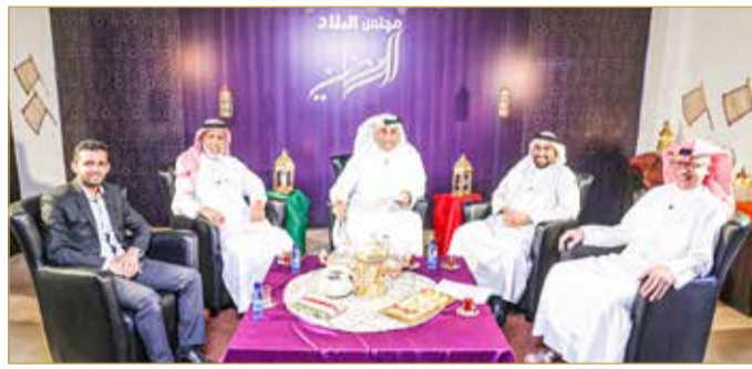
جانب من الحضور بالاستوديو