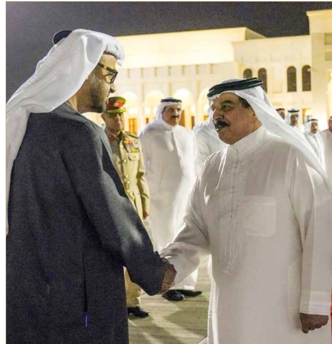
جلالة الملك في مقدمة مودعي ولي عهد أبوظبي