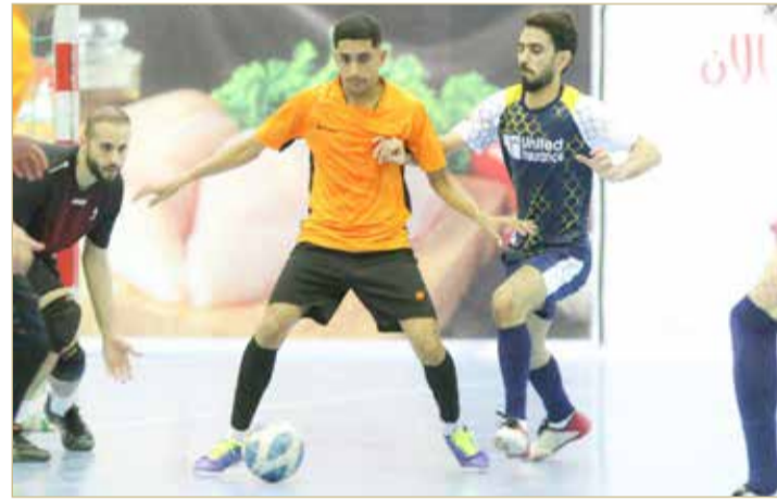
لقطة من لقاء المتحدة للتأمين ومازدا السعودي