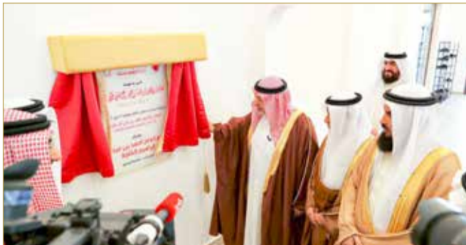
وزير العدل والشؤون الإسلامية والأوقاف يفتتح جامع أحمد الخاجة في شرق الحد

البلاد صاحب الجلالة الملك حمد بن عيسى آل خليفة، وصاحب السمو الملكي ولي العهد رئيس مجلس الوزراء لدور العبادة، لما للمساجد من دور فاعل في نهضة المجتمع واستقراره بإشاعة قيم التعاون والتكاتف والوحدة والتكافل والبناء، وإسهامها الفعال في تعزيز المواطنة الصالحة. من جانب آخر، افتتح رئيس مجلس الأوقاف السنية الشيخ راشد الهاجري مسجد بريد بن سعيد بن بريد البورحمة المنصوري بمنطقة جو بالمحافظة الجنوبية. (02)