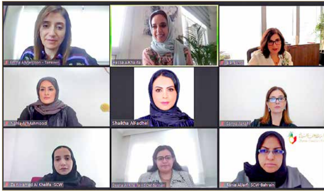
سمو الشيخة حصة بنت خليفة تعقد اجتماعاً لمناقشة نتائج امتياز الشرف لرائدة الأعمال البحرينية الشابة

كما ناقش الاجتماع آلية تقييم المشاركات، وخطة العمل المقبلة التي ستشمل زيارات ميدانية لأفضل