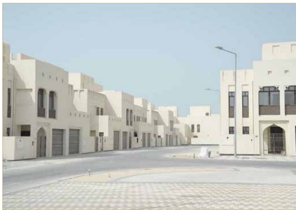
إسكان شرق الحد