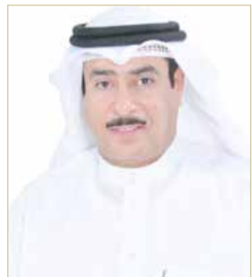
النائب عيسى الدوسري

وأكد الدوسري “أن ما حدث هو استكمال لمسيرة الاستهداف الممنهج للصيادين البحرينيين في أرزاقهم، ويشكل انتهاكا لمبادئ الأخوة الخليجية وحسن الجوار، الذي التزمت به مملكة البحرين على الدوام، حرصا على اللحمة الخليجية والبيت الواحد الخليجي الواحد، وهي لب ما تسعى له كل دول الخليج من حرص على تعزيز تلك اللحمة