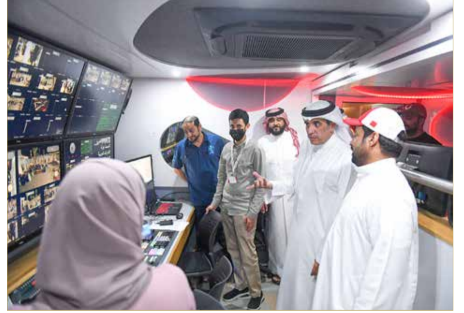
وزير الإعلام يزور مواقع تصوير وتنفيذ البرامج التلفزيونية والإذاعية والإخبارية المباشرة

أكد وزير الإعلام علي الرميحي، حرص الوزارة على تقديم وطرح مجموعة متنوعة من البرامج التلفزيونية والإذاعية الخاصة بشهر رمضان المبارك، والتي تتناسب مع موروثنا الشعبي الأصيل وتراثنا الوطني والذائقة العامة للمشاهد البحريني والعربي. جاء ذلك، في زيارة الوزير لمواقع تصوير وتنفيذ البرامج التلفزيونية والإذاعية والإخبارية المباشرة التي تقدمها الوزارة خلال الشهر الفضيل، حيث قام بزيارة موقع تصوير برنامج "السارية" في سوق البراحة بديار المحرق، واطلع على سير عمل البرنامج، مثنياً الدعم الكبير الذي يلقيه قطاع الإعلام بشكل عام وبرنامج "السارية" بشكل خاص من ممثل جلالته الملك للأعمال الإنسانية وشؤون الشباب رئيس المجلس الأعلى