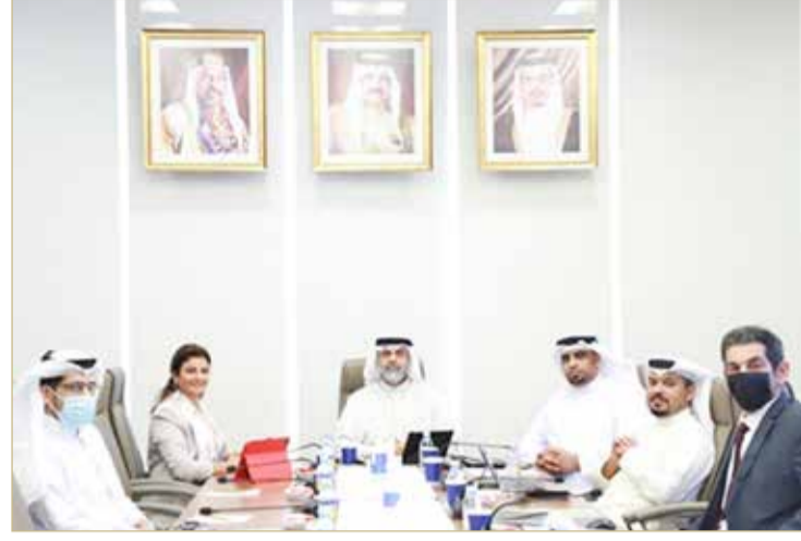
أحد اجتماعات لجنة الخدمات بمجلس النواب

وأكدت ضرورة أن تتحمل الصحف كمؤسسات العقوبات التي تقع عليها، وليس رئيس التحرير أو المحرر المسؤول شخصيا. ودعت إلى استبدال كلمات أو مصطلحات جرائم النشر أينما