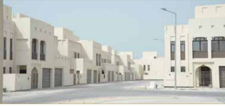
إسكان شرق الحد

للخدمات التجارية. ولفت إلى أنه بالإضافة إلى ذلك هنالك المواقع المخصصة للمحلات التجارية شمال غرب المدينة، والواقعة ضمن منطقة الخدمات المجاورة لمرافأ الصيادين، حيث تقوم هيئة التخطيط والتطوير العمراني بأعمال التخطيط والمتابعة لهذه المنطقة.