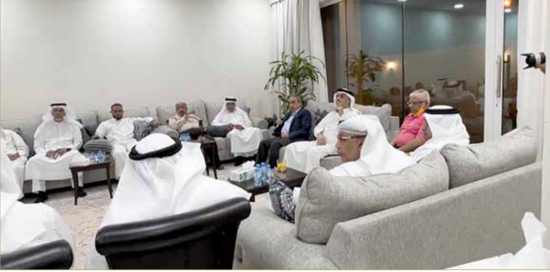
جانب من حضور مجلس الصالح الرمضاني

◆ خطة شاملة لتطوير البنية التحتية بالدائرة ◆ تغطية 81 % من الدائرة بالصرف الصحي ◆ 3.63 مليون دينار لمشاريع قطاع الطرق