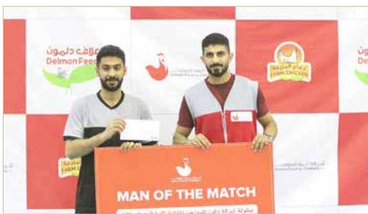
تقديم جائزة أفضل لاعب

السعودي مع فريق المعامير في مباراة يتوقع أن تكون مثيرة وقوية بين الفريقين، فيما تجمع المباراة الثانية بين فريق دزني البحرين وفريق الأبعاد والتطوير والبناء في مباراة مرتقبة ويتوقع أن تكون متكافئة بين الفريقين.