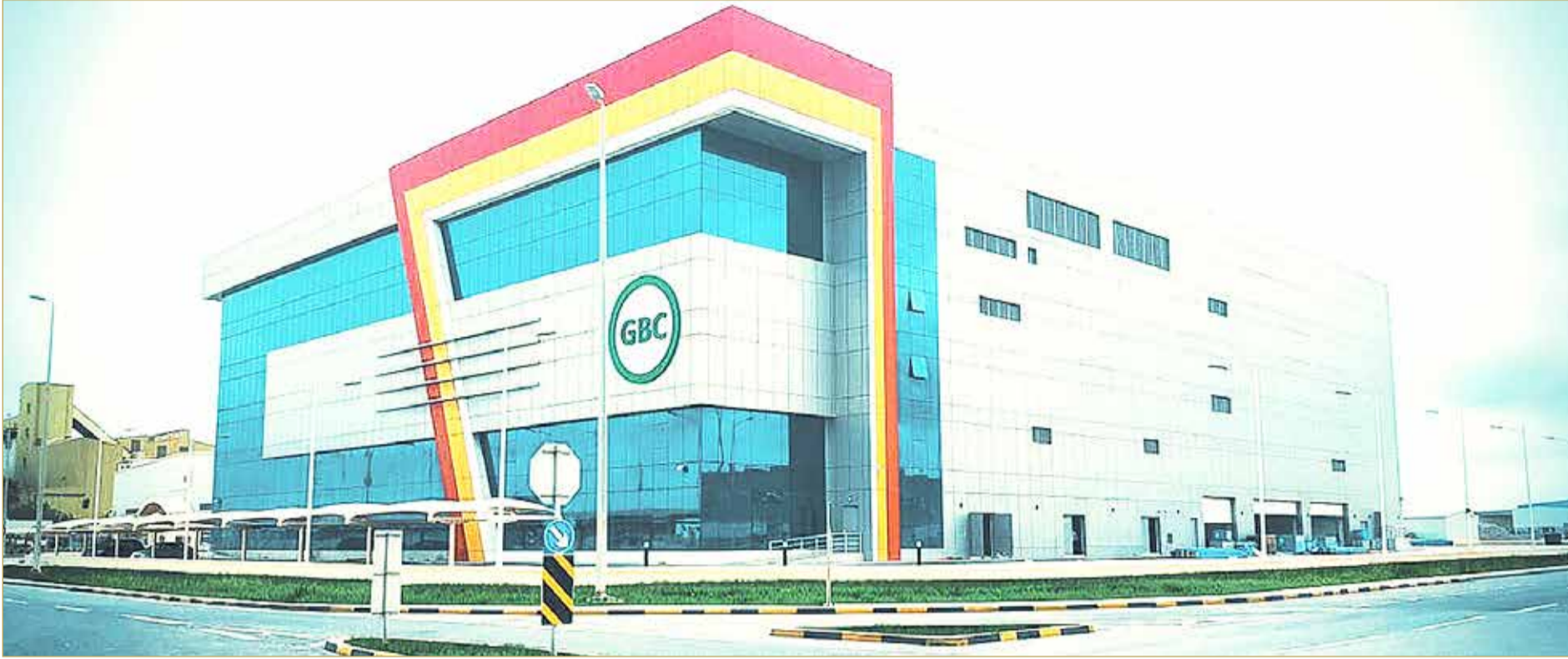
مصنع الخليج للتكنولوجيا الحيوية