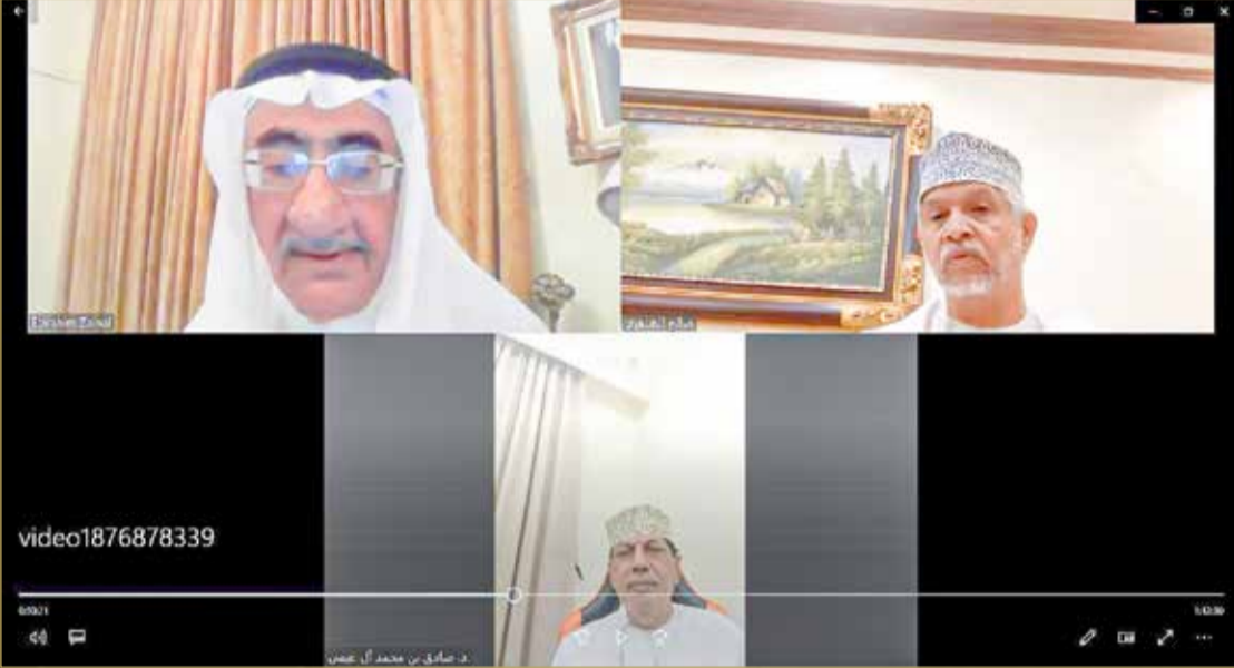
الجلسة الحوارية بمجلس خنجي في سلطنة عمان