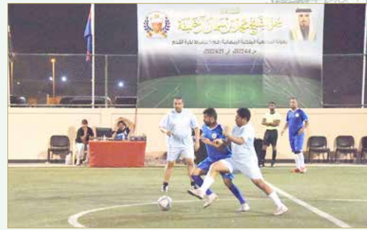
من منافسات البطولة