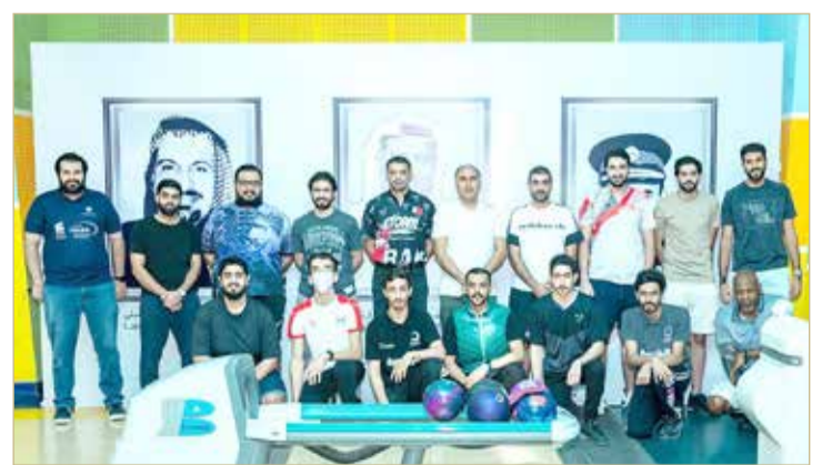
صورة جماعية للمشاركين