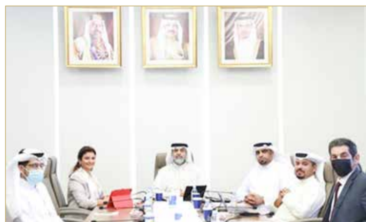
أحد اجتماعات لجنة الخدمات بمجلس النواب

من جهتها، رأت المؤسسة الوطنية لحقوق الإنسان أنها "لا تجد مبرراً مقبولاً يجعل من الشخص المحروم من حقوقه السياسية (الحق في الانتخاب) محروفاً من مباشرة حقه في الرأي والتعبير من خلال تملكه موقفاً إلكترونياً أو المساهمة في ملكيته". (05)