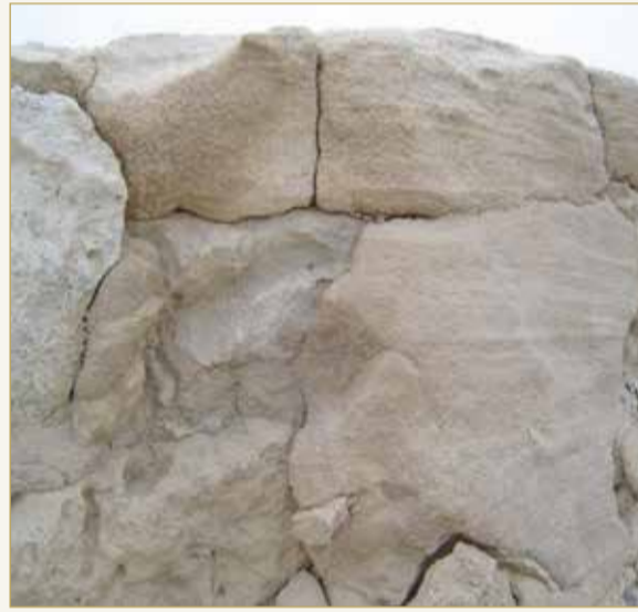
تأثير الرياح المحملة بحبيبات الرمال على جدران الآثار نتيجة للجفاف