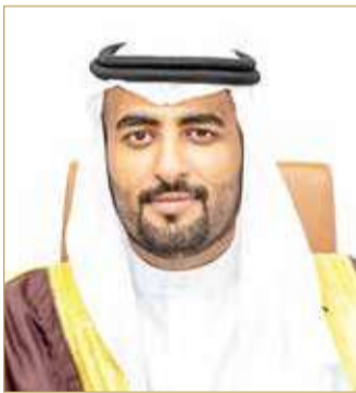
الشيخ نايف بن خالد

عن فئة الإدارة المبتكرة في المؤسسات الحكومية