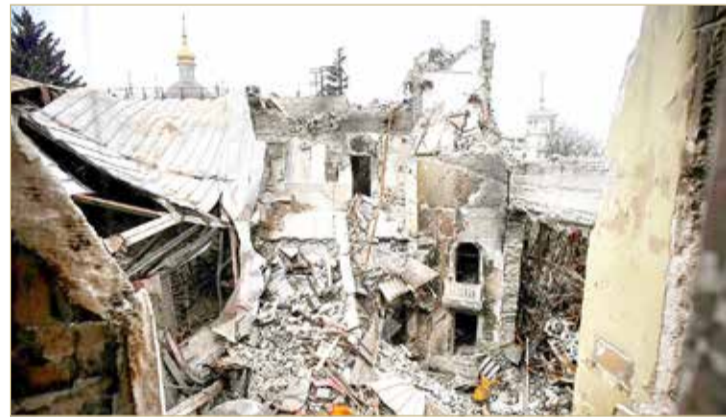
من آثار الدمار في مدينة ماريوبول الإستراتيجية

طويل الأمد. وقال رئيس الوزراء الأوكراني دنيس شميغال، أمس (الأحد)، إن القوات المتبقية في مدينة ماريوبول الساحلية الجنوبية مازالت تقاوت وتواصل تحدي مطلب روسي بالاستسلام. (08)