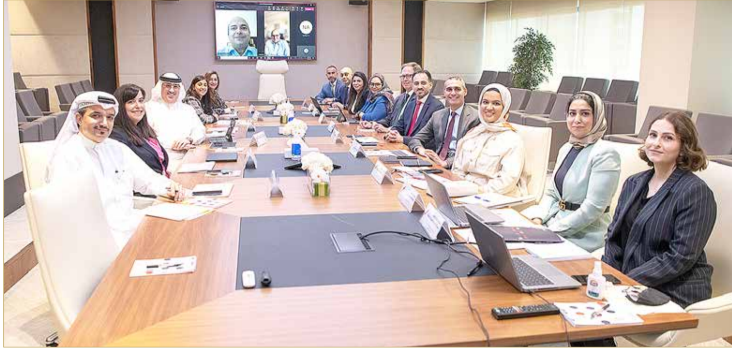
الاجتماع الأول لمجلس إدارة "تمكين" 2022

كما تم إبرام شراكات إستراتيجية مع 8 مصارف لتقديم التسهيلات التمويلية للمؤسسات التي تهدف للتطور والنمو عبر برامج تمكين وذلك بما يساهم في الارتقاء بأعمالها ودعم توسعها في الأسواق المحلية والدولية. إلى ذلك، أعلنت "تمكين" عن تدشين بوابتها الإلكترونية الجديدة بالتزامن مع إطلاق النسخة المحدثة من برامج الدعم بهدف تحسين مستوى الخدمة وتطوير آليات تقديم الطلبات وربطها بمعايير تقييم محددة مرتبطة بمؤشرات الأداء الرئيسية.