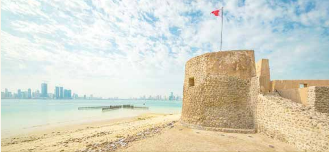
قلعة البحرين أحد المعالم الأثرية في البحرين

حسب الاتفاقية التي أقرها المؤتمر العام لمنظمة الأمم المتحدة للتربية والعلم والثقافة في باريس في عام 1972، وخصصت رسالة هذا العام حول التراث وتأثير المناخ عليه لما له من تأثير وأهمية. وتعد المعالم الأثرية منذ زمن أهم المقتنيات الحضارية والثقافية التي تؤكد على تطور الإنسان على مر العصور، والتي تساهم بشكل كبير على رفع مستوى كفاءة ووعي الأفراد والمجتمعات، وبناء جسور من التواصل والمعرفة بين الشعوب والأقاليم الدولية والعالمية.