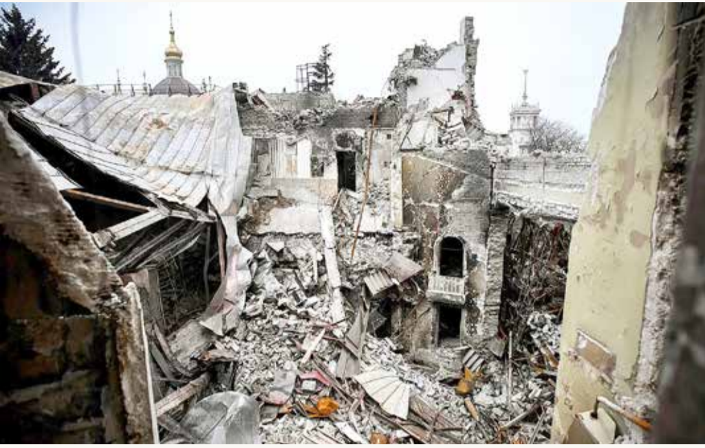
من آثار الدمار في مدينة ماريوبول الاستراتيجية