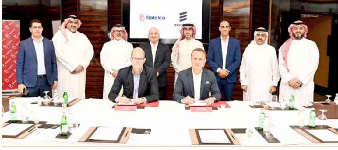
توقيع مذكرة التفاهم بين الجانبين

من جانبه، قال فويتشك باجدا، نائب الرئيس ورئيس منطقة دول مجلس التعاون الخليجي في إريكسون الشرق الأوسط وإفريقيا: “نحن متحمسون للعمل مع بتلكو واستكشاف تقنيات الجيل الخامس التي يمكن أن تطلق العديد من فرص النمو الرقمي. كما أننا واثقون بأن تعاوننا سيدعم بتلكو في تطوير نماذج أعمال جديدة وخلق عروض جديدة ومبتكرة في المملكة. ونحن ملتزمون تماماً بتقديم الدعم التقني لبتلكو في الاستجابة للتحديات المتزايدة في الشبكة وضمان إمكانية الوصول إلى اتصال سريع وموثوق في جميع أنحاء المملكة مع تنامي انتشار تقنيات الجيل الخامس فيها.”