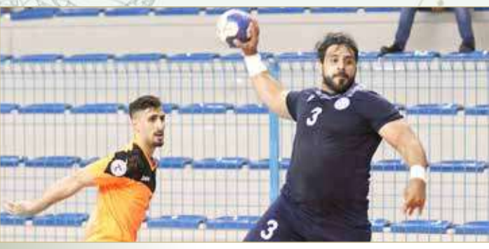
من لقاء النجمة والدير بكأس الاتحاد لكرة اليد