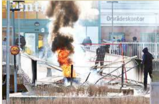
أعمال عنف وتخریب تصاحب تجمّعاً لليمين المتطرف في مالمو