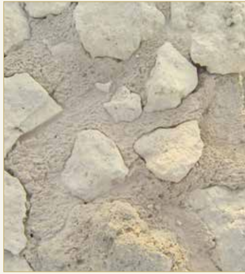
تآكل اسطح الجدران الأثرية بفعل التساقط القوي لمياه الامطار

وأضاف أنه بحسب التصريحات السابقة للمجلس الأعلى للبيئة ذكر بأن البحرين مُعرضة بشكل خاص لمخاطر التغيرات المناخية المرتبطة بارتفاع منسوب مياه البحر مع تكرار تعرض السواحل إلى الفيضانات بسبب الأمواج العالية. وعليه، فإن أي ارتفاع في منسوب مياه البحر مستقبلا يمكن أن يغير المواقع الأثرية القريبة من البحر مثل القلعة الساحلية الموجودة بموقع قلعة البحرين وقلعة أيوماهر فكلاهما يقع مباشرة بالقرب من ساحل البحر، أو الآثار الساحلية في جزر جوار.