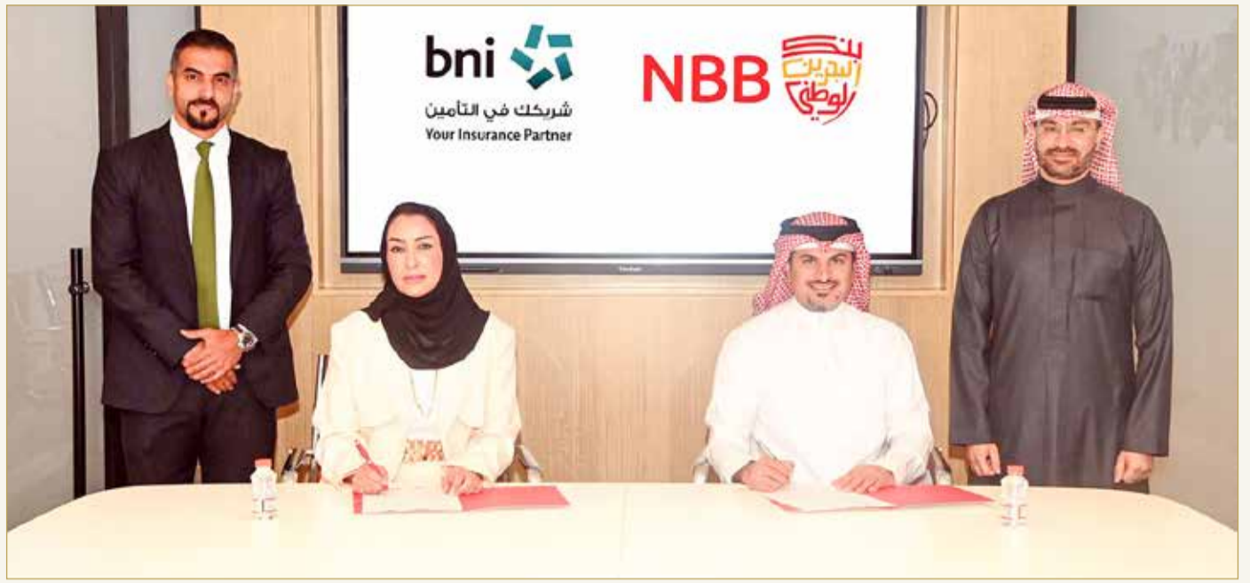
توقيع الشراكة بين الطرفين

أبرم بنك البحرين الوطني عقد شراكة مع شركة البحرين الوطنية للتأمين "bni" بهدف تقديم عروض تأمين حصرية للعملاء الراغبين في تملك وشراء السيارات، بما فيها السيارات الكهربائية، إذ تأتي هذه الخطوة كجزء من العروض الحصرية المقدمة من قبل البنك لقروض السيارات.