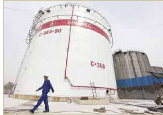
إيران صدّرت نفطاً إلى الصين بقيمة 22 مليار دولار العام الماضي

وأفاد تقرير نشرته صحيفة "واشنطن فيري بيكون" بأن إيران نجحت منذ العام 2021 في تصدير ما قيمته 22 مليار دولار من