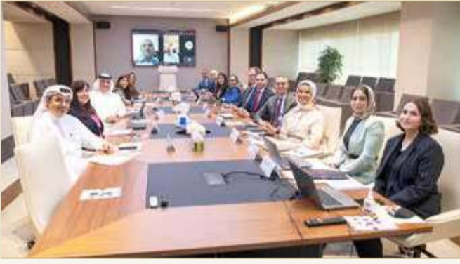
الاجتماع الأول لمجلس إدارة "تمكين" 2022

عقد مجلس إدارة صندوق العمل (تمكين) اجتماعه الأول للعام 2022؛ وذلك للاطلاع على سير العمل وتنفيذ الإستراتيجية وحزمة البرامج الجديدة خلال الربع الأول من العام الجاري. وقال رئيس مجلس إدارة "تمكين"، الشيخ محمد بن عيسى آل خليفة "نؤكد على أهمية الدور المحوري لـ (تمكين) في دعم الاقتصاد ونفخر بإنجازات الكبيرة التي ساهمت بها (تمكين) على مدى الخمس عشرة سنة الماضية".