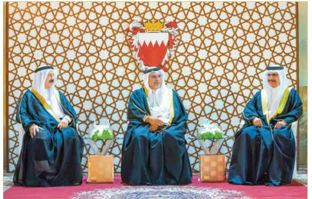
سمو ولي العهد رئيس مجلس الوزراء مستقبلاً عددًا من المواطنين من أصحاب المجالس الرمضانية

جاء ذلك لدى استقبال سموه في قصر الرفاع أمس، بحضور سمو الشيخ محمد بن سلمان بن حمد آل خليفة وعدد من كبار المسؤولين، عددًا من المواطنين من أصحاب المجالس الرمضانية، حيث تبادل سموه معهم التهانئ بمناسبة شهر رمضان المبارك. (02)