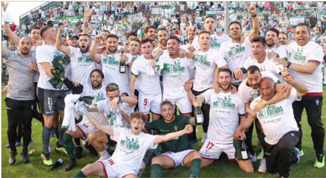
لقطات لفرحة لاعبي وجماهير الفريق