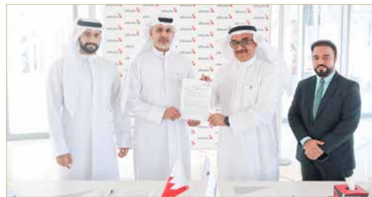
توقيع مذكرة التفاهم

من كبار المسؤولين من كلا الطرفين. وصرح نائب الرئيس التنفيذي لبنك البركة، طارق كاظم "نحن في بنك البركة، نسعى على الدوام بجهود