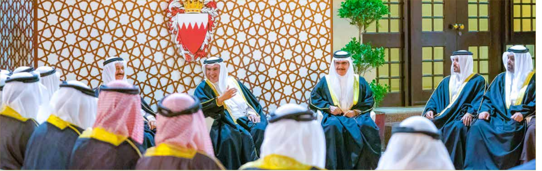
سمو ولي العهد رئيس مجلس الوزراء يستقبل عددًا من المواطنين من أصحاب المجالس الرمضانية