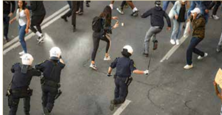
اشتبكات اندلعت خلال تظاهرات احتجاجية

وأثارت هذه الأحداث رد فعل عربية واسع مندد، حيث دانت دول الخليج العربي بشدة هذا الفعل الشنيع، واستدعت وزارة الخارجية العراقية، القائم بالأعمال السويدي في بغداد، وأبلغته احتجاجها على حرق القرآن بحماية من الشرطة السويدية، محذرة من أن هذه القضية قد تكون لها "تداعيات خطيرة" على العلاقات بين