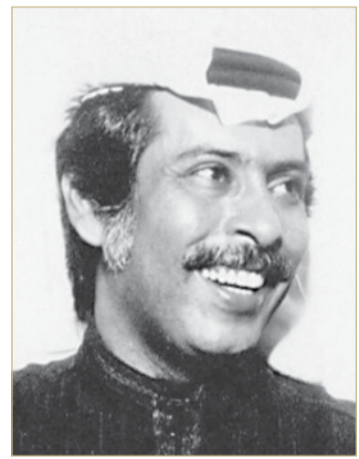
الرشود أخذني معه إلى الإمارات