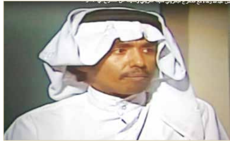
أحد الأعمال الفنية

« ما أكثر بلد تحب السفر إليه؟ مدينة بوكت بتايلند.. إذ إنني كتبت ثلاث روايات وديوان شعر هناك، فجمال الطبيعة والهدوء تشجع على الكتابة وكذلك الاسترخاء.