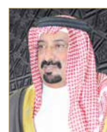
الشيخ أحمد بن علي

أعلنت "زين البحرين" عن نتائجها المالية للأشهر الثلاثة المنتهية بتاريخ 31 مارس 2022 مسجلة صافي أرباح قدرها 1.574 مليون دينار بحريني بنمو نسبته 3% على أساس سنوي مقارنة بـ 1.527 مليون دينار بحريني في الربع الأول 2021، وظلت ربحية السهم ثابتة عند 4 فلوس. (23)