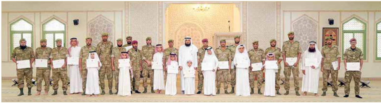
الهاجري يهنئ الفائزين بمسابقة سمو رئيس الحرس الوطني لحفظ القرآن الكريم وتجويد