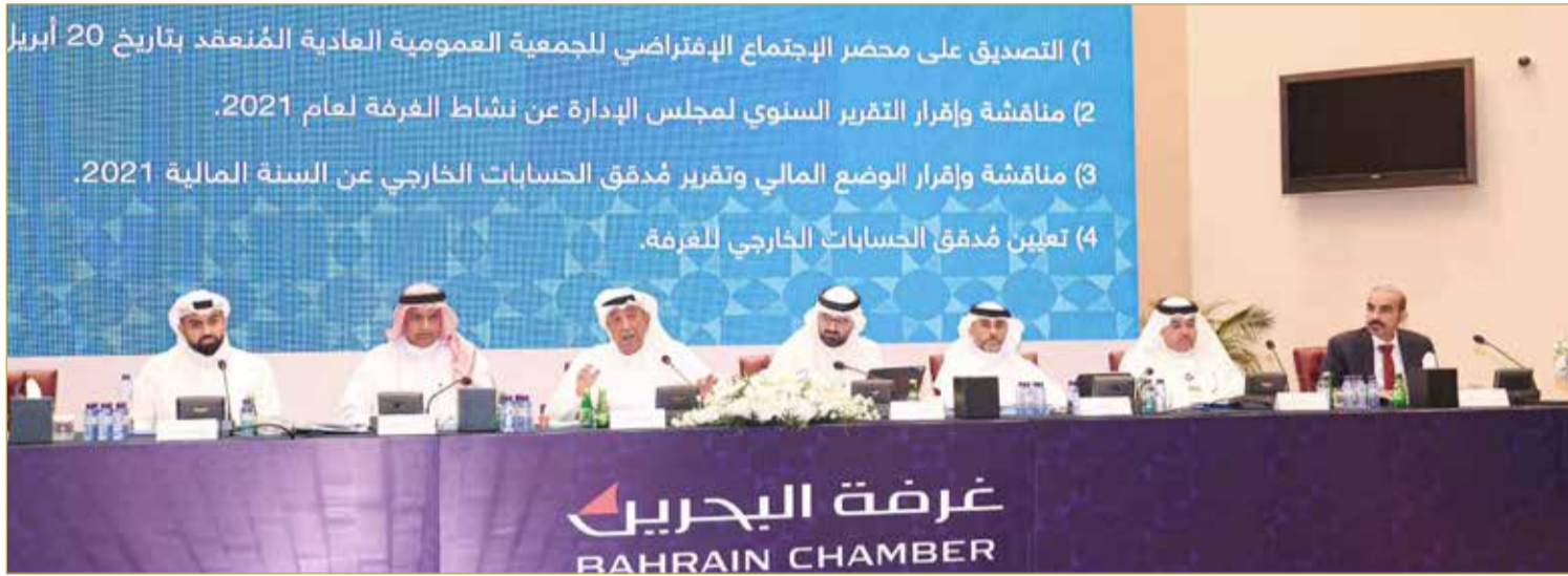
جانب من اجتماع ”عمومية“ غرفة تجارة وصناعة البحرين

وفي كلمة له أمام الأعضاء قال ناس إن الغرفة عازمة على المضي قدماً للبناء على ما تحقق من إنجازات في الدورة الماضية، حيث عملت في السنوات الماضية على استمرارية الأعمال