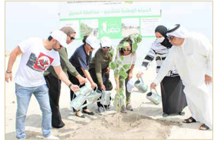
بنما - بنما

الزراعي، بالتعاون مع وزارة الأشغال وشؤون البلديات والتخطيط العمراني، والمجلس الأعلى للبيئة، بتشجير شارع الشيخ خليفة بن سلمان المؤدى لميناء خليفة، بغرس 240 شجرة من أشجار النيم والهيسكس تيلياسوس على مسافة 1000 متر طولي، وذلك بدعم كريم من بنك ستاندرد تشارترد البحرين. وبذلك يكون قد تم إكمال تشجير المواقع المقررة ضمن المرحلة الأولى للحملة الوطنية للتشجير (دمت خضراء)، في