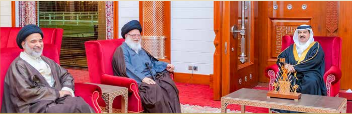
جلالة الملك المفدى يستقبل سماحة السيد عبدالله الغريفي

يرسخ عزتها ويديم قوتها ويحفظ حقوقها ويحقق أسباب المنعة والعنوان الحقيقي للأخوة الإنسانية المستمدة من المنهج الإسلامي القويم القائم على الرحمة والتسامح وقبول الآخر. وأثنى جلالته، على جهود سماحة السيد عبدالله الغريفي في بحوثه الدينية والإرشادية، مؤكداً أن رجال الدين بمملكة البحرين هم القدوة والمثل في الدين والخلق والخطاب الراشد المستنير، لأنهم يسهمون في النهوض ببناء أوطانهم ويسعون إلى ترسيخ مفاهيم الخير والسلام والمحبة ببصيرة الحكمة ورشد الموعدة الحسنة.