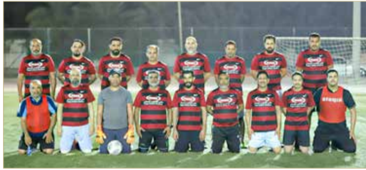
فريق هابي مفاجأة الدورة

يسدل الستار مساء يوم الثلاثاء على بطولة فئة المتقاعدين بدورة مركز تمكين شباب الهمة لكرة القدم بقاء يجمع فريق نعمانكو بطل نسخة 2015م و2016م ووصيف النسخة 2018م و2019م الماضية، وفريق هابي مفاجأة الدورة في مباراة يتوقع لها أن تتميز بحضور جماهير كبيرة من أبناء القرية وأعضاء المركز، بالإضافة إلى جميع إداريين ولاعبين المركز ونادي الهمة السابقين سواء المشاركين والمتابعين لهذه الدورة خاصة أنها تضم بعض الكبار ولاعبين نادي الهمة السابقين، كما أنها تضم مجموعة من اللاعبين المنقطعين عن ممارسة اللعب والرياضة.