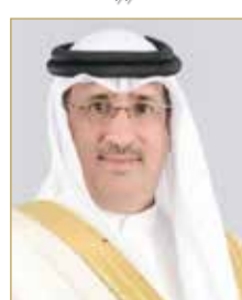
الشيخ محمد بن عيسى

أعلن صندوق العمل (تمكين) عن حصوله جائزة التميز في التواصل مع العملاء لسنة 2021 ضمن النظام الوطني للمقترحات والشكاوى "تواصل" 2021 في حفل التكريم الذي أقيم برعاية كريمة من ولي العهد رئيس مجلس الوزراء صاحب السمو الملكي الأمير سلمان بن حمد آل خليفة لتكريم الجهات الحكومية التي تميزت في العام الماضي. (05)