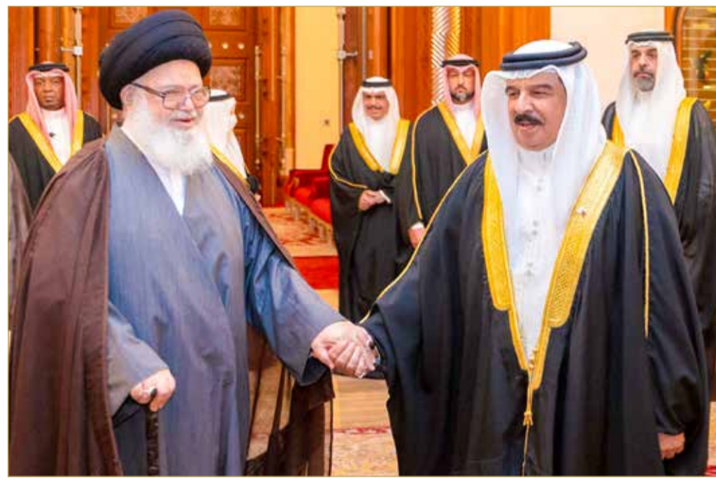
جلالة الملك يستقبل سماحة السيد عبدالله الغريفي

استقبل عاهل البلاد صاحب الجلالة الملك حمد بن عيسى آل خليفة، بقصر الصافية أمس، سماحة السيد عبدالله الغريفي حيث قدم لجلالته أطيب التهاني والتبريكات بمناسبة شهر رمضان الكريم، ضارعاً إلى المولى سبحانه وتعالى أن يحفظ جلالتهم ويعيد هذه المناسبة المباركة على جلالتهم بدوام الصحة والعافية، وعلى مملكة البحرين وشعبها بمزيد من التقدم والازدهار. وأثنى جلالتهم، على جهود سماحة السيد عبدالله الغريفي في بحوثه الدينية والإرشادية، مؤكداً أن رجال الدين بملكية البحرين هم القدوة والمثل في الدين والخلق والخطاب الراشد المستنير، لأنهم يسهمون في النهوض ببناء أوطانهم ويسعون إلى ترسيخ مفاهيم الخير والسلام والمحبة ببصيرة الحكمة ورشد الموعظة الحسنة.