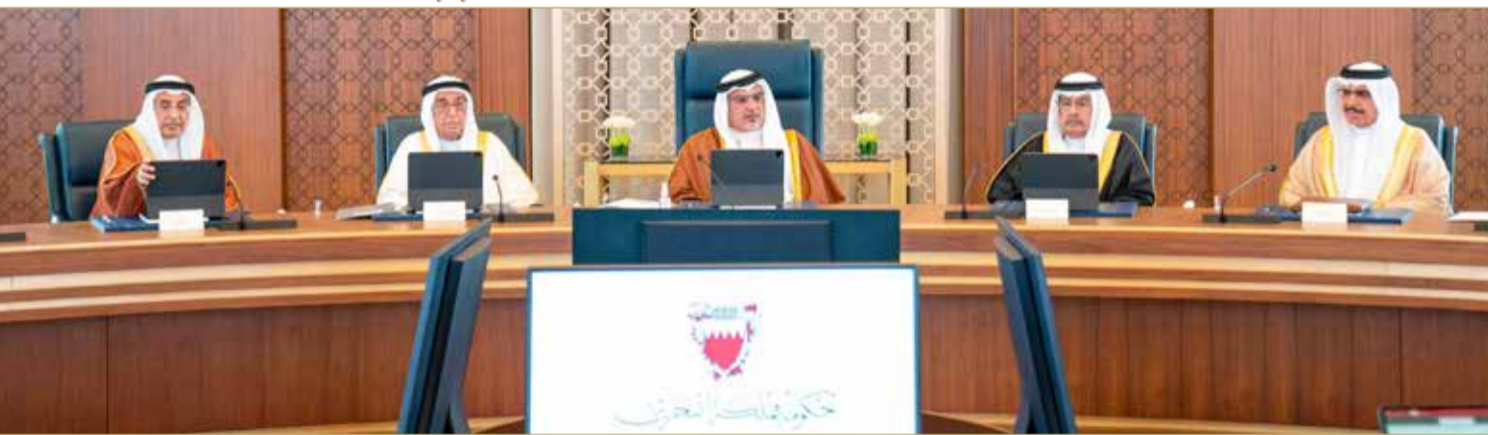
سمو ولي العهد رئيس مجلس الوزراء يترأس الاجتماع الاعتيادي الأسبوعي لمجلس الوزراء

أمر ولي العهد رئيس مجلس الوزراء صاحب السمو الملكي الأمير سلمان بن حمد آل خليفة بمباشرة صرف الزيادة بمعاشات المتقاعدين بأثر رجعي للعام 2021 وحتى أبريل من العام 2022 وإدخالها في حساباتهم المصرفية بتاريخ 20 أبريل 2022 بالتزامن مع موعد صرف المعاشات التقاعدية، وذلك في إطار الإصلاحات على أنظمة التقاعد والتأمين الاجتماعي بما يسهم في التغلب على التحديات التي تواجه الصناديق التقاعدية ويكفل استدامتها حفاظاً على حقوق المتقاعدين والمشاركين، وكلف سموه وزارة المالية والاقتصاد الوطني بالتنسيق مع الهيئة العامة للتأمين الاجتماعي لمباشرة التنفيذ. وترأس صاحب السمو الملكي ولي العهد رئيس مجلس الوزراء، الاجتماع الاعتيادي الأسبوعي لمجلس الوزراء الذي عقد أمس، بقصر القضيبي.