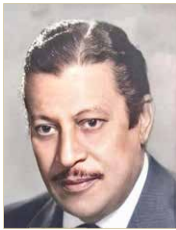
أحب تمثيل عماد حمدي