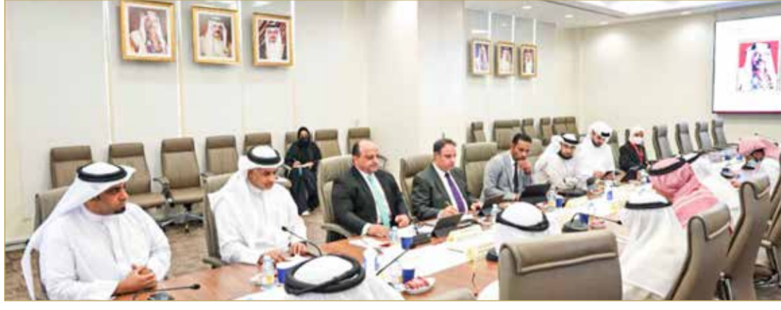
جانب من اجتماعات لجنة التحقيق

وقال ممثلو الإدارة إن الإدارة أسندت على لجنة الشؤون القانونية في كل مكتب أمر متابعة حالات المستأجرين المتخلفين والمتعثرين. وبينوا أن قضية إعدام المبالغ المتأخرة خاضعة لإجراءات محاسبية بناء على توصية من المدقق الخارجي، فضلاً عن