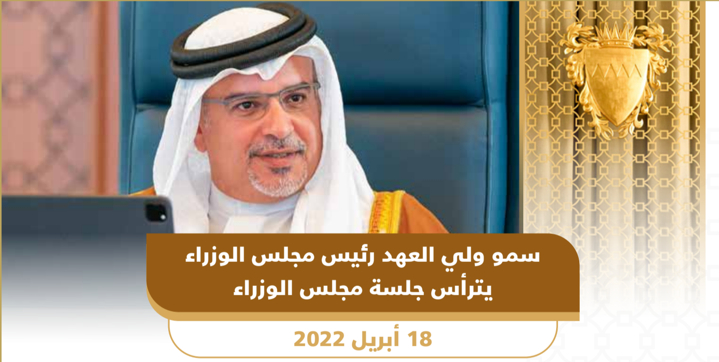
سمو ولي العهد رئيس مجلس الوزراء يتأخرس جلسة مجلس الوزراء