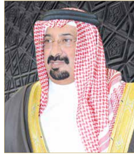
الشيخ أحمد بن علي آل خليفة

أعلنت زين البحرين عن نتائجها المالية للأشهر الثلاثة المنتهية بتاريخ 31 مارس 2022 مسجلة صافي أرباح قدرها 1.574 مليون دينار بحريني بنمو نسبتته 3% على أساس سنوي مقارنة بـ 1.527 مليون دينار بحريني في الربع الأول 2021، وظلت ربحية السهم ثابتة عند 4 فلوس.