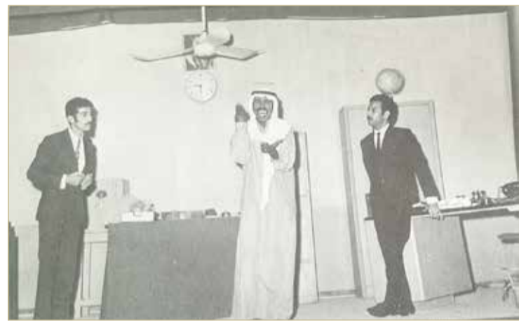
قبل التحدي ومثلت لأول مرة في كرسي عتيق