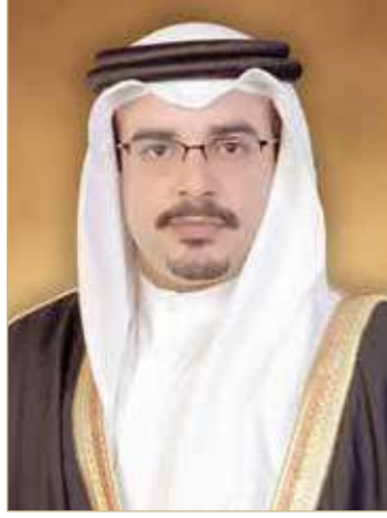
سمو ولي العهد رئيس مجلس الوزراء