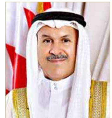
الشيخ هشام بن عبدالرحمن

قائمة أولوياتها. وأكد أن التواصل الإلكتروني المباشر مع العملاء، له أثر إيجابي على جودة الخدمات وفاعليتها وسرعتها، ويساهم كثيراً في رفع سقف الإنتاجية لما يوفره من اختصار للوقت والجهد، لافتاً إلى أن نظام (تواصل) يسهم في الارتقاء بالخدمات الحكومية بشكل عام. وكانت شؤون الجنسية والجوازات والإقامة، قد انضمت إلى النظام الوطني للمقترحات والشكاوى (تواصل) في نوفمبر 2020، وذلك لتعزيز التواصل مع الجمهور والمستفيدين، عبر توفير قناة إلكترونية للتعامل المباشر بصورة ميسرة وسريعة، تماشياً مع خطتها الاستراتيجية للتحويل الإلكتروني لجميع خدماتها.