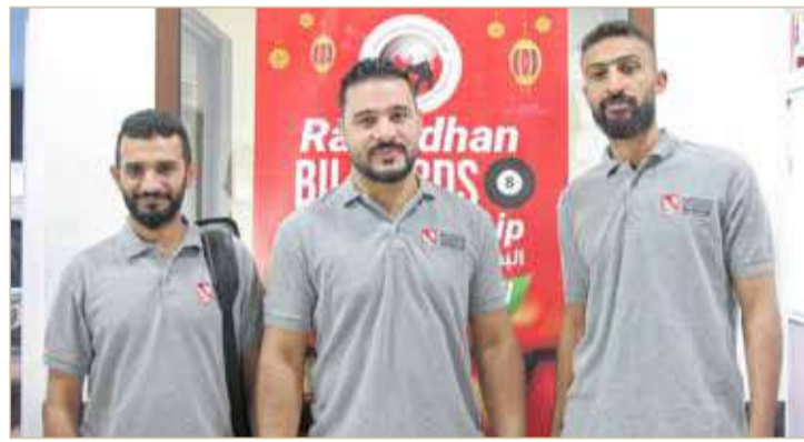
فريق الجامعة البريطانية