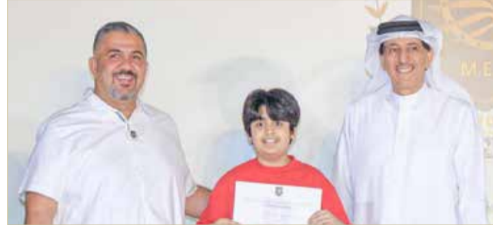
لفطات من التكريم