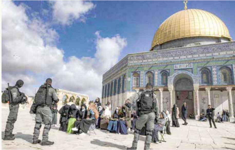
مخاوف من تصاعد التوتر في المسجد الاقصى

وصفت منظمة العفو الدولية إسرائيل بأنها دولة "فصل عنصري"، مشيرة إلى أن أعمال القتل والتعذيب التي تمارسها إسرائيل بحق الفلسطينيين