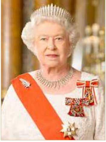
الملكة إليزابيث الثانية