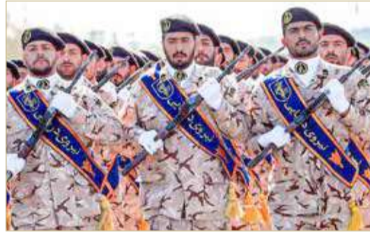
تدخلات الحرس الثوري في المنطقة تثير مخاوف واشنطن

من جهتهم، أكد المسؤولون الإيرانيون الاقتراح في الأيام الأخيرة، مما أثار غضب قادة السياسة الخارجية الجمهوريين،