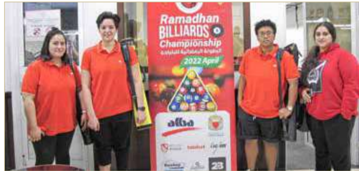
منتخب النساء للبيارد