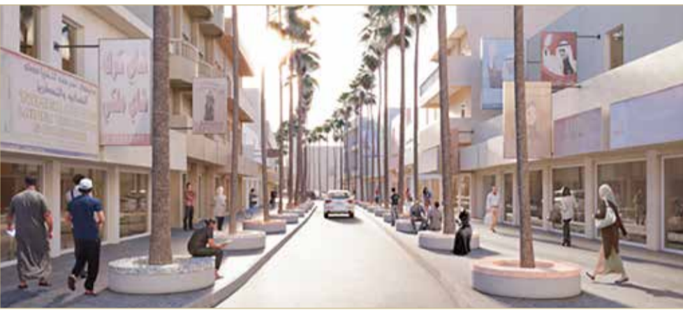
رسم تخيلي لمشروع تطوير شارع الشيخ حمد

قطاع الطرق مع المعنيين من قسم المنتزهات والحدائق في بلدية المرحق لإعداد مقترح الري والتوصيلات اللازمة للمشروع.