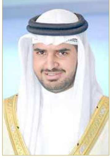
سمو الشيخ عيسى بن علي

بما يعزز من مكانة الرياضة البحرينية وسمعتها المتميزة على المستوى الخليجي معربين عن أملنا في تقديم الصورة الرائعة عن مملكتنا والظهور المشرف لرياضتنا بما يتواءم مع الطفرة الرياضية الكبيرة التي تعيشها المملكة في العهد الزاهر لجلالة الملك حفظه الله ورعاها...".