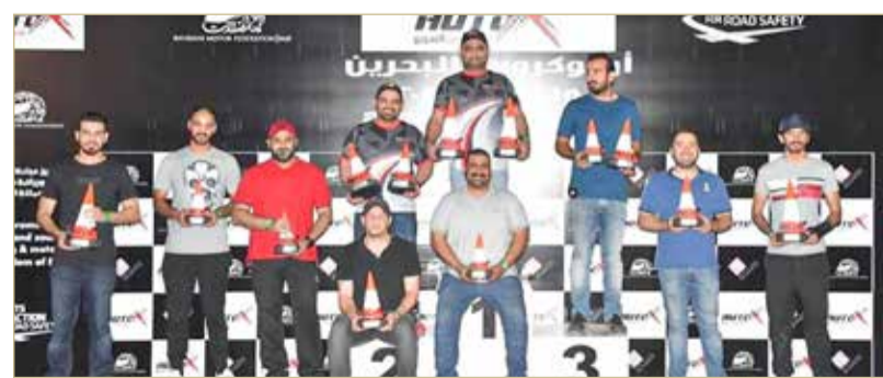
المتسابقون الفائزون في صورة جماعية

وأعلنت لجنة أوتوكروس والدريفت عن استمرارية التسجيل حتى هذا اليوم الخميس الموافق 21 من أبريل الجاري عبر الرابط linktr.ee/BahrainDrift- Championship؛ ليتسنى للقاتمين على البطولة بحصر أسماء وأعداد المتسابقين للمشاركة في المنافسات مساء يوم غد، ومن المقرر أن يبدأ الفحص الفني للسيارات المشاركة اليوم الخميس الموافق 21 من شهر أبريل الجاري بحلبة البحرين الدولية من الساعة 7.30 وحتى 8.30 مساءً، جولة حول المضمار وبريفغ المتسابقين بعدها، وعند الساعة 10.45 تنطلق أولى الجولات في المضمار.