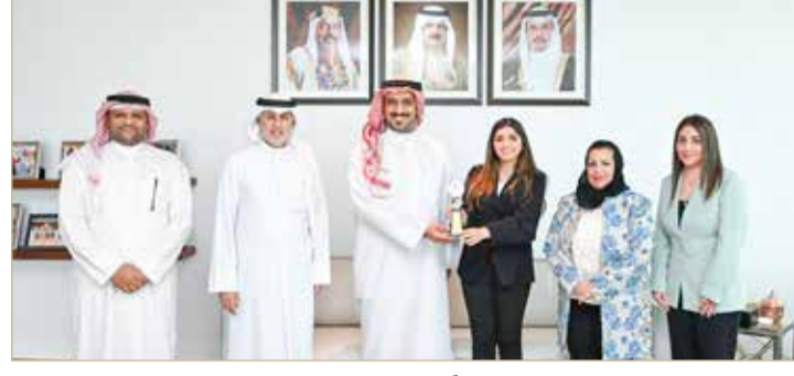
الزياني مستقبلاً الفريق الإداري لـ "تواصل"

أعرب وزير الصناعة والتجارة والسياحة، زايد بن راشد الزياني، عن بالغ سعاده واعتزازه وفخره بالجهد المبذول لمواصلة تطوير الأداء ورفع مستوى الكفاءة الإدارية من خلال الخدمات التي تقدمها الوزارة تحقيقاً لرؤى وتطلعات أهل البلاد حضرة صاحب الجلالة الملك حمد بن عيسى آل خليفة، وتعكس الثقة الكبيرة لفريق البحرين برئاسة صاحب السمو الملكي الأمير سلمان بن حمد آل خليفة ولي العهد رئيس مجلس الوزراء من خلال تقديم أفضل الخدمات الحكومية للمواطنين والمقيمين. جاء ذلك بعد تفضل صاحب السمو الملكي الأمير سلمان بن حمد آل خليفة ولي العهد رئيس مجلس الوزراء بتكريم وزارة الصناعة والتجارة والسياحة ضمن الجهات الحكومية الفائزة بجائزة التميز في التواصل مع العملاء للعام 2021 للمرة الخامسة على التوالي، وذلك بعد أن حصلت الوزارة على جائزة التميز في الأداء بالنظام الوطني للمقترحات والشكاوى (تواصل) بنسبة بلغت 100% من مؤشرات قياس الأداء.