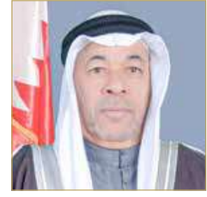
عبد اللطيف السكران

نقل القنصل العام لملكة البحرين في النجف، معربين عن تمنياتهم له بالتوفيق في مهامه القنصلية، ولملكة البحرين دوام الأمن والتقدم والازدهار في ظل المسيرة التنموية الشاملة لصاحب الجلالة الملك.