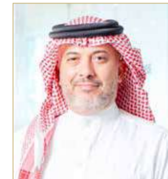
الشيخ خليفة بن إبراهيم

تقدم الرئيس التنفيذي لبورصة البحرين، الشيخ خليفة بن إبراهيم آل خليفة، ببالغ الشكر والاعتزاز إلى ولي العهد رئيس مجلس الوزراء صاحب السمو الملكي الأمير سلمان بن حمد آل خليفة وليفضل سموه بتكريم بورصة البحرين ضمن الجهات الحكومية الفائزة بجائزة التميز في التواصل مع العملاء لعام 2021 ضمن النظام الوطني للاقتراحات والشكاوى "تواصل"، وذلك للعام الثاني على التوالي.