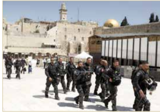
قوات إسرائيلية في باحة المسجد الأقصى

من جانبها، أعلنت حركة حماس التي تسيطر على غزة أنها أطلقت صواريخ أرض جو على طائرات حربية إسرائيلية. وجاء هذا التصعيد بعد نحو شهر من التوتر في المسجد الأقصى ومحيطه في القدس الشرقية المحتلة. وتركز التوتر في القدس في محيط المسجد الأقصى احتجاجا على ما يقوم به يهود بيهم مستوطنون من "زيارات" لباحات المسجد تتم في أوقات محددة وضمن شروط.