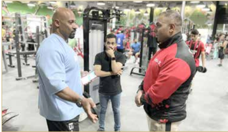
الحداد مقدماً الدرع التذكارية للشيخ

وفي ختام الزيارة قدم رئيس اتحاد كمال الأجسام درعاً تذكاريًا لصاحب صالة سوات؛ تقديراً لما يقدمه شخصياً وتقدمه الصالة عموماً لرياضة كمال الأجسام واللاعبين.