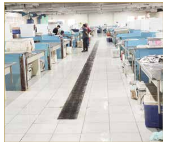
خلو سوق السمك من المربادين أمس