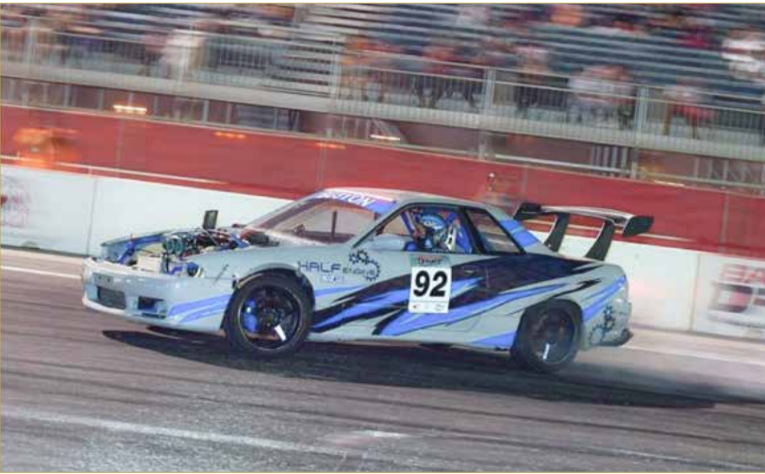
من منافسات الجولة الماضية

البحريني للسيارات من خلال لجنة الأوتوكروس والدريفت.