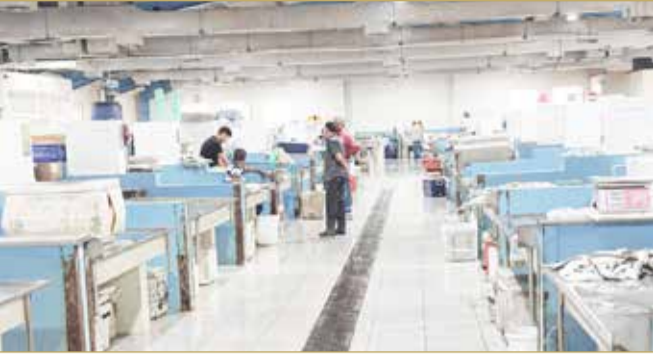
خلو سوق السمك من المرشدين أمس