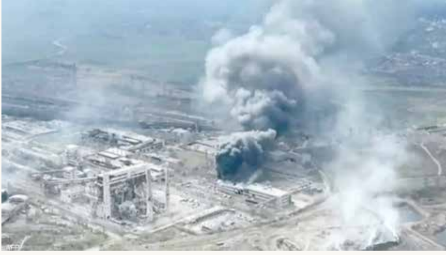
صورة جوية تظهر حجم الدمار في محيط مصنع آزوفستال بماريوبول

أعلنت الخارجية الروسية أمس الخميس عن فرض