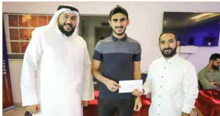
الفائزون بجوائز الجمهور