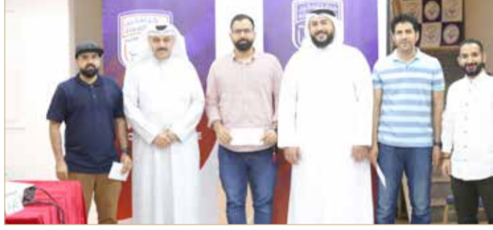
تكريم بطل المسابقة