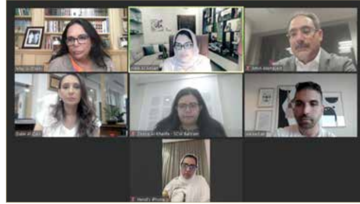
الأمين العام للمجلس الأعلى للمرأة تعقد اجتماع عمل مع بنك البحرين للتنمية وشركة ادمام ومياسم حول مركز ريادات

مركز "ريادات" واستقطاب مجموعة جديدة من المستأجرين، إضافة إلى الجهود المبذولة على صعيد التسويق والترويج للمركز، وتطوير خدماته اللوجستية، كما تم استعراض جوانب من مراحل العمل خلال الفترة القادمة. ونوهت بجهود الجميع، مؤكدة على استمرار دعم المجلس لما يتم بذله لتطوير عمل المركز وتحقيق أهدافه، وفي مقدمتها دعم رائدات الأعمال البحرينية للاستفادة من الفرص الاقتصادية المتاحة على المستوى الوطني وتحفيزهن على الابتكار والإبداع والتميز.