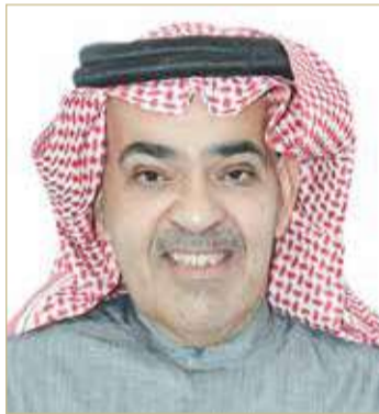
الشيخ صباح بن حمد