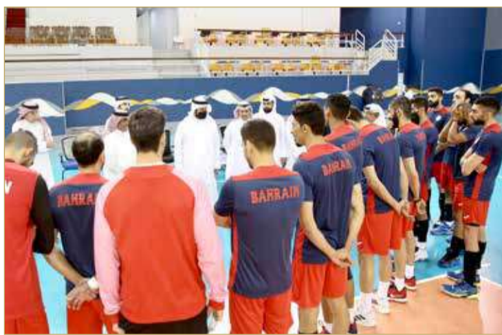
سمو الشيخ عيسى بن علي يلتقي لاعبي الطائرة

الزعبي، ومدير منتخب الصالات راند بابا. وشهد سموه تدريبات منتخب كرة القدم للصالات ونوه بالمكانة المتميزة لمنتخب الرجال والذي حقق العديد من الإنجازات الرائعة كان آخرها التأهل لنهائيات كأس آسيا 2022 لتكون دورة الألعاب الخليجية محطة مهمة للمنافسة والتحضير للاستحقاق الآسيوي القادم، مؤكداً سموه أهمية مضاعفة الجهود وتقديم الصورة المشرفة؛ من أجل المنافسة على اللقب الخليجي في ظل القفزة الكبيرة التي تعيشها اللعبة والرعاية والاهتمام من الاتحاد البحريني لكرة القدم برئاسة الشيخ علي بن خليفة آل خليفة، معرباً عن أمله في أن تتكامل جميع تلك الجهود بتحقيق اللقب الخليجي والظفر بالميدالية الذهبية.