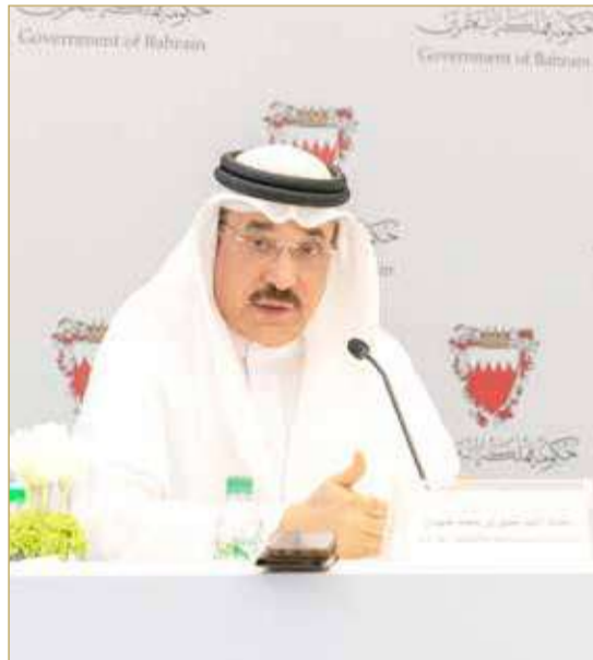
وزير العمل والتنمية الاجتماعية

قال وزير العمل والتنمية الاجتماعية جميل حميدان إنه تم في الأشهر الثلاثة الأولى من هذا العام تحقيق نمو في معدلات التوظيف بنسبة 32%، حيث تم توظيف 7740 بحرينياً في القطاع الخاص في الربع الأول من هذا العام، مقارنة بعدد 5856 في الربع الأول من العام الماضي. كما شهد الربع الأول من العام تدريب نحو 3722 باحثاً عن عمل مرتفعاً بنسبة 36% عن ذات الفترة من العام الماضي، والذي يعكس التحسن الملحوظ في مؤشرات الاقتصاد الوطني، والتي بدأت تصب في صالح تسريع وتيرة توظيف المواطنين وإدماج الأيدي العاملة الوطنية في القطاع الخاص في وظائف نوعية وجاذبة. كما شهد الربع الأول من العام 2022 زيادة مطردة في توظيف الجامعيين، حيث تم توظيف 2281 جامعياً من بين العدد الاجمالي للمتوظفين، بارتفاع نسبته 32% مقارنة بأعداد الجامعيين المتوظفين في العام الماضي. (02)