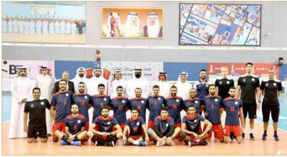
سموه يتوسط لاعبي منتخب الطائرة