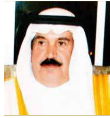
دعيج بن سلمان

للتطور عاقاً بعد عام، منوهاً بدوره كذلك للجهد الكبيرة التي يبذلها سمو الشيخ خالد بن حمد آل خليفة النائب الأول لرئيس المجلس الأعلى للشباب والرياضة رئيس الهيئة العامة للرياضة رئيس اللجنة الأولمبية البحرينية، في سبيل الدفع بعجلة التطوير وتوفير كافة الاحتياج لتحقيق ذلك.