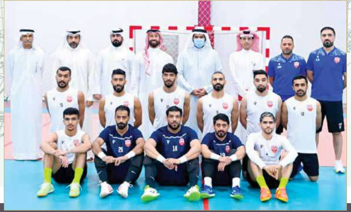
سمو الشيخ عيسى بن علي يتوسط منتخب الصالات لكرة القدم