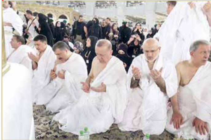
أردوغان أدى مناسك العمرة مع أعضاء الوفد التركي