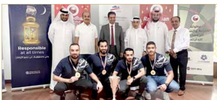
تكريم فريق وزارة الداخلية للسنوكر