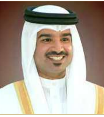
خليفة بن علي