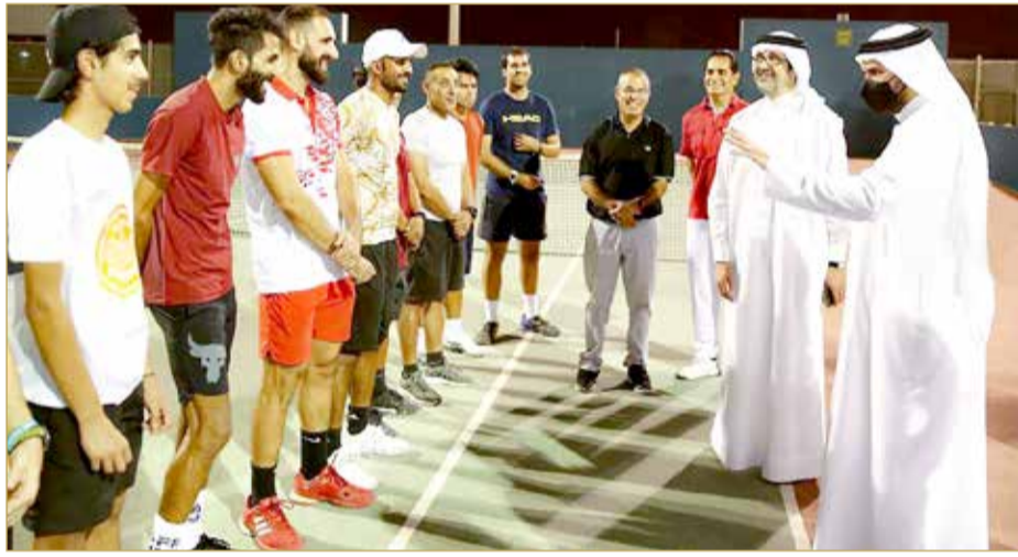
سموه يوجه كلمته للاعبين منتخب التنس الأرضي