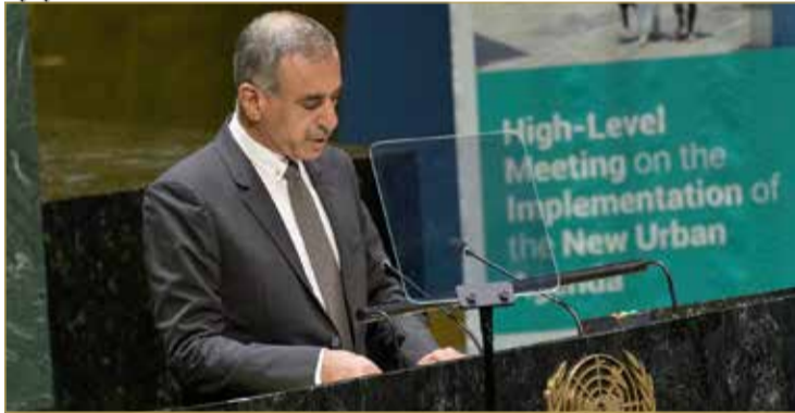
وزير الإسكان يترأس وفد البحرين في اجتماع الأمم المتحدة رفيع المستوى

استعرض وزير الإسكان أبرز نتائج تنفيذ الخطة الحضرية الجديدة وأهداف التنمية المستدامة 2030 الواردة في التقرير الطوعي الثاني بشأن تنفيذ الخطة الحضرية الجديدة الذي تقدمت به مملكة البحرين في نوفمبر 2021، حيث أشار إلى أن الحكومة قامت بإطلاق حزم مالية تجاوزت قيمتها 4.5 مليارات دينار بحريني لدعم الاقتصاد المحلي بمختلف مكوناته كاستجابة لتحديات جائحة كورونا، منوهاً إلى جهود المملكة خلال فترة الجائحة للمضي في تنفيذ أهداف التنمية المستدامة بالتوازي، في إطار التزامها الأممي بتنفيذ الخطة الحضرية الجديدة (NUA) والأجندة 2030.