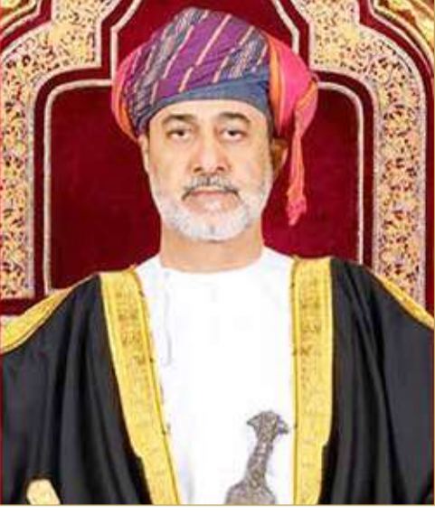
جلالة السلطان هيثم بن طارق آل سعيد