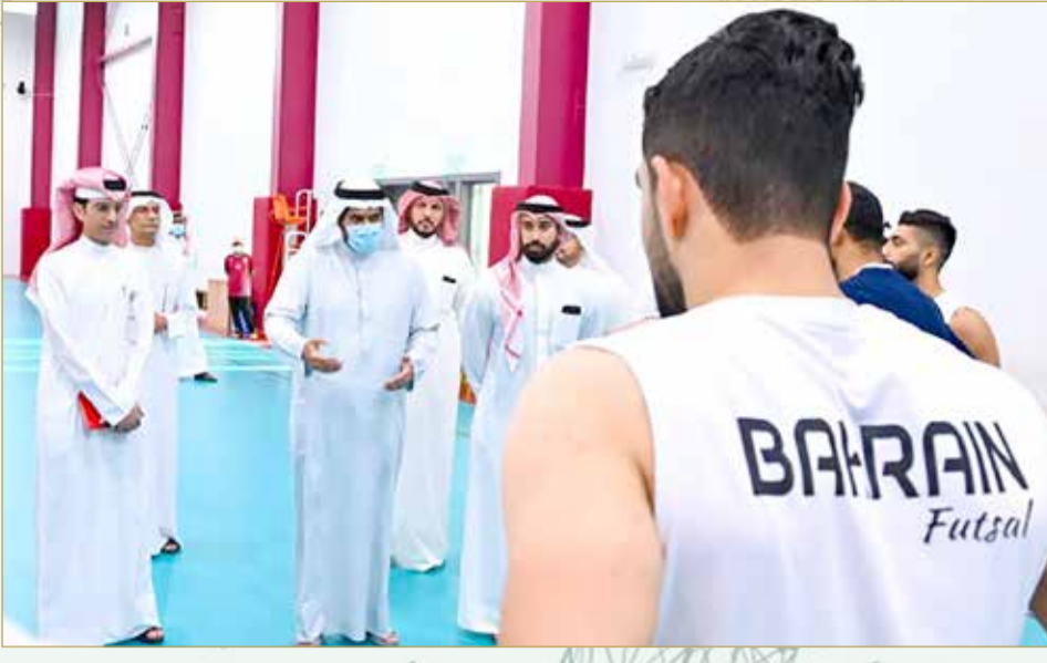
السبت 30 أبريل 2022 - 29 رمضان 1443 - العدد 4946