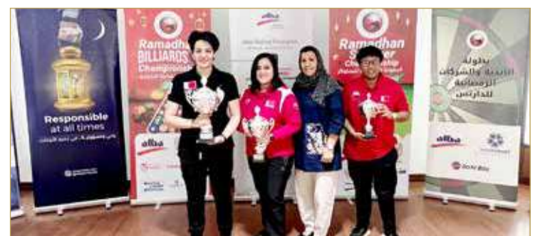
فريق سيدات البليارد