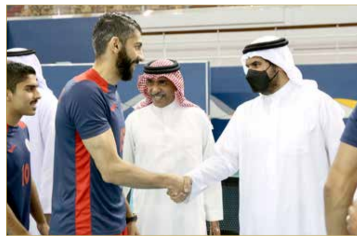
مبارك آل خليفة من دعم ورعاية للمنتخب لتحقيق أفضل النتائج المشرفة.