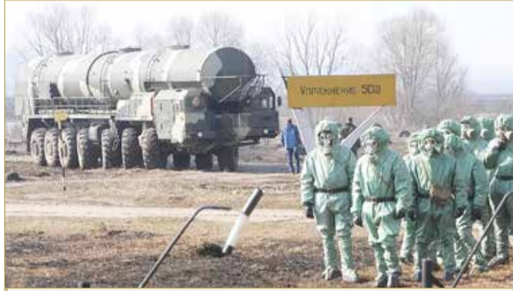
روسيا لوحث باستخدام سلاحها النووي خلال الحرب الأوكرانية

بليكن: العالم ما زال مهدداً بشبح "الكيمائي"