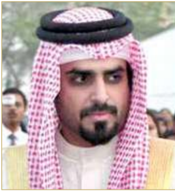
عبدالله بن خالد

كما وهنأ الشيخ عبدالله بن خالد آل خليفة رئيس نادي الرفاع ومجلس إدارته بمناسبة تحقيق الفريق الأول لقب دوري ناصر بن حمد الممتاز لكرة القدم، بعد إسدال الستار على الموسم في الجولة الختامية، مشيداً بالمستوى الفني الذي ظهر عليه فريق الرفاع وقاده للمحافظة على لقب دوري ناصر بن حمد الممتاز للعام الثاني على التوالي، مؤكداً أن ذلك