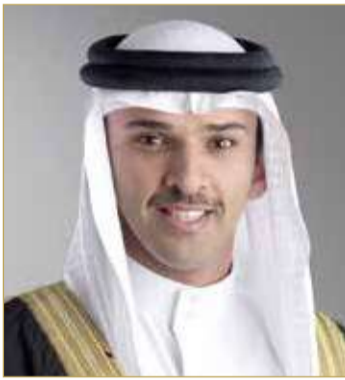
علي بن خليفة

خليفة في مواصلة السير على الخط التطويري الذي ينتهجه سموه دائماً، إذ يحرص الاتحاد على مواكبة الرؤى والأفكار التطويرية الكفيلة بارتقاء الكرة البحرينية بما يحقق تطلعات سموه في ازدهار الكرة البحرينية