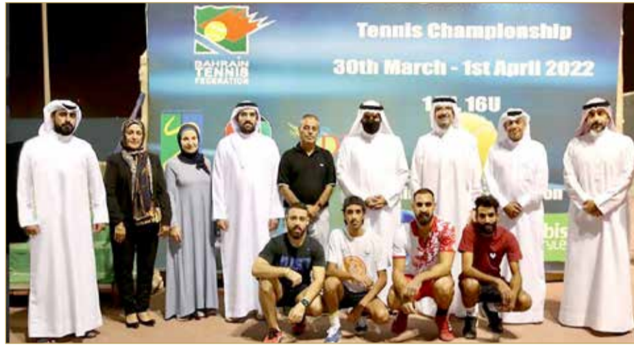
سموه أثناء زيارته منتخب التنس الأرضي