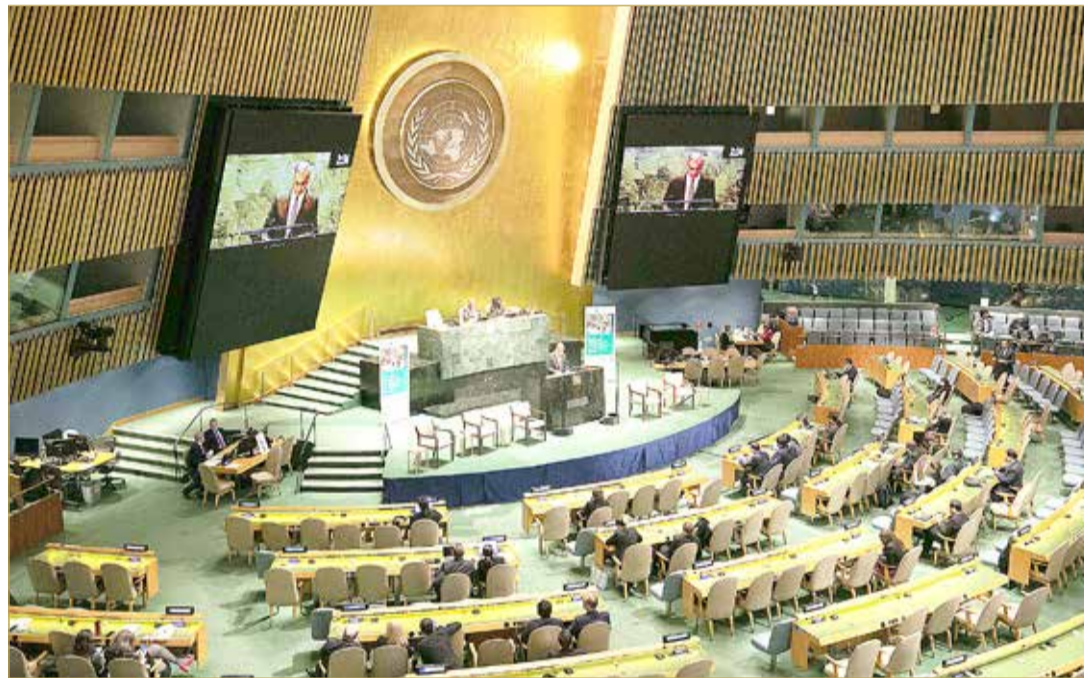
وزير الإسكان يترأس وفد البحرين في اجتماع الأمم المتحدة رفيع المستوى

أكد وزير الإسكان باسم بن يعقوب الحمير أن حجم البرامج والمبادرات والاستثمارات الحكومية التي أطلقتها حكومة مملكة البحرين في قطاع السكن الاجتماعي منذ تأسيس وزارة الإسكان قد بلغ 3.3 مليارات دينار، وأن تلك القيمة مرشحة للزيادة خلال السنوات المقبلة نتيجة لزيادة مبادرات الشراكة مع القطاع الخاص لتوفير السكن الاجتماعي للمواطنين. وأكد الوزير في كلمته أمام اجتماع الجمعية العمومية للأمم المتحدة رفيع المستوى المنعقد بمقر الأمم المتحدة في نيويورك، أن نسبة السكان الذين يعيشون تحت خط الفقر الدولي على المستوى الحضري الوطني 0%، وزيادة متوسط دخل الأسرة البحرينية بمعدل 47% في الفترة ما بين العامين 2008 و2016. (02)