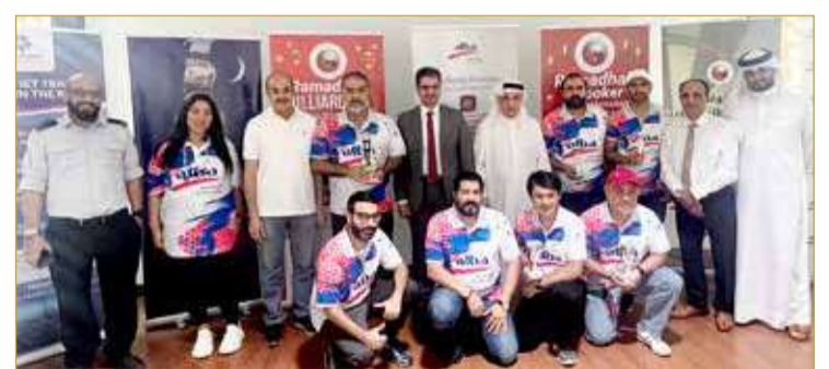
تكريم فريق ألبا للدارتس