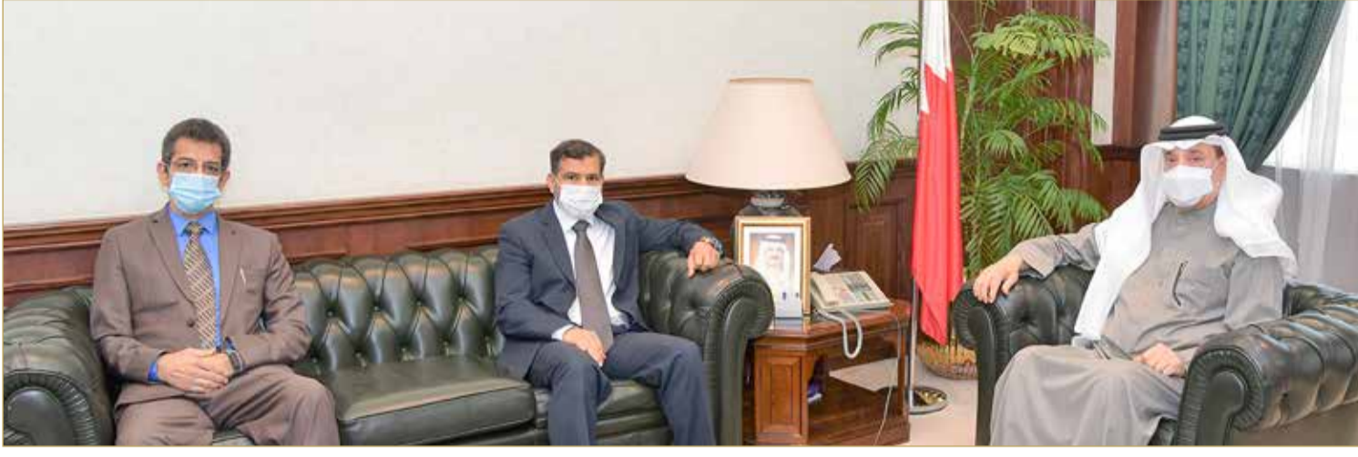
وزير العمل ملتقى الشهابي والحلواجي (صورة أرشيفية)