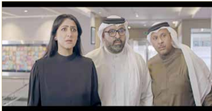
في مسلسل الرقوم