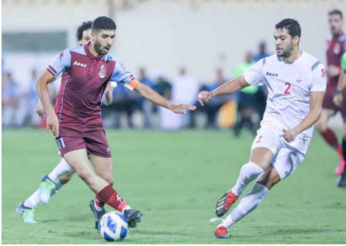
من مباريات الشباب في دوري الدرجة الثانية