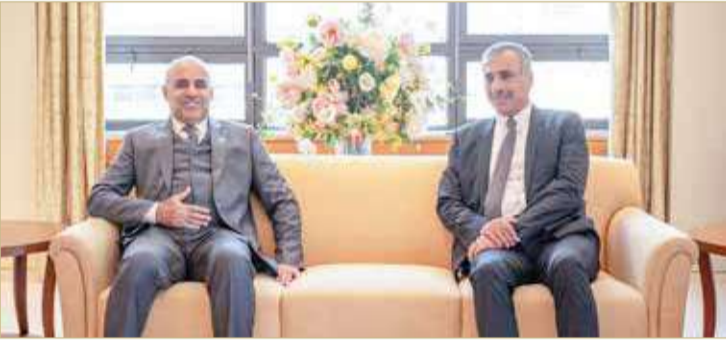
وزير الإسكان مع نظيره العماني

الثانية المبذولة من أجل تعزيز التعاون المشترك بين مملكة البحرين وسلطنة عمان.