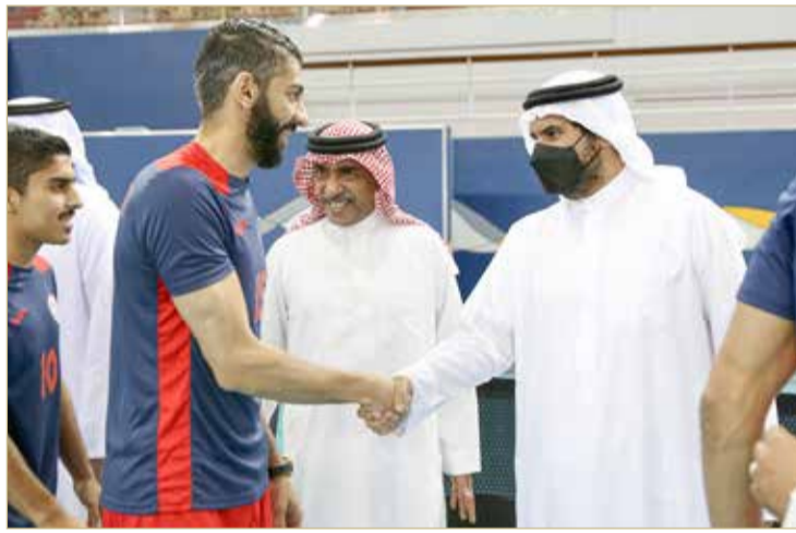
جانب من زيارة سموه منتخب الطائرة