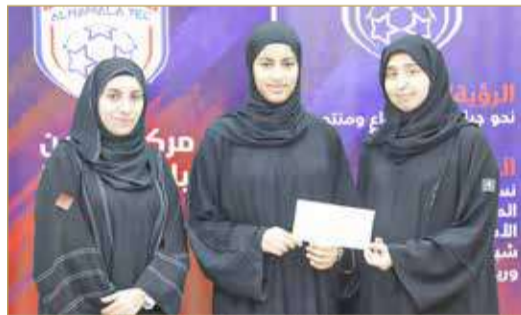
المسابقة الثقافية النسائية الرمضانية