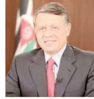
الملك عبدالله الثاني بن الحسين

جرى اتصال هاتفي أمس بين ملك البلاد صاحب الجلالة الملك حمد بن عيسى آل خليفة وملك المملكة الأردنية الهاشمية الشقيقة صاحب الجلالة الملك عبدالله الثاني بن الحسين.