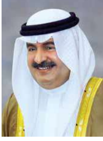
سمو الشيخ علي بن خليفة