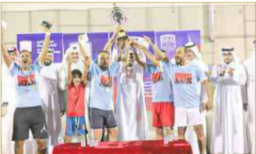
دورة فته الكبار