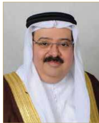
الشيخ نواف بن إبراهيم

شؤون الكهرباء والماء تقدر جهود العاملين في مختلف مجالات ونواحي عمل الهيئة والطاقة المتجددة، وأن ما تم تحقيقه من إنجازات في مجال البنية التحتية للكهرباء والماء جاء ثمرة سواعد العاملين في القطاع". بدوره، أكد الرئيس التنفيذي للهيئة الشيخ نواف بن إبراهيم