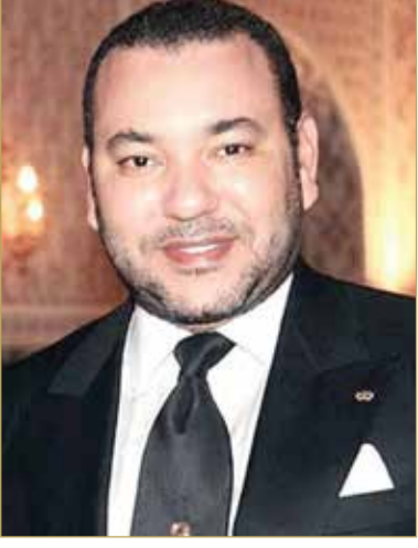
عاهل المملكة المغربية