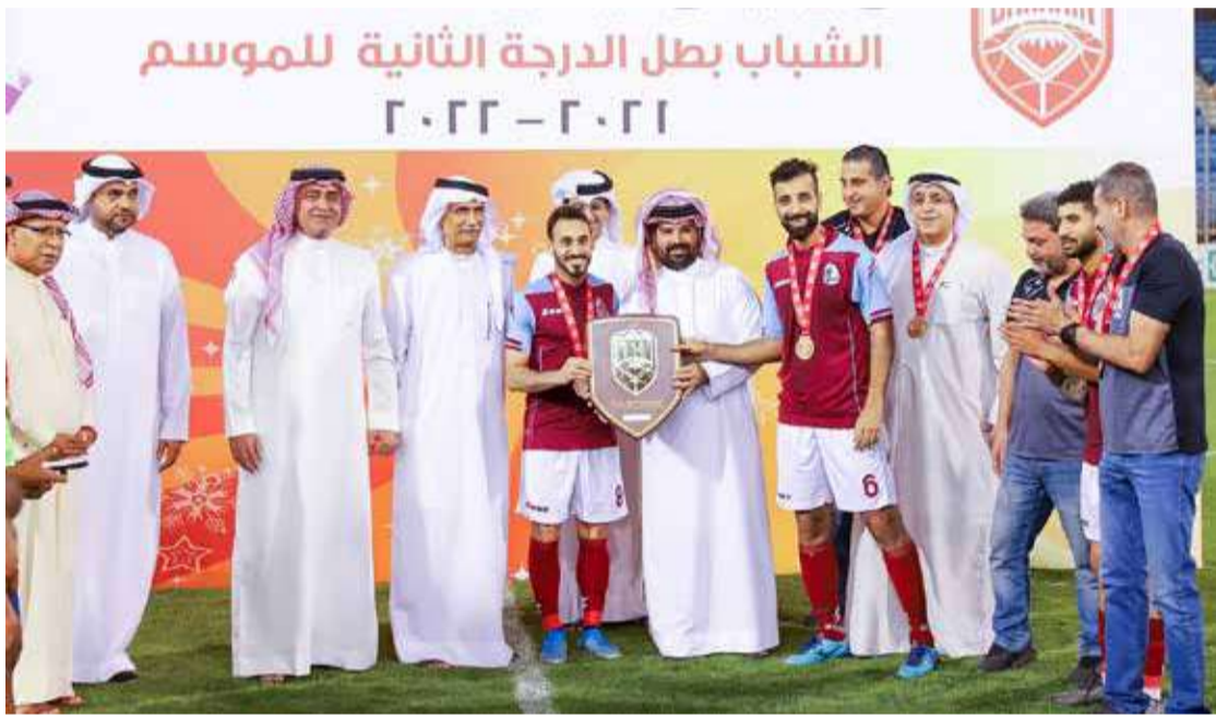
من تتويج الشباب بلقب دوري الدرجة الثانية

وبارك مظاهر لمجلس إدارة نادي الشباب وإلى الجهازين الفني