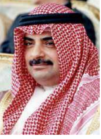
سمو الشيخ سلمان بن خليفة