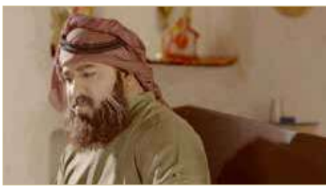
مسلسل عين الذيب

يذكر أن الفنان عقيل الماجد حقق الكثير من الجوائز منها جائزة أفضل ممثل "جائزة محمد هنيدي" في مهرجان شرم الشيخ الدولي للمسرح الشبابي في دورته الرابعة والتي أقيمت عام 2019 وذلك عن دوره في مسرحية "أكس أو" من إخراج حمزة العصفور وإنتاج مركز الشاخورة والتي سبق وأن شاركت في مهرجان خالد بن حمد للمسرح الشبابي، متفقاً على الكثير من الدول العربية والأجنبية المشاركة في المهرجان، وجائزة أفضل ممثل دور أول بمهرجان خالد بن حمد للمسرح الشبابي عن دوره في مسرحية "إكس أو" ويشغل حالياً منصب رئيس مجلس إدارة مسرح الريف.