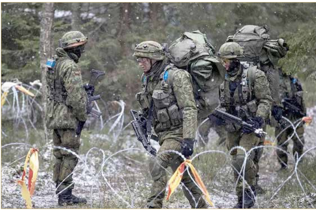
من تدريبات "الناتو" في ليتوانيا