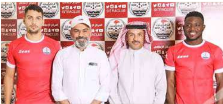
صورة جماعية بعد توقيع العقد

بن حمد الممتاز، ويهبط الرابع لدوري الدرجة الثانية. وحقق سترة المركز الثالث بدوري الدرجة الثانية بعدما قدم مستويات متميزة، ويأمل في الصعود من خلال الملحق.