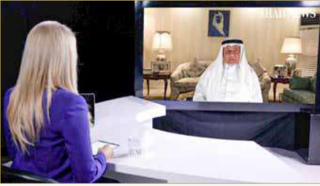
الأمير تركي الفيصل أثناء المقابلة مع موقع "عرب نيوز"