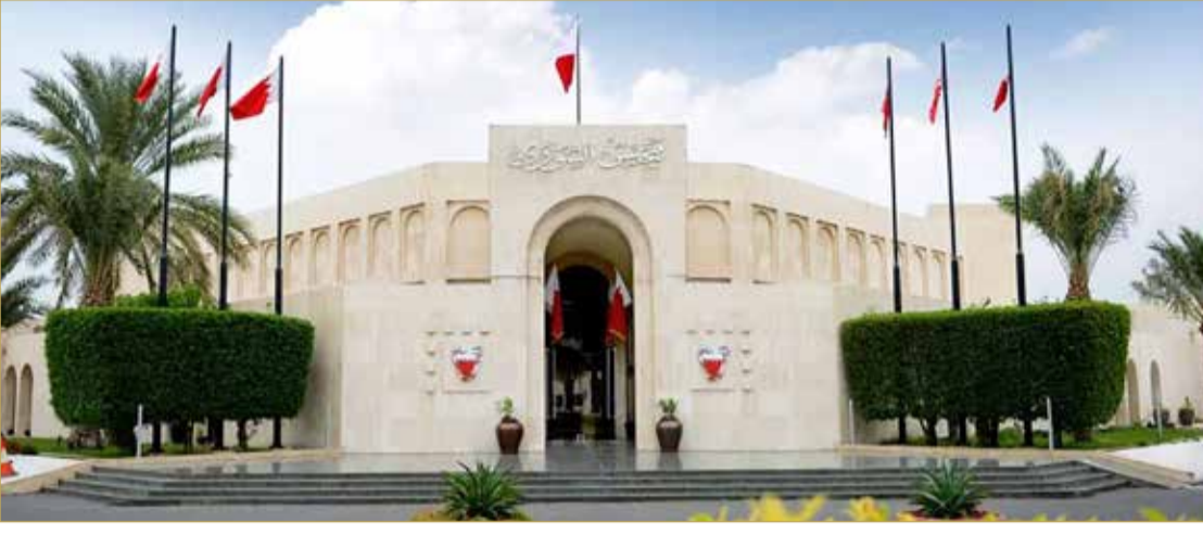
القضيبية - مجلس الشورى

أكد مجلس الشورى تقديره للدور الكبير والمكانة المرموقة التي حققتها الصحافة البحرينية باعتبارها مرآة تعكس مناخ الديمقراطية وحرية الرأي والتعبير في المملكة، والتي أرسى دعائمها عاهل البلاد صاحب الجلالة الملك حمد بن عيسى آل خليفة، ضمن مشروع جلالاته الإصلاحية، وحظيت بعناية ومتابعة مستمرة من الحكومة الموقرة برئاسة ولي العهد رئيس مجلس الوزراء صاحب السمو الملكي الأمير سلمان بن حمد آل خليفة. وأشاد مجلس الشورى في بيان أمس، بمناسبة اليوم العالمي لحرية الصحافة الذي يصادف الثالث من مايو كل عام، بالمستوى المهني الراقى، وروح المسؤولية العالية التي يتصف بها العاملون في الحقلين الصحافي والإعلامي بمملكة البحرين، ومساهماتهم في إبراز التحول الحضاري الكبير الذي تشهده البلاد، ومواكبة المستجدات العالمية، من خلال الالتزام بالمصادقية