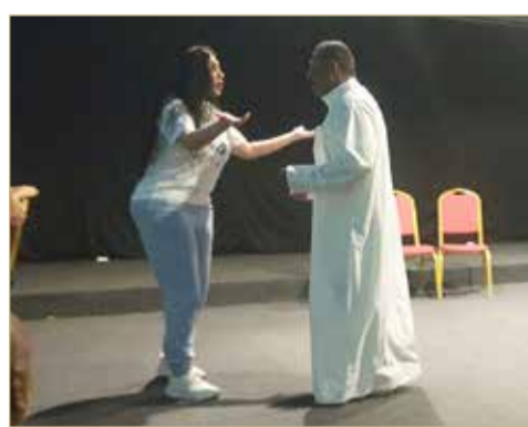
جانب من بروفة لا تتشنج