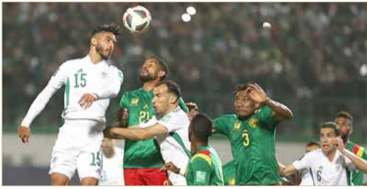
من مباراة الكامبيرون والجزائر

أعلن الاتحاد الدولي لكرة القدم ”فيفا“، الاثنين، قرار لجنة الانضباط بشأن مباراة الجزائر والكامبيرون، التي أقيمت يوم 29 مارس آذار الماضي، في إياب الدور النهائي من التصفيات الإفريقية المؤهلة لكأس العالم 2022. وتقرر تغريم الاتحاد الجزائري 3 آلاف فرانك سويسري، بسبب شغب الجماهير في مدرجات ملعب مصطفى تشاكر، بإلقاء المقذوفات وإشعال الألعاب النارية.