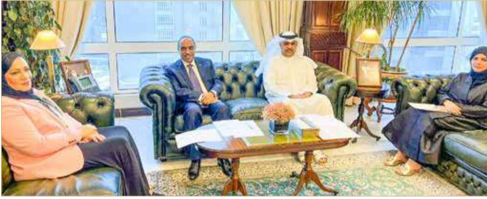
المنامة - وزارة الأشغال

استقبل وزير الأشغال وشؤون البلديات والتخطيط العمراني عصام خلف بمكتبه في شؤون الأشغال النائبة فاطمة القطري ممثل الدائرة الثانية في المحافظة الشمالية بحضور وكيل الوزارة لشؤون الأشغال أحمد الخياط ومدير عام بلدية المنطقة الشمالية لمياء الفضالة وعددًا من مسوولي الوزارة. وفي بداية اللقاء، رحب الوزير خلف بالنائبة فاطمة القطري مشيدًا بالدور الذي يلعبه أعضاء السلطة التشريعية في خدمة الوطن والمواطنين، مؤكدًا في الوقت ذاته أهمية التعاون المستمر بين السلطتين التشريعية والتنفيذية من أجل الصالح العام.