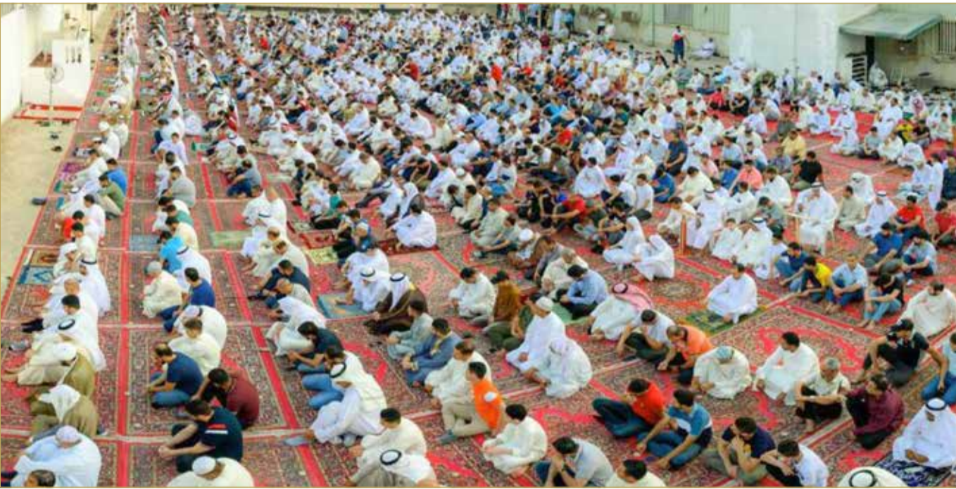
البلاد | محرر الشؤون المحلية

رفع الشيخ محمد المدني في خطبة صلاة العيد التي أقامها صباح أمس في مصلى العيد بجبله حبشي تهانيه وتبريكاته بعيد الفطر المبارك إلى عاهل البلاد صاحب الجلالة الملك حمد بن عيسى آل خليفة، وإلى ولي العهد رئيس مجلس الوزراء صاحب السمو الملكي الأمير سلمان بن حمد آل خليفة، سائلًا الله أن يحفظهما ويعيد عليهما هذا العيد في خير وعافية ونماء، ومزيد عناية ربانية.