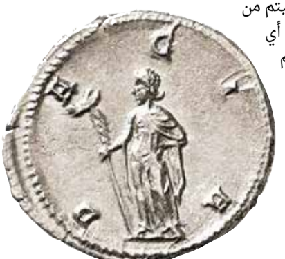
عملة دراخاما الإمبراطور دقيانوس