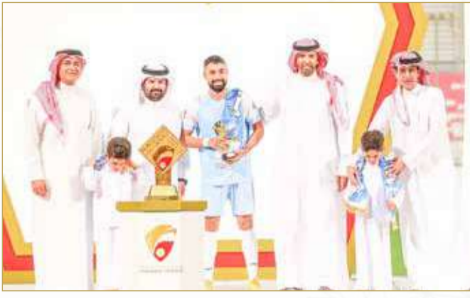
من ختام دوري ناصر بن حمد الممتاز

أساسية للنهوض باللعبة. كما أثنت الشركة على التعاون المتميز بين طموح واتحاد الكرة والذي يصب في صالح تطور وازدهار اللعبة في المملكة مؤكدة على أهمية تطوير وتنمية هذه العلاقة بما يسهم في تعزيز