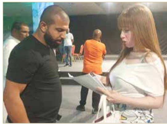
المخرج حسين العويناتي