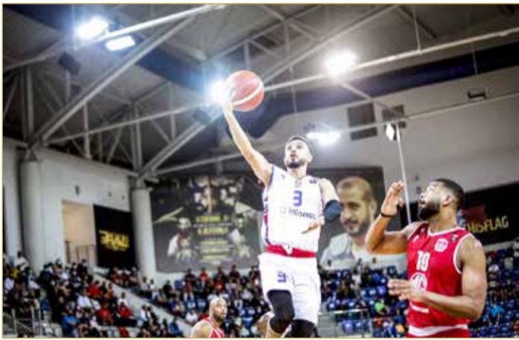
لقاء المنامة والمحرق