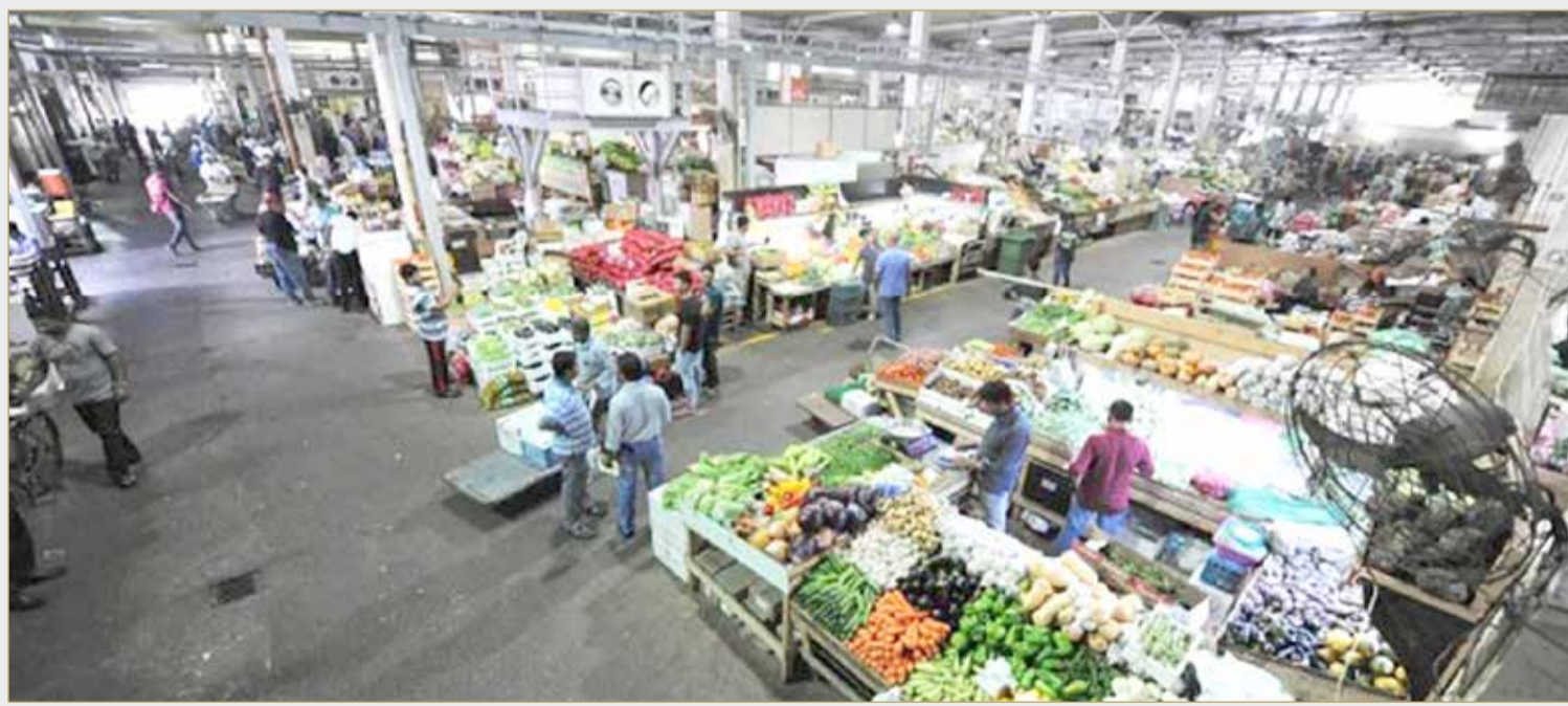
الفواكه بسوق المنامة