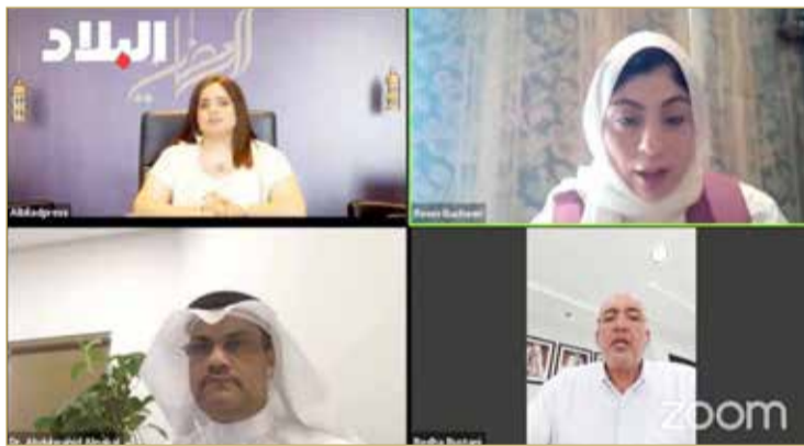
المشاركون في ندوة البلاد

والأجنبي، فشددت بوجيري على دعمها للتجار المحليين والبحرينيين، مؤكدة ضرورة التبليغ عن المخالفين وعدم تشجيعهم على البيع والشراء في السوق، منوهة بوجود وحدات خاصة في أمانة العاصمة تتابع وترصد المخالفين وتحاسبهم. ومن الجهود التي قامت بها الأمانة لتخفيف من وجود العمالة السائبة والجائلة في السوق إذ أصدرت بطاقات تعريفية لكل العمال الموجودين في السوق وخاضعين لسجل تجاري مفصل يوضح اسمه وعنوانه التابع لسوق المنامة المركزية واسم صاحب السجل وكافة المعلومات اللازمة. (04 - 05)