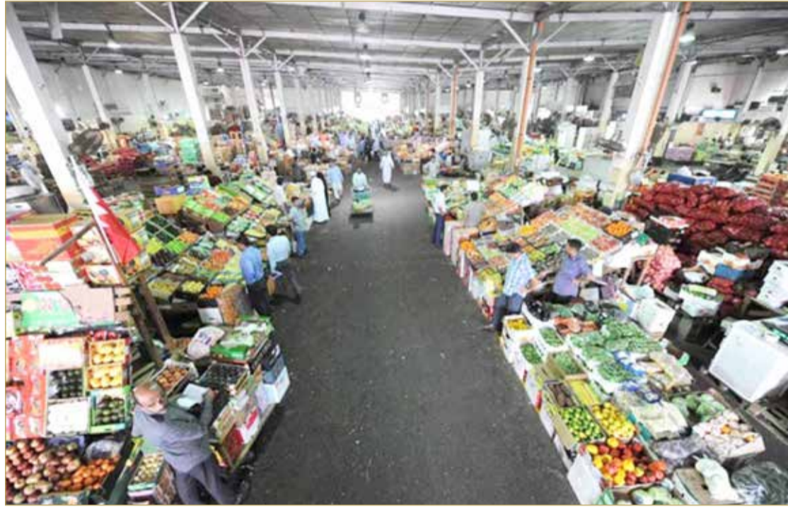
الفواكه والخضروات بالسوق

وتكثيف السوق المركزية وبالتحديد سوق الخضار والفواكه والذي عُرف عنه بكونه سوقاً شعبية غير مكيفة، تم الانتهاء من تكييف شق الجملة وشق التجزئة على مرحلتين تم إنجاز مشروع تطوير وتقوية التيار الكهربائي وتغيير عوازل المياه والأمطار للسوق بالكامل. وأضافت "تمت المبادرة بمشروعين استطاعا أن يضيفا نقلة نوعية في مجال تجارة المواد الغذائية وأتاحا فرصاً للتجار الصغار؛ للبدء في أنشطة الاستيراد والتجارة، ومشروع توسعة