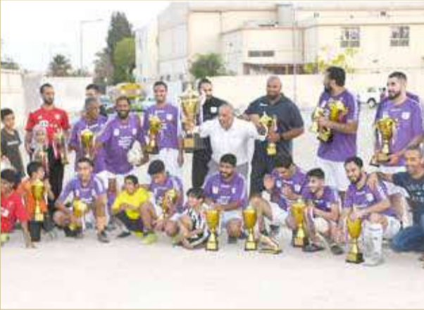
صورة جماعية في الختام