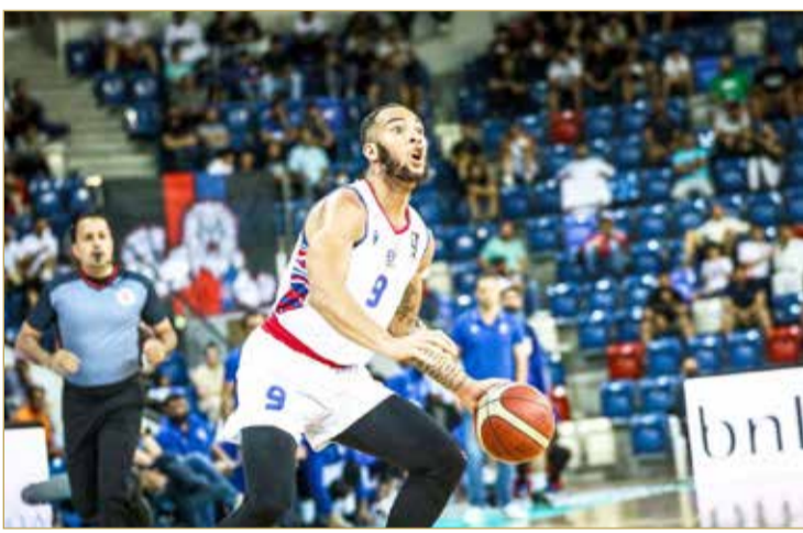
محترف المنامة بييري