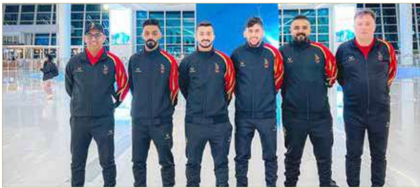
منتخب كرة الطاولة

غادر منتخبنا الوطني لكرة الطاولة المملكة متوجهاً إلى إسبانيا لإقامة معسكر تدريبي يسبق المشاركة في دورة الألعاب الخليجية التي ستقام في الكويت الشهر الحالي. واجتمعت رئيس الاتحاد البحريني لكرة الطاولة الشيخة حياة بنت عبدالعزيز آل خليفة مع وفد المنتخب، حيث تمت لهم التوفيق والنجاح وطببتهم ببذل مزيد من الجهود تحقيقاً لكسب جميع الأهداف المرجوة من المعسكر قبل المشاركة في البطولة الخليجية، معربة عن شكرها وتقديرها إلى النائب الأول لرئيس المجلس الأعلى للشباب والرياضة رئيس الهيئة العامة للرياضة رئيس اللجنة الأولمبية البحرينية سمو الشيخ خالد بن حمد آل خليفة على دعم سموه المتواصل للاتحاد والهيئة العامة للرياضة واللجنة الأولمبية على تهيئة الأجواء المثالية للمنتخب في إقامة المعسكر