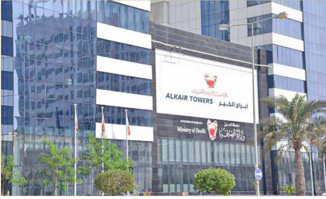
مبنى وزارة الصحة