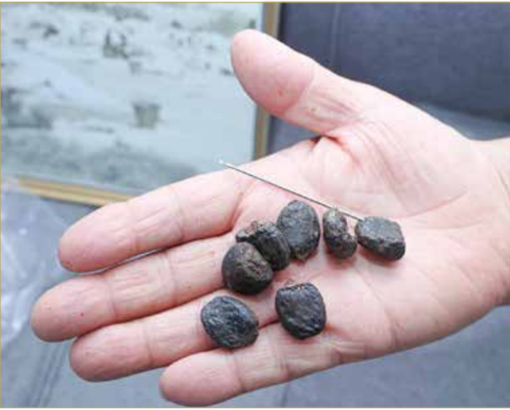
مادة النيل التي تستخدم كإشارة لمعرفة الملابس