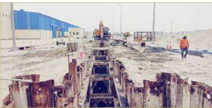
أعمال مشروع الخط الرئيس الناقل للصرف الصحي بالحد الصناعية