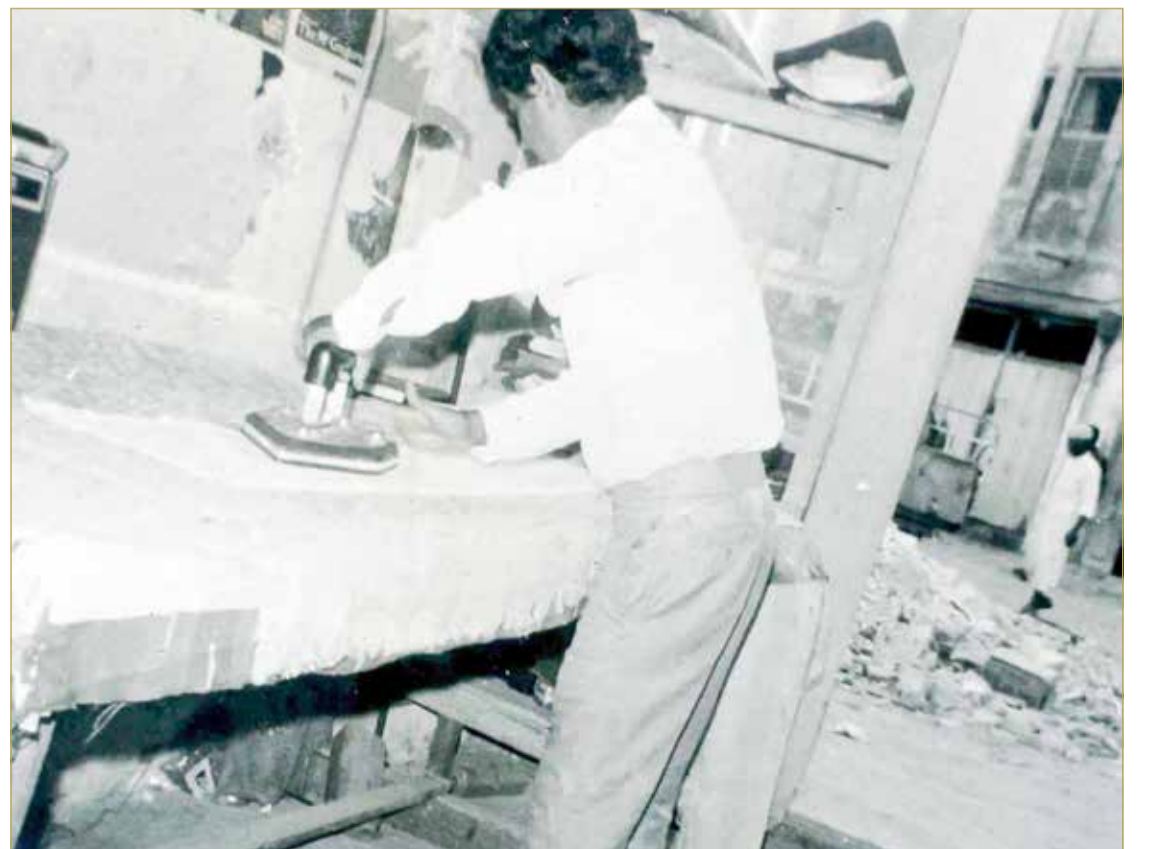
عملية كي الملابس