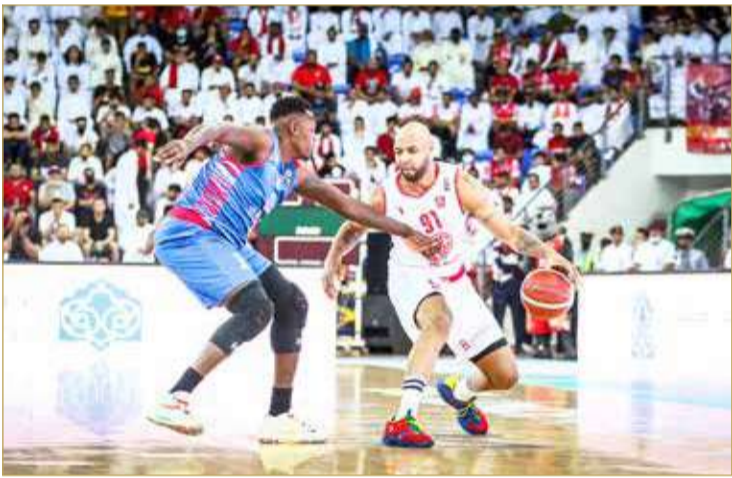
من لقاء المحرق والمنامة