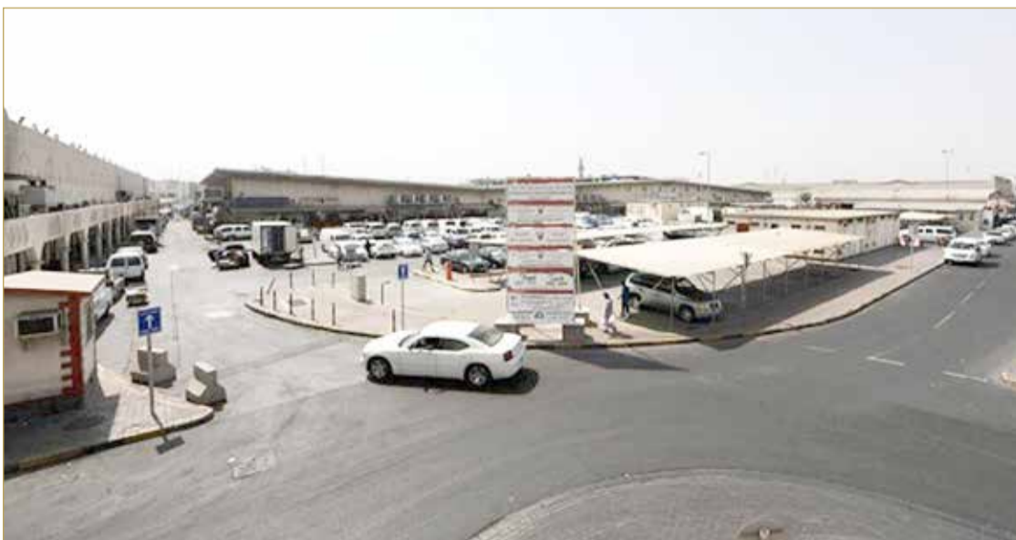
منطقة سوق المنامة المركزية

أن درجة الحرارة الحالية معقولة، مشيرة إلى أن عملية تبريد سوق المنامة المركزية من أكثر المشاريع تكلفة في الأمانة والتي تمت على مرحلتين.