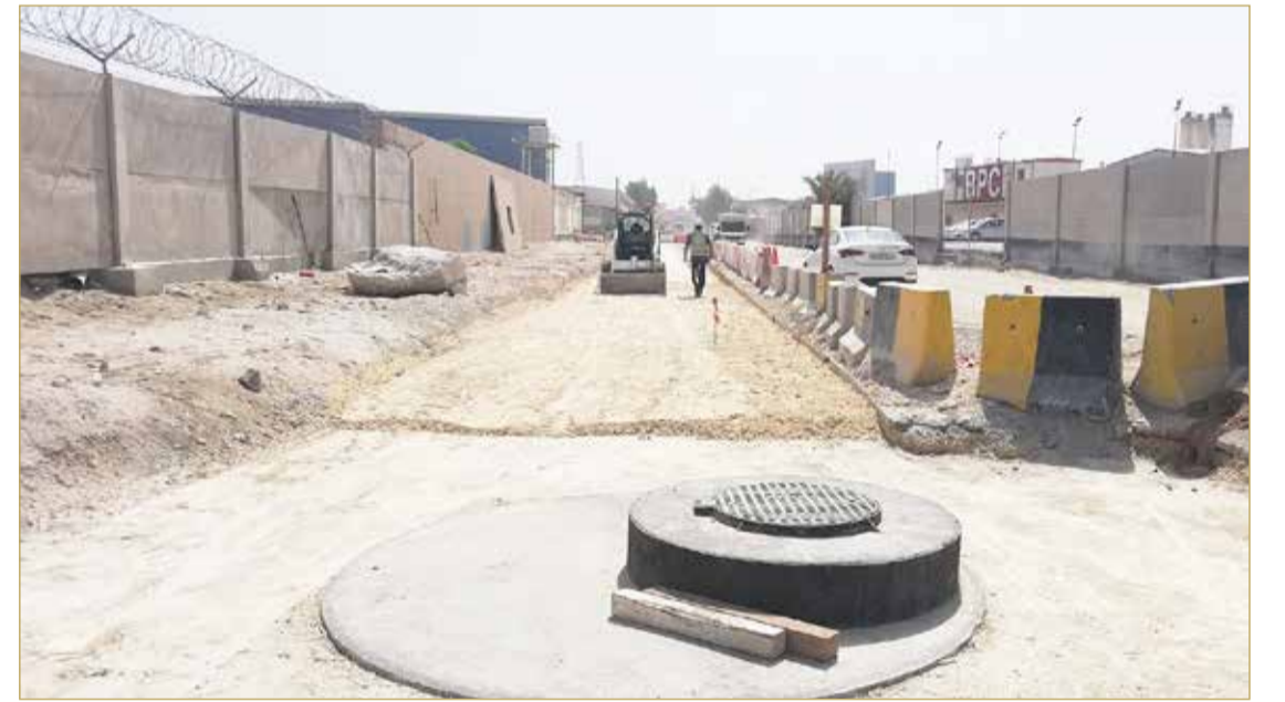
المنامة - وزارة الأشغال

أكد وزير الأشغال وشؤون البلديات والتخطيط العمراني عصام خلف أن أعمال مشروع بناء الخط الرئيس للصرف الصحي من منطقة سلما باد إلى تقاطع شبكة E و F - في المرحلتين الأولى والثانية مستمرة، إذ وصلت أعمال الإنجاز في المرحلة الأولى من المشروع إلى 85% من المشروع، فيما وصلت أعمال الإنجاز بالمشروع في المرحلة الثانية إلى 65%.