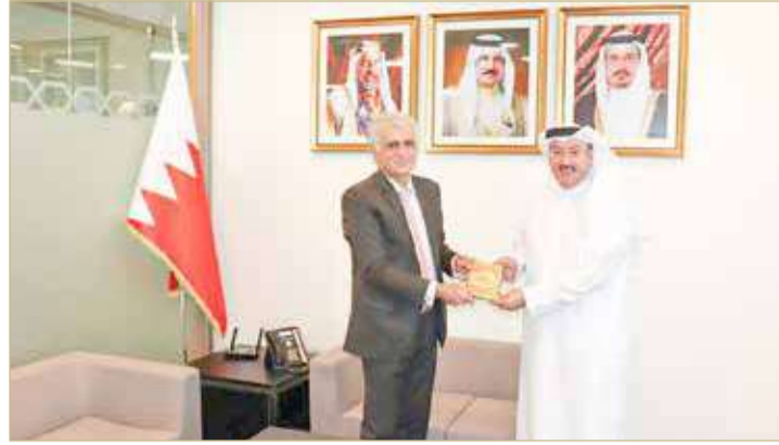
حاجي يهدي "أنا والخوارزميات" للشهخ محمد بن خليفة

المجموعة العالمية للذكاء الاصطناعي بالشكر والتقدير خليفة.