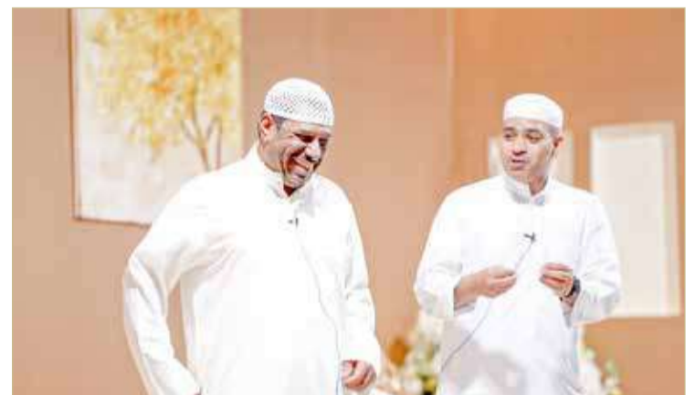
الصايغ ينظم العالم بفنه