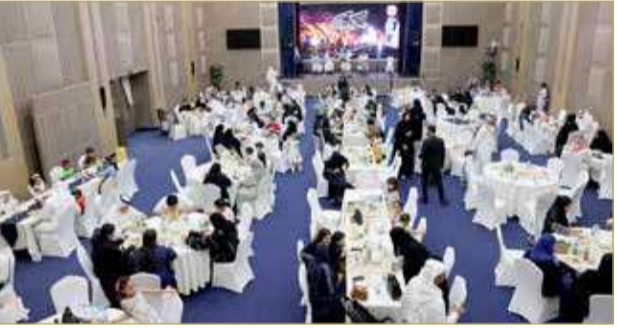
المنامة - وزارة الداخلية

النادي وأبنائهم وعوائلهم، حيث اشتملت الفعالية على العديد من البرامج وال فقرات المتنوعة لفرقة شباب الحد لفن الصوت، إضافة إلى ركن الأسر المنتجة وركن الضيافة العربية، كما تم توزيع الهدايا على جميع الأطفال المشاركين في جو اجتماعي ترفيهي وعائلي مميز.