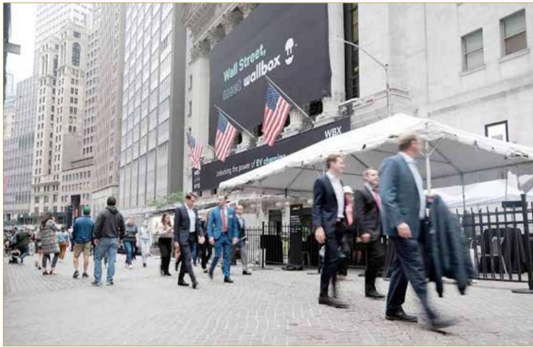
انهيار أسواق الأوراق المالية عقب رفع الفائدة الأمريكية

وأكدوا في الوقت نفسه أن دول الخليج ستكون الأقل تأثراً بهذه الخطوة، لأنها مستفيدة من ارتفاع أسعار النفط، ومن احتياطياتها المالية الكبيرة، وارتباط سعر صرف عملاتها المباشر بالدولار. وتوقعوا أن يخفض الارتفاع عدد القروض الممنوحة للمستهلكين ويضعف القوة الشرائية بشكل كبير محلياً وعالمياً. (17)