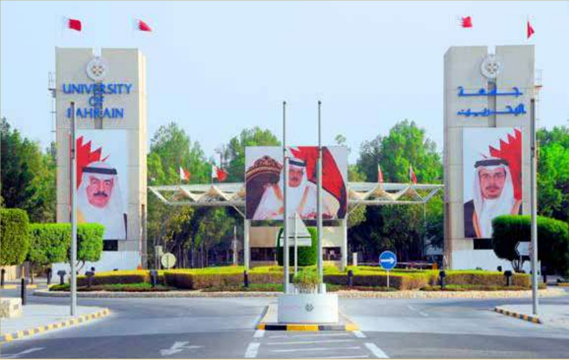
الصغير - جامعة البحرين

أعلنت جامعة البحرين أن فترة تقديم طلبات الالتحاق بالمرحلة الجامعية الأولى (الفترة الأولى) ستتم من اليوم الأحد إلى يوم الأحد 29 من الشهر نفسه، مشيرة إلى فتح باب القبول للطلبة المحولين من الجامعات الأخرى (التحويل الخارجي) في الفترة نفسها.