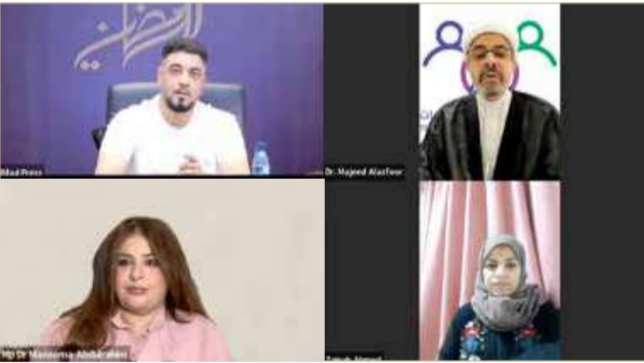
المشاركون في ندوة "البلاد"

الانستغرام" في أحيان أخرى. وطالب البرلمان السابق مجيد العصفور وزير العمل والتنمية الاجتماعية والمجلس الأعلى للمرأة بسرعة التحرك نحو إيجاد قاعدة بيانات عن حالات الطلاق لإيجاد الحلول المناسبة. (04 - 05)