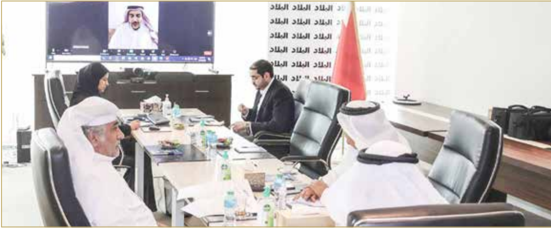
متابعة الاجتماع عبر الاتصال المرئي