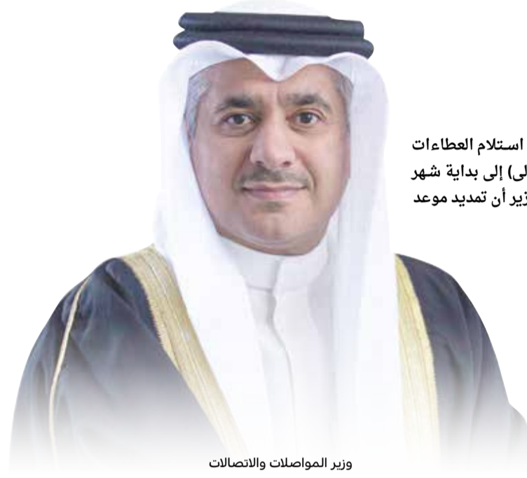
وزير المواصلات والاتصالات

كشف وزير المواصلات والاتصالات كمال أحمد لـ "البلاد الاقتصادي"، عن تمديد موعد استلام العطاءات لمناقصة مرحلة التأهيل المسبق للمطورين المنفذين لمشروع مترو البحرين (المرحلة الأولى) إلى بداية شهر يونيو المقبل، وذلك بعد أن كان من المقرر استلامها يوم أمس الموافق 8 مايو. وأوضح الوزير أن تمديد موعد استلام العطاءات جاء بناء على طلب الشركات والحاجة لوقت أكثر لإعداد عطاءاتها.