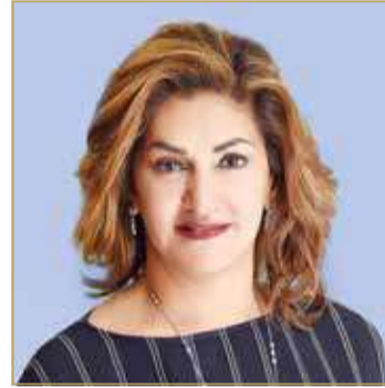
الشيخة هند بنت سلمان