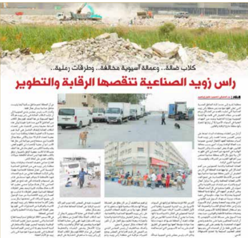
كلاب ضالة.. وعمالة أسيوية تتقصصها الرقابة والتطوير

النفائات ومخلفات البناء التي يتسبب بها العمالة الوافدة فضلا عن المخالفات القانونية، ولفت إلى التجمعات الكبيرة للعمالة المخالفة والباعة المتجولين المخالفين للقانون وانتشار "الفرشات" غير القانونية في أرجاء المدينة رغم كثافة حملات التفتيش إلا أنها لم تمنع من وجودهم لبيع كل ما هو فاسد وممنوع وغير صالح للاستهلاك، كما بين التقرير معاناة المنطقة من انتشار كبير لظاهرة الكلاب الضالة التي تحتضنها العمالة الوافدة.