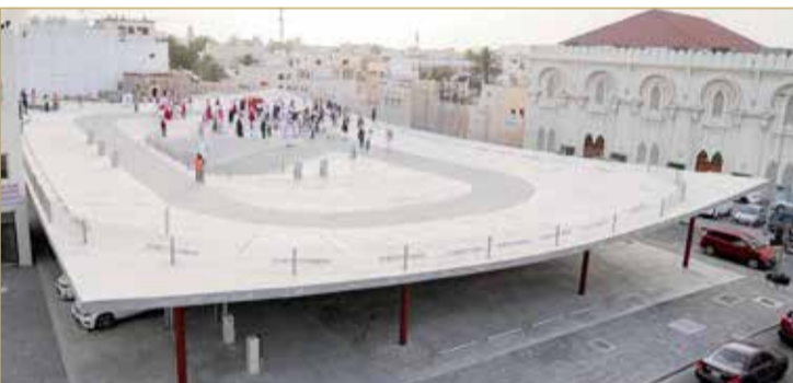
افتتاح المبنى الأول لمواقف السيارات متعددة الطوابق

مسار اللؤلؤ في المحرق، والمشروع عبارة عن 4 مبان موزعة على امتداد المسار. ويتسع المبنى الذي تم افتتاحه لحوالي 130 سيارة ويتكون من طابق أرضي وطابق أول. ومن المقرر الانتهاء من تشييد المواقف الثلاثة المتبقية ما بين نهاية العام 2022 وبداية العام 2023.