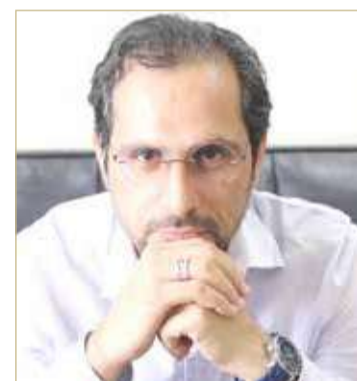
بقلم: جعفر حمزة

يذكر أن المخرج محمد خضر هو مخرج المسرحيات التالية: مسرحية الطماطية الحمراء،