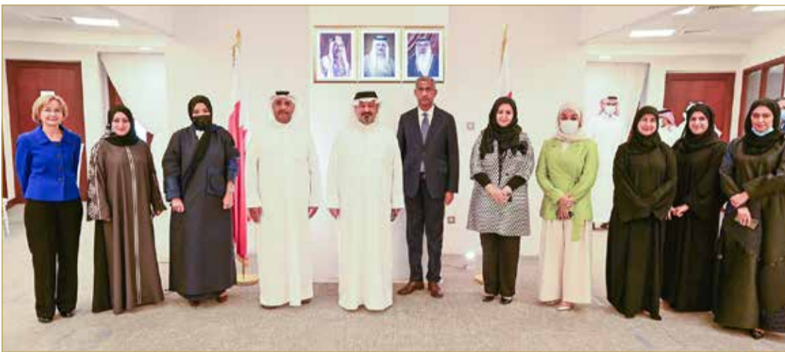
المنامة - ديوان الرقابة المالية الإدارية:

أكد رئيس ديوان الرقابة المالية والإدارية، الشيخ أحمد بن محمد آل خليفة، أن القدرات التي يمتلكها الديوان من جهة الكفاءات البشرية والإمكانات الفنية واللوجستية، تؤهله ليكون في مصاف الأجهزة الرقابية المتقدمة. وأضاف خلال حفل استقبال نظمته الديوان لموظفيه صباح أمس بمناسبة عيد الفطر المبارك، أن هناك ضرورة دائمة وديناميكية للتطوير والتحديث وإدخال البرامج الجديدة التي تواكب آخر ما توصل إليه العالم في مجال الرقابة والتدقيق، خصوصاً ما يتعلق بتدريب الموظفين والجانب التكنولوجي. واعتبر النهوض بالأداء والإنتاجية والارتقاء بأسلوب تنفيذ المهام المنوطة بالديوان وانعكاسها إيجاباً على مستوى الخدمات المقدمة للمواطنين، هي جزء من واجباتنا تجاه البحرين التي تستحق بذل المزيد من الجهد والتطلع نحو المستقبل. وهنأ الشيخ أحمد الموظفين بالعيد