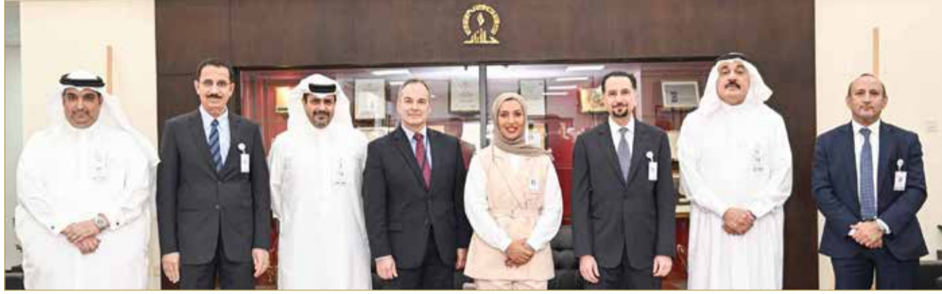
أثناء زيارة رئيس وأعضاء مجلس إدارة بناغاز و"توسعة"

وفي ختام الزيارة، أعرب رئيس وأعضاء مجلس إدارة شركة بناغاز وتوسعة عن شكرهم وتقديرهم للشركة على حفاوة الاستقبال وكرم الضيافة، معربين عن اعتزازهم وفخرهم بما أطلعوا عليه من تاريخ حافل من الإنجازات والجوائز العديدة التي أحرزتها على الصعيد المحلي والإقليمي والعالمي، إذ عكست هذه الإنجازات المستوى الرفيع للشركات النفطية في مملكة البحرين مشيدين بالأيدي العاملة البحرينية وخبراتها الرفيعة في مجال تشغيل المشروعات الصناعية الكبيرة، منوهين في الوقت ذاته بالدور المتميز الذي تتيحه الشركة في المساهمة بدفع عجلة التنمية والاقتصاد في مملكة البحرين، متمنين للشركة وللعاملين فيها مزيدًا من التطور والازدهار.