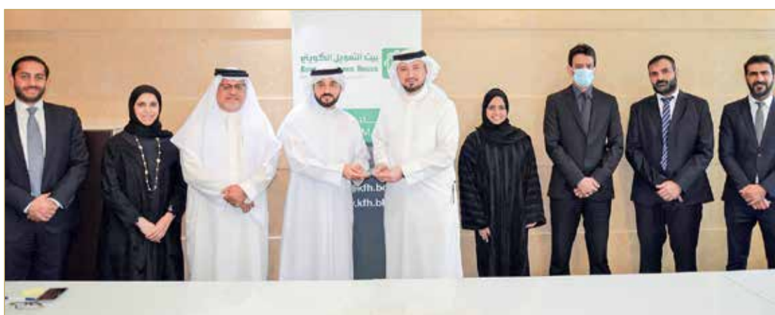
أثناء تسلم جائزة "النخبة للجودة الرفيعة (STP)"

الرائدة على الصعيد المحلي ومساهم رئيسي في تطوير القطاع المالي الإسلامي بمملكة البحرين. وتقدم مجموعة "سي تي" المصرفية جوائز جودة عمليات المعالجة المباشرة للمدفوعات، لتكريم في كل عام البنوك التي نجحت حول العالم في تحقيق أعلى المعايير في تصفية تحويلات أموال العملاء والتمويل التجاري والتسويات الدولية، استناداً إلى معدلات STP الخاصة بهم؛ أي النسبة المئوية لمعاملات الدفع المؤتمتة التي يتم إكمالها دون الحاجة لتدخل يدوي إضافي، حيث ستمكن هذه الهيئات من إجراء واستلام المدفوعات بشكل أسرع، من اتباع الخطوات التقليدية.