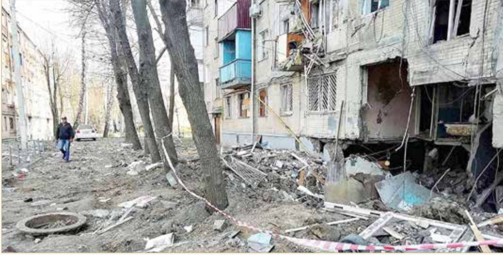
جانب من الدمار جراء القصف الروسي في أوكرانيا