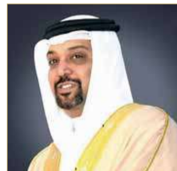
الشيخ سلمان بن خليفة

المنامة - وزارة المالية والاقتصاد الوطني