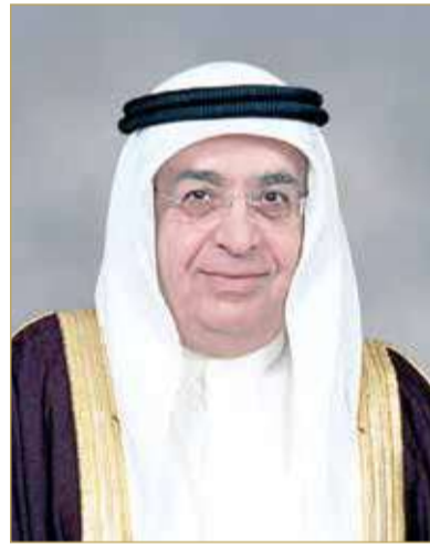
سمو الشيخ محمد بن مبارك

الملكية السامية بتعزيز الأمن الغذائي والاستثمار فيه، ووجه بمواصلة تبني المبادرات التي تكفل تحقيق الأمن الغذائي في المجالات الزراعية والحيوانية والبحرية وتزيد حجم المنتج الوطني بما يكفل تأمين الغذاء واستدامته وسلاسل الإمدادات، وذلك في ضوء الاطلاع على المذكرة المرفوعة في هذا الشأن من وزير الأشغال وشؤون البلديات والتخطيط العمراني، فيما كلف المجلس وزارة شؤون البلديات والتخطيط العمراني ووزارة الصناعة والتجارة والسياحة بتكثيف مراقبة أسعار المنتجات وضمان توافرها وفقاً لاحتياجات السوق الاستهلاكية. ثم أشاد المجلس بمسارات التعاون والتنسيق بين السلطتين التنفيذية والتشريعية وما تحقق على صعيده من نجاحات؛ من أجل تنمية الوطن وتحقيق تطلعات المواطن. (04)