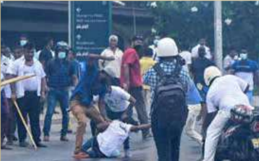
جانب من أعمال العنف في سريلانكا

لقي ثلاثة أشخاص حتفهم بينهم نائب وجرح أكثر من 150 في أعمال عنف في سريلانكا أمس استقال على إثرها رئيس الوزراء ماهيندا راجاباكسا. وقالت الشرطة إن أماراكيرثي أتوكورالا، وهو نائب في الحزب الحاكم، فتح النار وأصاب شخصين بجروح خطيرة اعتراضاً سيارته في بلدة نيتامبوا، ثم انتحر خلال مواجهة خارج العاصمة. وأضافت الشرطة أن أحد الضحايا توفي متأثراً بجراحه ويبلغ من العمر 27 عامًا.