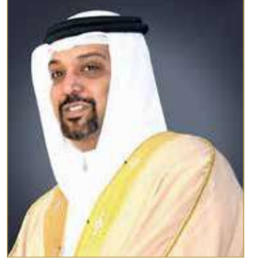
الشيخ سلمان بن خليفة آل خليفة

أكد وزير المالية والاقتصاد الوطني الشيخ سلمان بن خليفة آل خليفة أن برنامج التوازن المالي على مسار تحقيق أهدافه وأن العمل مستمر لتنفيذ جميع مبادرات برنامج التوازن المالي بكل عزيمة وإصرار للوصول إلى نقطة التوازن المالي، مشيراً إلى ما تحقق من خطوات متقدمة على صعيد برنامج التوازن المالي الذي يستهدف الوصول لنقطة التوازن المالي بين