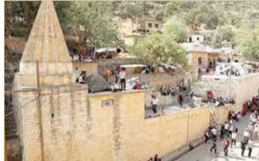
المتظاهرون قلقون من الوضع في سنجار