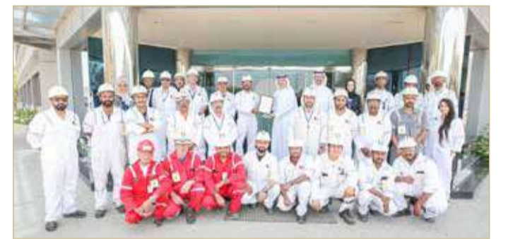
الاحتفاء بالجائزة المرموقة

بأعلى معايير الصحة والسلامة وإصلاح السفن “أسري” عن حصولها على جائزة السلامة الدولية من مجلس السلامة البريطاني نظير التزامها بحماية صحة موظفيها والحفاظ على سلامتهم وحرصها على توفير بيئة عمل آمنة وصحية لكافة منتسبيها خلال العام 2021.