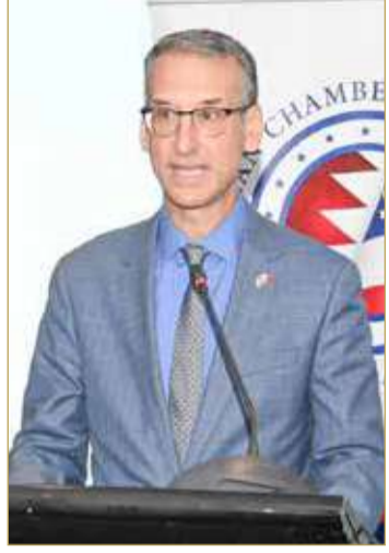
السفير الأميركي متحدًا في الفعالية

وأعرب السفير الأميركي ستيفن بوندي في بداية كلمته عن سعادته بالحضور في فعالية الغرفة الأميركية، مشيراً إلى قدم إلى البحرين في شهر فبراير الماضي ليصبح سفيراً للولايات المتحدة لمدة 3 أعوام، معرباً عن سعادته بالعمل في البحرين خلال الأعوام 2004 و2007،