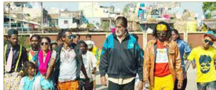
براعة في تكوين البناء النهائي لمعظم اللقطات

والخلفيات المرتبطة بالشخصيات، بالدرجة التي جعلت المشاهد يعيش مشكلات الأطفال والشباب المرشدين في الهند عن قرب وظروفهم الصعبة، ويبدو بوضوح في الفيلم أن مسألة كالتجاذب والفشل الاجتماعي هي مجرد حوادث يتعرض لها الإنسان، ولكنه بالإمكان التغلب عليها، وقد عبر عن ذلك في مقطع الأغنية الذي يقول "صادق الحياة، فهناك طريقة للخروج من هذ