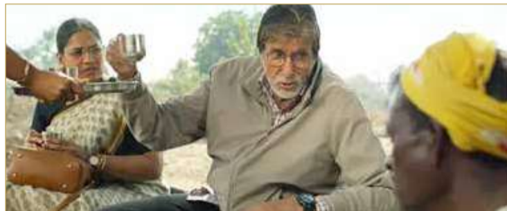
تفاصيل وخلفيات مرتبطة بالشخصيات

لا يزال أسطورة السينما الهندية أميتاب باتشان يدرك أمجاد قوته ويربط منجزات الماضي بمنجزات الحاضر، ولعل اختياره نوعية معينة من الأفلام خلال السنوات العشر الماضية تأكيد على معرفته بإيقاع قانون الحياة الدائم. لقد شاهدت فيلم Jhund للنجم باتشان، وفكرته الأساسية تحمل في طياتها نواة القصة أو الموضوع وتكشف غايتها. فيجاي بارس رياضي متقاعد يؤسس منظمة غير حكومية لتأهيل أطفال الشوارع وإبعادهم عن المخدرات والجريمة من خلال تحويلهم إلى لاعبي كرة قدم، وقد تمكن مخرج ومؤلف الفيلم "ناغراج منجول" في تحريك الخطوط الدرامية بشكل متوازٍ دقيق، واختزال الخط الدرامي الكامل في فريق كرة القدم الذي أسسه فيجاي، وتنويع المشاهدة بين التشويق والتعجب والدهشة والتوتر وحدة الصراع والمواقف الكوميديّة والمفاجآت المختلفة والمفارقات والانقلابات الدرامية. لقد جرت العادة على النظر إلى الأحياء الفقيرة في الهند، وكثيرة هي الملامح التي نراها تنعكس في المئات من الأفلام، ولكن في هذا الحي يختلف الأمر، فالسيناريو المكتوب صور التفاصيل