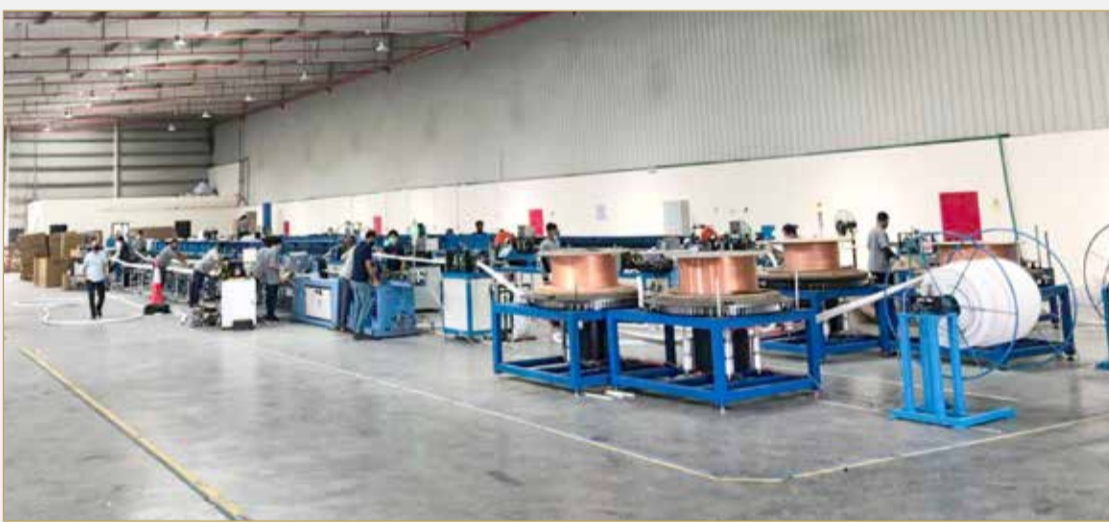
المصنع سيخدم أسواق الشرق الأوسط والولايات المتحدة وأوروبا

ويعتبر قطاع التصنيع في البحرين من ضمن القطاعات الحيوية ضمن أولويات خطة التعافي الاقتصادي، حيث تسعى البحرين إلى زيادة الصادرات الوطنية المنشأ لتشكّل 80.1% من إجمالي صادرات المملكة بحلول عام 2026. يمثل التصنيع نحو 14% من الناتج المحلي الإجمالي وهو ثاني أكبر مساهم في القطاع غير النفطي في البحرين.