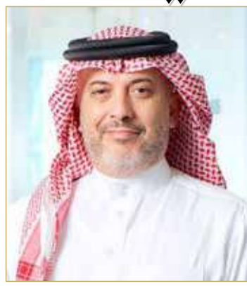
الشيخ إبراهيم بن خليفة

ويشارك في هذا المؤتمر كوكبة من علماء الشريعة وكبار ممثلي البنوك المركزية والهيئات الرقابية والإشرافية والمؤسسات المالية وشركات المحاسبة والتدقيق، والشركات القانونية والجامعات ومؤسسات التعليم العالي ووسائل الإعلام من جميع أنحاء العالم. وبمناسبة انعقاد المؤتمر، صرح رئيس مجلس أمناء أيوفي الشيخ إبراهيم بن خليفة آل خليفة أن "مؤتمر الهيئات