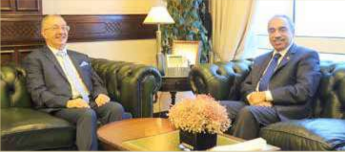
المنامة - وزارة الأشغال وشؤون البلديات والتخطيط العمراني

الجزائرية المتقدمة في مجال الأشغال والتعمير والبنى التحتية. ومبادرات التعافي الاقتصادي. كما أعرب عن تطلع الوزارة إلى الاستفادة من الخبرات الجزائرية في مختلف المجالات خصوصاً في مجالات البنية التحتية. من جانبه، أشاد سفير الجمهورية الجزائرية الديمقراطية الشعبية بالتعاون الذي تبديه الوزارة مع السفارة من جهود نحو تعزيز أواصر التعاون في مجال البنية التحتية، متمنياً استمرار التعاون بين الجانبين؛ لمواصلة نهج التطور والإزدهار.