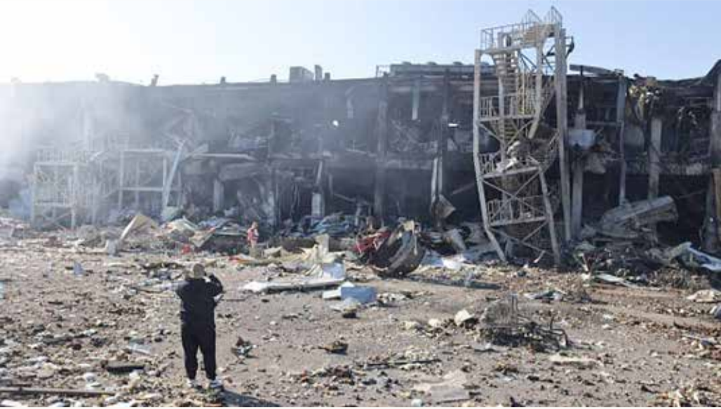
العثور على جثث 44 مدنياً بأقناض مبنى في إيزيوم

في الجلسة نفسها قال مدير وكالة الاستخبارات التابعة لوزارة الدفاع الأميركية اللتانتال جنرال سكوت برييه إن المعارك الدائرة حالياً في منطقة دونباس تشهد "نوعاً من الجمود". لكنه قال إن هذا الواقع يمكن أن يتغير إذا ما أعلنت روسيا الحرب رسمياً وامرت بالتعبئة العامة.