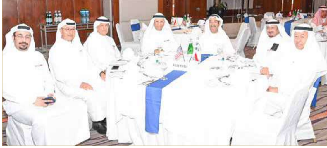
جانب من المشاركة في الفعالية

وأكد أن سيتم التعاون مع الشركات الأميركية في البحرين ودول الخليج وأميركا للناك من معرفة الفرص الممتازة التي توفرها منطقة التجارة الأميركية للاستثمار في المملكة.