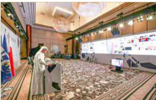
جانب من الجمعية العمومية