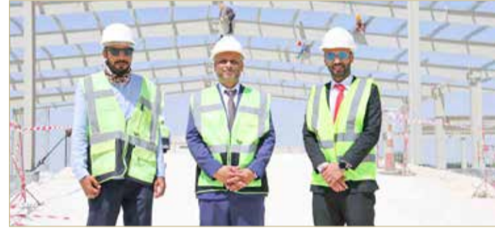
الزيارة التفقدية لموقع المفرخة الجديدة

بدوره سيساهم في زيادة إنتاج الدجاج اللاحم في مملكة البحرين، كما سيساهم المبنى الجديد للمفرخة في توفير فرص عمل جديدة. وتواصل الشركة بذل الجهود من أجل تحقيق الاكتفاء الذاتي وتعزيز مساهمتها بمجال الأمن الغذائي في المملكة عبر خطة تدريجية بدأت بتطوير خط الإنتاج والقدرة الكهربائية