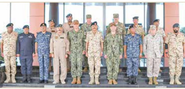
المنامة - بنا

اختتمت صباح أمس، مجريات التمرين المشترك الدفاع المتوهج (Neon Defender)، والذي نفذته عدد من أسلحة ووحدات قوة دفاع البحرين، ووزارة الداخلية متمثلة بخفر السواحل، والقيادة المركزية للقوات البحرية الأمريكية (NAVCENT) بحضور اللواء الركن غانم الفضالة مساعد رئيس هيئة الأركان للعمليات، والفريق بحري تشارلز برادفورد كوبر قائد القوات البحرية بالقيادة المركزية الأميركية قائد الأسطول الخامس، واللواء الركن بحري محمد العسم قائد سلاح البحرية الملكي البحريني. وتضمن التمرين تنفيذ عدد من ورش العمل والتدريبات