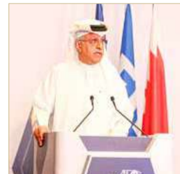
كلمة سلمان بن إبراهيم

أعلى مستوى في مدينة بوتراجايا قرب العاصمة الماليزية كوالالمبور، وهو أمر سيسهل خطوة كبيرة للأمام بالنسبة للاتحاد الآسيوي لكرة القدم والاتحادات الوطنية والإقليمية الأعضاء. وخلال اجتماع الجمعية العمومية، تم الاطلاع على قرار الصين الانسحاب من استضافة نهائيات كأس آسيا 2023، ونظراً لطبيعة الطائرة للموقف فقد تقرر تفويض المكتب التنفيذي باختيار مضيف بديل (بعد عملية تقديم ملفات الترشيح عبر إدارة الاتحاد الآسيوي لكرة القدم، وسيتم الإعلان عن المزيد من التفاصيل بخصوص عملية اختيار مضيف كأس آسيا 2023 في الوقت المناسب. كما صادقت الجمعية العمومية على تقارير تدقيق الحسابات المالية للعام 2021، وصادقت على التعديلات المقترحة على النظام الأساسي والتي تؤكد على التزام الاتحاد بالحوكمة الرشيدة.