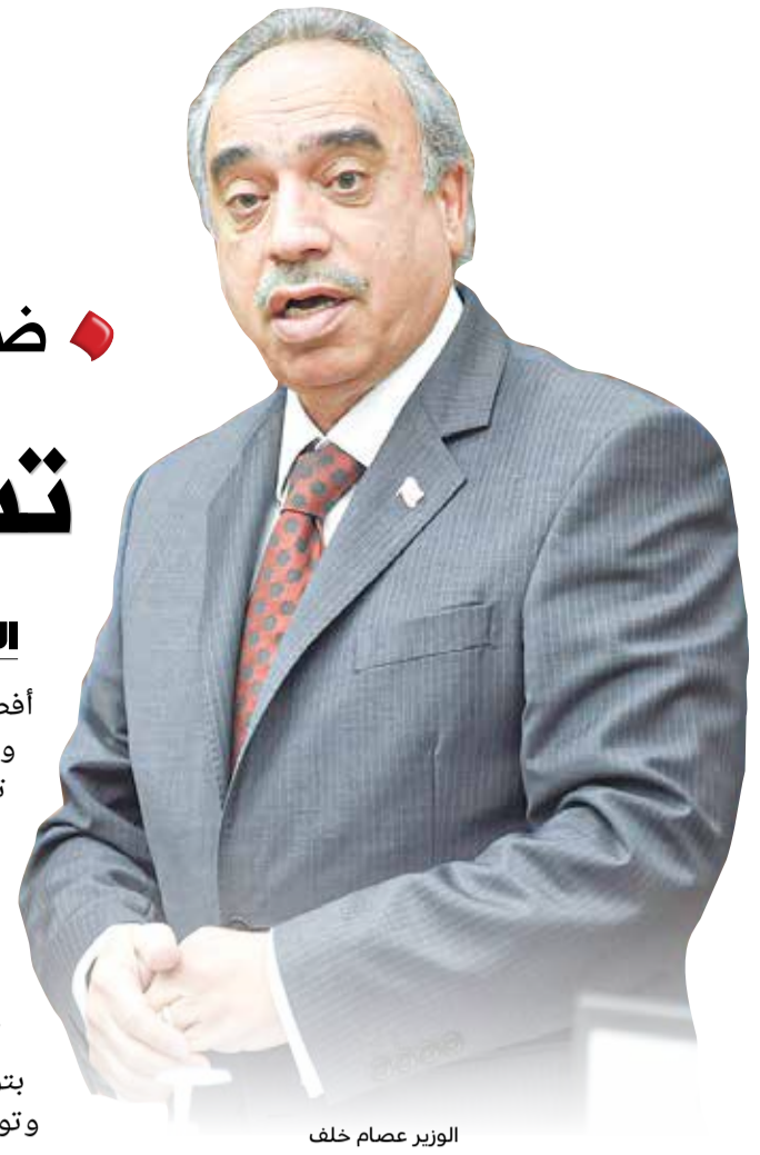
الوزير عصام خلف

أفصح وزير الأشغال وشؤون البلديات والتخطيط العمراني عصام خلف عن تخصيص مواقع ضمن المخطط التفصيلي لشارع البسيتين بمنطقة شمال الدير لمشروع إسكانية. وذكر خلف في خطابه لمجلس بلدي المحرق بشأن المخطط التفصيلي للمنطقة أن هيئة التخطيط والتطوير العمراني أعدت دراسة شاملة للمنطقة، حيث قامت بتوسيع شبكة الطرق وتصنيف بعض العقارات وتوفير بعض الخدمات مع مراعاة تحديد