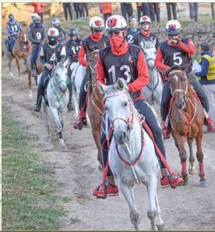
سمو الشيخ ناصر بن حمد يقود الفريق الملكي