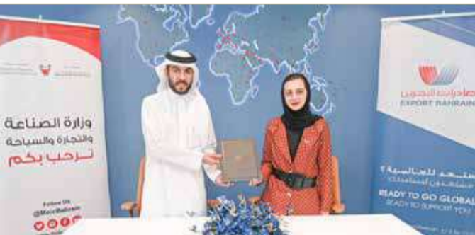
عقب توقيع مذكرة التفاهم

للإلكترونية بمشاركة مجموعة من الشركات والمؤسسات الرائدة في هذا المجال لضمان حصول المشاركين على تجربة إرشادية متكاملة، علماً أنه سيتم اختيار الشركات والمؤسسات المتأهلة من هذا البرنامج ومنحها لقب رواد التجارة الإلكترونية في الخارج من قبل لجنة تقييم. وما زال التسجيل متاحاً للمهتمين بالمشاركة في هذا البرنامج من خلال الرابط التالي: https://service.moic.gov.bh/champions .