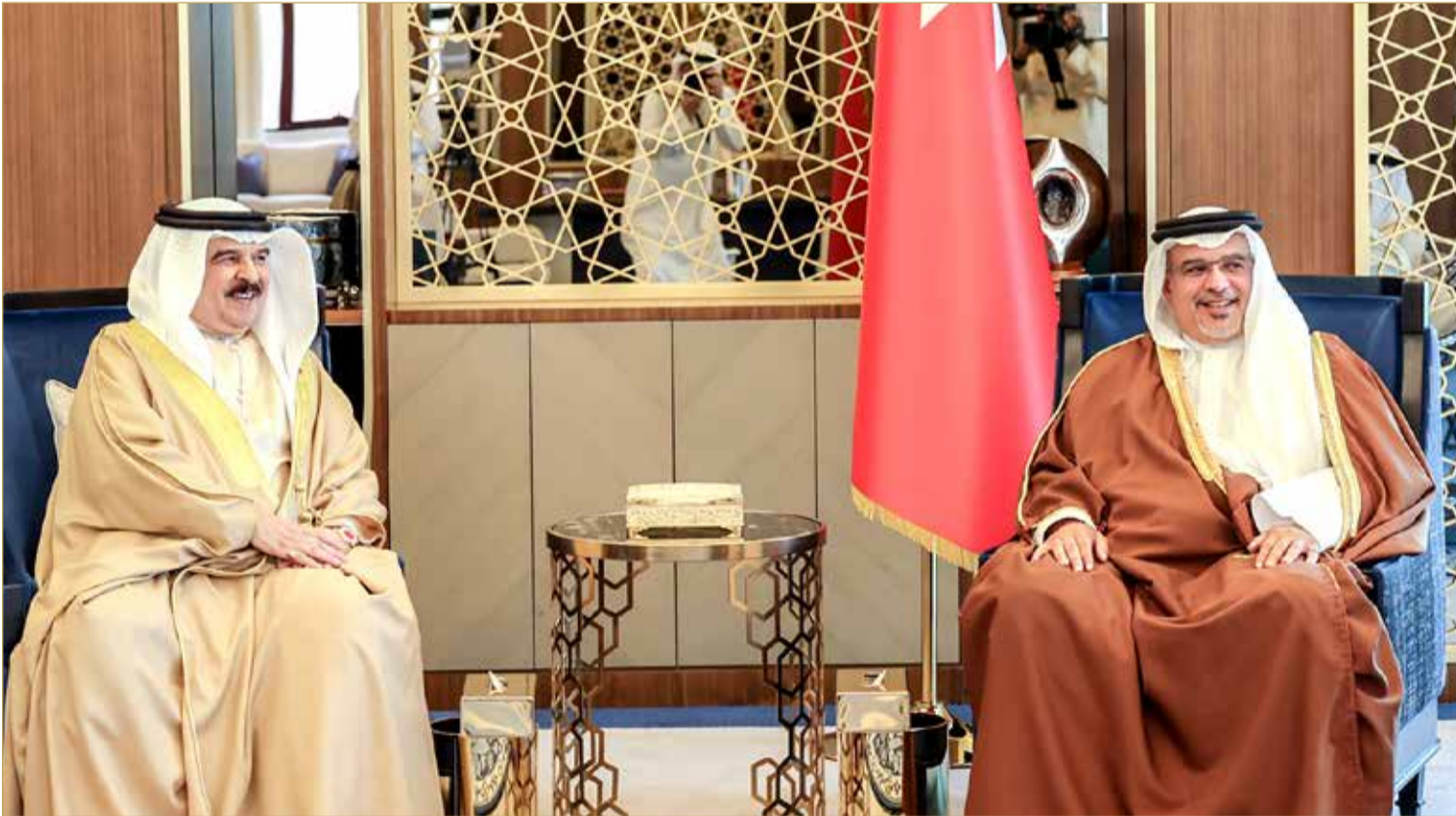
جلالة الملك يعقد اجتماعاً مع سمو ولي العهد رئيس مجلس الوزراء

المنامة - بنا عقد عاهل البلاد صاحب الجلالة الملك حمد بن عيسى آل خليفة، اجتماعاً مع ولي العهد رئيس مجلس الوزراء صاحب السمو الملكي الأمير سلمان بن حمد آل خليفة، في قصر القضيبي مساء أمس. واستعرض جلالته مع صاحب السمو الملكي ولي العهد رئيس مجلس الوزراء خلال اللقاء عدداً من القضايا والموضوعات ذات الصلة بالشأن المحلي، خصوصاً المتعلقة بالخطط والبرامج والمشروعات التنموية والتطويرية التي تنفذها الحكومة في مختلف القطاعات بما يعود بالخير والنماء والازدهار على الوطن والمواطنين. وأثنى جلالته الملك على الجهود الدؤوبة والمخلصة التي يواصل بذلها صاحب السمو الملكي ولي العهد رئيس مجلس الوزراء خدمة البحرين وتعزيز نهضتها المباركة وتطوير منظومة العمل الحكومي عبر استمرار مبادرات تحسين الخدمة الحكومية بما يعزز من جودة الخدمات المقدمة للمواطنين والمقيمين وتعزيز الحوكمة ودعم الاستراتيجيات التي تخدم عملية التنمية الشاملة. وأشاد جلالته الملك بما يبذله جميع أعضاء فريق البحرين من عملي مستمر في مختلف المساعي المعززة لسبل تحقيق التنمية الوطنية المنشودة، ومواصلة تعزيز نمو الاقتصاد الوطني بما يحقق التطلعات لبناء حاضر مشرق ومستقبل مزدهر لمملكة البحرين وأبنائها وخلق الفرص الواعدة وتعزيز مكانة المملكة التنافسية. وأشار جلالته إلى أهمية مواصلة تنمية مختلف القطاعات التنموية وتعزيز الاستثمار بما يسهم في تأمين سلاسل الإمدادات والمواد الأساسية للمواطنين ويكفل الوصول إلى الأهداف المنشودة. (02 - 03)