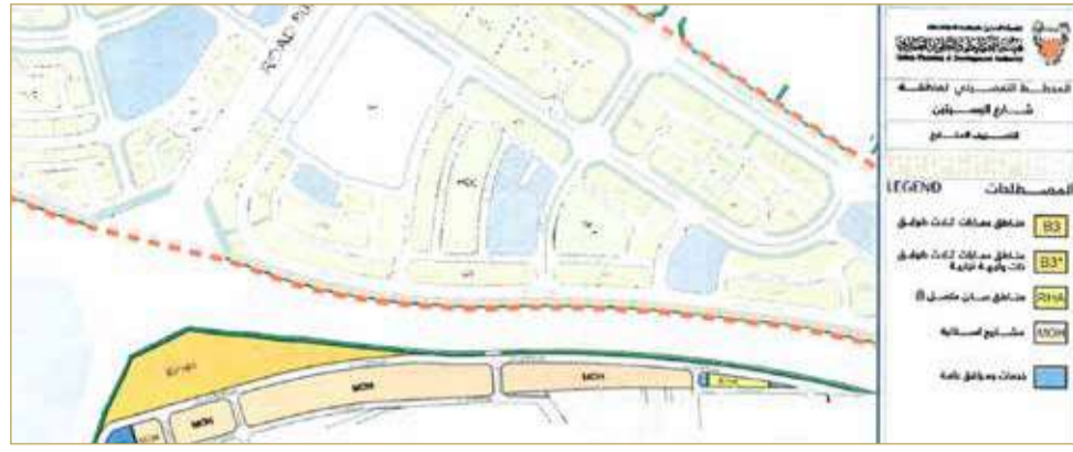
المخطط التفصيلي للمنطقة

أفصح وزير الأشغال وشؤون البلديات والتخطيط العمراني عصام خلف عن تخصيص مواقع ضمن المخطط التفصيلي لشارع البسيطين بمنطقة شمال الدير لمشروعات إسكانية.