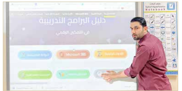
عرض الدليل التدريبي

شاركت 50 مدرسة حكومية في تدشين دليل للبرامج التدريبية المعززة للتمكين الرقمي، والذي يتضمن أكثر من 100 ورشة تدريبية مسجلة مقسمة إلى 6 مجالات مختلفة، وهي: البوابة التعليمية، والأدوات الرقمية التعليمية، والمختبرات التعليمية، والمحتوى التعليمي الرقمي، والاستعمال الآمن للتكنولوجيا، وأدوات مايكروسوفت 365. وأشرف على هذا المشروع فريق