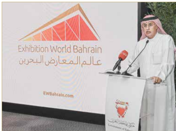
الزباني متحدثاً في المؤتمر الصحافي أمس

◆ بدء المرحلة الثانية من مركز المعارض نهاية العام الجاري