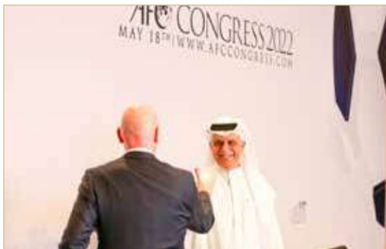
رئيس الاتحاد الدولي مصافحاً سلمان بن إبراهيم