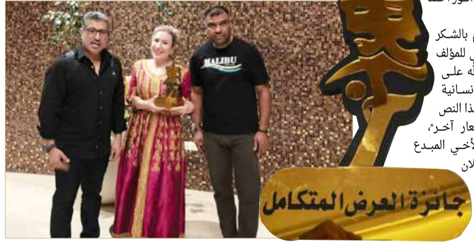
جائزة العرض المتكامل

لـ "البلاد": في البداية أتقدم بالشكر والتهنئة لفريق العمل للمؤلف عبدالناصر فتح الله على ما قدمه من حالة إنسانية عالية من خلال هذا النص الرابع "حتى إشعار آخر"، والتهنئة الأخرى لأخي المبدع المخرج جمال الغيلان على استعداده هذه الحالة وتنفيذها بدقه مستعينا بفنانة جميلة مثقفة