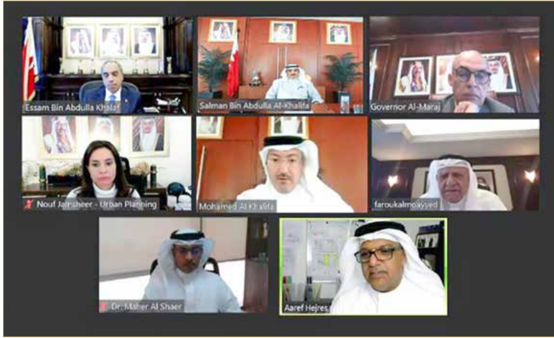
مجلس إدارة مؤسسة التنظيم العقاري عن بُعد

كما اطلع المجلس على آخر ما توصلت له الخطة الوطنية للقطاع العقاري، التي تحتوي على 5 ركائز وما تم التوصل له في عملية تنفيذ وتطوير النقاط التي تحتويها هذه الركائز، ومن مراحل إنجاز للمبادرات والمشاريع التي تحتوي