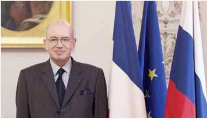
الخارجية الروسية استدعت سفراء فرنسا وإسبانيا وإيطاليا

إلا أن دي مايو رأى أن خطوة الروس اليوم بطرد دبلوماسيه غير مبررة. بدوره، نددت باريس بشدة "بهذا الطرد، معتبرة أن القرار الروسي لا يستند إلى أي أساس شرعي". وقالت وزارة الخارجية في بيان "يقدم الجانب الروسي هذا القرار على أنه رد على قرارات فرنسا" المتخذة في أبريل عندما طردت "العشرات من العملاء الروس" الذين يشته في أنهم جواسيس. كما أضافت "عمل الدبلوماسيين والموظفين في السفارة الفرنسية في روسيا يندرج بخلاف ذلك، في