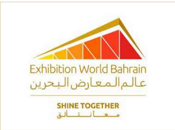
شعار الهوية الجديدة للمركز

◆ الهوية الجديدة تستلهم التراث البحريني والعربي وتجسد شعار "تحت سقف واحد"