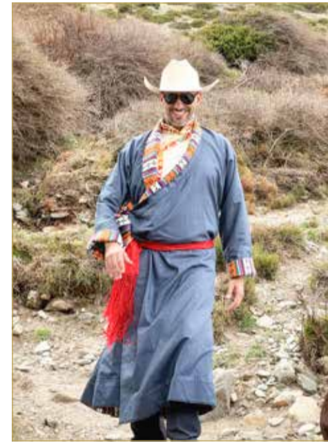
لباس الشيربا التقليدي