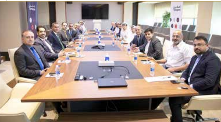
اللقاء مع عدد من المؤسسات العاملة بقطاع الخدمات اللوجستية

على إثر إعادة إطلاق باقة البرامج المستحدثة مطلع العام الجاري، وبدء استقبال طلبات الدعم في برامج تمكين الموجهة للمؤسسات والأفراد. كما تهدف هذه العملية لضمان الاستثمار في دعم جميع القطاعات، لاسيما القطاعات الواعدة التي تساهم بشكل أكبر في تطوير الاقتصاد الوطني، وخلق فرص عمل للبحرينيين، وذلك انسجاماً مع الأولويات الوطنية وإستراتيجيات خطة التعافي الاقتصادي التي أطلقتها مملكة البحرين في نوفمبر من العام الماضي.