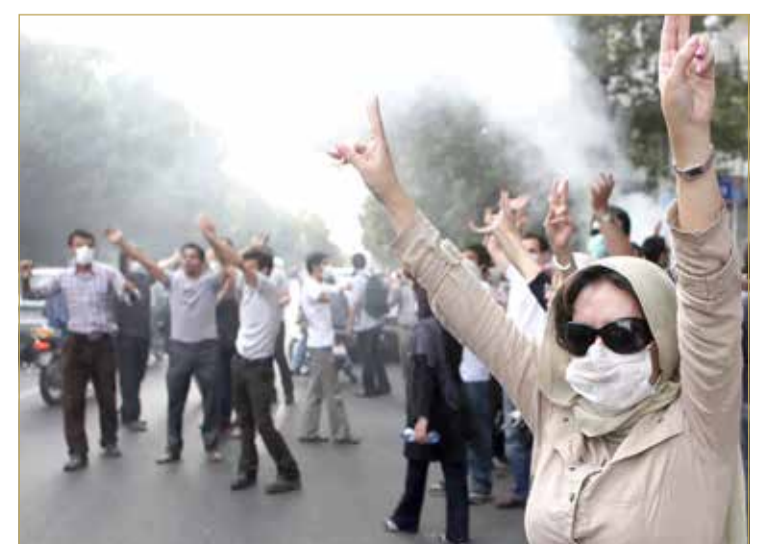
جانب من التظاهرات في إيران