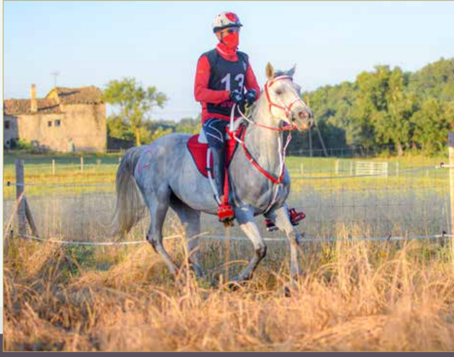
سمو الشيخ ناصر بن حمد خلال التدريبات