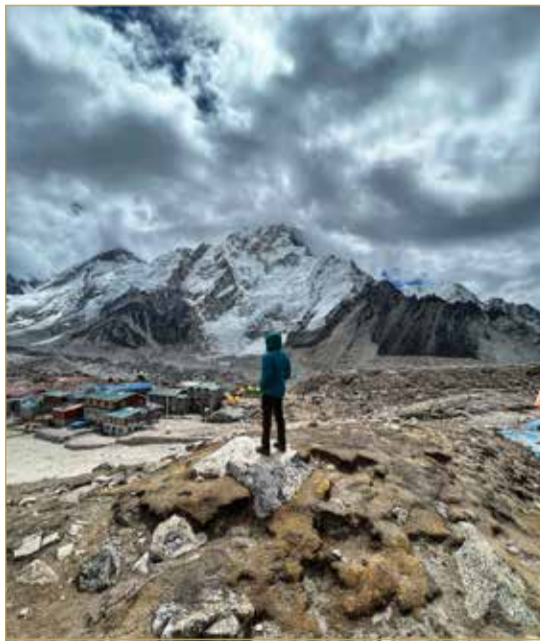
فورك شيب وهي المحطة الأخيرة قبل الوصول إلى سفح جبل إيفرست

وعن تجربته في محطات الرحلة للسفح أعلى جبل في العالم قال "بقينا في بعض المحطات وقرى الجبل ليلتان حتى نتأقلم أجسادنا على الارتفاع؛ لمحاولة الوصول إلى ارتفاع أعلى ثم نعاود الهبوط إلى محطات أقل انخفاضا وذلك لتهيئة الجسم إلى قلة الاكسجين كلما زاد الارتفاع". وأضاف "غلبت على مغامرة التسلق الظروف المناخية ودرجات الحرارة المنخفضة والتي كانت تحديا كبيرا واجه أعضاء الفريق، كما كانت الظروف الحياتية في القرى على الجبل صعبة جدا وخلافا للتوقعات، حيث لا تتوفر فيها أبسط الاحتياجات اليومية كالمياه الدافئة ودورات المياه المجهزة، كما أن هذه القرى تعتمد على الطاقة الشمسية