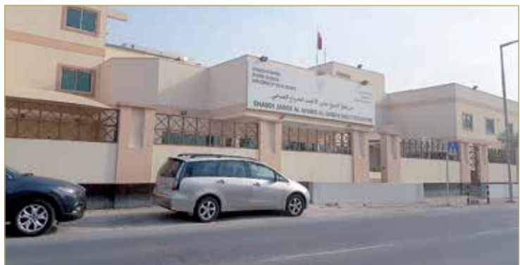
واجهة المركز من الخارج

وأكد الوداعي أهمية هذا المشروع بالنظر إلى حجم الشريحة التي يخدمها، إذ يوفر المركز خدماته إلى 48 مجمعا سكنيا تضم شريحة سكانية تصل إلى نحو 50 ألف نسمة تقريباً.