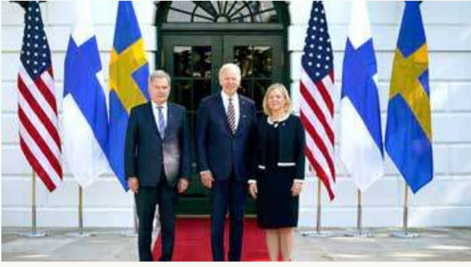
بايدن ملتقياً رئيسة وزراء السويد والرئيس الفنلندي

في الشق الاقتصادي، يعقد وزراء المال في مجموعة السبع اجتماعات يومي الخميس والجمعة في ألمانيا سيدرسون خلالها تداعيات الحرب التي شنتها موسكو منذ نحو ثلاثة أشهر، على الصعيد العالمي. ويبدو جدول أعمال وزراء مالية الدول الصناعية السبع (الولايات المتحدة واليابان وكندا وفرنسا وإيطاليا