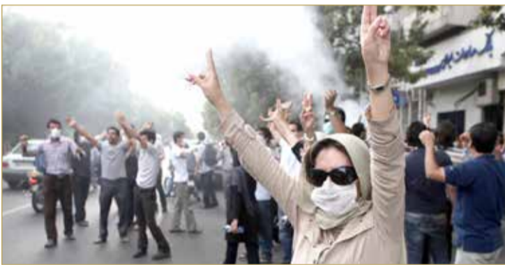
جانب من التظاهرات في إيران

أطلقت قوات الأمن الإيرانية الذخيرة الحية والغاز المسيل للدموع لتفريق محتجين مناهضين للحكومة في عدة أقاليم أمس الخميس، بحسب منشورات على مواقع التواصل الاجتماعي فيما تتواصل الاحتجاجات على ارتفاع أسعار المواد الغذائية. ونزل الإيرانيون إلى الشوارع الأسبوع الماضي بعد أن تسبب خفض دعم الغذاء في ارتفاع الأسعار بنسبة تصل إلى 300 % لبعض المواد الغذائية الأساسية التي تعتمد على الدقيق. وسرعان ما اكتسبت الاحتجاجات منحى سياسياً، إذ دعت الحشود إلى نهاية الجمهورية الإسلامية في تكرار للاضطرابات التي وقعت العام 2019 وانطلقت شرارتها بسبب ارتفاع أسعار