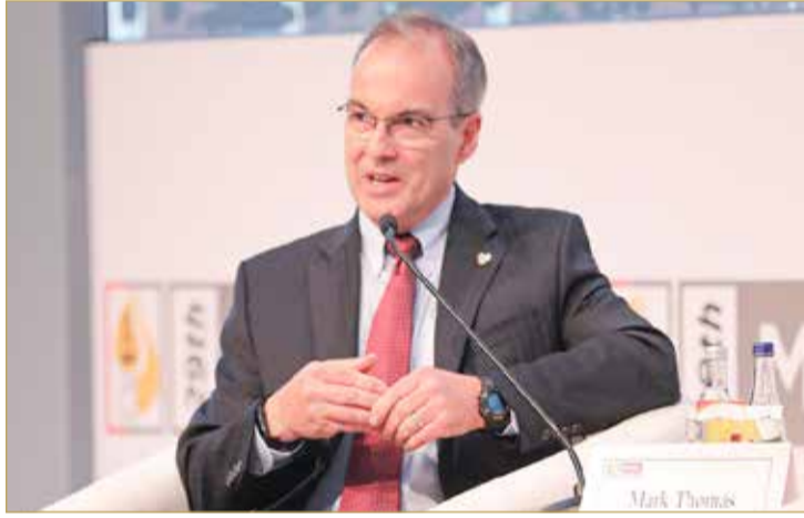
الرئيس التنفيذي لـ “القبضة للنفط والغاز” مشاركاً في المؤتمر

◆ مؤتمر الشرق الأوسط للبترول والغاز أحد أعرق المؤتمرات بالقطاع