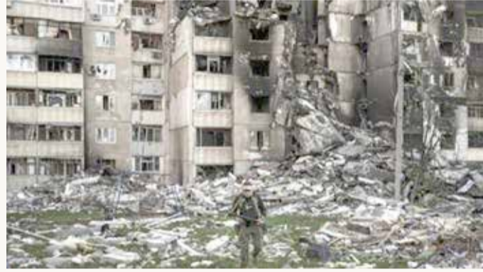
جانب من القصف الروسي على أوكرانيا

وبريطانيا وألمانيا)، مثقلاً بالمواضيع من التضخم المرتبط خصوصاً بارتفاع أسعار موارد الطاقة والتهديدات بأزمة غذائية وشبح تراكم الديون في العديد من الدول النامية. والمسألة الأهم هي تغطية الميزانية الأوكرانية في الفصل الراهن للحفاظ على جهود الصمود في مواجهة الحرب.