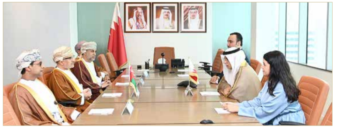
اللقاء بين الجانبين البحريني والعماني