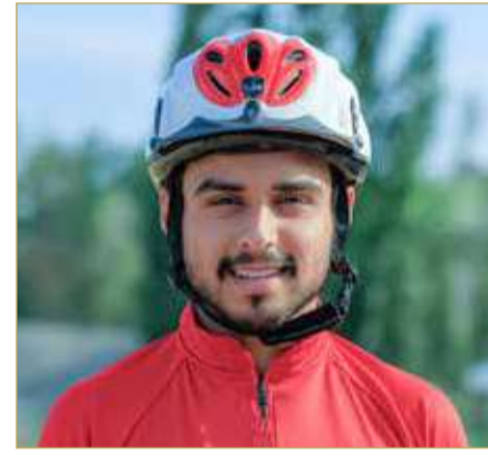
سمو الشيخ عيسى بن فيصل بن راشد

راشد آل خليفة أن دعم ومتابعة سمو الشيخ ناصر بن حمد آل خليفة يعطي الفرسان حافزاً كبيراً لتقديم أفضل المستويات، مبيناً أن الفريق سيسعى لتقديم أفضل المستويات وتأكيد ريادته في الساحة الأوروبية. وأشار سمو الشيخ عيسى بن فيصل بن راشد آل خليفة إلى أن الفريق الملكي يسير بخطى ثابتة نحو مواصلة الازدهار والتطور في الساحة الأوروبية بعد أن حقق العديد من الإنجازات في الفترة الماضية بفضل رؤية ودعم سمو الشيخ ناصر بن حمد آل خليفة.