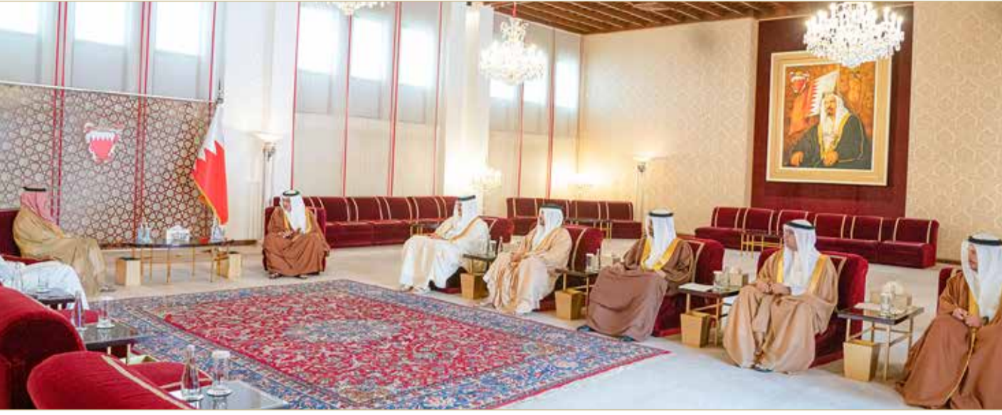
سمو ولي العهد رئيس مجلس الوزراء يستقبل رئيس مجلس إدارة شركة أكوا باور