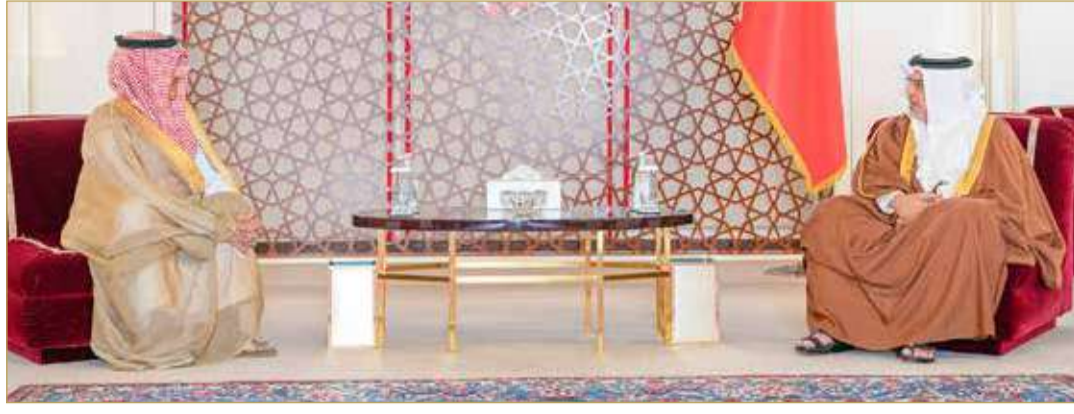
سمو ولي العهد رئيس مجلس الوزراء يستقبل رئيس مجلس إدارة شركة أكوا باور