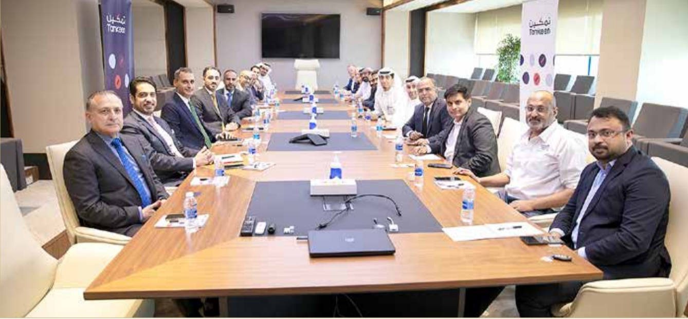
اللقاء مع عدد من المؤسسات العاملة بقطاع الخدمات اللوجستية

انطلاقاً من إستراتيجية صندوق العمل “تمكين” القائمة على تطوير أداء القطاعات الاقتصادية المختلفة، وتعزيز مساهمتها في رفد الاقتصاد الوطني، عقد “تمكين” لقاء مع عدد من المؤسسات العاملة في قطاع الخدمات اللوجستية لبحث فرص نمو هذا القطاع، وتحفيز المؤسسات على توظيف الدعم الذي تتيحه تمكين في الاستثمار والتوظيف والتدريب بما يساهم في الارتقاء بإنتاجية واستدامة أعمال هذه المؤسسات وتنفيذ خططها في التوسع والتطوير. وتأتي هذه اللقاءات كجزء من جهود “تمكين” المستمرة في تفعيل أطر الشراكة مع القطاع الخاص، من خلال التواصل المباشر مع الشركات الممثلة لمختلف القطاعات، وذلك على إثر إعادة إطلاق باقة البرامج المستحدثة مطلع العام الجاري، وبدء استقبال طلبات الدعم في برامج تمكين الموجهة للمؤسسات والأفراد. كما تهدف هذه العملية لضمان الاستثمار الواعدة التي تساهم بشكل أكبر في تطوير الاقتصاد الوطني، وخلق فرص عمل للبحريين، وذلك انسجاماً مع الأولويات الوطنية وإستراتيجيات خطة التعافي الاقتصادي التي أطلقتها مملكة البحرين في نوفمبر من العام الماضي. ونظمت تمكين عدداً من اللقاءات مع أكثر من 200 شركة من مختلف القطاعات وذلك قبيل طرح البرامج؛ بهدف التعرف بشكل وثيق على احتياجات المؤسسات في ظل متغيرات السوق المستمرة، والتأكد من تصميم الحلول المناسبة التي من شأنها تلبية هذه الاحتياجات وفقاً للأولويات الإستراتيجية لتمكين وأهدافها الرئيسية.