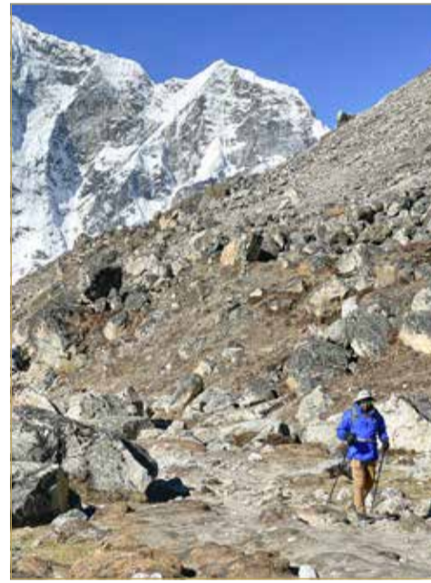
تضاريس متنوعة خلال المغامرة