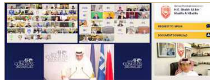
جانب من مشاركة الزعبي

عملية تقديم ملفات الترشيح عبر إدارة الاتحاد الآسيوي لكرة القدم، وسيتم الإعلان عن المزيد من التفاصيل بخصوص عملية اختيار مضيف كأس آسيا 2023 في الوقت المناسب. كما صادقت الجمعية العمومية على تقارير تدقيق الحسابات المالية لعام 2021، وصادقت على التعديلات المقترحة على النظام الأساس والتي تؤكد على التزام الاتحاد بالحوكمة الرشيدة.