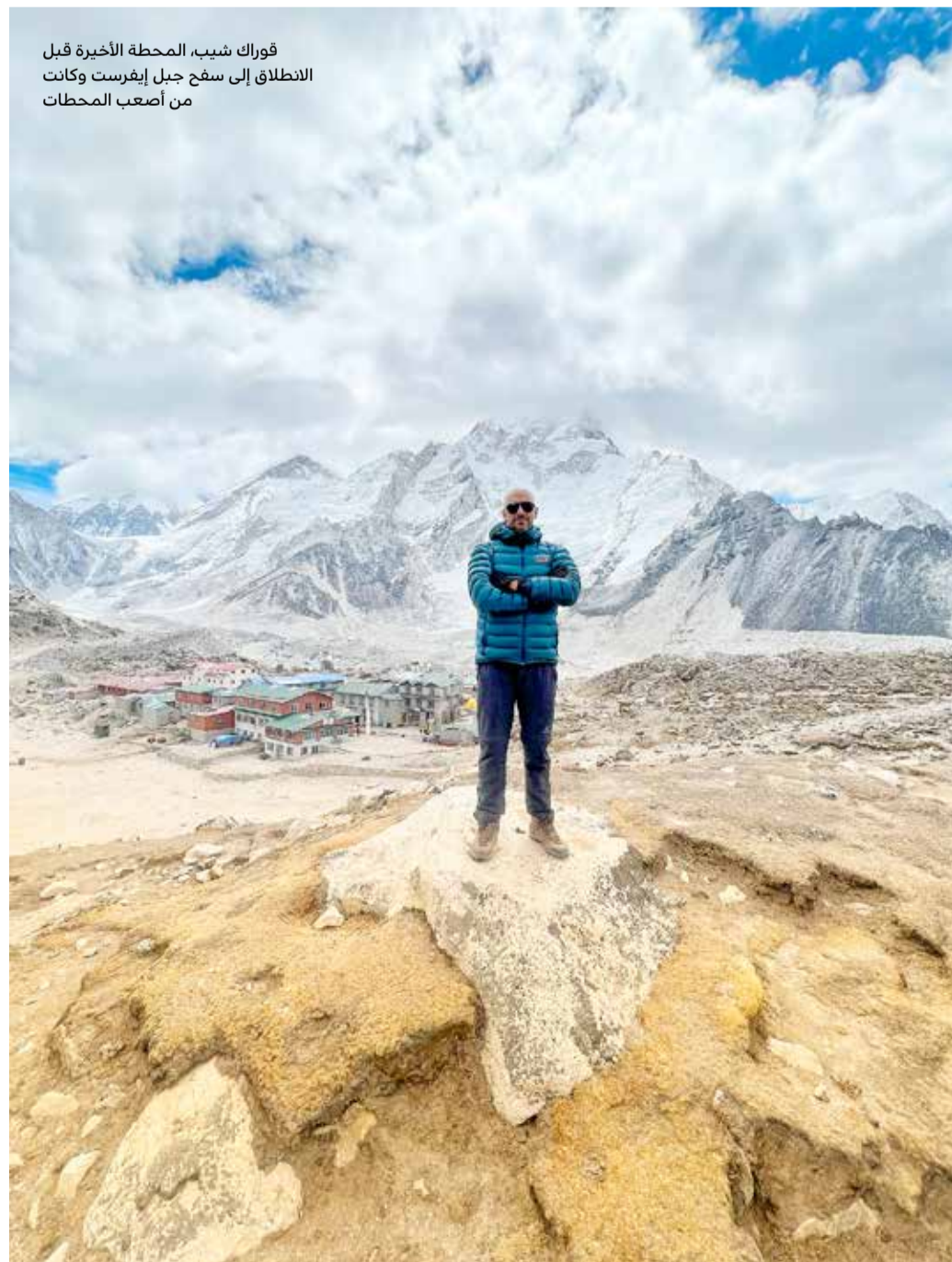
فورك شيب، المحطة الأخيرة قبل الانطلاق إلى سفح جبل إيفرست وكانت من أصعب المحطات

وفي حديثه لـ "البلاد" عن تجربته الأخيرة قال "حققنا هدفنا في الوصول إلى سفح أعلى جبل في العالم ونهدي هذا الإنجاز إلى القيادة الرشيدة وإلى شعب البحرين، في رحلة استغرقت 15 يوما في النيبال، حيث انطلقنا من تاريخ 3 مايو الجاري من العاصمة "كاتمانو" بعدها طيارنا إلى قرية "لوكلا" وفيها أخطر مطار في العالم حيث مدرج الطائرة لا يتجاوز طوله 527 مترا وسط الجبال على ارتفاع 3 آلاف متر".