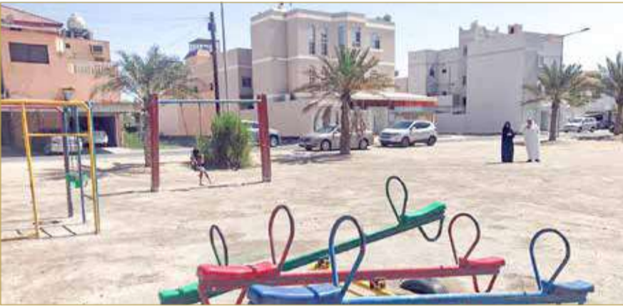
خلال زيارة ميدانية مع مسؤول في البلدية الشمالية