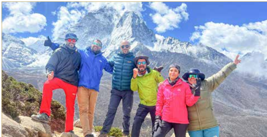
في الخلف قمة اما دابلام وارتفاعها 6812 مترا