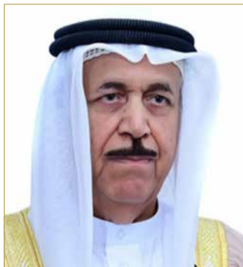
الشيخ عبدالرحمن بن محمد

حدثت فعلاً، إذ إن جميع الدول اليوم فيها مسلمون، وإن من يزور روسيا اليوم يقف باعتراز وإعجاب لانتشار الإسلام فيها، وما لعبه شعب البولغار الذي كانت له دولة قوية في حوض نهر الفولغا في القرنين العاشر والثالث عشر الميلادي، من دور مهم في تاريخ العلاقات بين روسيا والعالم الإسلامي، منوهاً معاليه بالدور الحضاري الذي يضطلع به المسلمون في بناء بلادهم، وكان الشيخ عبدالرحمن بن محمد آل خليفة قد شارك أمس في عاصمة تارتستان في افتتاح أعمال القمة الاقتصادية الدولية "روسيا - العالم الإسلامي: قمة قازان"، التي تُعقد بمشاركة ممثلي 63 دولة و52 منظمة روسية، والتي ستعنى بالاقتصاد التشاركي والمصالح العام للمنتجات الحلال وغيرها من الموضوعات. كما سيقام ضمن فعاليات هذه القمة معرض روسيا حلال إكسبو، ومنتدى بناء الآلات القطاعي، واليوم العالمي للحلال، بالإضافة إلى الأحداث المخصصة للذكرى 1100 لدخول بلغار الفولغا الإسلام.