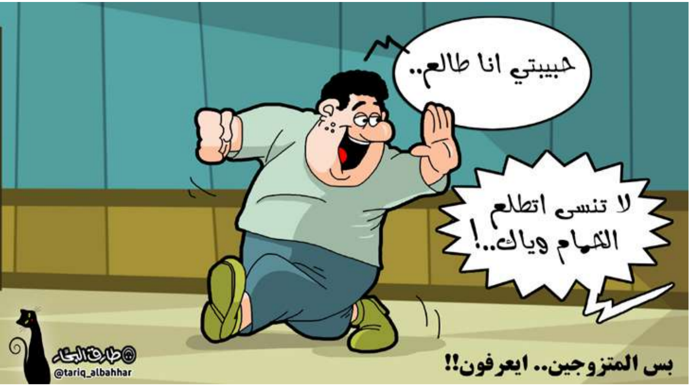
طريق البحار @tariq_albahhar