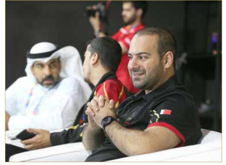
فوزي كانو رئيس الاتحاد يتابع منافسات البادل