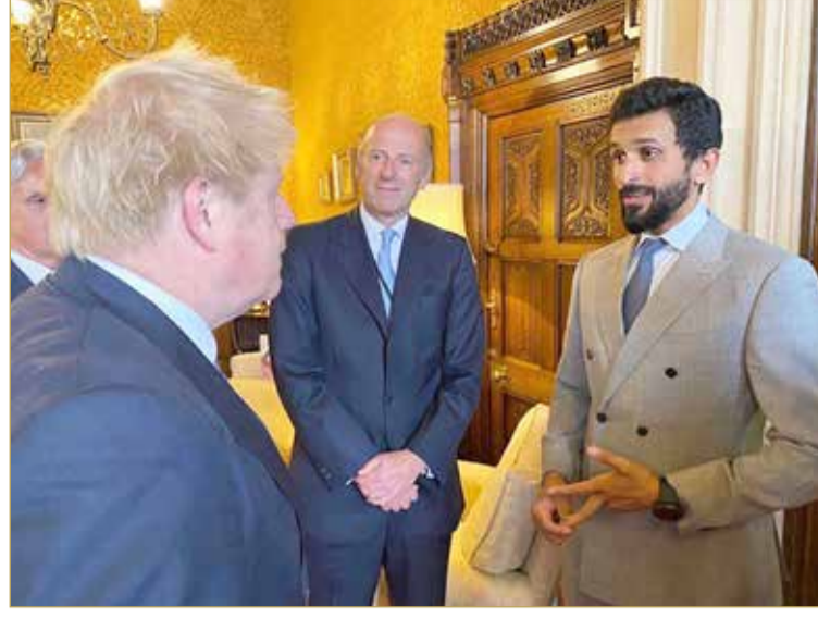
سمو الشيخ ناصر بن حمد لدى لقاء رئيس وزراء بريطانيا