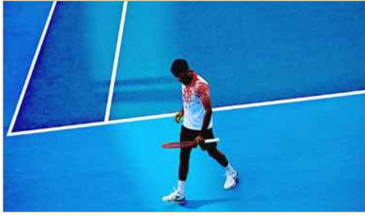
خسارة منتخب التنس الأرضي