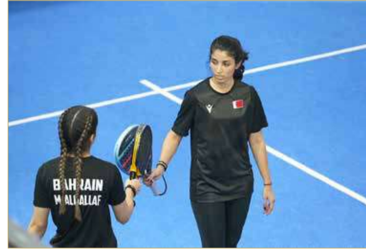
منتخب السيدات للبادل

تقدم المنتخب السعودي بنتيجة الشوط الأول بنتيجة 6/3 و6/3 مقابل 6/0 لصالح منتخبنا. وقد شهد هذا