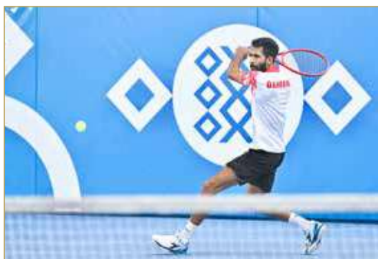
مشاركة منتخبنا بمنافسات التنس الأرضي

وتواصل منافسات التنس الأرضي عندما يلتقي منتخبنا أمام نظيره السعودي الساعة 3:30 على مجمع الشيخ جابر الصباح للتنس.