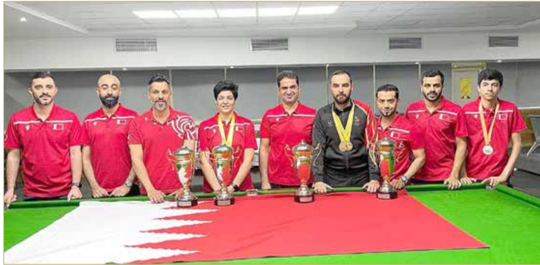
صورة جماعية لرئيس ولاعبي البليارد والسنوكر