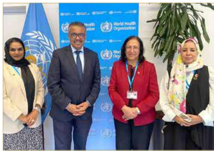
وزيرة الصحة تلتقي بالمدير العام لمنظمة الصحة العالمية في جنيف

تعزيز الخطط والبرامج المستقبلية الكفيلة بمواجهة الفاشيات والأمراض المعدية. ومن جانبه، عبر المدير العام للمنظمة تيدروس أدهانوم غيبريسوس، عن تقديره وشكره لحكومة وشعب مملكة البحرين، وأثنى على جهود المملكة الداعمة لدور منظمة الصحة العالمية، لا سيما في مواجهة هذه الجائحة. ونوّه إلى أن مملكة البحرين معروفة بنجاحاتها في المجال الطبي والرعاية الصحية نتيجة جهود مشكورة وعمل دؤوب تقوم به الحكومة من أجل تعزيز المنظومة الصحية والعلاجية. وأبدى تيدروس استعداده التام لتطوير برامج العمل والخطط والإستراتيجيات الصحية، بما يتناغم مع الأهداف العالمية للصحة.