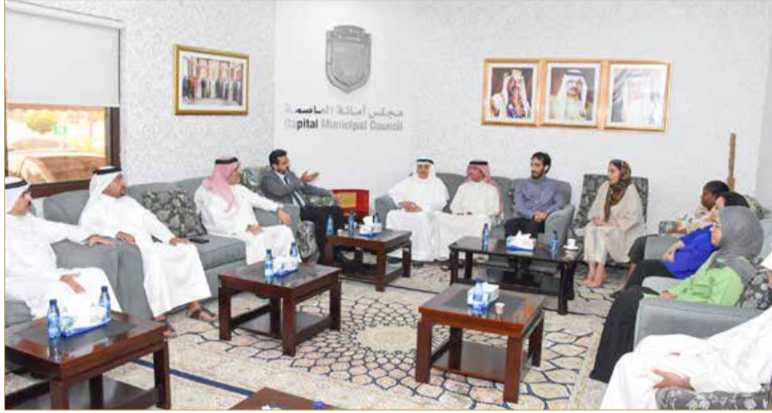
مجلس أمانة العاصمة

أكد رئيس قسم مراقبة الأغذية بوزارة الصحة فيصل الساري وجود 26 مفتشاً بالقسم مسؤولون عن تفتيش أكثر من 20 ألف منشأة غذائية بجميع أنواعها في مملكة البحرين، موضحاً أن هناك 4 آلاف منشأة غذائية جديدة يتم الترخيص لها سنوياً.