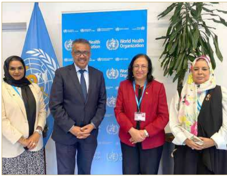
وزيرة الصحة تلقي بالمدير العام لمنظمة الصحة العالمية في جنيف