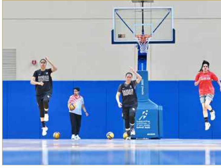
تدريبات منتخب السلة الثلاثة