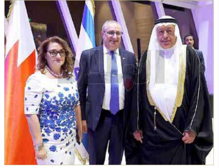
البلاد | محرر الشؤون المحلية

والدبلوماسية والاقتصادية وممثلي المجتمع المدني. وهذا هو الحفل الأول من نوعه للسفارة منذ افتتاحها بالمنامة في سبتمبر 2021.