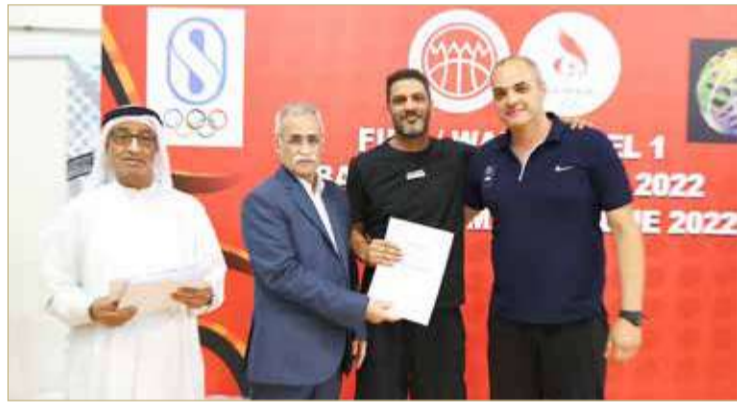
جانب من ختام الدورة

واشتملت الدورة على عدد من المحاضرات النظرية والورش العملية المتنوعة التي تناولت جوانب هامة في تدريب كرة السلة وأبرزها التخطيط والتعليم، أسس الهجوم والمهارات