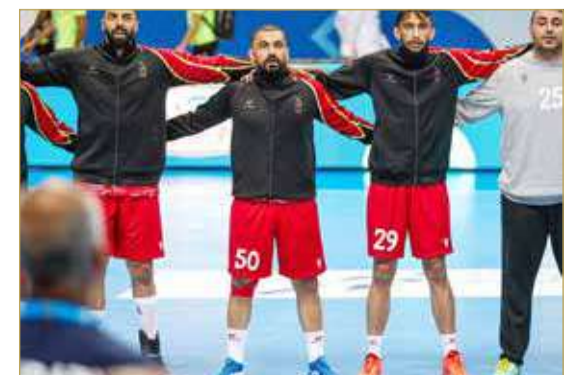
منتخب كرة اليد