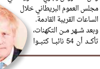
ووجه ذلك بعدما أرسل العدد المطلوب من أعضاء البرلمان عن حزب المحافظين خطابات تدعو إلى تنحيته. ومن المقرر أن يجري التصويت في مجلس العموم البريطاني خلال الساعات القريبة القادمة. وبعد شهر من التكهات، تأكد أن 54 نائبا كتبوا