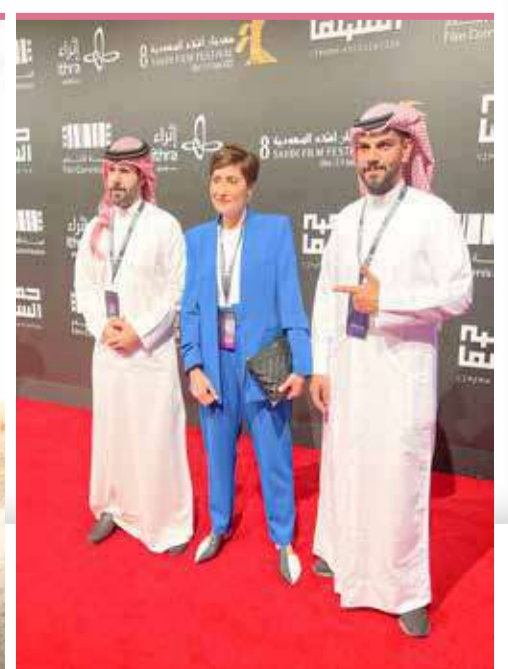
فيلم "جوي" من عبق جدة التاريخية