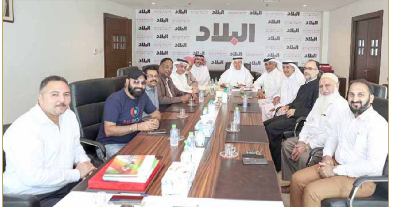
صورة جماعية للحاضرين باللقاء