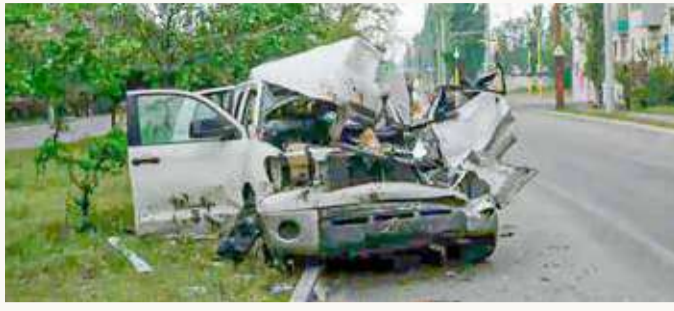
من سيفيرودونيتسك شرقي أوكرانيا (أ ب)

كما أضاف في منشور على حسابه الخاص على تلغرام أن "المفوضية الأوروبية تبنت الحزمة السادسة؛ بهدف تمزيق الاقتصاد الروسي إلى أشلاء، لكن الواضح أن الهدف افتعال حريق ثورة عالمية في الاقتصاد". وقال: "لا توجد وسيلة للتخلي عن نفطنا بسهولة؛ لذا سيتعين على الأوروبيين الآن البحث في العالم عن مواد خام من نفس الجودة. وبذلك سيواجهون نقصاً في أنواع معينة من الوقود، مثل الديزل اللازم للشاحنات والمعدات الزراعية".