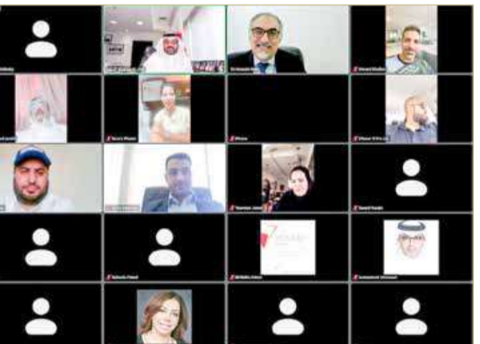
اجتماع العمومية تم بُعد

الفترة القادمة على تكثيف اجتماعاتها من أجل التوصل إلى حلول لأي مشاكل تواجه أعضاء الجمعية العمومية للجمعية، والعمل على زيادة الفعاليات واللقاءات لتوفير أكبر استفادة للأعضاء.