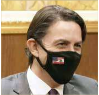
هوكستين مطلوب لبنان على وجه السرعة

بحث الرئيس اللبناني ميشال عون مع رئيس حكومة تصريف الأعمال نجيب ميقاتي، أمس الإثنين، الخطوات الواجب اتخاذها لمعالجة التوتر مع إسرائيل على الحدود البحرية الجنوبية، فيما قالت الخارجية اللبنانية إن البلاد "لا تريد الحرب" مع إسرائيل. وقال بيان صادر عن مكتب ميقاتي: "في إطار متابعة تطورات التحركات البحرية التي تقوم بها سفينة وحدة إنتاج الغاز الطبيعي المسال (إنبريجان باون) قبالة المنطقة البحرية المتنازع عليها مع إسرائيل في جنوب لبنان، توافقت فخامة الرئيس ودولة الرئيس على دعوة الوسيط الأميركي أموس هوكشتاين للحضور إلى بيروت؛ للبحث في