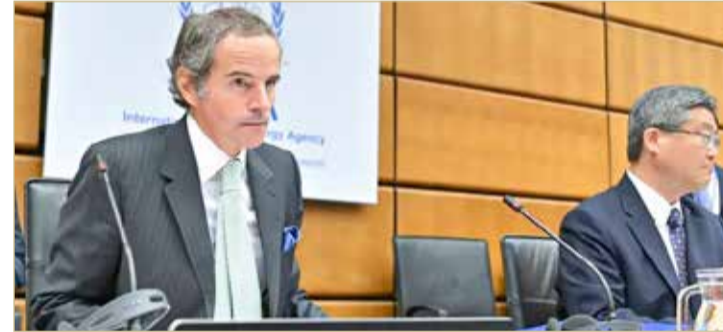
غروسي في اجتماع أمس بفيينا

أكد مدير وكالة الطاقة الذرية، رافايل غروسي، أن عمل مفتشي الوكالة تأثر بشكل كبير في إيران خلال الأشهر الماضية منذ قرار وقف طهران التزاماتها المتعلقة بالاتفاق النووي، في كلمة افتتاحية أمام مجلس محافظي الوكالة بفيينا، أمس الاثنين، أن إيران لم تقدم أجوبة شافية حول العثور على آثار يورانيوم في 3 أماكن سرية. كما رأى أن السلطات الإيرانية لم تتعاون وتوضح الغموض الذي لف تلك المواقع، وحثها على تقديم الإجابات الواضحة دون تأخير لحل المسائل العالقة، وقال: على إيران التعاون من دون تأخير لحل المسائل العالقة وإلا فلن تكون الوكالة قادرة على منح ضمانات تؤكد أن برنامجها النووي سلمي حصراً. وفي مؤتمر صحفي لاحق، أكد غروسي