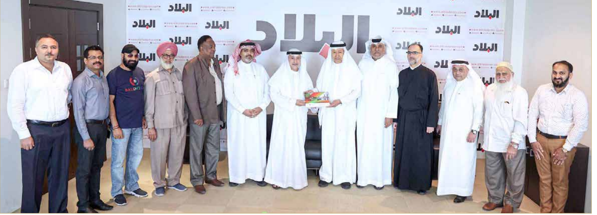
الشعلة يتسلم نسخة من كتاب الجمعية