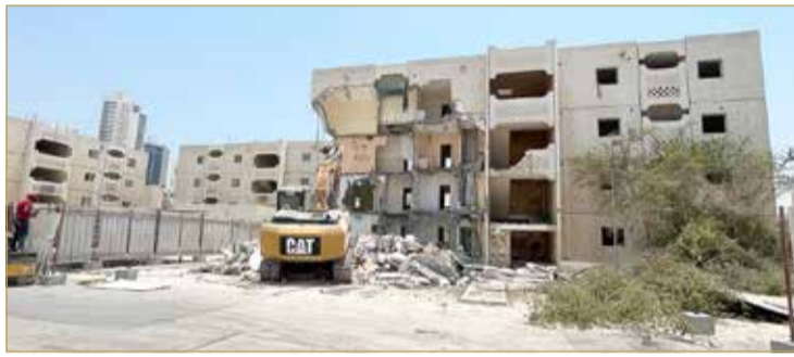
جانب من هدم عمارة بالسنايس

في إطار توجه وزارة الإسكان لهدم جميع العمارات السكنية بمنطقة السنايس بهدف إقامة مشروعات إسكانية حديثة في مجمع 408، رصدت "البلاد" صباح أمس الاثنين، بدء أعمال هدم إحدى عمارات الشقق الإسكانية المؤقتة بمنطقة السنايس. وقال عدد من قاطني العمارات المجاورة التي ما زالت مأهولة بالسكان لـ "البلاد" إن عمليات الهدم تأتي في وقت عادت فيه وزارة الإسكان في الأيام القليلة الماضية إلى الاتصال بمجموعات من الأهالي برفض التسوية لإخلاء الشقق الإسكانية مقابل حصولهم على تعويض شهري بمبلغ 200 دينار بدل