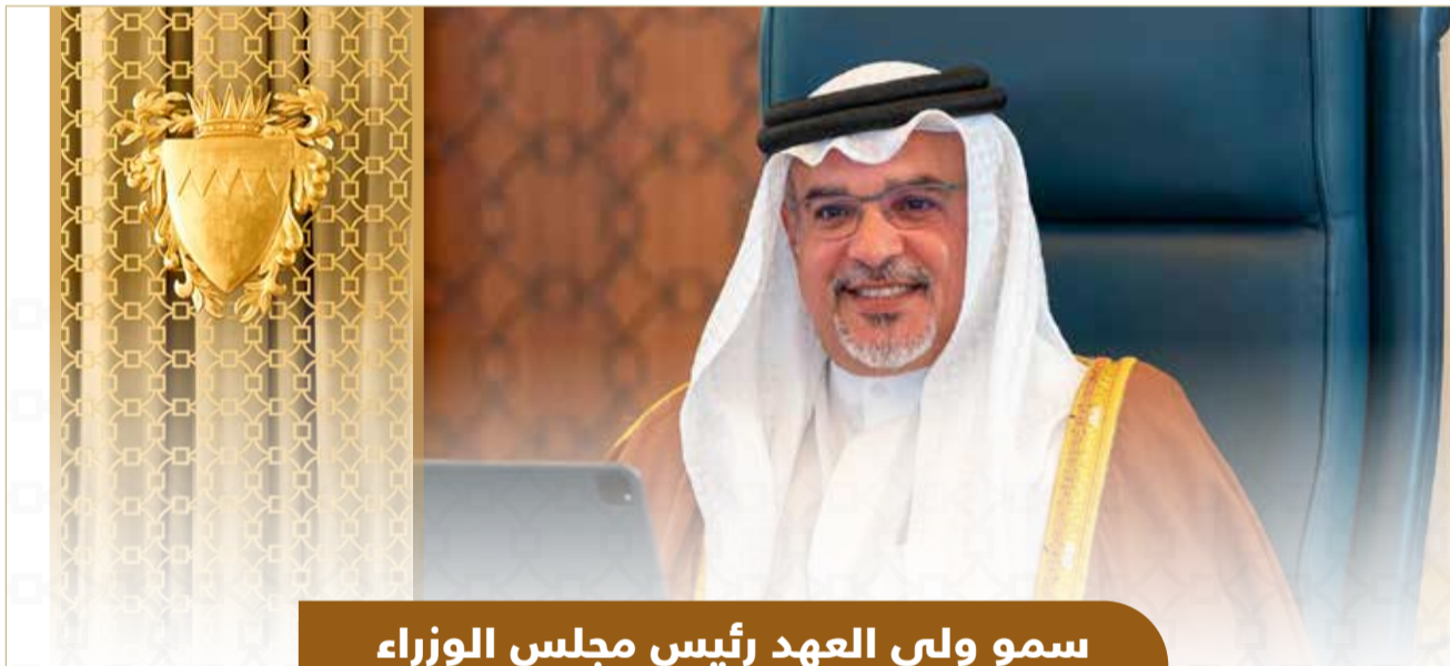
سمو ولي العهد رئيس مجلس الوزراء يترأس جلسة مجلس الوزراء

◆ مساندة جهود إنهاء الحرب في اليمن ودعم التوصل إلى حل شامل