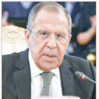
وزير الخارجية الروسي سيرغي لافروف

أضحى بربرياً في تصرفاته. كما أكد أن العلاقة مع بلفراد لن يدمرها أحد، مضيفاً أن إغلاق الدول المجاورة لصربيا المجال الجوي أمام طائرته خطوة غير مسبوقة. إلى ذلك، اعتبر أن دول أوروبا الغربية تضغط على دول الشرق الأوروبي لتصبح عدوة لروسيا. ورأى أن هذا النهج الأوروبي تجاه بلاده وغيرها يؤكد صحة قرار العملية العسكرية الروسية في أوكرانيا. كما اتهم الرئيس الأوكراني فولوديمير زيلينسكي بتنفيذ أجندة الغرب ضد