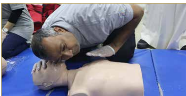
تطبيق عملي بالدورة