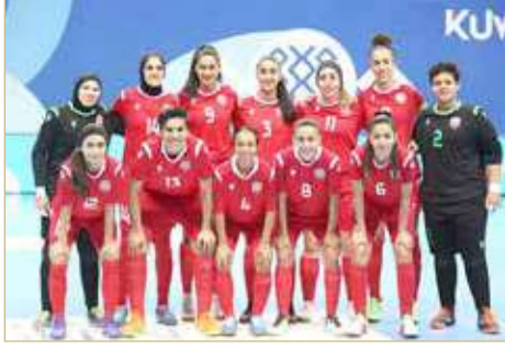
منتخب السيدات لكرة الصالات

يخوض منتخب السيدات لكرة القدم، السبت 18 يونيو الجاري لقاءه الثاني في بطولة اتحاد غرب آسيا الثالثة، والتي تقام منافساتها بمدينة جدة في المملكة العربية السعودية، وتستمر حتى 24 من الشهر الجاري.