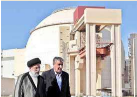
إيران لم تقدم ما يثبت سلمية برنامجها النووي

تمت مراقبته من قبل الجماعات التي تتعقب انتشار المنشآت النووية الجديدة، إلا أن مسؤولي إدارة بايدن لم يتحدثوا عنها علناً، وذكرها وزير الدفاع الإسرائيلي مرة واحدة فقط، في جملة واحدة في خطاب الشهر الماضي. وفي المقابلات التي أجريت مع مسؤولي الأمن القومي في كلا البلدين، كان من الواضح أن هناك تفسيرات متباينة لكيفية اعتزام الإيرانيين استخدام الموقع ومدى إلحاح التهديد الذي يمثله.