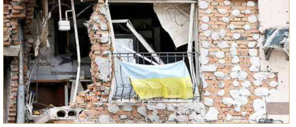
أوكرانيا تسعى بقوة للانضمام إلى الاتحاد الأوروبي

أوصت المفوضية الأوروبية أمس الجمعة بضرورة منح أوكرانيا وضع مرشح الاتحاد الأوروبي، كخطوة أولى على الطريق الطويل نحو عضوية الدولة التي مزقتها الحرب في التكتل الأوروبي. وقالت رئيسة المفوضية أورسولا فون دير لاين في مؤتمر صحفي إن "المفوضية توصي المجلس أولاً بإعطاء أوكرانيا أفقا أوروبياً، وثانياً بمنحها وضع المرشح، وهذا بالطبع شريطة أن تتخذ الدولة عدداً من الإصلاحات المهمة". (08)