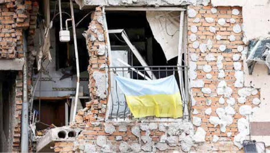
أوكرانيا تسعى بقوة للانضمام إلى الاتحاد الأوروبي

ويُتخذ قرار منح أو رفض وضع المرشح من قبل رؤساء دول وحكومات الاتحاد الأوروبي في القمة التي ستعقد في بروكسل يومي 23 و24 يونيو، مع