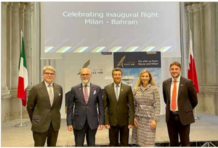
Celebrating inaugural flight Milan - Bahrain

ميلان هي عاصمة منطقة لومباردي ومقاطعة ميلان؛ حيث تحافظ هذه المدينة العالمية على موقعها الريادي الأوروبي كونها مركزاً للمواصلات والصناعات الرئيسية، وهي إحدى أهم مراكز الأعمال في الاتحاد الأوروبي، بالإضافة إلى كونها إحدى المراكز المالية الرائدة في غرب أوروبا في العام 2022