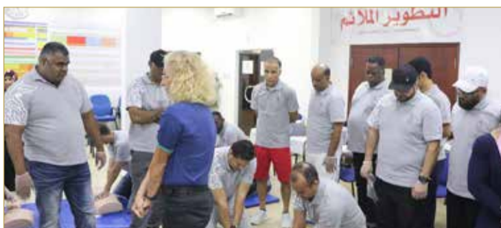
جانب من إحدى دورات الإنعاش القلبي

أهم الدورات التي تنظمها الأكاديمية الأولمبية لاكتساب مهارات الإنعاش القلبي، خصوصاً في ظل تزايد حالات الموت المفاجئ للرياضيين والتي حصدت أرواح العديد من الناس الذين كانوا يزاولون الأنشطة الرياضية سواء الترويحية أو التنافسية، حيث إن تلك الدورة ستساهم في تهيئة أعداد من