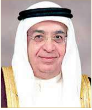
سمو الشيخ محمد بن مبارك