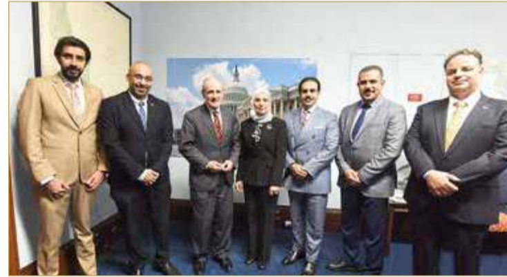
لقاء بحث تنمية العلاقات البرلمانية بين مجلس النواب والكونغرس الأمريكي

الأميركي، والسعي لتوسعة أطر التعاون والتنسيق وتبادل الخبرات، ودعم الجهود الحكومية في البلدين الصديقين، لتنمية الفرص الاستثمارية والتعاون الاقتصادي، ورفع مستوى التبادل التجاري، خاصة في ظل مذكرات التفاهم التي وقعت مؤخراً كثمرة للزيارات النوعية من قبل ولي العهد رئيس مجلس الوزراء صاحب السمو الملكي الأمير سلمان بن حمد آل خليفة للولايات المتحدة الأميركية.