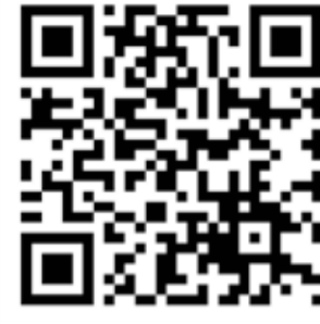
شاهد الفيديو عبر قناة "البلاد" باليوتيوب