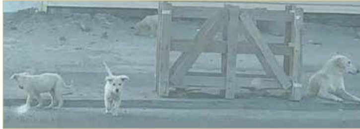
الكلاب الضالة بعدسة المواطن السعيد