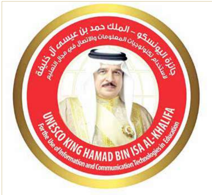
شعار جائزة اليونسكو - الملك حمد لاستخدام تكنولوجيا المعلومات والاتصال في التعليم

التعليم وجودته، امتدت لتشمل أكثر من (1.5) مليون مدرسة و(240) مليون طالب و(8.5) مليون معلم، حيث تم توفير برامج التعلم الرقمي من خلال وسائل الإعلام المتنوعة، بما في ذلك التلفزيون والراديو ومنصات الانترنت للطلاب والمعلمين، مع مراعاة الاحتياجات الخاصة للطلاب ذوي الإعاقة، والطلاب في المناطق الريفية في الهند. أما المشروع الآخر الفائز في الدورة الحالية، وهو مشروع (أوبونجو: أكبر فصل دراسي رقمي في أفريقيا) المقدم من مؤسسة أوبونجو من تنزانيا، الذي انطلق عام 2014م، فقد ساهم في إعداد أكثر من (300) مادة تلفزيونية وإذاعية بثماني لغات محلية في (18) دولة أفريقية تقع جنوب الصحراء الكبرى، بهدف توفير محتوى تعليمي فعال وممتع للأطفال في سن المدرسة وأولياء أمورهم، باستخدام وسائل الترفيه والتقنيات، وتوجيهه خصوصاً للأطفال اللاجئين والأطفال الذين يتعافون من الصدمات.