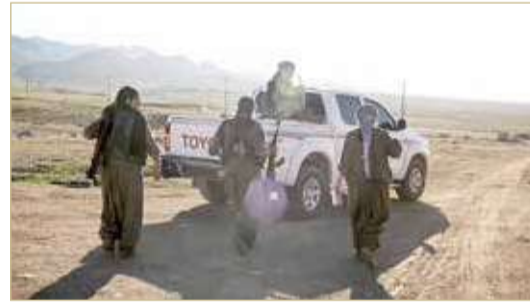
عناصر من حزب العمال الكردستاني في سنجار

لاستهداف مبنى "يستخدم مجمعاً لحزب العمال الكردستاني" في سنجار. وتعليقاً على الغارة، دانت وزارة الخارجية العراقية "بأشد العبارات" القصف التركي الذي استهدف "مقاراً حكومية ومنازل في ناحية سنوي في قضاء سنجار بمحافظة نينوى".