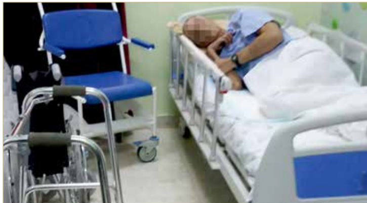
أوضاع زوجها الصحية تفاقمت بعد إصابته قبل بضع سنوات بجلطة