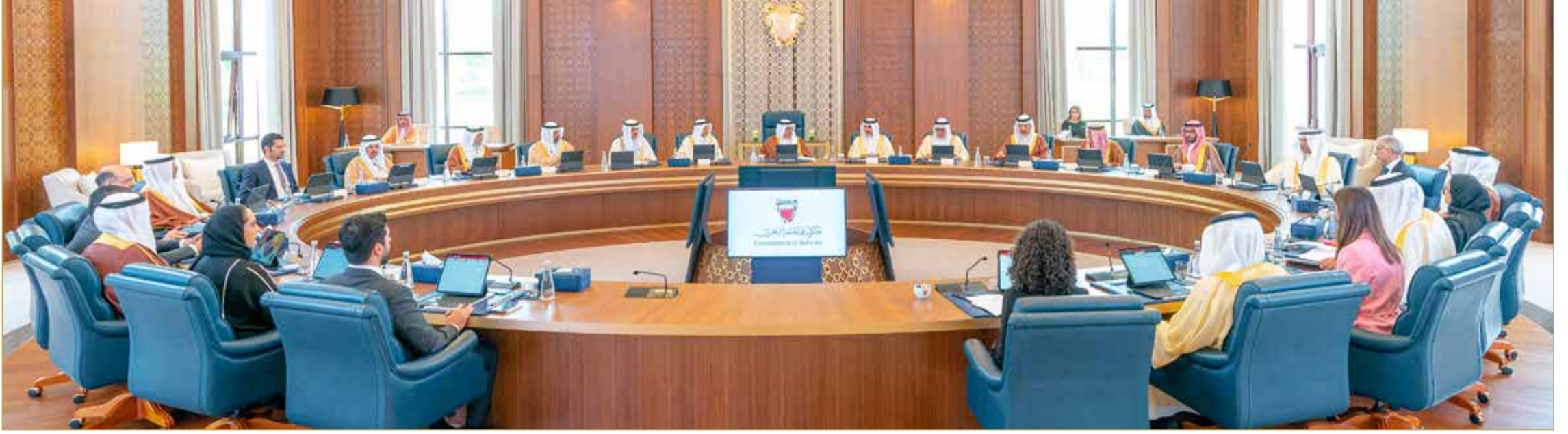
سمو نائب جلالة الملك ولي العهد يترأس الاجتماع الاعتيادي الأسبوعي لمجلس الوزراء