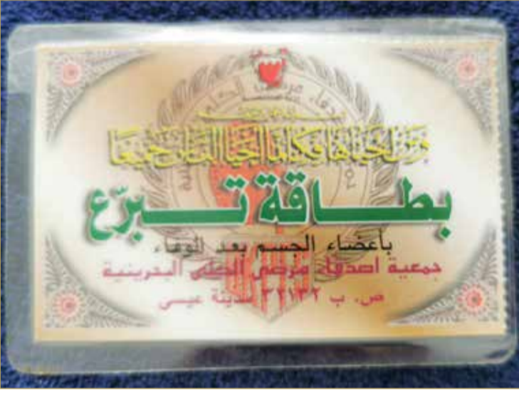
بطاقة تبرع زينب