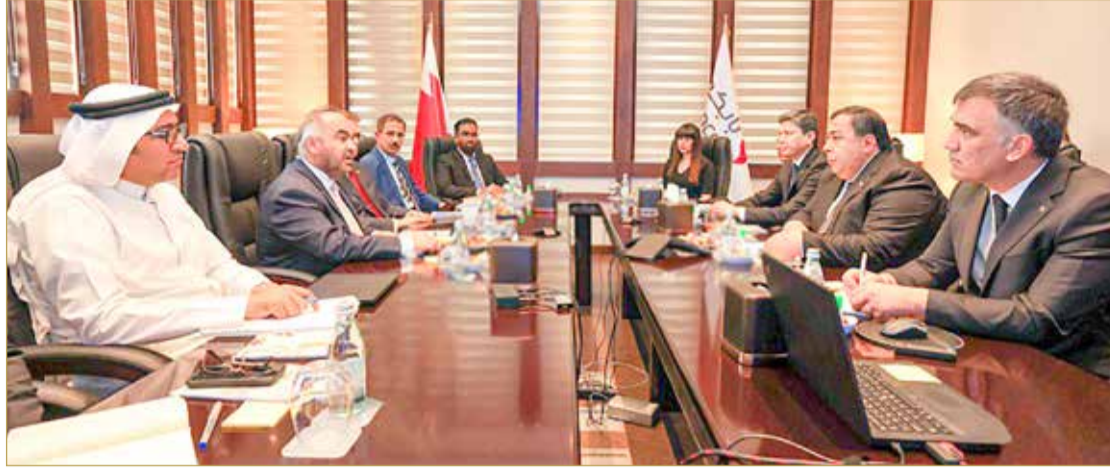
المباحثات بين الجانبين

واتفق الجانبان في ختام الزيارة على القيام بالزيارات وكذلك تبادل الخبرات، بما يسهم في فتح آفاق أوسع للتعاون والتنسيق المشترك بين البلدين الصديقين.