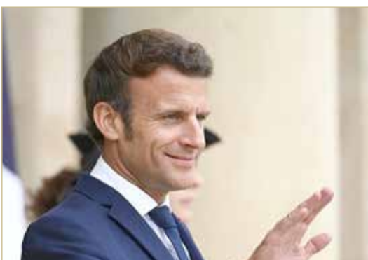
الرئيس الفرنسي إيمانويل ماكرون

تواجه حكومة الرئيس الفرنسي، إيمانويل ماكرون، اقتراعاً لسحب الثقة الشهر المقبل بعد أن فشل الرئيس في الفوز بأغلبية مطلقة في الانتخابات التشريعية يوم الأحد. وصرح تحالف الاتحاد الشعبي البيئي والاجتماعي اليساري الجديد، أمس الإثنين، أنه يخطط لطرح اقتراع لسحب الثقة من تجمع "أنسامبل"، الذي يتزعمه ماكرون. وقد فاز "أنسامبل" بـ 246 مقعداً، أي بأقل مما كان مطلوباً للأغلبية بـ 43 مقعداً، وكان إجماع منظمات الاقتراع الفرنسية الرئيسية على أن تحالف ماكرون ربما يستطيع أن يحقق ما يتراوح ما بين 255 و295 مقاعد الجمعية البالغ عددها 577 مقعداً، لهذا جاء أداء "أنسامبل" أقل من أسوأ التوقعات.