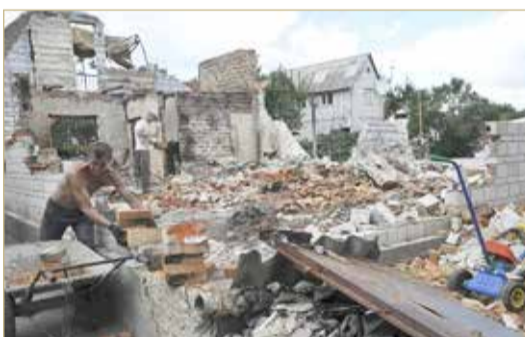
القصف الروسي تسبب بدمار أبنية في ضواحي كييف

"أونيكس" مطار أرتسيز في منطقة أوديسا ودمرت مراكز تحكم الطائرات المسيرة الأوكرانية. وأوضح المتحدث باسم وزارة الدفاع الروسية، الفريق، إيغور كوناشينكوف، خلال إحاطة إعلامية أن القوات المسلحة الروسية قامت بقصف مطار أرتسيز بمقاطعة أوديسا بصاروخ عالي الدقة من طراز "أونيكس" ودمرت محطة لتوجيه طائرات "بيردار" المسيرة.