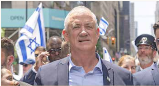
غانس يعلن أن إسرائيل تبني تحالفا للدفاع الجوي بقيادة الولايات المتحدة الأمريكية

وأضاف أن هذه الخطوة من شأنها إحباط محاولات إيران لشن أي هجمات جديدة. كما رأى في إحاطة أمام نواب