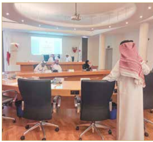
مشاورات منصة الرئاسة قبل فض الجلسة