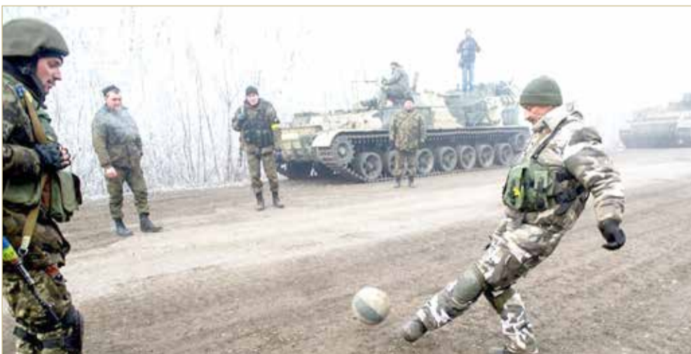
جنود أوكرانيون يلعبون كرة القدم على خطوط الجبهة

إننا لا ندفع لهم، ويتم حرق الصفقات، لا يمكنك تخيل ما يجري. وأضاف: قرار تجديد العقود في يد وكلاء اللاعبين، لكن ذلك لا يعكس رغبة النادي في حماية اللاعبين والاستثمارات.