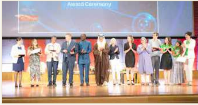
الفائزون بجائزة اليونسكو - الملك حمد