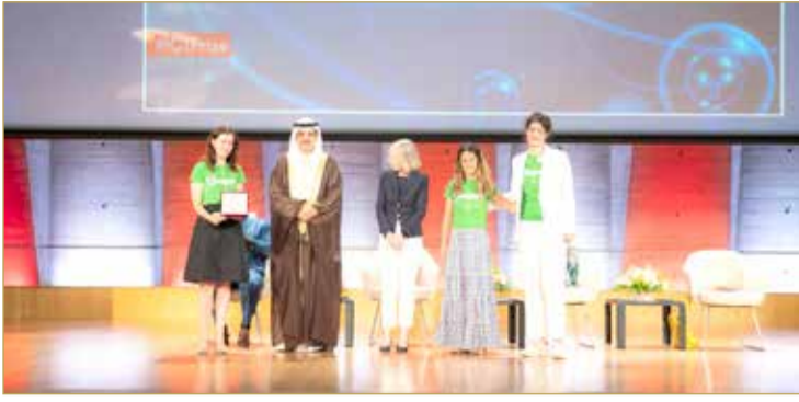
تسليم الجائزة لإسبانيا