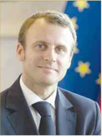
رئيس الجمهورية الفرنسية