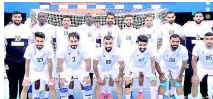
فريق النجمة لكرة اليد

ووضعت إدارة الفريق السعودي عينها على الصياد، بسبب إلمامها بقيمته ومكانته الكبيرتين من خلال وجوده بالدوري السعودي لسنوات طويلة، ما من شأنه أن يصب لمصلحة فريقها الساعي للدفاع عن الألقاب التي حققها بالموسم المنصرم منها بطولتي كأس الأمير سلطان بن فهد والنخبة واحتلاله المركز الثاني للدوري، بالإضافة لامتلاكه مشاركة مهمة للغاية متمثلة في كأس العالم للأندية "سوبر غلوب" في شهر أكتوبر المقبل.