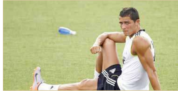
رونالدو مستمر في العطاء والنجومية في عمر 37

يحدث في العصر الحالي على ما يبدو ارتفاع في متوسط عمر اللاعبين على المستطيل الأخضر. يقول الطبيب أحمد مسعد اختصاصي التغذية العلاجية، إن استمرار اللاعبين حتى سن متأخرة في الملاعب يعتمد على المخزون البدني والبناء الجسدي والتغذية السليمة.