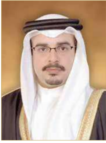
سمو ولي العهد رئيس مجلس الوزراء