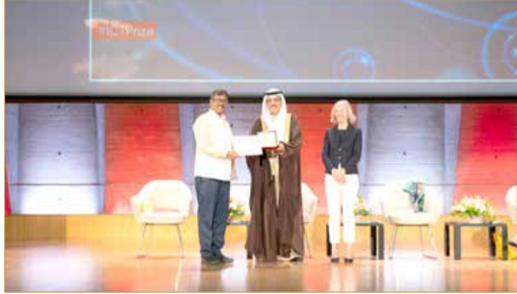
تسليم الجائزة للهند

بعدها قام كل فائز بالجائزة بتقديم عرض موجز عن مبادراته. ثم أهدى الوزير هدية تذكارية للمديرة العامة لليونسكو.