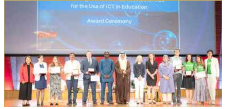
الفائزون بجائزة اليونسكو - الملك حمد