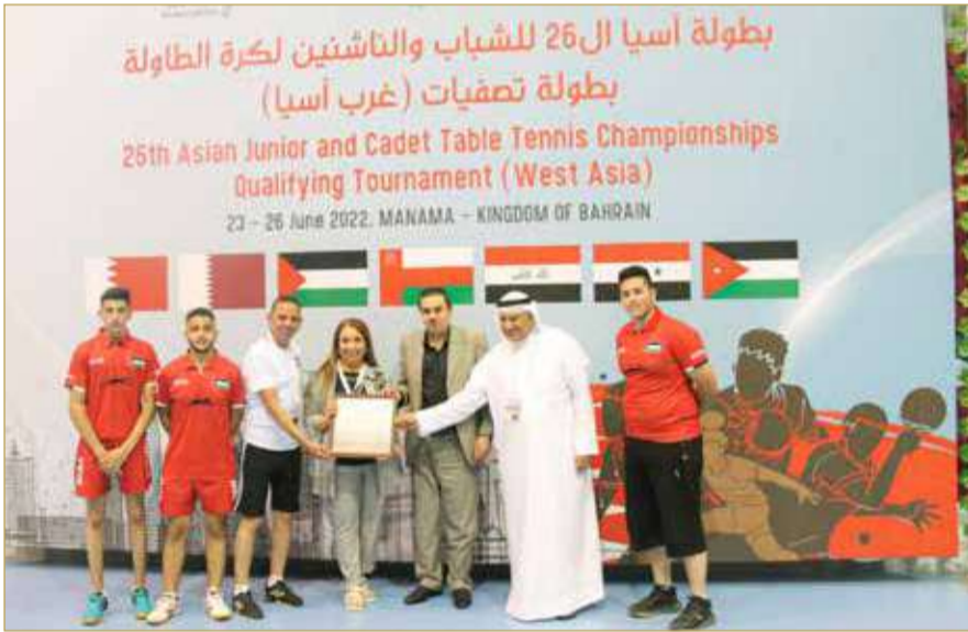
هدية تذكارية من فلسطين

وتواصل اليوم السبت منافسات التصفيات، حيث ستقام مباراتان في الفترة الصباحية، سيلتقي قطر مع العراق، ومنتخبنا سيلعب مع فلسطين، والمباراتان عند الساعة 10:30 على صالة الاتحاد. أما في الفترة المسائية، فسيلتقي منتخبنا للناشئين (الرجال) مع قطر، والمباراة الثانية ستجمع بين العراق وعمان، وفي فئة الناشئات (الفتيات)، ستلعب فتيات البحرين مع سوريا، وفتيات العراق أمام الأردن، وجميع مباريات الفترة المسائية في تمام الساعة 5 مساءً.