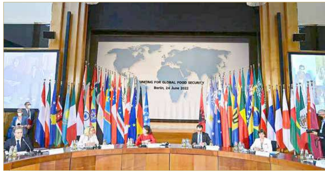
مؤتمر بشأن أزمة الغذاء العالمية

كما أكد أن النزاع الأوكراني الروسي فاقم الاضطرابات الناجمة عن تغير المناخ وجائحة كورونا وعدم المساواة ليسبب أزمة جوع عالمية غير مسبوقة، تؤثر بالفعل على