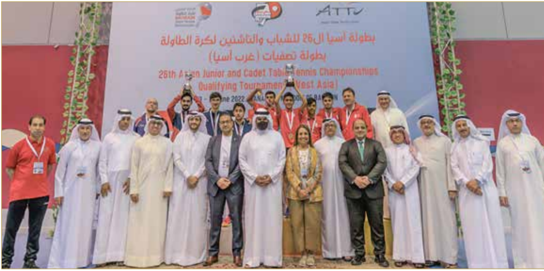
منتخب الناشئين يرفع الكأس

الأحد 26 يونيو 2022 - 26 ذو القعدة 1443 - العدد 5003