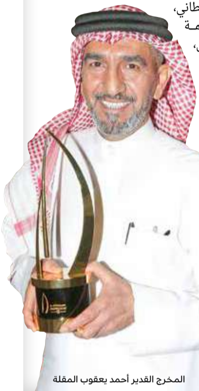
المخرج القدير أحمد يعقوب المقلة

المسلسل نال إعجاب المشاهدين وحظي بمتابعة كبيرة عند عرضه، وذلك لتواجد كل عناصر النجاح، من الإخراج، والتأليف، والطاقتين الفني، وتطور أحداثه في 3 مراحل زمنية مختلفة في الأربعينيات والتسعينيات حتى الألفية الجديدة، ويعكس المشكلات الاجتماعية والمادية بشكل عام والفرق بين الماضي والحاضر في هذه المشكلات.