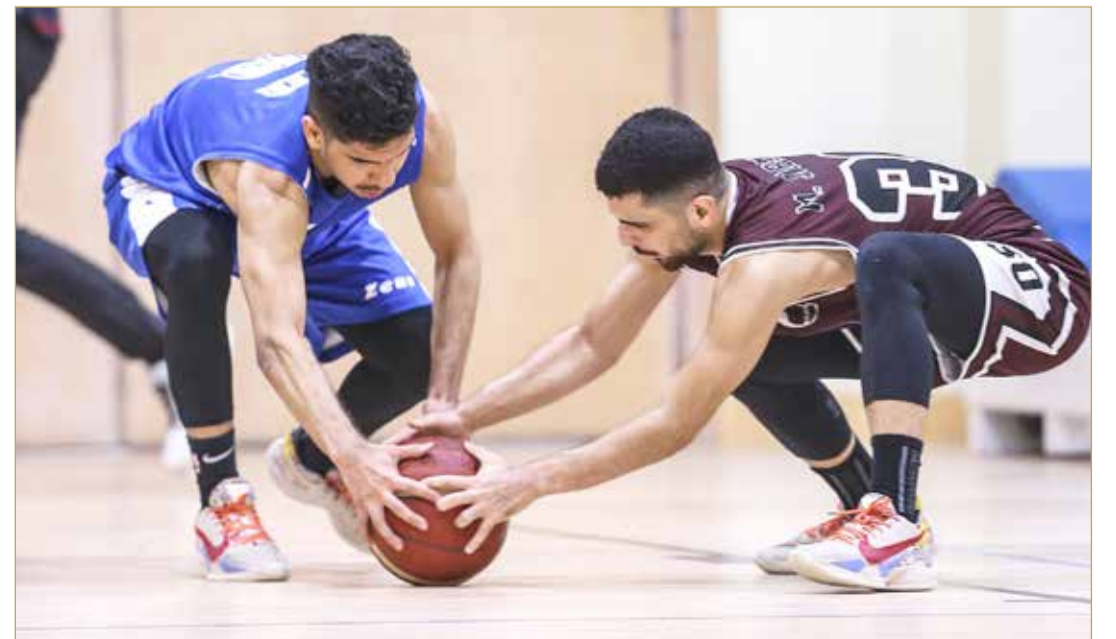
من منافسات دوري جماهير السلة

نجح فريقا راس رمان وسيكس بنس سبارتان من التأهل لدور ربع النهائي من دوري بي أس اكشن الثانية لجماهير كرة السلة، التي تقام برعاية stc البحرين على صالة نادي البيا بالرفاع. ولم يواجه الفريقان أي صعوبة في تجاوز السعيد للعلاج الطبيعي و DHL في افتتاح مرحلة الPLAY IN وهو نظام خروج المغلوب، لتتضح معالم المواجهات في دور ربع النهائي والذي سينطلق يوم الاثنين المقبل على صالة الاتحاد البحريني لرياضة ذوي الإعاقة - الصالة D. في المباراة الأولى نجح فريق رأس رمان في تخطيه منافسه فريق السعيد للعلاج الطبيعي