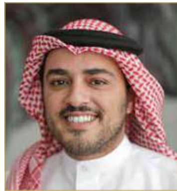
الشيخ علي بن خليفة