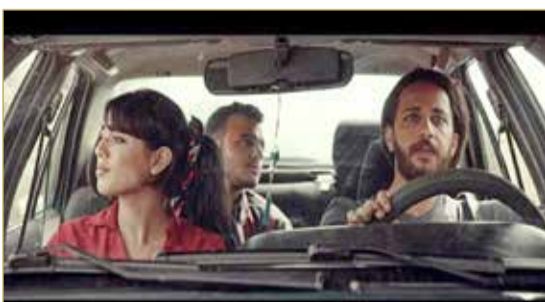
يستمد الفيلم أحداثه من قصة حقيقية عن تهريب البشر بين الحدود

طريقة ممكنة، وكانت كل لحظة من التصوير تذكرني بشيء من واقعي". وليست هذه سوى بداية عام حافل بالنسبة لمليحيس، حيث يلعب دور البطولة في فيلم حمزة، وهو فيلم منخفض الميزانية من نوع الفنتازيا من المتوقع أن يحقق نجاحاً كبيراً، كما يؤدي دور الشخصية الرئيسية في فيلم بلاك ليستد، الذي تم اختياره مرة أخرى