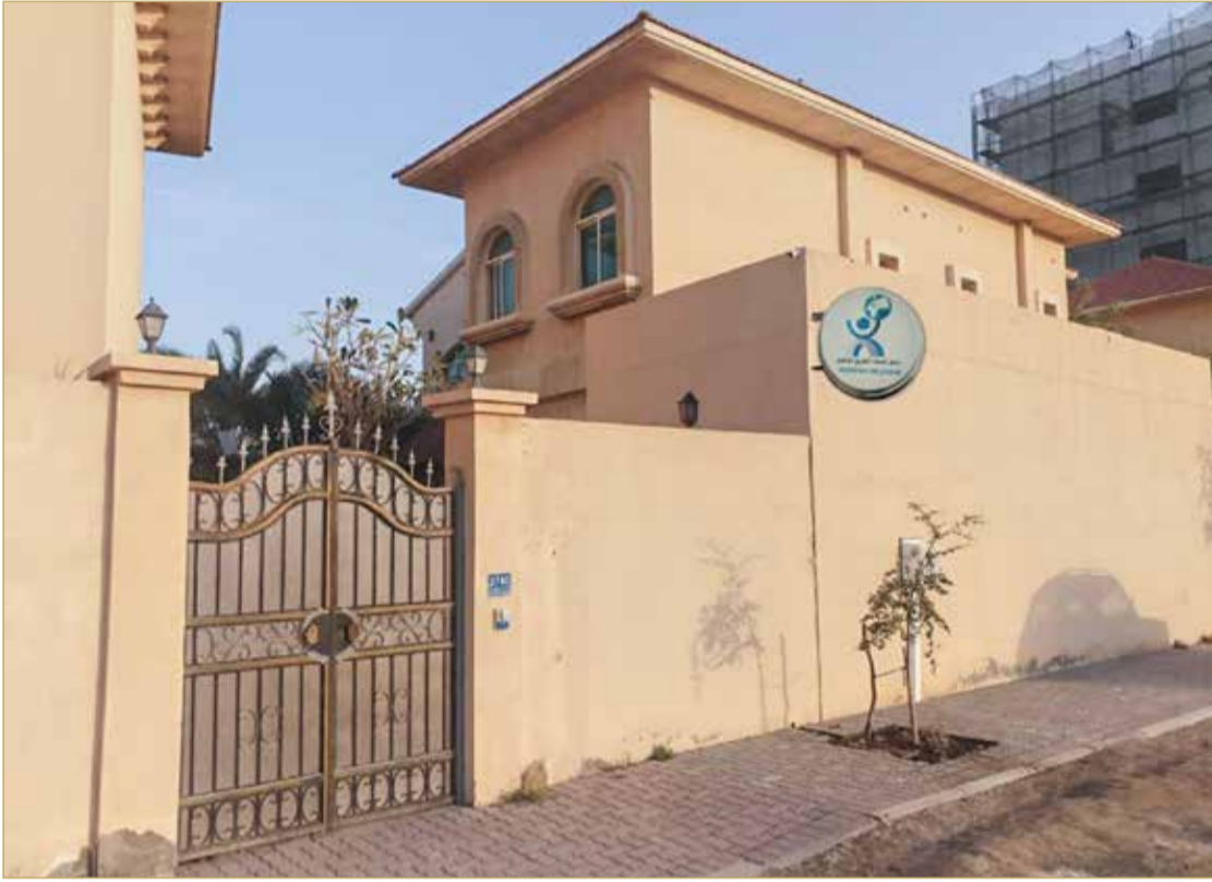
مبنى مركز نصف الطرق للتأهيل

والسلوك، وتؤثر على منطق الإنسان وأفكاره ومفاهيمه، ما يؤدي بعد ذلك إلى زعزعة العلاقات الاجتماعية بالمتعاطي. وقال الحسيني إن أصعب الفترات التي يمر بها المركز والمتعاطي هي الشهور الـ 3 الأولى وهي التي