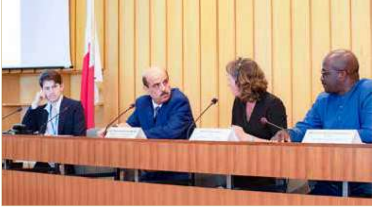
المشاركون في الندوة التعريفية عن جائزة "اليونسكو- الملك حمد"

بمناسبة حفل تسليم جائزة اليونسكو- الملك حمد بن عيسى آل خليفة لاستخدام تكنولوجيا المعلومات والاتصال في مجال التعليم، والذي حظي برعاية كريمة من حضرة صاحب الجلالة الملك حمد بن عيسى آل خليفة ملك البلاد المعظم، وأقامته منظمة الأمم المتحدة للتربية والعلم والثقافة "اليونسكو" بالتعاون مع وزارة التربية والتعليم، عُقدت ندوة تعريفية عن المبادرات الفائزة بالجائزة، تحدث فيها الفائزون في دوراتها الحادية عشرة والثانية عشرة والثالثة عشرة، وذلك في مقر المنظمة بباريس، بحضور لجنة التحكيم الدولية وعدد من الدبلوماسيين والمختصين والإعلاميين.