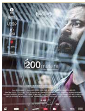
استغرقت كتابة النص نحو 7 سنوات