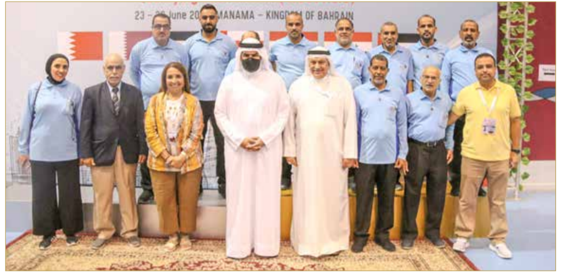
سموه في صورة تذكارية مع حكام البطولة