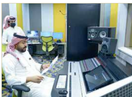
المخرج عبدالله الشوملي ومتابعة دقيقة