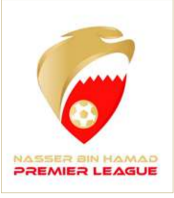
شعار "دوري ناصر"

الجهات (أندية أو وسائل إعلام) في أن تكون شريكاً فاعلاً مع الاتحاد البحريني لكرة القدم، عبر إسهاماتها المختلفة التي تعزز من أسباب النجاح التنظيمي لمسابقات وأنشطة الاتحاد كافة. ولفت في ختام تصريحه إلى أن هذا التفاعل جسّد أهمية تكامل العلاقة بين مختلف أركان المنظومة الرياضية؛ لتسخير الإمكانيات وبذل الجهود الراهمة للتطوير المنشود.