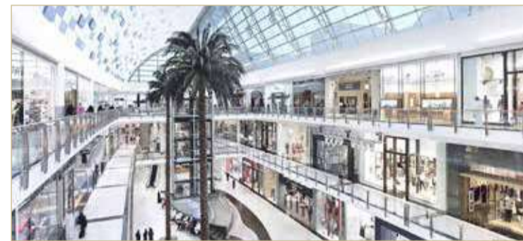
أحد المجمعات التجارية في المملكة