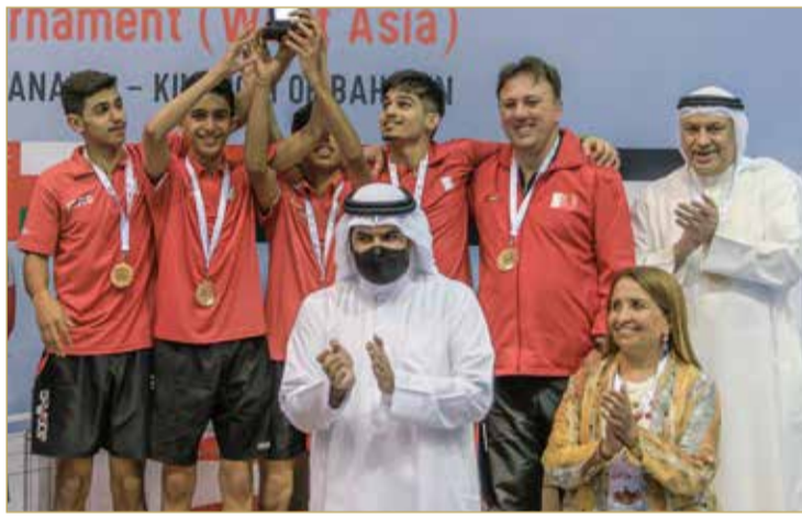
منتخب الناشئين بطل غرب آسيا

وتمنى سموه في ختام تصريحه للاتحاد البحريني لكرة الطاولة برئاسة الشيخة حياة بنت عبدالعزيز آل خليفة دوام التوفيق والنجاح.