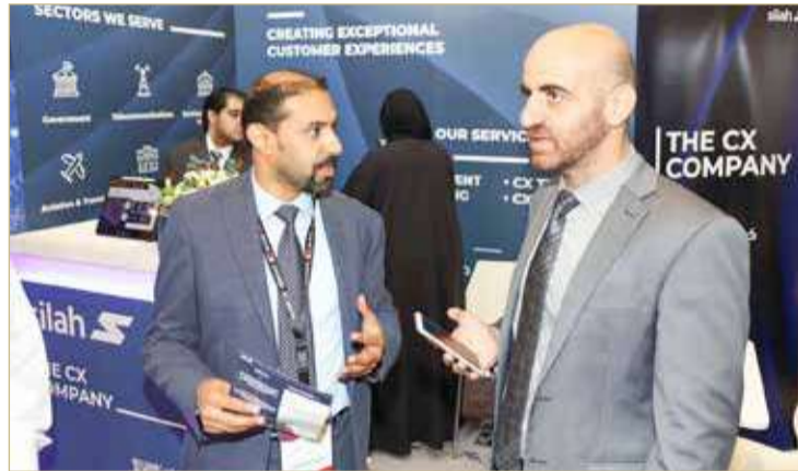
فراس منحندا لـ "البلاد"

وأوضح الرئيس التنفيذي لشركة صلة الخليج أن الشركة تستعين بحلول عالمية وتقوم عبر فريق الشركة التقني بتعديل هذه الأنظمة لتتلاءم مع احتياجات العميل خصوصاً في بيئة العمل البحرينية سواء في المجال المصرفي أو الحكومي أو الصحي.