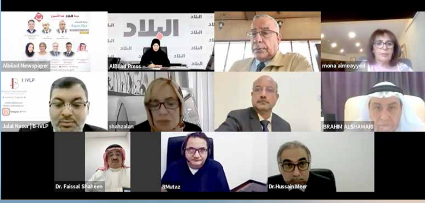
المشاركون بنودة "البلاد"