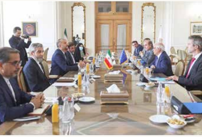
المحادثات بين إيران والاتحاد الأوروبي

أعلن الاتحاد الأوروبي وإيران أمس استئناف المفاوضات بشأن الملف النووي في الأيام المقبلة، بعد توقفها منذ أكثر من 3 أشهر، وذلك خلال زيارة مفاجئة أجراها وزير الخارجية الأوروبي جوزيب بوريل لطهران.