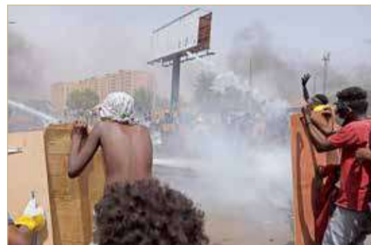
مقتل 10 أشخاص في احتجاجات الخميس

واصل الشارع السوداني، أمس الجمعة، تصعيده حيث خرج الآلاف مجدداً إلى الشوارع مطالبين بالحكم المدني بعد يوم دام؛ في حين تزايدت الانتقادات الدولية للاستخدام المفرط للقوة من قبل السلطات، ما أدى إلى مقتل 10 أشخاص في احتجاجات الخميس التي شارك فيها الآلاف في أكثر من 30 مدينة.