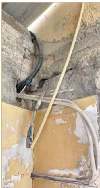
جدران البيت من الداخل