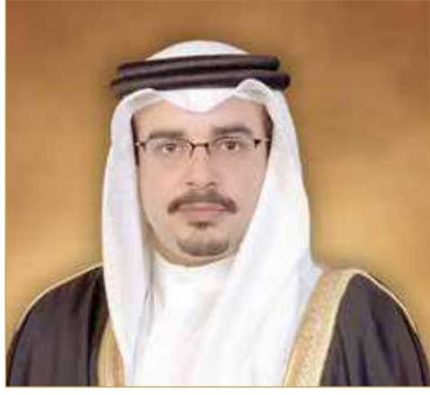
سمو ولي العهد رئيس مجلس الوزراء