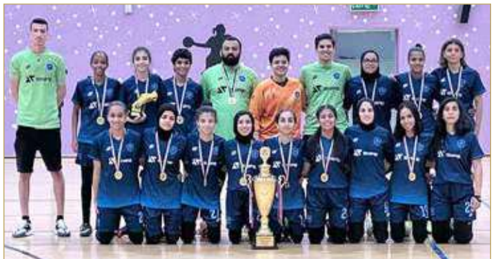
سيدات مدينة عيسى

بدأ المشوار بالفوز على فتيات العيون (ب) بخماسية نظيفة، وفاز بعدها على أكاديمية لفيربول بثلاثة أهداف مقابل هدفين، قبل الفوز في النهائي على فتيات العيون (أ) بهدف نظيف.