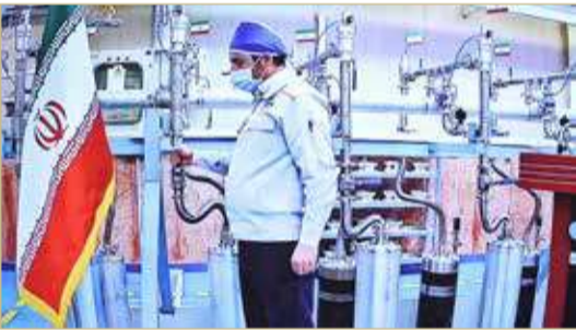
بيان أوروبي يدعو إيران إلى وقف تصعيدها النووي