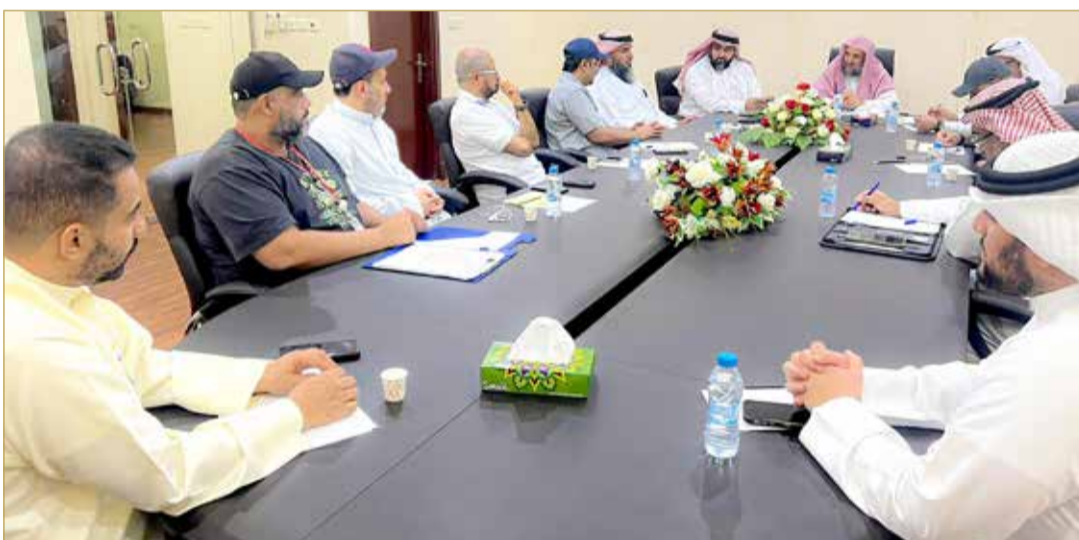
جانب من اجتماع بعثة الحج البحرينية

مدار الساعة لاستقبال الحجاج وأصحاب الحملات والتعامل مع أي مشكلة تعترض الحملات البحرينية، إضافة إلى استعدادهم لتنظيم الدخول والخروج في المشاعر المقدسة. (03)