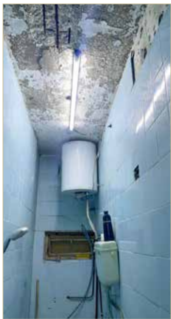
دورة مياه المنزل