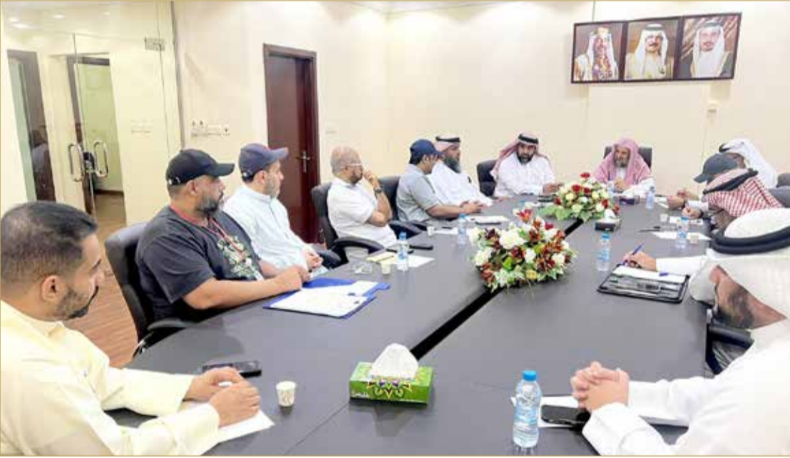
جانب من اجتماع بعثة الحج البحرينية