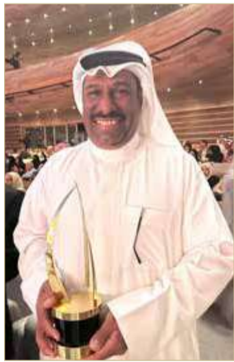
حاملا جائزة الشراع الذهبي

يوميات أم سحنون.. قصة طويلة من الإبداع. بهذه الكلمات تحدث الفنان القدير أحمد مبارك بطل المسلسل الإذاعي الكوميدي الشعبي "يوميات أم سحنون"، مؤكداً أن المسلسل منذ الجزء الأول حافظ على قوته وتميزه في طرح القضايا الاجتماعية بأسلوب راقٍ وساهم إلى حد كبير في عودة كثير من الناس إلى الإذاعة بعد سيطرة الفضائيات، ووسائل التواصل الاجتماعي، إلى درجة أن بعض الأمهات كبار السن كن يشتري جهاز الراديو ويضعنه في المطبخ بشهر رمضان للاستماع إلى المسلسل خلال إعداد الطعام، لأن معظم جمهور المسلسل من كبار السن الذين يتشوقون لسماع المفردة الشعبية الجميلة المكتوبة في نص الحوارات التي أبدع فيها الكاتب أسامة الماجد. وأضاف مبارك أن "فوز المسلسل بجائزة الشراع الذهبي في