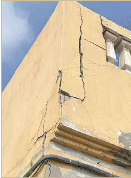
جدران المنزل من الخارج