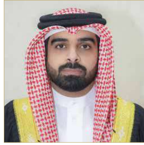
سمو الشيخ سلمان بن محمد