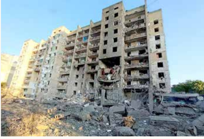
أوكرانيا تقول إن روسيا قصفت المبنى السكني وموسكو تنفي

وفي المقابل، كشف مدير الاستخبارات الخارجية الروسية،