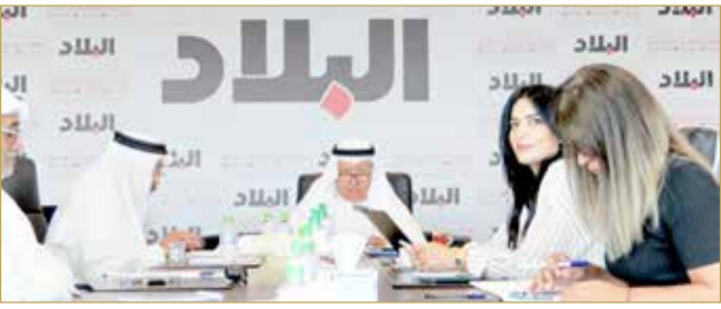
(02) جانب من اجتماع اللجنة العليا