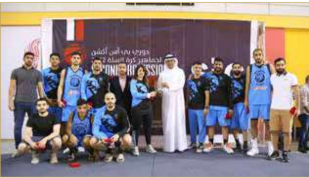
تكريم المركز الثاني فريق منامة كيريزي