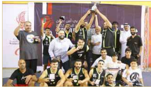
بطل دوري بي اس اكشن فريق موسى دنتل