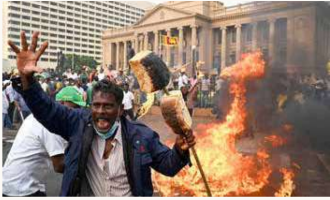
محتجون يقتحمون القصر الرئاسي في سريلانكا

بعد أكبر احتجاج تشهده سريلانكا، أمس السبت، حيث اخترق عشرات الآلاف الحواجز ودخلوا مقر إقامة الرئيس غوتابايا راجاباكسا ومكتبه القريب للتفويض عن غضبهم ضد زعيم يعتبرونه مسؤولاً عن أسوأ أزمة اقتصادية ألمت بالبلاد.