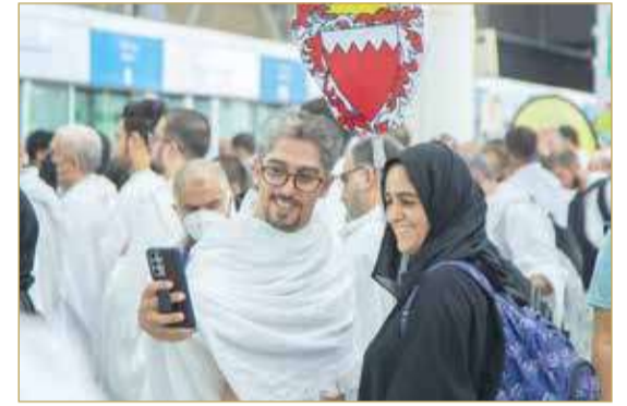
"سيفلي" قبل التغير إلى مزدلفة