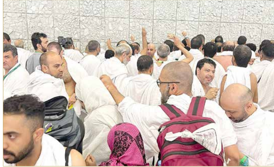
حجاج بحرينيون أثناء رمي الجمرات

حل مليون حاج بينهم 2094 بحرينياً من إحرامهم أمس، في أول أيام عيد الأضحى المبارك بعد أن باتوا ليلتهم الماضية في مزدلفة، وقضوا مناسك يوم العاشر من ذي الحجة من نحر ورمي لجمرة العقبة الكبرى وطواف وسعي وحلق وتقصير، حيث بلغت كلفة الهدى نحو 900 ريال سعودي (ما يعادل 90 ديناراً). ويقضي الحجاج البحرينيون أيامهم الثلاثة بعد يوم العيد في منى في الذكر والشكر على توفيق الله لهم للحج، ويتمون رمي الجمرات الثلاث حيث يبدأون بالصغرى ثم الوسطى ثم الكبرى كل منها بسبع حصيات.