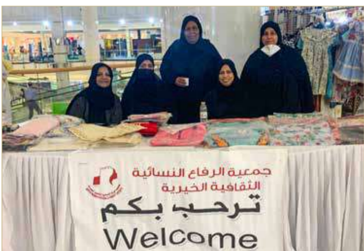
عضوات لجنة المشاريع بجمعية الرفاع النسائية

والتوابل والمخللات والحلويات محلية الصنع، والأطباق الشعبية، والبطور، والتحف، وغيرها الكثير.