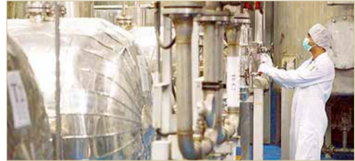
منشأة فوردو النووية

تأتي هذه التطورات بعد أن أجريت محادثات غير مباشرة في نهاية يونيو في العاصمة القطرية الدوحة بين الولايات المتحدة وإيران