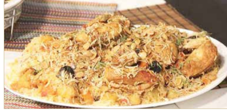
غوزي لحم بحريني "ارشيفية"

البلد" 90 % من الزبائن يفضلون اللحم العربية في أيام الأعياد والمناسبات، حيث يعتبر الغوزي البحريني سيد المائدة في أيام عيد الأضحى المبارك، ثم يليه الأنواع الأخرى من الأرز مثل المندي، البخاري، المجبوس، البرياني، وهي أنواع الأرز التي تطلب بكميات عالية خلال أيام الأعياد الإسلامية. وعن سبب ارتفاع أسعار الولايم