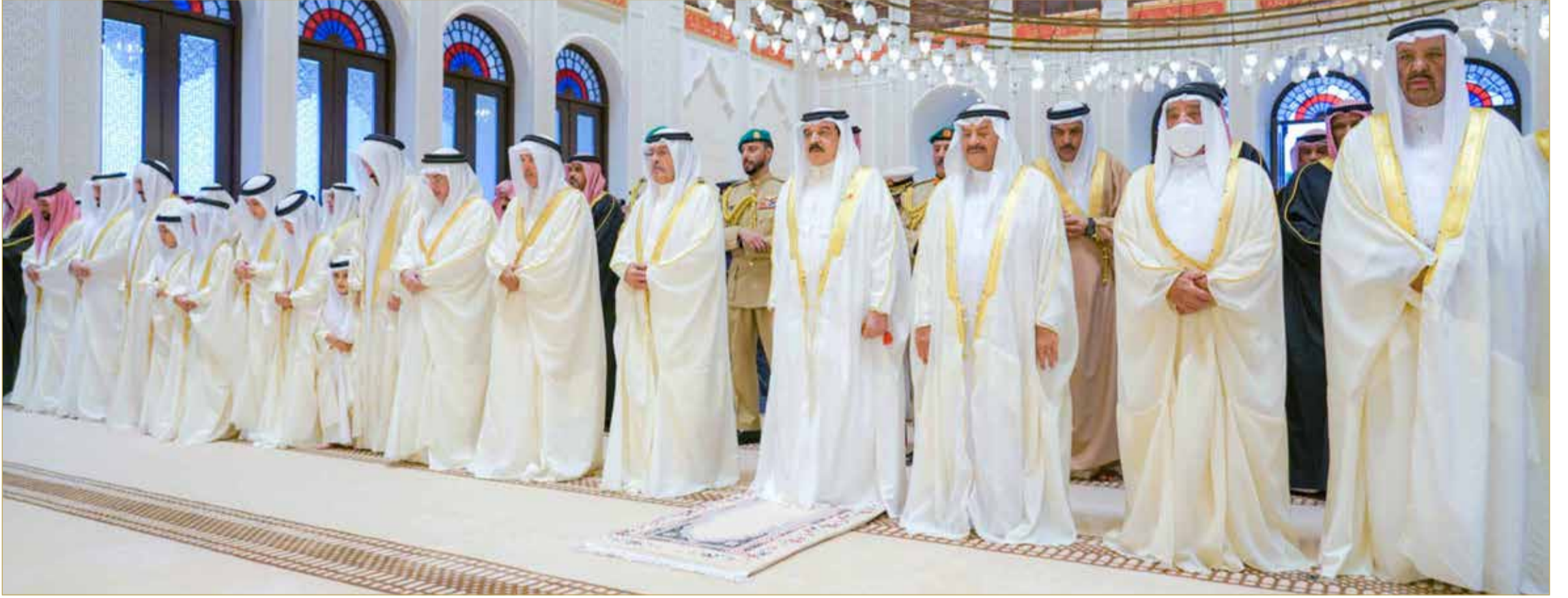
جلالة الملك المعظم يؤدي صلاة عيد الأضحى المبارك في مسجد قصر الصخير