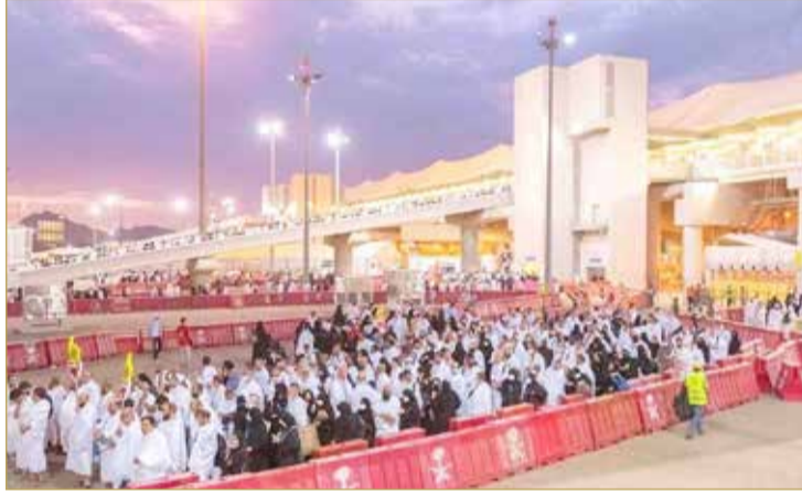
تغير حجاج بحرنيين إلى مزدلفة

احتفت الرئاسة العامة لشؤون المسجد الحرام والمسجد النبوي بوصول الحجاج إلى المسجد الحرام لأداء طواف الإفاضة بتطبيب وتبخير المسجد الحرام بأفخر وأجود أنواع الطيب في أول أيام عيد الأضحى المبارك. بن عبدالعزيز السديس.