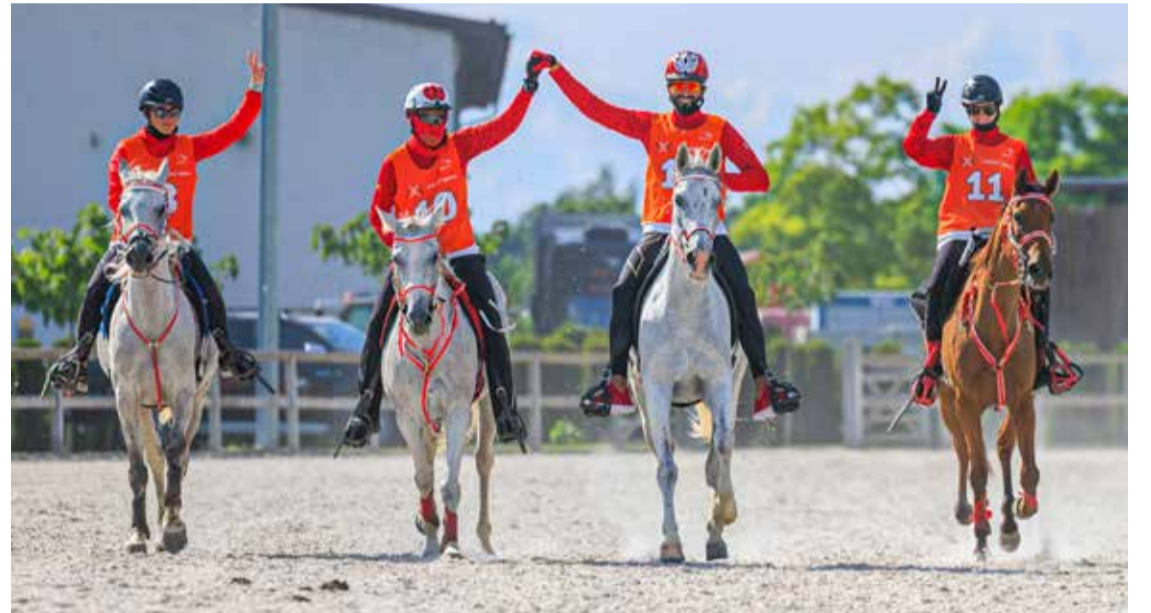
سلوفاكيا - المكتب الإعلامي

«اليوم سباق 120 كم» وسيقود سمو الشيخ ناصر بن حمد آل خليفة عدد من فرسان الفريق الملكي في سباق 120 كم الذي سيقام اليوم.