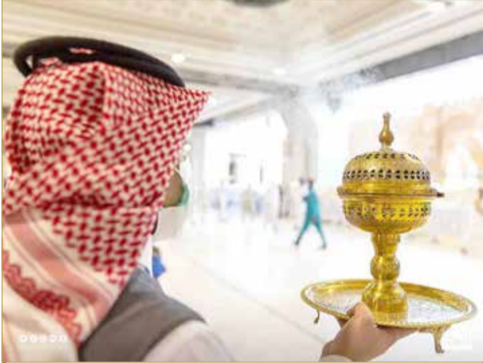
جانب من أعمال تبخير المسجد الحرام

احتفت الرئاسة العامة لشؤون المسجد الحرام والمسجد النبوي بوصول الحجاج إلى المسجد الحرام لأداء طواف الإفاضة بتطبيب وتبخير المسجد الحرام بأفخر وأجود أنواع الطيب في أول أيام عيد الأضحى المبارك. بن عبدالعزيز السديس.