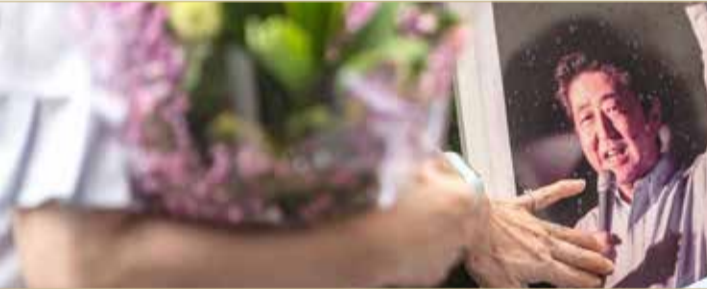
حداد في اليابان غداة اغتيال شينزو آبي

وصل جثمان رئيس الوزراء الياباني السابق شينزو آبي أمس السبت إلى طوكيو من نارا، المدينة الواقعة في غرب اليابان والتي قتل فيها خلال تجمع انتخابي الجمعة. وأثار مقتل آبي، أحد أشهر سياسيي الأرخيبيل والذي حكم البلاد أكثر من ثماني سنوات، مشاعر حزن عميق في اليابان وخارجها. ولاحقا، صرح قائد شرطة منطقة نارا أن هناك ثغرات "لا يمكن إنكارها" في الإجراءات الأمنية الخاصة برئيس الوزراء الياباني السابق شينزو آبي، ووعده بإجراء تحقيق في المسألة. وقال توموكا أونيزوكا رئيس شرطة محافظة نارا للصحافيين "اعتقد أنه لا يمكن إنكار وجود مشاكل تتعلق بإجراءات الحراسة والترتيبات الأمنية لرئيس الوزراء السابق آبي، متهددا "بكشف المشاكل بشكل كامل