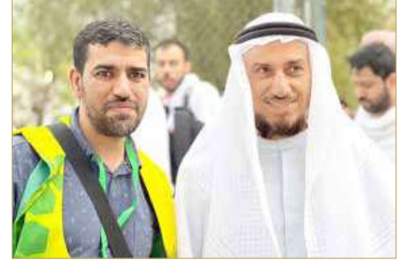
الإمامي جابر العلواني والشيخ عدنان القطان