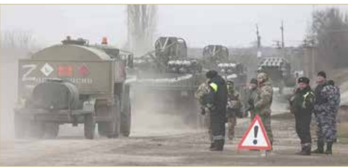
الجيش الروسي في أوكرانيا

نظام كييف يخشون أن يتعب سكانها من الأحداث في أوكرانيا وينتقلون إلى الأجنحة المحلية. في الوقت ذاته، أشارت وزارة الخارجية الروسية مرارا وتكرارا إلى أن الولايات المتحدة وحلفاءها هم الذين يساهمون في إطالة أمد الصراع، بما في ذلك من خلال تزويد كييف بأسلحة جديدة. بالإضافة إلى ذلك، وبتوجيه من الشركاء الغربيين، قطع الجانب الأوكراني عملية التفاوض مع روسيا الاتحادية.