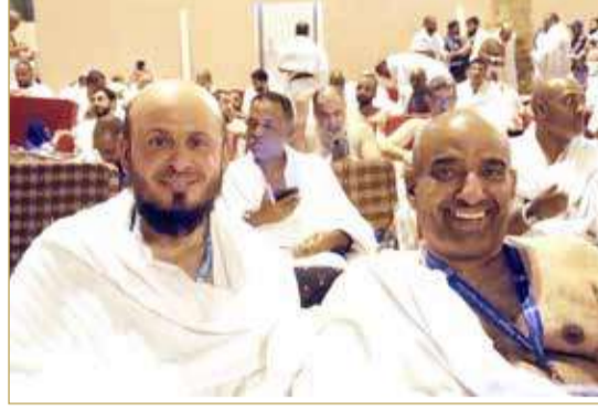
حجاج ليلة المبيت بمزدلفة