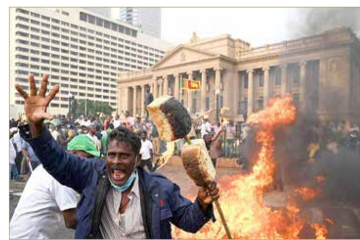
محتجون يقحمون القصر الرئاسي في سريلانكا

على خلفية الأزمة الاقتصادية التي تعصف بالبلاد، التي تسببت في نقص حاد في السلع الأساسية، تظاهر الآلاف في سريلانكا واقتحموا منزل الرئيس بعد محاصرته ما اضطره لمغادرة مكان إقامته. عقب ذلك بساعات، وافق رئيس الوزراء السريلانكي، رانيل ويكرمسينغه، على الاستقالة بعد أن طالبه قادة الحزب في البرلمان بالتنحي هو والرئيس المحاصر في الوقت الذي اقتحم فيه متظاهرون مقر إقامة الرئيس ومكتبه.