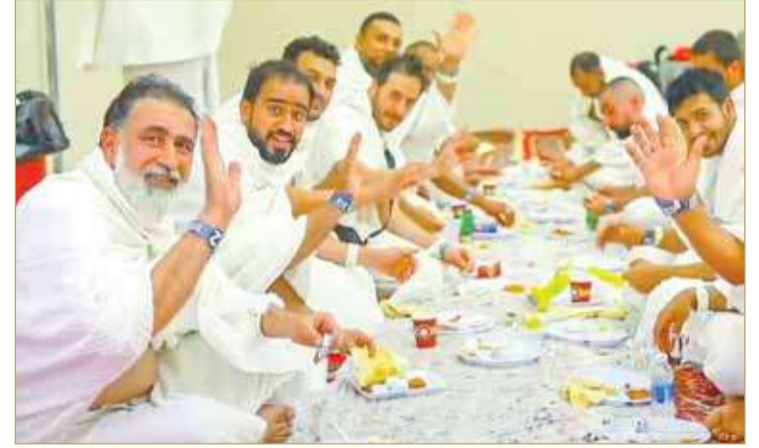
تناول وجبة الإفطار

احتفلوا بالعيد بوجبة "الغوزي" ... وتناولوا على حلق الرؤوس