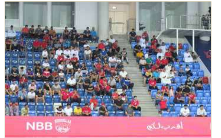
لقطة للجمهور البحريني

شهد لقاء منتخبنا الوطني للشباب لكرة اليد مع نظيره الباكستاني، حضوراً جماهيرياً جيد العدد من أنصار وعشاق القميص الأحمر. وتفاعل الجمهور مع مجريات المباراة لصالح منتخبنا على مدار الشوطين، من تصديات حراس المرمى والأهداف التي شجلت من قبل لاعبينا. وفي نهاية المباراة توجه لاعبو منتخبنا لتقديم التحية للجمهور الذي قابلها بالامر المماثل. ومن المتوقع أن تشهد