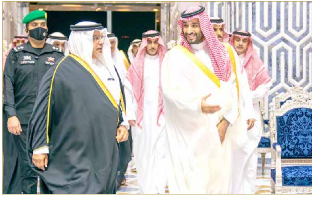
سمو ولي العهد رئيس مجلس الوزراء يصل إلى المملكة العربية السعودية لحضور قمة جدة للأمن والتنمية