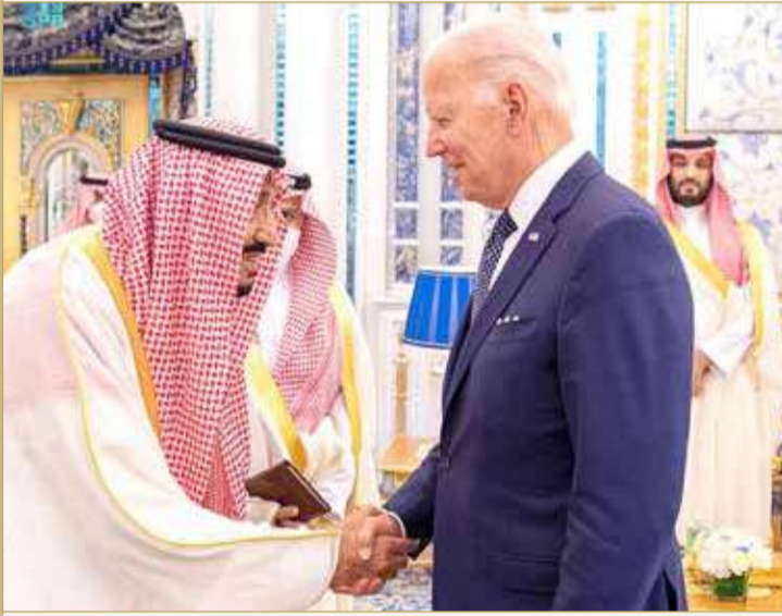
خادم الحرمين الشريفين مستقبلاً الرئيس الأميركي