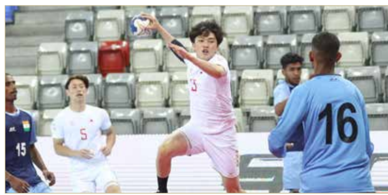
لقاء اليابان والهند

حقق فريق اليابان نتيجة الفوز الأول في مستهل مشواره، حيث ضرب مرمى نظيره الهندي بنتيجة كبيرة قوامها (11/49). وأنهى الكمبيوتر الياباني فعلياً هذه المواجهة منذ الشوط الأول بفارق 19 هدفاً وبنتيجة (6/25). ويأتي ذلك في ظل تواضع إمكانات المنتخب الهندي مقارنة بخبرة وقوة لاعبي اليابان. ومن المتوقع أن تنحصر بطاقتي