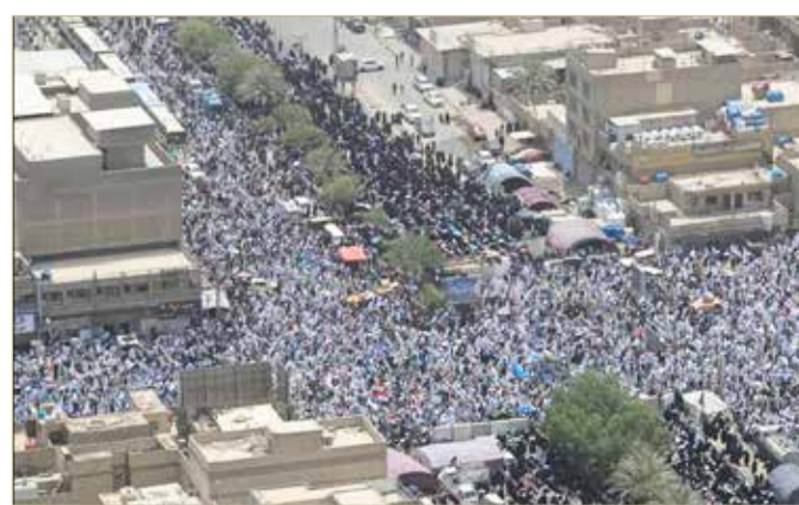
حشود صدرية في صلاة الجمعة بالعراق

وأضاف الصدر أن الخيار للشعب، مؤكداً أنه سيكون داعماً في الأيام المقبلة لأي حراك شعبي لمناصرة الإصلاح.