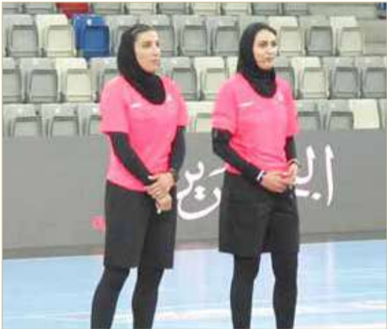
الطاقم الإيراني لمباراة اليابان والهند