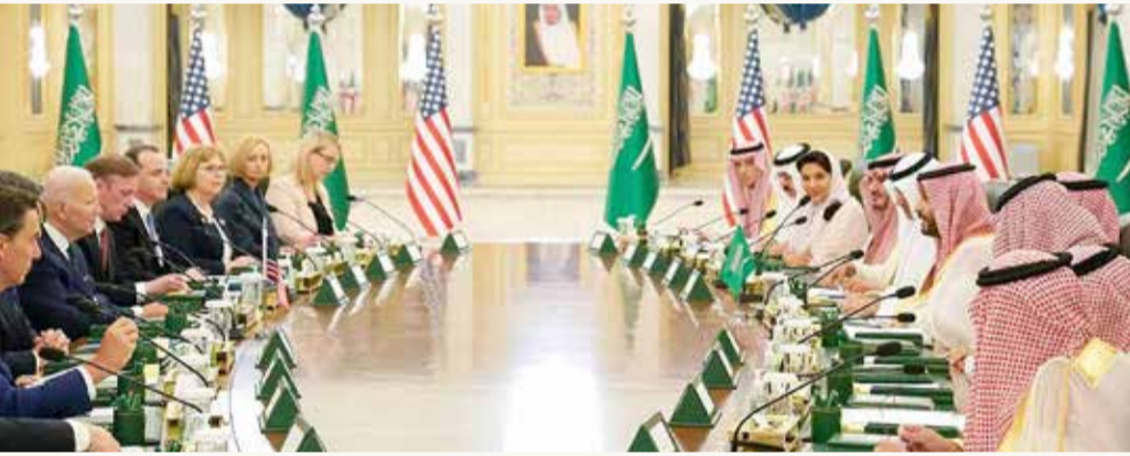
الأمير محمد بن سلمان يعقد اجتماعاً مع بايدن بحضور مسؤولين من البلدين

وتمثل جدة المحطة الأخيرة في جولة بايدن في الشرق الأوسط بعد محادثات أجراها الجمعة مع الرئيس الفلسطيني محمود عباس واجتماعات مع مسؤولين إسرائيليين في اليوم السابق.