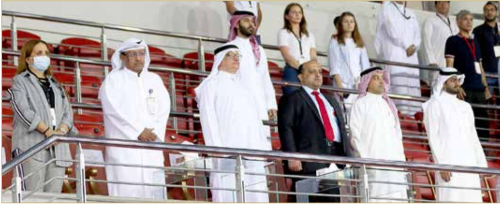
جانب من كبار الحضور