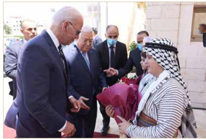
بايدن يؤكد لعباس: لن نتخلى أبداً عن مساعينا لتحقيق السلام

وأجرى عباس مباحثات مع بايدن بشأن مسار السلام، منبهاً إلى أن فرصة حل الدولتين قد تكون متاحة اليوم فقط وربما لا يظل الأمر كذلك في المستقبل. وأضاف الرئيس الفلسطيني، خلال مؤتمر صحفي مع نظيره الأميركي ببيت لحم، أنه على إسرائيل وقف التصرف كدولة فوق القانون وإنهاء احتلالها للأراضي الفلسطينية، وتابع "أمد يد إلى إسرائيل من أجل صنع سلام الشجعان". وأبدى عباس تطلع الفلسطينيين إلى أن تبذل الولايات المتحدة جهوداً؛ من أجل وقف الاستيطان وعنف المستوطنين، معتبراً زيارة بايدن بمثابة اهتمام أميركي بتحقيق السلام. ودعا الرئيس الفلسطيني، إلى فتح