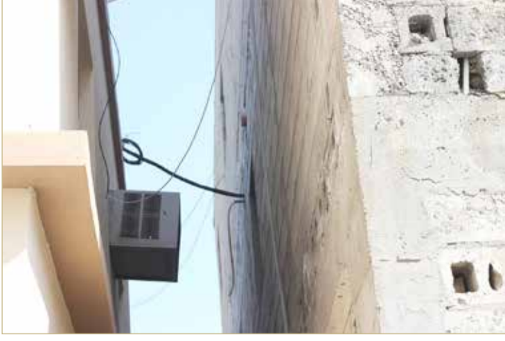
التمديدات المخالفة بين البيتين