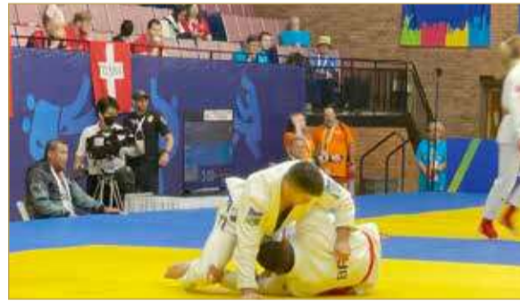
من منافسات الجوجيتسو