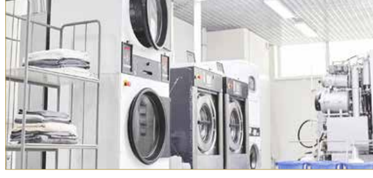
مغسلة ملابس خارجية

الملايس، إذ يكفي العاملة القيام بأمر التنظيف والطبخ وتربية الأطفال في حال غيابه مع زوجته أثناء وقت العمل، معتبراً أن الاعتماد على المغاسل بات سلوكاً استهلاكياً يعتمد على الفرد في التكيف معه في ظل ارتفاع تكاليف أمور الحياة. فيما وصف عادل التيتون نفسه