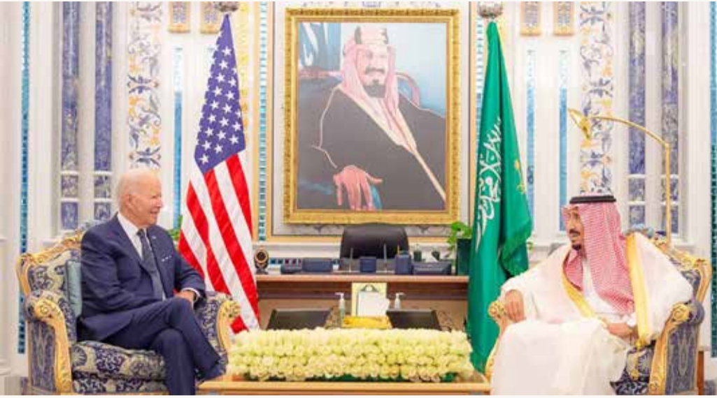
العاهل السعودي التقى الرئيس بايدن في جدة