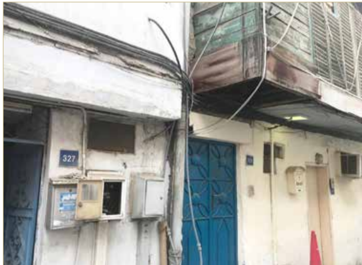
الأسلاك التابعة للهيئة وضعها سليم

على سرعة التنسيق والمتابعة. وتود الهيئة التنويه بالتزامها بأعمال الصيانة الدورية بوضع خطة سنوية مبرمجة؛ لمسح المجمعات وصيانة