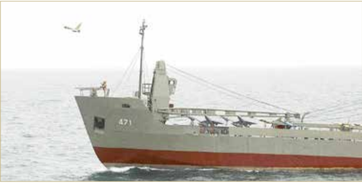
سفينة واحدة تحمل ما لا يقل عن 50 طائرة مسيرة

ووقع بايدن ورئيس الوزراء الإسرائيلي بايبر لابيد الخميس على تعهد مشترك في القدس لمنع إيران من حيازة أسلحة نووية، في خطوة بدت أنها تلبية لمطلب إسرائيلي دعا إلى "تهديد عسكري جاد" من قبل القوى العالمية.