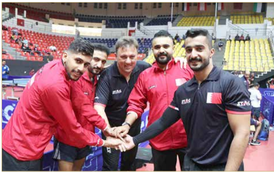
منتخبنا الوطني للرجال لكرة الطاولة