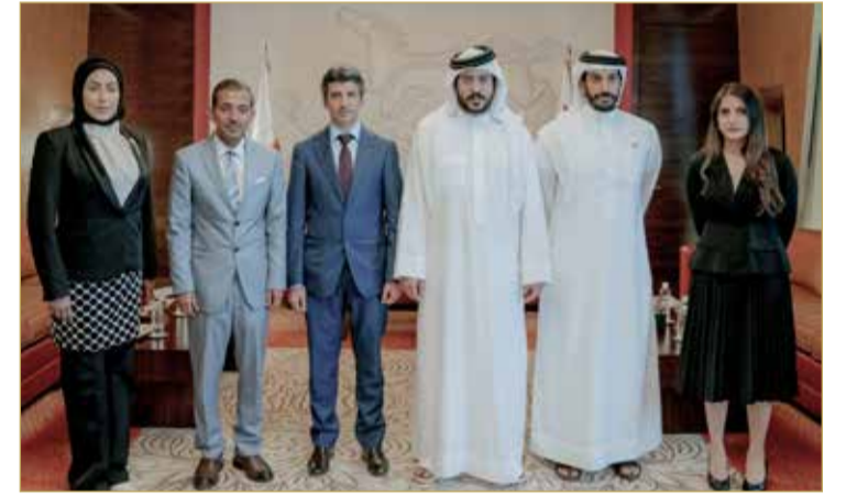
المكتب الإعلامي لسمو الشيخ خالد بن حمد

من جانبهم، أعرب القائمون على عيادة فحص القلب الرياضي عن شكرهم وتقديرهم على إبداء سمو الشيخ خالد بن حمد آل خليفة من دعم ومتابعة للعمل الذي تم إنجازه في البرنامج الوطني للفحص الدوري الإلزامي للاعبين، متطلعين لأن يحقق البرنامج الأهداف المرجوة للحفاظ على صحة ولياقة الرياضيين.