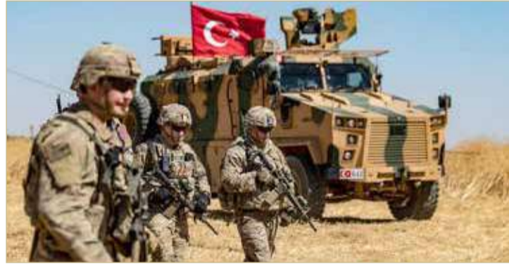
قوات تركية في شمال سوريا

وكان وزير الخارجية التركي مولود تشاويش أوغلو، قد أدلى بنفس التصريحات تقريبا الخميس الماضي، قائلاً إن تركيا "لا تطلب الإذن مطلقاً" من أي أحد قبل شن عملية عسكرية في سوريا. من جانب آخر، اتهم وزير الخارجية التركي، أمس الأربعاء، الحكومة العراقية بعدم القدرة على إدارة معركة "فعالة" ضد التنظيمات المسلحة على أراضيها. وقال جاوش