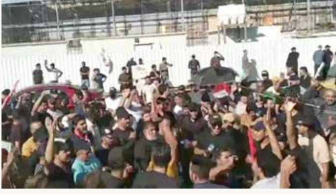
تظاهرات في ساحة التحرير وسط بغداد

انطلقت تظاهرات في ساحة التحرير وسط العاصمة العراقية بغداد، مساء الأربعاء، رفضاً لترشيح الإطارات التنسيقي، الموالي لإيران، محمد شياع السوداني، لمنصب رئيس الوزراء. وأفادت مصادر إعلامية بسماع دوي إطلاق نار في المنطقة الخضراء بعد اقتحام المتظاهرين لبوابة البرلمان. بدورها، شرعت القوات الأمنية في إغلاق بوابات المنطقة الخضراء بالكامل. وشدت القوات الأمنية من إجراءاتها وانتشرت ضمن الساحة، بحسب ما صرح مصدر أمني لوسائل إعلام محلية. وفي وقت لاحق، عبر