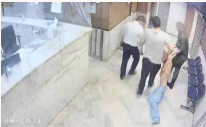
قضايا قائمة على "الاعترافات المشوبة بالتعذيب الروتيني" للمتهمين

وقالت نائبة مديرة المكتب الإقليمي للشرق الأوسط وشمال إفريقيا في منظمة العفو الدولية ديانا الطحاوي في بيان "خلال الأشهر الستة الأولى من العام 2022، أعدمت السلطات الإيرانية