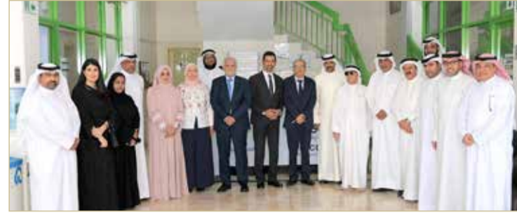
زيارة الوزير المبارك لمجلس بلدي الشمالية

شدد وزير شؤون البلديات والزراعة وائل المبارك، على أهمية التحول الرقمي لخدمات المجالس البلدية بما يساهم في تسهيل الإجراءات أمام المواطنين؛ خصوصاً لتقديم طلبات الخدمات البلدية وتيسير إجراءات الحصول على تلك الخدمات لجميع المستفيدين منها سواء المواطنين أو المقيمين أو المستثمرين، وذلك من خلال تعزير منظومة التحول الرقمي.