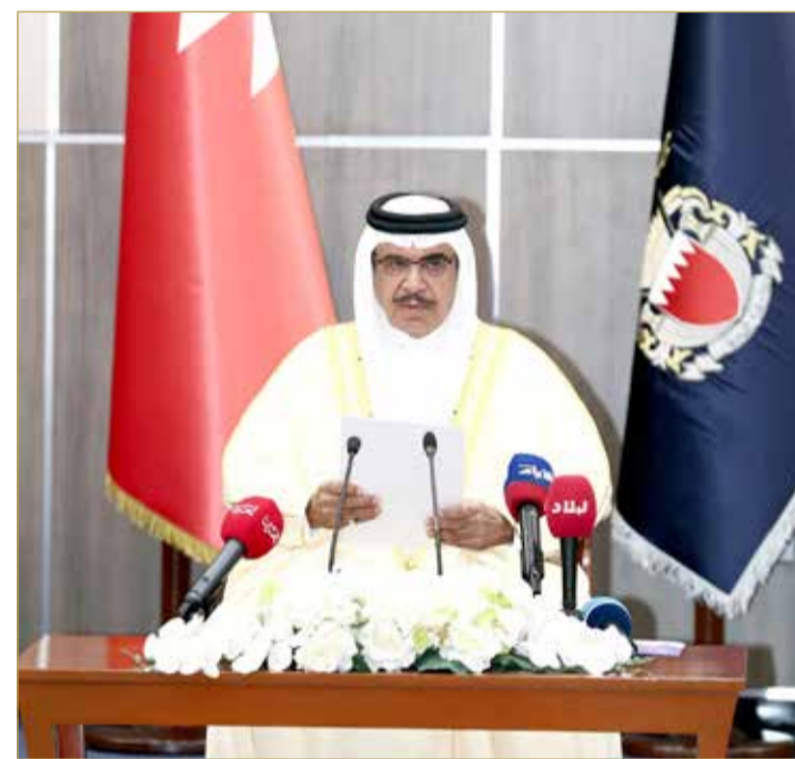
وزير الداخلية يلقي كلمة في الاجتماع

قال وزير الداخلية الفريق أول الشيخ راشد بن عبدالله آل خليفة إن لعاشوراء البحرين خصوصية متحضرة، وحفاظًا على روحانياتها، لا يجوز أن تغطي الحالة المادية، والترويج لها باستخدام غطاء السياحة الدينية، من خلال الدعوة إلى استقبال حملات دينية من خارج البلاد للمشاركة في مواكب العزاء، حيث يتنافى ذلك مع الخصوصية البحرينية في إحياء المناسبة وطابعها المميز. جاء ذلك في اجتماع موسع، بمناسبة موسم عاشوراء، بحضور رئيس مجلس الأوقاف الجعفرية يوسف الصالح، وأعضاء هيئة المواكب الحسينية ورؤساء ومسؤولي مآتم وحسينيات محافظات مملكة البحرين، كما حضر الاجتماع رئيس الأمن العام والمحافظون، في إطار تعزيز منهجية الشراكة المجتمعية البناءة المعمول بها في جميع مناحي عمل وزارة الداخلية. وأكد الوزير في كلمة له أن إحياء المناسبة في البحرين يبقى للمواطنين والمقيمين، ولن نستقبل حملات من الخارج، حفاظًا على أمن وسلامة المعزين وحسن إدارة وتنظيم المناسبة، لافتًا إلى أن وجهات العزاء في المنطقة معروفة.