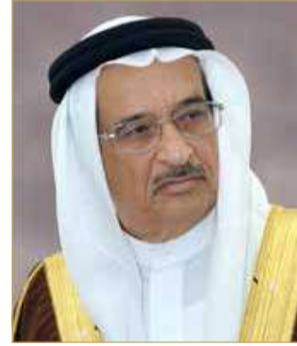
الشيخ محمد بن عبد الله