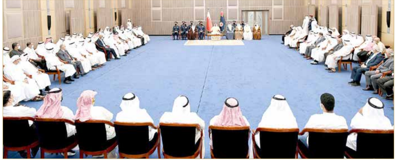
وزير الداخلية يلقي كلمة في الاجتماع

◆ رؤساء المآتم: دعم الخطاب الديني المعتدل ونبذ الطائفية