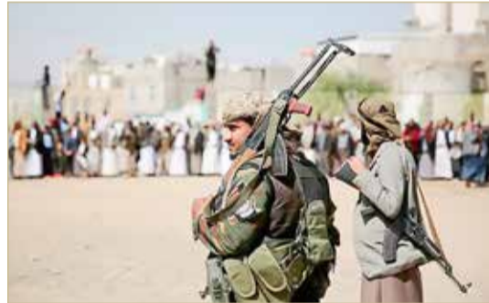
عناصر حوثية في العاصمة اليمنية، صنعاء

في أسرع وقت". ورحبت مصر ببيان مبعوث الأمم المتحدة الخاص إلى اليمن هانس غرونديبرغ، بشأن تمديد الهدنة بين أطراف الحرب اليمنية.