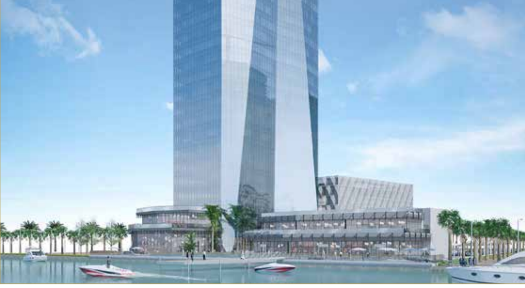
برج احتياطي الأجيال القادمة