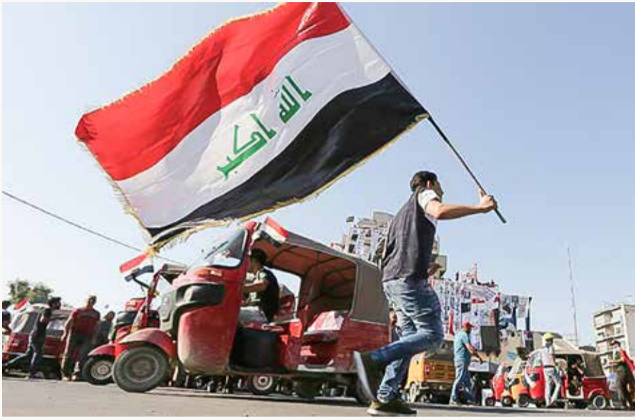
أنصار الصدر والأحزاب الموالية لإيران يحتمون للشارع وكل معسكر يتحدث باسم الشعب

أما الخيار الآخر، فهو يطلب "من رئيس مجلس الوزراء وبموافقة رئيس الجمهورية". ويشرح الحداد أنه "من غير الواضح ما إذا كان الخيار الثاني واردا أصلا؛ لأن الحكومة الحالية هي حكومة تصريف أعمال".