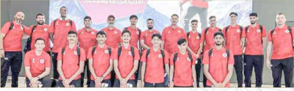
منتخب الشباب لكرة السلة

يسعى منتخبا لكرة السلة لفئة الشباب للوصول إلى المباراة النهائية للبطولة الخليجية المؤهلة لكأس آسيا تحت 18 عامًا، حينما يلاقي نظيره القطري في مواجهة نصف النهائي، الجمعة، عند 3 عصرًا بتوقيت البحرين، وذلك في إمارة دبي بدولة الإمارات العربية المتحدة. وكان المنتخب احتل المركز الرابع في الدور التمهيدي عبر فوزين و3 خسارات، إذ تفوق على الإمارات وعمان، فيما خسر من الكويت وقطر والسعودية؛ ليتأهل للمربع الذهبي ويلاقي قطر متصدرة المنتخبات في التمهيدي.