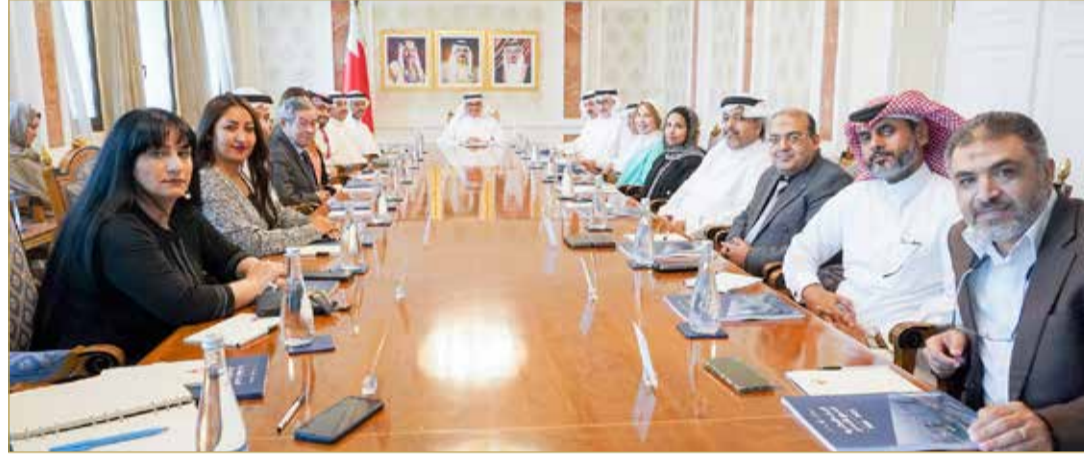
وزير الخارجية لدى لقائه مديري تحرير الصحف المحلية

جاء ذلك خلال اللقاء الذي عقده وزير الخارجية مع مديري التحرير في الصحف المحلية ووكالة أبناء البحرين. (05)