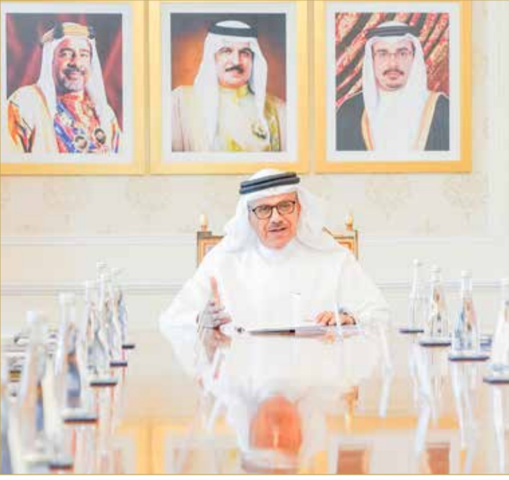
وزير الخارجية متحندا لمديري التحرير

مؤخرًا الخطة الوطنية لحقوق الإنسان، التي أعدتها الوزارة بالتعاون مع اللجنة التنسيقية العليا لحقوق الإنسان، مؤكداً أن الوزارة حرصت على أن تلبّي الخطة تطلعات القيادة الحكيمة لتعزيز وحماية حقوق الإنسان وحرياته الأساسية، وأن تضيف إلى ما حققته المملكة من إنجازات معروفة في هذا المجال. وخلال اللقاء، قدمت رئيس قطاع شؤون حقوق الإنسان بوزارة الخارجية السفير أروي حسن السيد، عرضاً حول الخطة الوطنية لحقوق الإنسان (2022-2026)، مشيرة إلى أن المحاور الرئيسية في الخطة تتضمن الحقوق المدنية والسياسية، والحقوق الاقتصادية والاجتماعية والثقافية، وحقوق الفئات الأولى بالرعاية، وحقوق التضامن، لافتة إلى أنه تم تصنيف الأهداف لتشمل تغطية ثلاث فئات رئيسية لتعزيز حقوق الإنسان وهي: التشريعات، وبناء القدرات، وتطوير المؤسسات.