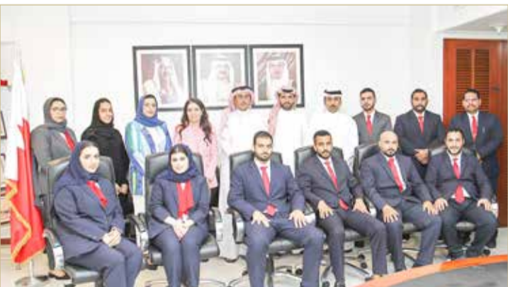
هيئة تنظيم سوق العمل

أدى 11 مفتشاً من مأموري الضبط القضائي بقطاع الضبط القانوني بهيئة تنظيم سوق العمل القسم القانوني أمام الرئيس التنفيذي للهيئة نوف جمشير، تنفيذاً لقرار منح الضبطية القضائية لهم، وذلك بموجب قرار وزير العدل والشؤون الإسلامية والأوقاف رقم (99) لسنة 2022 بشأن تحويل بعض موظفي هيئة تنظيم سوق العمل صفة مأموري الضبط القضائي، وتنفيذاً لأحكام قانون بشأن هيئة تنظيم سوق العمل رقم (19) لسنة 2006 بشأن التفتيش على الخاضعين لأحكام قانون تنظيم سوق العمل.