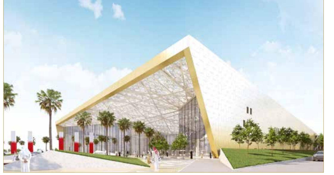
مركز البحرين الدولي للمعارض

◆ أثار مجلس كبار الشخصيات والبهو لمركز البحرين الدولي للمعارض بـ 37 ألفاً