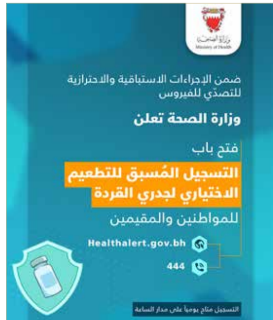
المنامة - وزارة الصحة

أعلنت وزارة الصحة عن فتح باب التسجيل للفئة المستهدفة للتطعيم الاختياري المضاد لفيروس جدري القردة لجميع المواطنين والمقيمين، وذلك عبر الموقع الإلكتروني التابع لوزارة الصحة healthalert.gov.bh أو من خلال الاتصال على الخط الساخن 444. ونوهت الوزارة بتوافر كميات محدودة من التطعيم حالياً مخصصة للفئات ذات الأولوية حسب البروتوكولات الطبية المعتمدة، والتي تشمل العاملين الصحيين الذين يتعرضون للمصابين أو عيانتهم والمخالطين القريبين من ذوي الخطورة العالية، لافتة بأن كافة الاستعدادات اللوجستية قائمة لتأمين سلاسل إمداد التطعيمات في ظل الطلب العالمي عليها. وأشارت الوزارة إلى أن هذه الخطوة تأتي ضمن عدة إجراءات استباقية واحترازية تتخذها مملكة البحرين بناءً على المستجدات الصحية العالمية المرتبطة بجدري القردة وبما يتماشى مع توصيات منظمة الصحة العالمية، منوهة أن الشحنات القادمة للتطعيم ستخصص للذين يرغبون في أخذ التطعيم المضاد اختياريًا من المواطنين والمقيمين بشكل مجاني. وأكدت الوزارة جاهزيتها للتعامل مع أي مستجدات في هذا الشأن حفاظًا على الصحة العامة، حيث تم وضع خطة استباقية طارئة تستجيب لأي حالة إصابة وافدة بفيروس جدري القردة، والتي تضمنت على تفعيل آليات الكشف المبكر للحد من انتشار الفيروس، وتوعية العاملين الصحيين بهذا الفيروس، وآلية الإبلاغ عن الحالات المشتبه بها، وتطوير آليات التشخيص المختبري للحالات المشتبه بها بالسرعة المطلوبة، ووضع خطط لمتابعة الحالات وحصر المخالطين. يُذكر أن وزيرة الصحة جليلا السيد أصدرت عدة قرارات بتحديد الأمراض السارية، وأحكام العزل الصحي للوقاية من