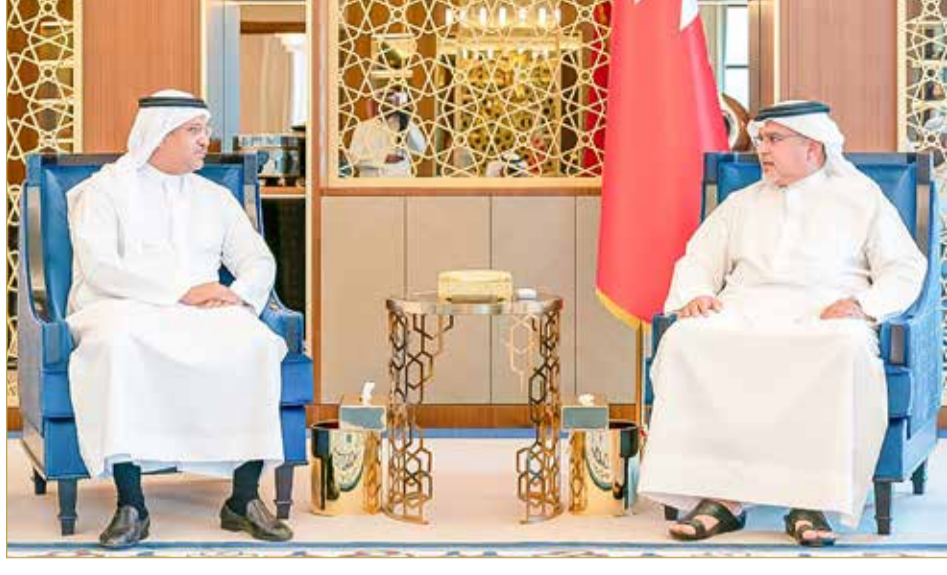
سمو ولي العهد رئيس مجلس الوزراء مستقبلاً رئيس هيئة البحرين للثقافة والآثار

البحرين تضم آثاراً شاهدة على ازدهارها تتطلب مواصلة التنقيب... سمو ولي العهد رئيس الوزراء: