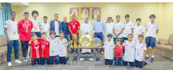
جانب من استقبال فريق أكاديمية طموح وأوليه