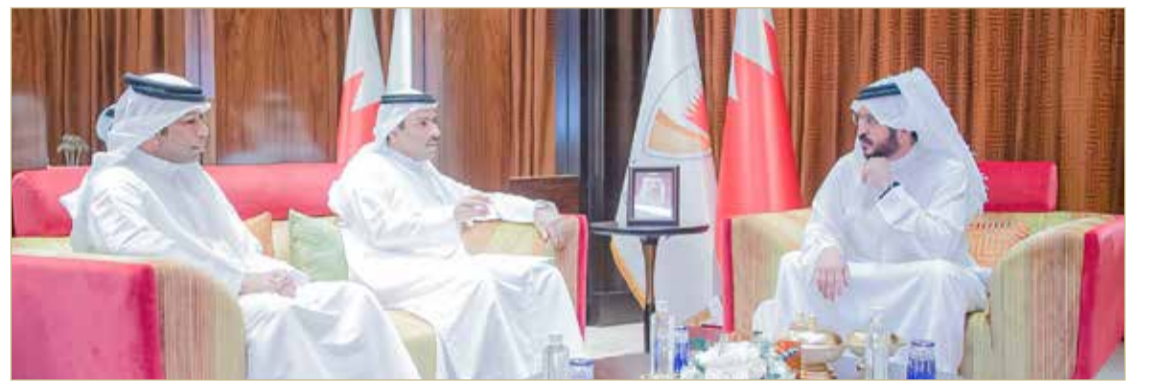
سمو الشيخ خالد بن حمد لدى استقباله وزير شؤون الإعلام