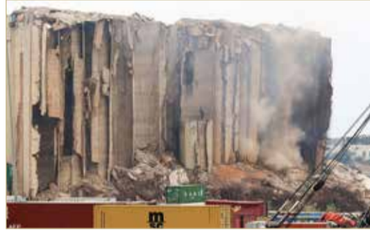
الغبار الناجم عن انهيار الصوامع في مرفأ بيروت

انهارت 4 من صوامع الحبوب في مرفأ بيروت، أمس الخميس، في الذكرى الثانية للانفجار المدمر الذي ضرب الميناء وألحق دمارا هائلا بالعاصمة اللبنانية.