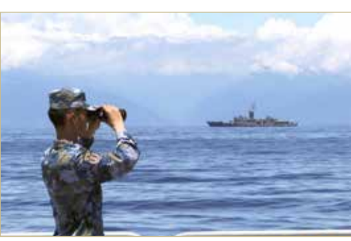
تايوان تعتبر أن مناورات الجيش الصيني تحاكي هجوماً عسكرياً

وصل وفد من الكونغرس الأمريكي، أمس الأحد، إلى تايوان، بينما أعلنت وزارة الدفاع التايوانية أن طائرات عسكرية صينية عبرت الخط الفاصل لمضيق تايوان ودخلت منطقة الدفاع الجوي التايوانية صباح الأحد. والخط الفاصل في المضيق الضيق بين جزيرة تايوان والبر الرئيسي للصين هو خط سيطرة غير رسمي لا تعبره عادة الطائرات العسكرية والبوارج من أي من الجانبين. وأدت رئيسة مجلس النواب الأميركي نانسي بيلوسي مطلع أغسطس الجاري، زيارة لتايوان وُصفت بالمثيرة للجدل.