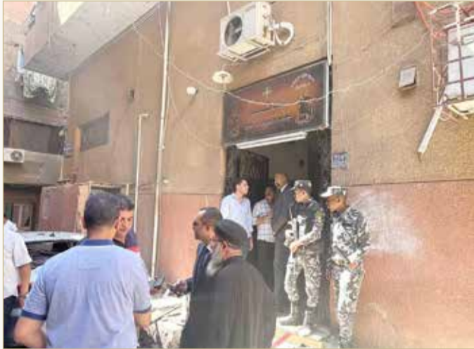
خلل كهربائي أدى إلى اندلاع الحريق

من قوات الحماية المدنية، مشيرة إلى أن الحريق اندلع نتيجة لخلل كهربائي. ودفعت السلطات العديد من سيارات وإخماد الحريق.