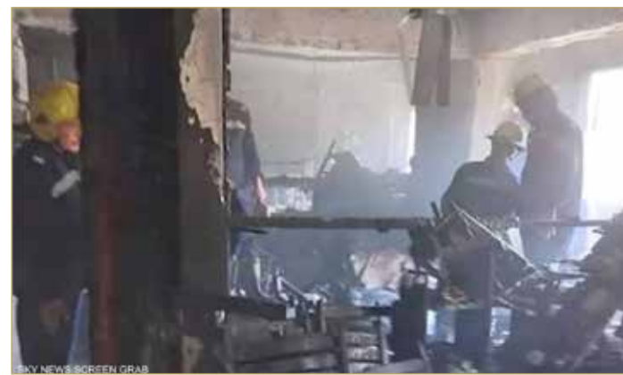
النيران كانت تحجب منفذ الخروج من قاعة الصلاة

اندلع حريق بكنيسة أبوسيفين بحي إمبابية غرب العاصمة المصرية (القاهرة)، صباح الأحد، أسفر عن عشرات الضحايا، بينهم 41 قتيلاً على الأقل.