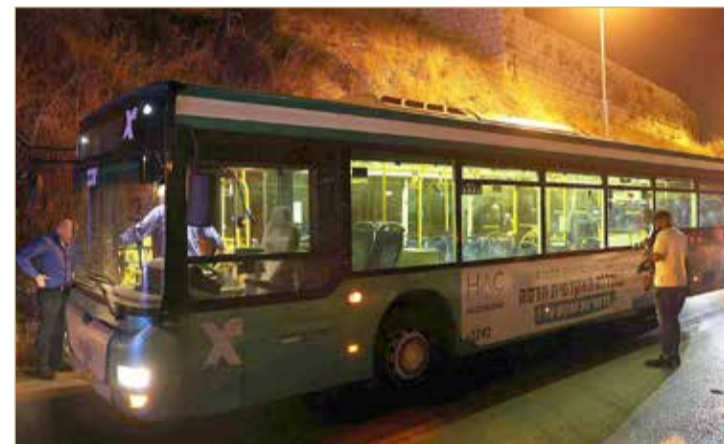
مهاجمة الحافلة ثاني بعد أسبوع على وقف النار بين إسرائيل وحركة الجهاد الإسلامي

حيث وقعت في 3 أماكن متباعدة، استهدفت فيها حافلة إسرائيلية، ثم مركبة، وعدداً من المستوطنين. وأوضحت أن مسلحاً دخل إلى الحافلة وراح يطلق النار بشكل عشوائي على من كان فيها، ثم انسحب ولاد بالفرار