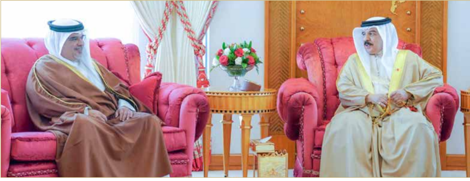
جلالة الملك المعظم مستقبلاً سمو ولي العهد رئيس الوزراء وعدداً من كبار المسؤولين

السمو الملكي ولي العهد رئيس مجلس الوزراء وسعي سموه الدؤوب لتطوير عمل المؤسسات والأجهزة الحكومية وتنمية مختلف القطاعات للاستمرار في تحقيق المزيد من المكتسبات الوطنية. كما أثنى جلالتة على الجهود المثمرة التي بذلتها الوزارات والمؤسسات المعنية ومجلس الأوقاف الجعفرية والقائمون على المآتم لإنجاح موسم عاشوراء، مؤكداً أن ذلك يعكس النسيج المجتمعي المتماسك والترابط الوثيق والمحبة بين أهل البحرين جميعاً الذين تميزوا باحترامهم للتعددية التي عززت من قوة ومكانة المملكة عبر تاريخها العريق.