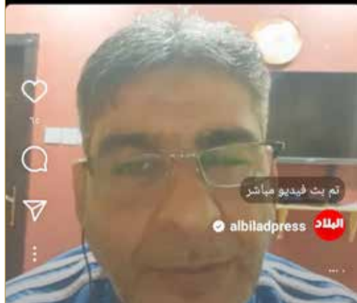
من اللقاء المرئي

الظهور الإيجابي والصعود إلى دوري ناصر بن حمد الممتاز.