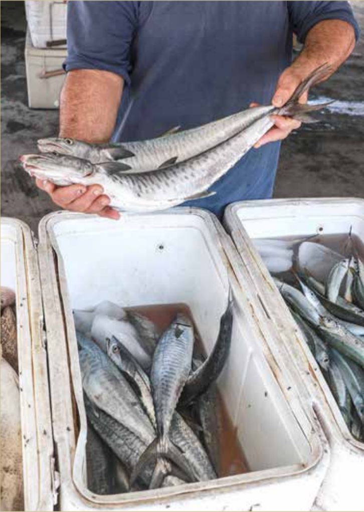
بدء سريان فترة حظر صيد أسماك الكنعان بواسطة الشباك وتداوله وبيعه من 15 أغسطس (أرشيفية)

أعلنت شؤون الزراعة والثروة البحرية عن بدء سريان فترة حظر صيد أسماك الكنعان بواسطة الشباك وتداوله وبيعه، اعتباراً من 15 أغسطس الجاري حتى 15 أكتوبر المقبل.