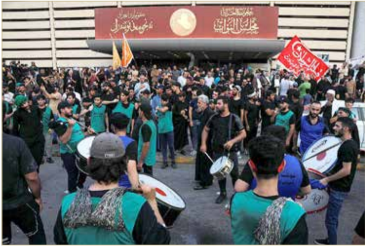
مبنى البرلمان تحت سيطرة الصدر منذ أسبوعين

أعلنت أعلى سلطة قضائية في العراق أمس (الأحد) أنها لا تملك صلاحية حلّ مجلس النواب، بعدما طالب الزعيم الشيعي مقتدى الصدر القضاء بذلك خلال مدة أقصاها نهاية الأسبوع، وسط أزمة سياسية خانقة تعيشها البلاد.