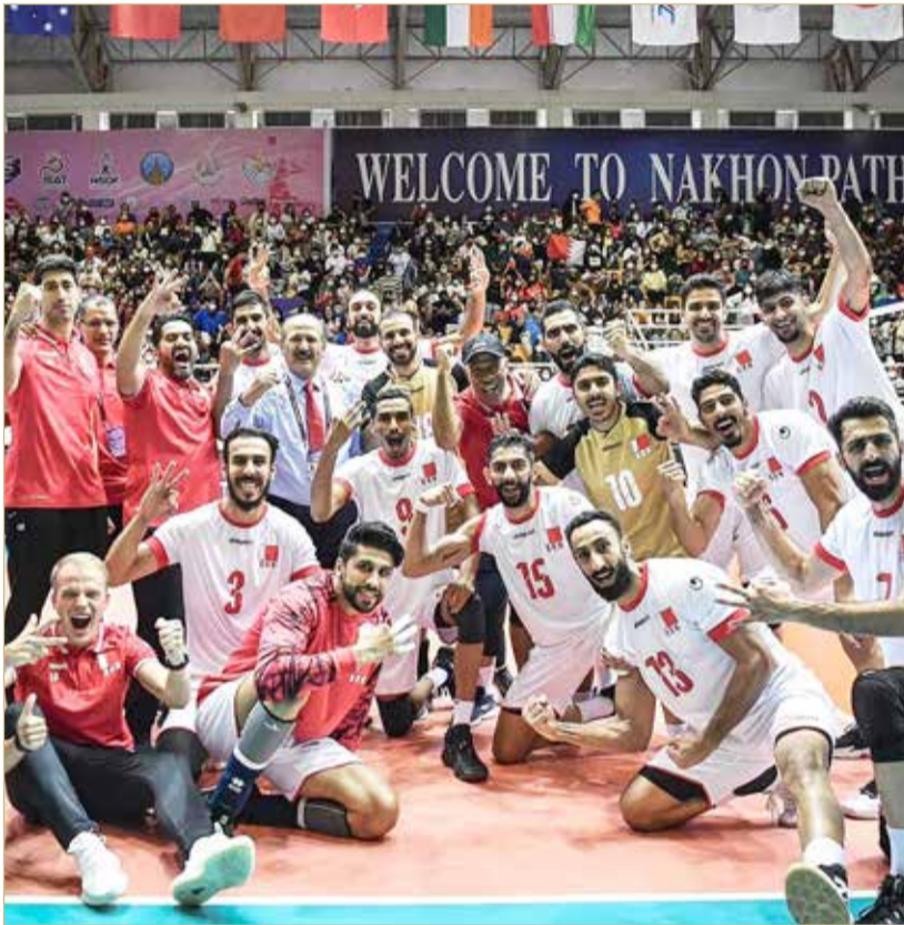
فرصة منتخبنا بالمركز الثالث