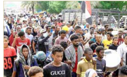
هل تنهي مبادرة "نداء أهل السودان" الأزمة السياسية؟

وتخلص لإجراء انتخابات حرة ونزيهة. وقد تجمع في الخرطوم مئات من السودانيين المؤيدين لمبادرة سياسية يدعمها قائد الجيش الذي نفذ انقلاباً عسكرياً العام الماضي، لوضع حد للأزمة السياسية في البلاد. وتجمعت مسيرات المتظاهرين خارج قاعة المؤتمرات بالعاصمة السودانية، والتي تشهد اجتماعات منذ السبت حول المبادرة التي تم إطلاقها حديثاً.