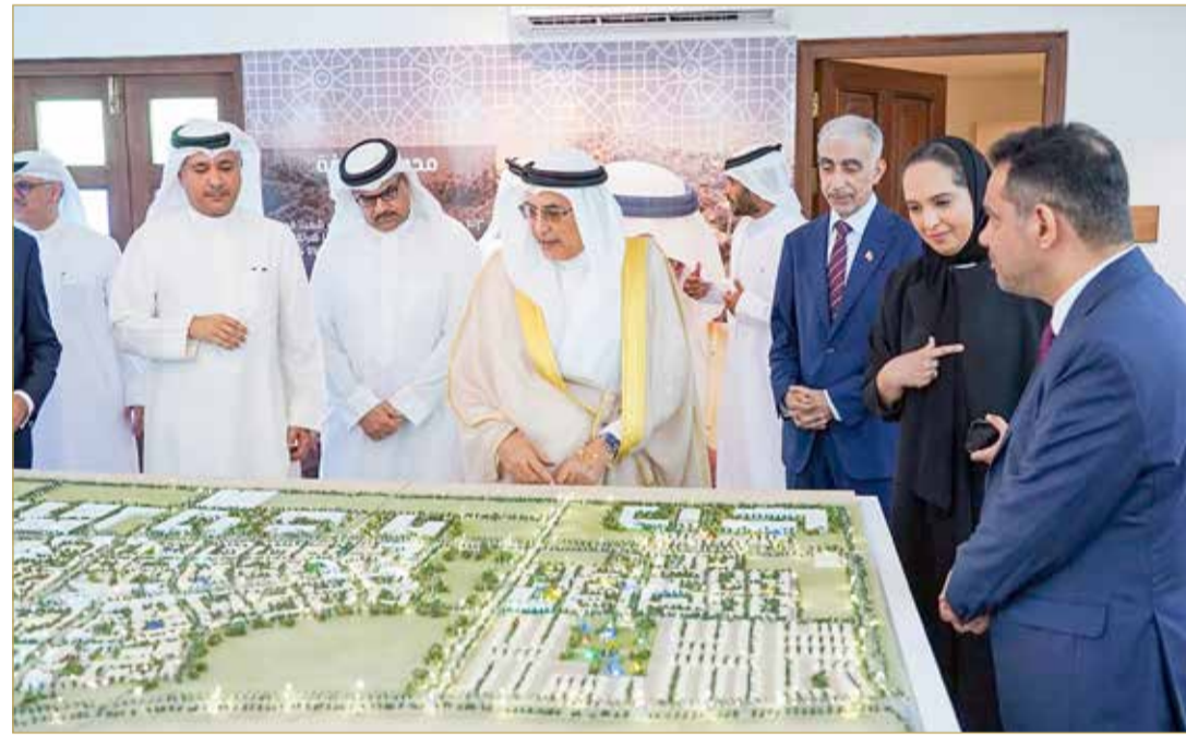
الشيخ خالد بن عبدالله يزور مدينة خليفة

طرحها بأسعار تناسب المستفيدين من التمويلات الإسكانية الجديدة المعلن عنها حديثاً.