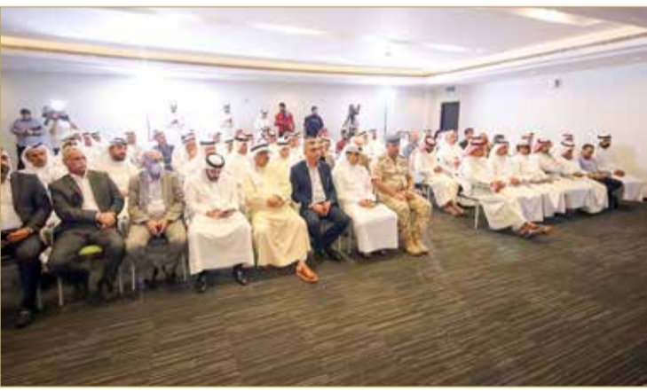
حضور واسع في المؤتمر الصحفي