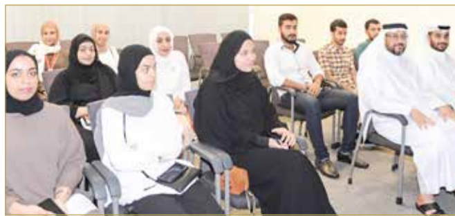
جانب من استقبال عدد من المتدربين (أرشيفية)

الرامية إلى تطوير الكوادر البشرية المؤهلة وتوجيهها لتلبية احتياجات سوق العمل. وأوضحت أنها الوزارة وضمن توجهات الحكومة، تولي التدريب أهمية كبرى، حيث يساهم ذلك في إعداد الكفاءات القادرة على العطاء والمشاركة في مسيرة التنمية الشاملة للبناء والتطوير في مختلف مواقع العمل