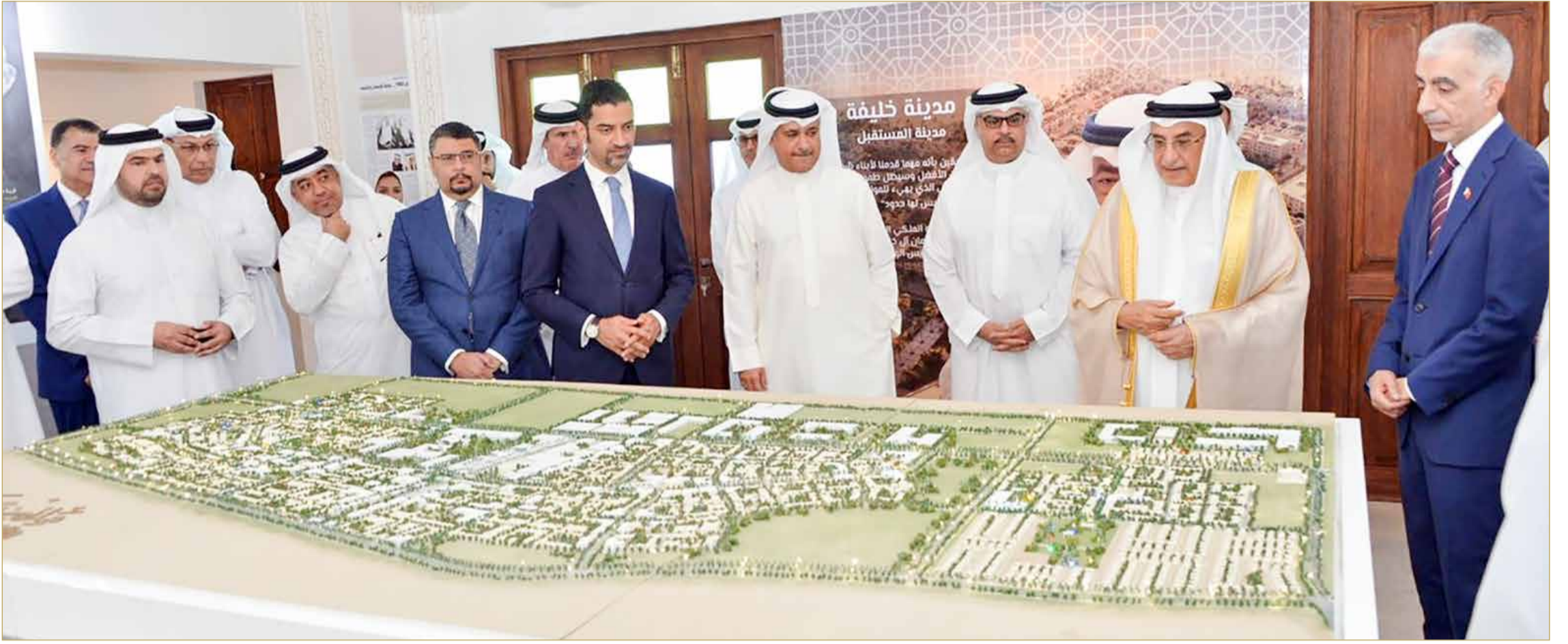
الشيخ خالد بن عبدالله آل خليفة يزور مدينة خليفة