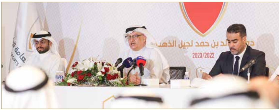
المتحدثون في المؤتمر الصحفي