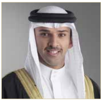
علي بن خليفة

من خلاله سمو الشيخ خالد بن حمد آل خليفة، على تقديم أشكال الدعم كافة لهذه الفئة، معرباً عن بالغ شكره وتقديره إلى سمو الشيخ خالد بن حمد آل خليفة، على المساندة والاهتمام الكبيرين، والذي يعد مرتكزاً للبناء على مكتسبات الرياضة البحرينية ووصولها إلى أرقى المراتب وتحقيق الإنجازات الذهبية الرائدة في مختلف المحافل. ولفت الشيخ علي بن خليفة بن أحمد آل خليفة إلى أن الاتحاد البحريني لكرة القدم، سيكون عاملاً فعالاً في هذه المبادرة الرائدة من قبل سمو الشيخ خالد بن حمد آل خليفة، مشيراً إلى أن الاتحاد لن يألو جهداً في التعاون مع جميع الأطراف لتحقيق أهداف هذه المبادرة، والمتتمثلة بشكل رئيسي في صقل المواهب وتطوير مستوى الفئات العمرية.