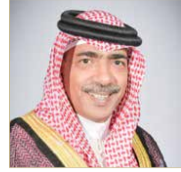
علي بن محمد

رفع رئيس الاتحاد البحريني لكرة الطائرة الشيخ علي بن محمد آل خليفة أسمى آيات التهاني والتبريكات إلى عاهل البلاد المعظم صاحب الجلالة الملك حمد بن عيسى آل خليفة وإلى ولي العهد رئيس مجلس الوزراء صاحب السمو الملكي الأمير سلمان بن حمد آل خليفة بمناسبة فوز المنتخب الأول لكرة