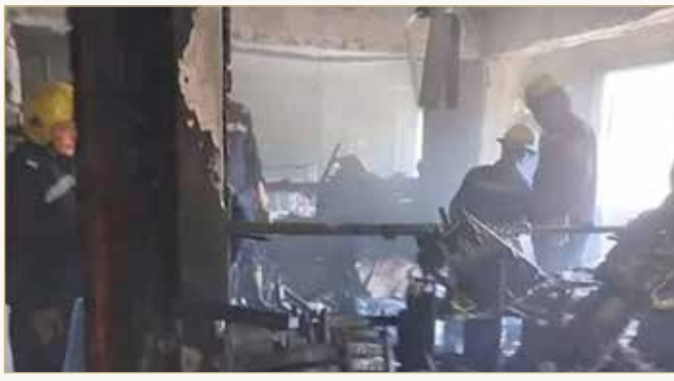
النيران كانت تحجب منفذ الخروج من قاعة الصلاة

وأوضحت وزارة الداخلية أن الحريق أسفر عن إصابة ضابطين و3 أفراد