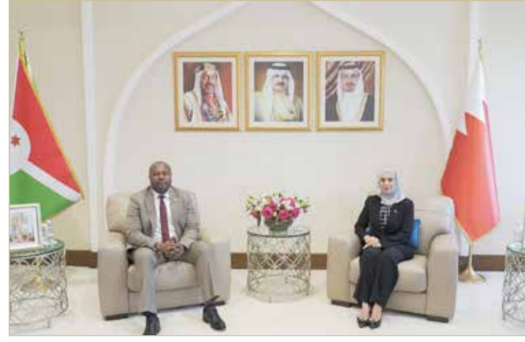
رئيسة مجلس النواب تلقي وزير الشؤون الخارجية والتعاون البوروندي

السياسية بين البلدين؛ بهدف تعزيز التعاون المشترك في المجالات السياسية والدبلوماسية، يؤسس لمرحلة جديدة من العلاقات المتقدمة بين البلدين الصديقين. من جانبه، أعرب وزير الشؤون الخارجية والتعاون الإنمائي ألبرت شينجيرو، عن شكره لرئيسة مجلس النواب على هذا اللقاء البناء، مشيداً بعلاقات الصداقة والتعاون التي تربط مملكة البحرين وجمهورية بوروندي التي تقوم على أسس من الاحترام والتعاون البناء، مؤكداً حرص بلاده على تعزيز أوجه التعاون الثنائي مع مملكة البحرين في مختلف المجالات بما يخدم المصالح المتبادلة بين البلدين والشعبين الصديقين، متمنياً لمملكة البحرين مزيداً من التقدم والنماء.