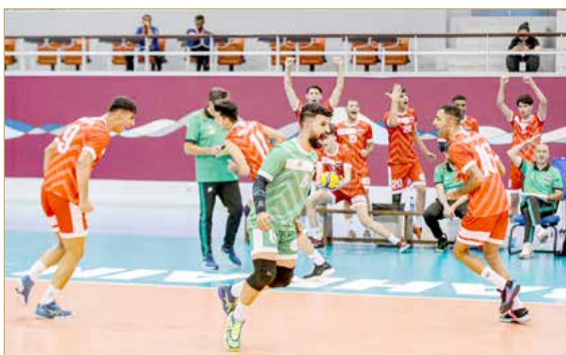
فرحة العراقيين بالفوز على أستراليا