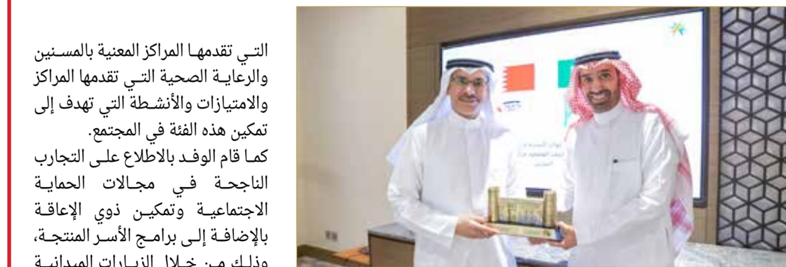
تكريم الوزير أسامة العصفور

التي تقدمها المراكز المعنية بالمسنين والرعاية الصحية التي تقدمها المراكز والامتيازات والأنشطة التي تهدف إلى تمكين هذه الفئة في المجتمع. كما قام الوفد بالاطلاع على التجارب الناجحة في مجالات الحماية الاجتماعية وتمكين ذوي الإعاقة، بالإضافة إلى برامج الأسر المنتجة، وذلك من خلال الزيارات الميدانية إلى مراكز التميز للتوحد، وهيئة رعاية الأشخاص ذوي الإعاقة، وكذلك مركز بلاغات العنف الأسري وحماية الطفل، إلى جانب زيارة عيادة التمكين للاطلاع على آليات وأنواع الدعم المقدم لتمكين الأسر الفقيرة ومحدودي الدخل.