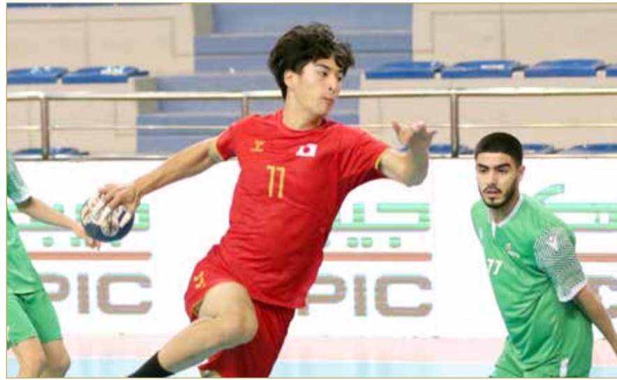
جانب من المنافسات

وفي المباراة الأولى التي جمعت المنتخبين الكوري الجنوبي ونظيره الهندي لم تجد كوريا الجنوبية أي صعوبة في الحصول على النقطة السادسة بعد الفوز الكبير الذي