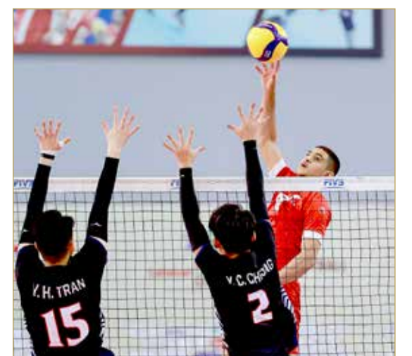
منتخبنا الوطني فاز بجدارة