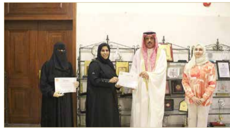
التعليمي يكرم مديرة مدارس الفلاح الخاصة ومعلمة اللغة العربية بالمدرسة

الذي ساهم في إنجاح هذه التجربة، وكذلك مساهمة معلمة الحاسوب بالمدرسة التي قامت بتدريب الطالبات على استخدام الأجهزة الإلكترونية لمدة فصل دراسي كامل، حيث كان للمشروع أثر طيب تمثل في زيادة ثقة الطالبات بأنفسهن، وارتفاع معدل التحصيل في الكتابة، وإمتداد أثره إلى المواد الدراسية الأخرى، وغرس حب اللغة العربية في نفوس الطالبات، ونشر الممارسات المشوقة في تدريس اللغة العربية رقمياً. وبهذه المناسبة، أشاد الوزير بالدور الذي تقوم به الجائزة في تشجيع الممارسات التربوية التي تسهم في زيادة دافعية الطلبة نحو التحصيل الدراسي، متمنياً للجميع دوام التوفيق.