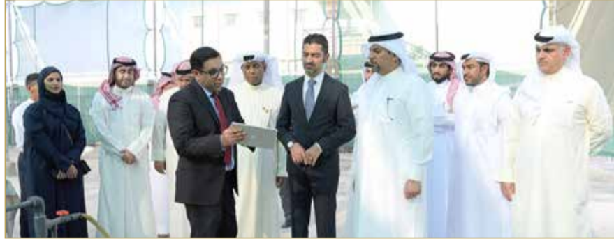
الوزير المبارك وبن دينة بالمشتل

صاحب السمو الملكي الأمير سلمان بن حمد آل خليفة ولي العهد رئيس مجلس الوزراء حفظه الله، خلال المؤتمر السادس والعشرين للأطراف في اتفاقية الأمم المتحدة الإطارية بشأن تغير المناخ (COP26) الذي عُقد في مدينة غلاسكو بالمملكة المتحدة في نوفمبر 2022. وأشار وزير النفط والبيئة إلى أن مملكة البحرين اعتمدت سلسلة من المبادرات لإزالة الكربون، ومنها مضاعفة أشجار نبات القرم 4 أضعاف ما هي عليه الآن، إضافة إلى حزمة من المبادرات المساندة للخطط الوطنية الرامية إلى زيادة عدد الأشجار في المشروعات الحكومية والشركات الصناعية الكبرى، وتوفير السياسات الداعمة التي تحفز المؤسسات والشركات والأفراد على المساهمة بزيادة المساحات الخضراء.