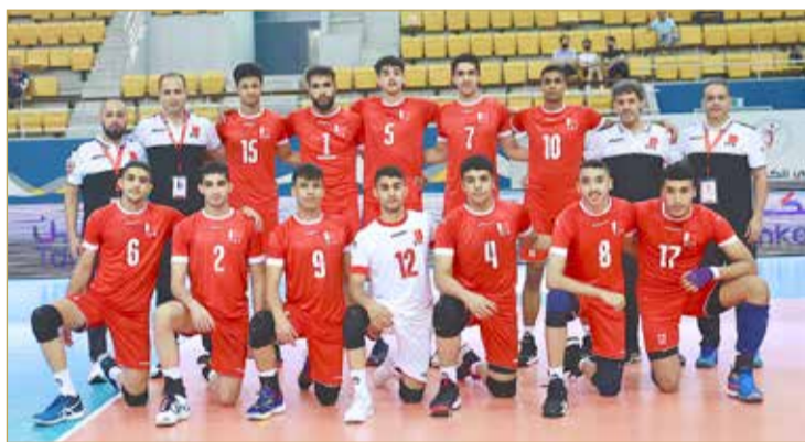
منتخبنا الوطني للشباب

حقق الهند مفاجأة كبيرة بعدما هزم اليابان وأقصاه من الدور التمهيدي عندما تغلب عليه بثلاثة أشواط نظيفة 25-19، 25-21، 25-23 ليذيق اليابانيين الخسارة الثانية ويتأهل برفقة إيران إلى الدور الثاني.