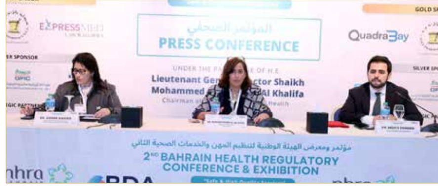
المندوبون في المؤتمر

البلاد | حسن عبدالرسول