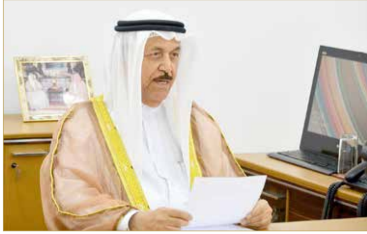
رئيس المجلس الأعلى للشؤون الإسلامية

كما أطلع المجلس على مذكرة من الأمانة العامة بشأن مسودة مشروع قرار بإصدار لائحة تنظيم عمل شيوخ الإقراء والمحاضرين والأساتذة والمدربين الذين يتم استضافتهم في معهد القراءات وإعداد معلمي القرآن الكريم، وأبدى موافقته عليها وإرجاعها إلى المعهد لاتخاذ ما يلزم لإقرارها، واختتم المجلس جلسته باستعراض الرسائل والطلبات الواردة واتخذ بشأنها ما يلزم.