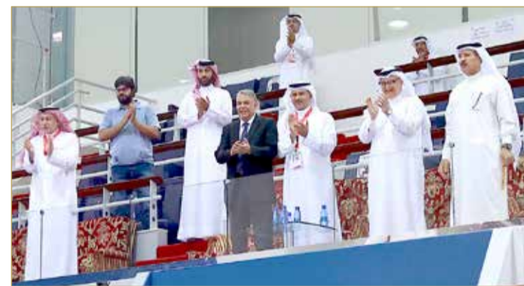
حضور رسمي داعم للمنتخب