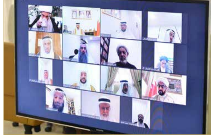
اجتماع المجلس الأعلى للشؤون الإسلامية عن بعد

والعشرين لإنشاء المجلس الأعلى للمرأة، مقدراً الجهود المتواصلة التي يضطلع بها المجلس الأعلى للمرأة لخدمة قضايا المرأة والأسرة والمجتمع. وبحث المجلس الموضوعات المدرجة