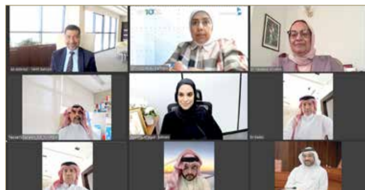
اجتماع مجلس المفوضين

التي فرضتها جائحة كورونا - محل تقدير من الجميع، داعياً وزارة الداخلية إلى مواصلة التعاون الفعال بين الجانبين تحقيقاً للأهداف المشتركة.