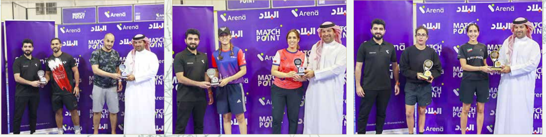
لقطات من التنوع