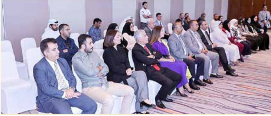
جانب من الحضور في المؤتمر الصحافي أمس