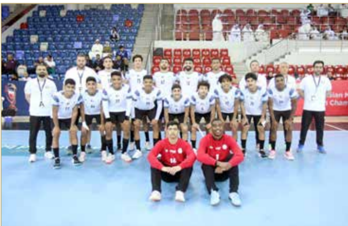
منتخب الكويت للناشئين لكرة اليد