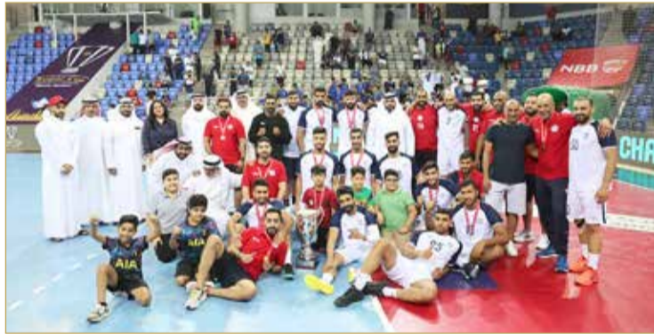
النجمة بطلاً لكأس السوبر البحريني لكرة اليد