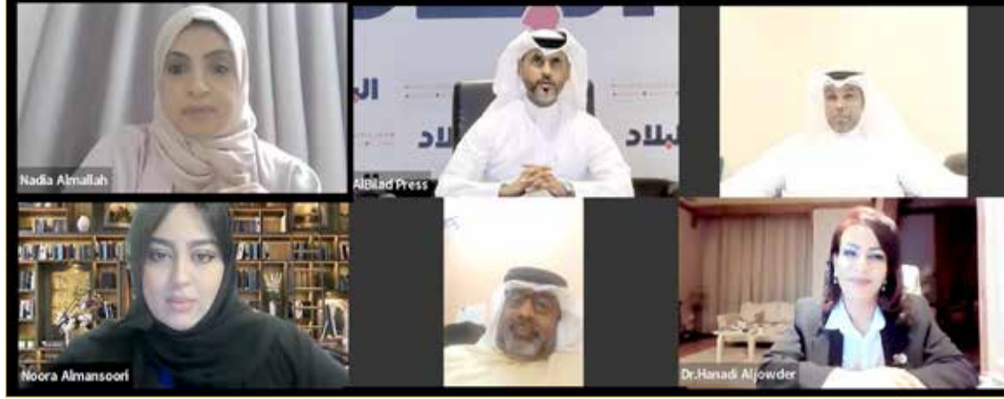
المشاركون بندوة "البلاد" التي أدارها الرمز إبراهيم النهام

وختمت المنصوري "كما يركز ويوثق التجربة الديمقراطية ويقدم التوصيات المهنية على المستوى الإيجابي والتشريعي لتطوير العملية الانتخابية والتي تعزز النزاهة وضمان تطبيق المعايير الدولية في الرقابة على الانتخابات فضلاً عن توثيق هذه التجربة وتعميمها على المكتبات والباحثين والمؤسسات الرسمية".