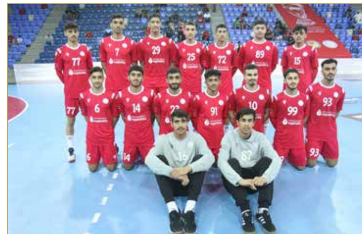
منتخبنا الوطني للناشئين لكرة اليد

تحديد المركزين السابع والثامن بين قطر وأوزبكستان في آسيوية الناشئين