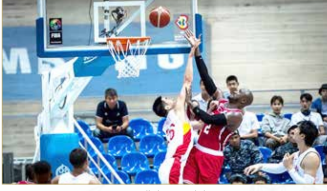
لقاء منتخبنا والصين

التصفيات في شهر نوفمبر المقبل حينما يستضيف منتخبنا نظيره اليابان يوم 11 نوفمبر، وبعدها يلتقي الصين يوم 14 نوفمبر، ثم يغادر لمواجهة استراليا يوم 23 فبراير 2023، وأخيراً يواجه اليابان يوم 26 فبراير.