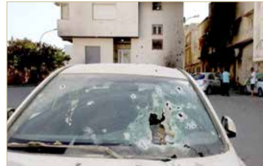
جانب من أثار الدمار جراء القتال في طرابلس

دعا المجلس الرئاسي الليبي جميع الأطراف السياسية إلى تحمل مسؤولياتهم من أجل استقرار ليبيا، وتجنب البلاد أتون أي حرب محتملة. وأكد المجلس الرئاسي الليبي السير بخطوات ثابتة نحو الاستقرار والمصالحة الوطنية، مشدداً على عدم التفريط فيما تحقق من مكاسب على صعيد إنهاء الانقسام السياسي وتوحيد مؤسسات البلاد، وتبادل رئيسا الحكومتين في ليبيا عبدالحامد الدببية وفتح باشاغا الاتهامات بـ "العدوان" والإجرام" مع انتهاء اشتباكات بين المجموعات المسلحة الموالية للطرفين في العاصمة الليبية أسفرت عن سقوط 32 قتيلاً و 159 جريحاً حسب حصيلة رسمية.