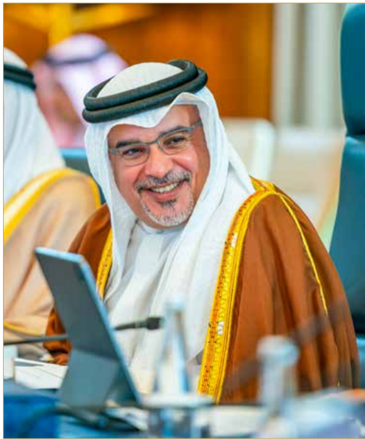
سمو نائب جلالة الملك ولي العهد يترأس الاجتماع الاعتيادي الأسبوعي لمجلس الوزراء

والمؤهلات العلمية بما يدعم تسريع وتسهيل توظيف المواطنين، على أن يراعى فيها التدقيق بالشكل اللازم على المؤهلات العلمية الخاصة بالمهن التخصصية في مجالات الطب والهندسة وغيرها بحسب الإجراءات المتبعة. (04)