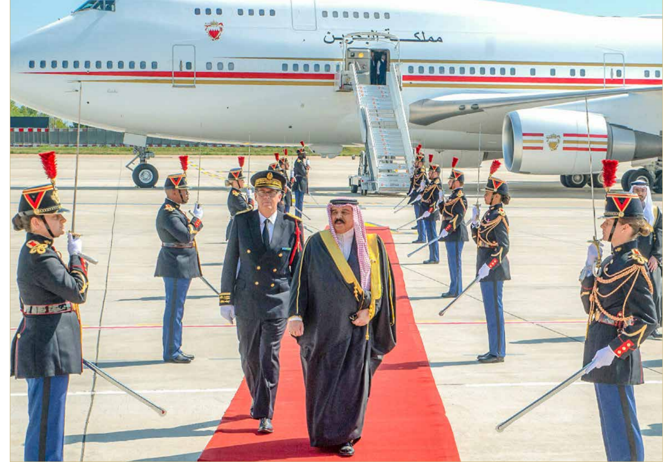
جلالة الملك المعظم يصل إلى الجمهورية الفرنسية