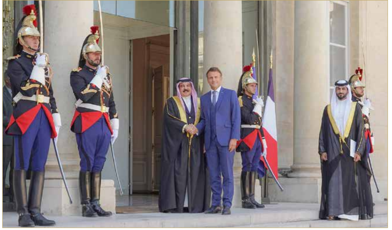
جلالة الملك المعظم عقد جلسة مباحثات مع رئيس الجمهورية الفرنسية في باريس

المنامة - بنا عقد عاهل البلاد المعظم صاحب الجلالة الملك حمد بن عيسى آل خليفة، ورئيس الجمهورية الفرنسية إيمانويل ماكرون، جلسة مباحثات رسمية في قصر الاليزيه بالعاصمة الفرنسية باريس أمس. وكان صاحب الجلالة قد وصل إلى قصر الاليزيه، حيث جرت لجلالته مراسم الاستقبال الرسمية، وكان الرئيس الفرنسي في مقدمة مستقبلي جلالة الملك المعظم، مرحباً بجلالته وبزيارته للجمهورية الفرنسية. وتناولت المباحثات سبل تعزيز علاقات الصداقة والتعاون بين البلدين الصديقين على جميع الأصعدة والمستويات، والمستجدات الإقليمية والدولية والقضايا محل الاهتمام المشترك. وتم تأكيد أهمية تطوير العلاقات الثنائية بين البلدين والاقتصاد والتجارة والاستثمار والثقافة والسياحة وآفاق تطويرها وتمييزها بما يحقق المنفعة المشتركة للبلدين الصديقين. وأكد صاحب الجلالة ملك البلاد المعظم، موقف مملكة البحرين الداعم للسلام والتعايش والتسامح في العالم أجمع، وإيمانها بالحوار وحل القضايا بالطرق الدبلوماسية السلمية، ونبذ الإرهاب والعنف والتطرف، لما من شأنه تلبية تطلعات وآمال شعوب العالم لتحقيق الأمن والاستقرار والازدهار. (02) و(03)