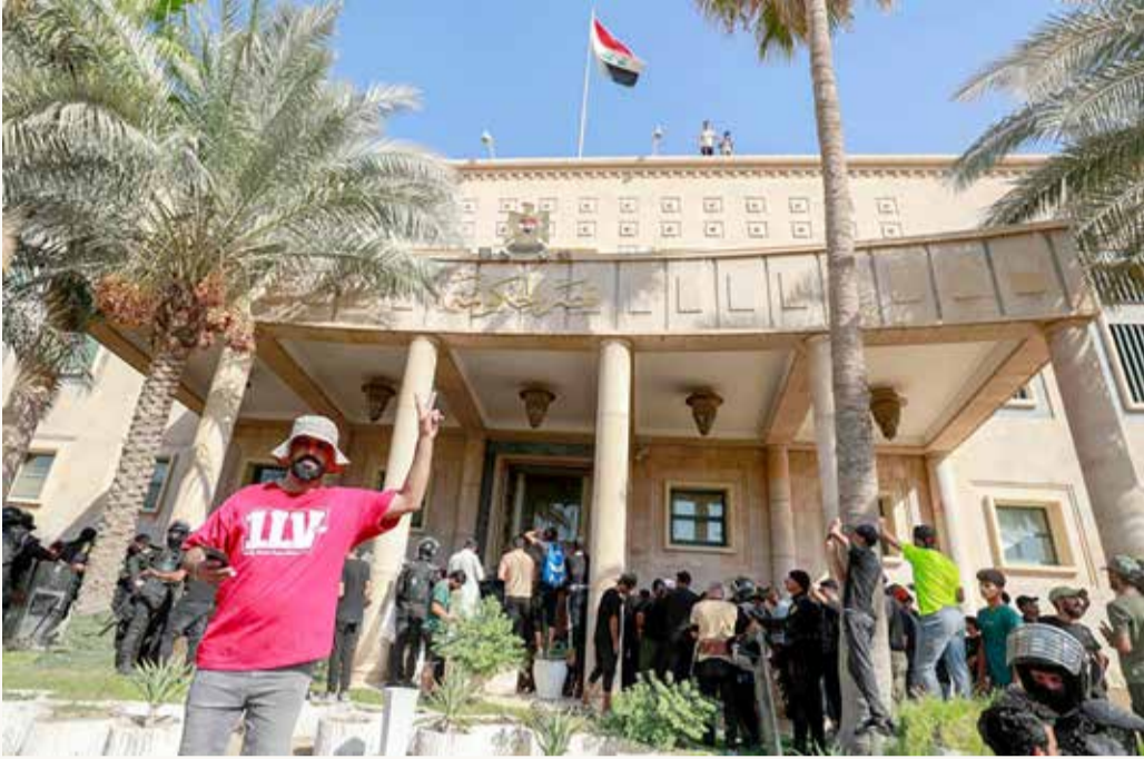
أنصار الصدر يقتحمون القصر الجمهوري

وقال الصدر في تغريدته "كنت قد قررت عدم التدخل في الشؤون السياسية، والآن أعلن الاعتزال النهائي، وعلق كافة المؤسسات، إلا المرقد الشريف والمتحف الشريف، وهيئة تراث آل الصدر". وأضاف أن "الكل في جل مني، وإن مت أو قتلت فأسالكم الفاتحة والدعاء". وقال الصدر أيضاً "إنني لم أدع يوماً العصمة أو الاجتهاد ولا حتى القيادة وإنما أمر بالمعروف وناه عن المنكر". وأوضح "ما أردت إلا أن أقوم