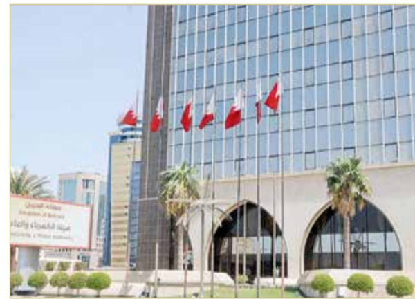
ديوان الرقابة المالية والإدارية