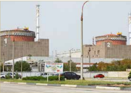
محطة زابورجيا الأكبر في أوروبا

وذكرت الوكالة نقلاً عن المسؤولين أن مستويات الإشعاع في محطة الطاقة النووية طبيعية، والوضع هناك تحت السيطرة. وتنفى كييف وموسكو استهداف محطة الطاقة النووية، وهي الأكبر في أوروبا، وتبادلنا الاتهامات حول المسؤولية عن حوادث قصف في محيطها. وفي وقت سابق من أمس الاثنين، قالت وزارة الدفاع الروسية، إنه تم إسقاط طائرة مسيرة أوكرانية "كانت تحاول مهاجمة محطة زابورجيا النووية"، فيما دعا الكرملين المجتمع الدولي إلى "الضغط على أوكرانيا" من أجل خفض التوتر العسكري عند المحطة، متهما كييف بـ"تعزيز أوروبا للخطر". وقالت وزارة الدفاع حسبها نقلت وكالات أنباء روسية، إنه تم إسقاط الطائرة المسيرة بالقرب من حواصة النفايات النووية بالمنشأة، لافتة إلى أنه "لم تقع أضرار جسيمة ومستويات الإشعاع طبيعية". وكررت وكالة "تاس" للأنباء نقلاً عن مسؤول عينته روسيا في شرق أوكرانيا، أمس، أن السلطات