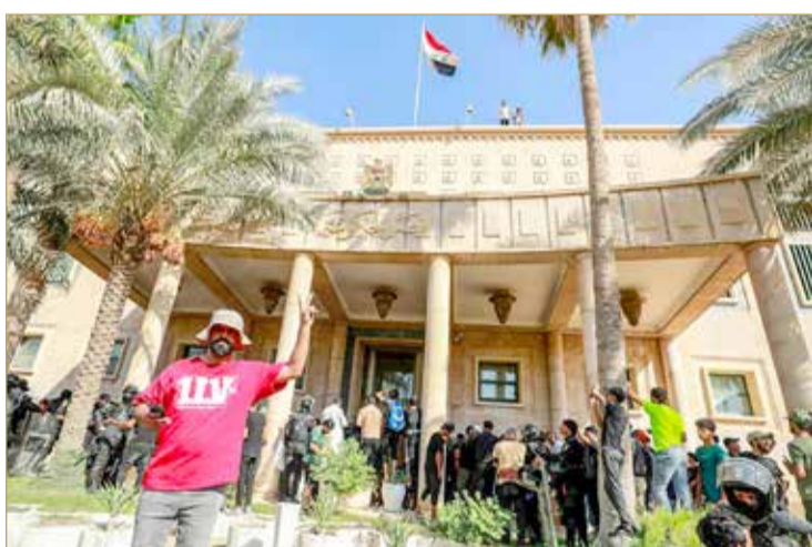
أنصار الصدر يقتحمون القصر الجمهوري

بغداد - وكالات أعلن الزعيم الديني مقتدى الصدر أمس "الاعتزال النهائي" عن العمل السياسي، وسرعان ما أعلنت السلطات العراقية عن فرض حظر تجول شامل في العراق وإرسال تعزيزات عسكرية إلى المنطقة الخضراء، مع اقتحام مؤيدي الصدر مبنى القصر الجمهوري ومبنى القصر الحكومي وأيضاً مبنى محافظة ذي قار، فيما أحرق المتظاهرون الإطارات في الشوارع وسط إجراءات أمنية مشددة. وعمد مسلحون من الحشد الشعبي إلى إطلاق الرصاص الحي، والاشتباك مع المتظاهرين، ما أدى إلى سقوط قتيلين، وعشرات الجرحى. (16)