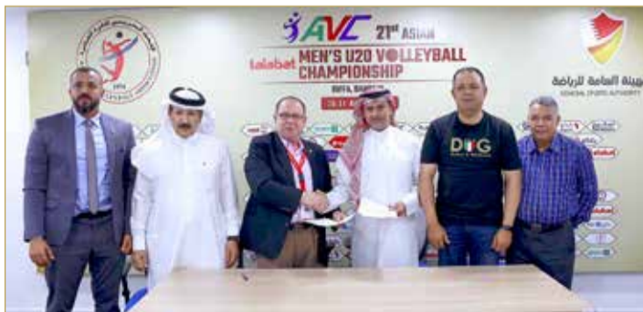
أثناء توقيع اعتمادية حصول البحرين على درجة الامتياز في التنظيم

بجانب صالات التدريب وفنادق البطولة والمواصلات والأمور المتعلقة بالتغذية، إضافة للتميز في التغطية الإعلامية على مستوى الصحافة المقروءة وشبكات التواصل الاجتماعي، وأوضح أن التقرير لم يتطرق لكل من فحص المنشطات وعقد مؤتمرات صحافية بعد كل مواجهة وذلك لعدم اعتمادية ذلك من قبل الاتحاد الآسيوي على