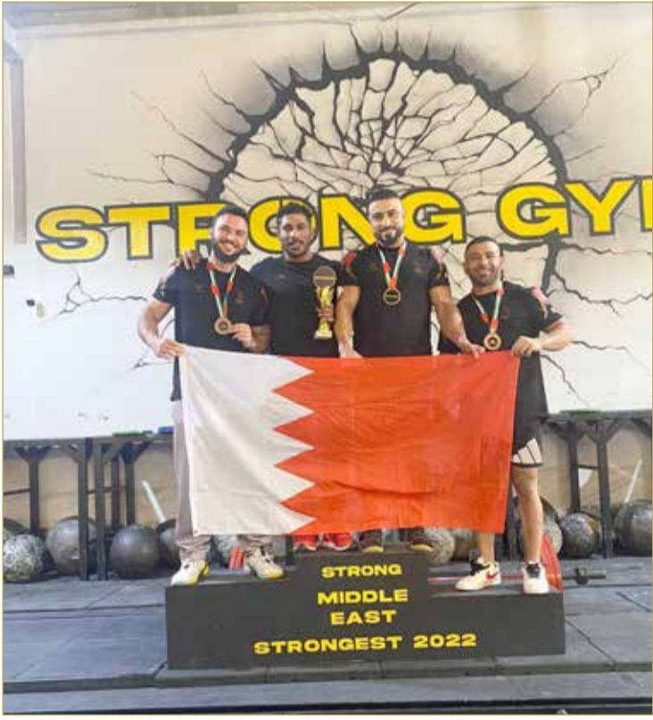
منتخب أقوى رجل على منصة التتويج