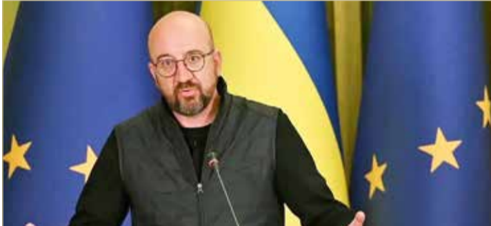
رئيس المجلس الأوروبي شارل ميشال في كييف

مع تصاعد القلق الدولي بشأن محطة زابوريجيا الواقعة جنوب أوكرانيا والخاضعة لسيطرة القوات الروسية، حذر رئيس المجلس الأوروبي شارل ميشال من خطورة الوضع على أوروبا برمقتها. وقال في تصريحات، أمس (السبت)، إن روسيا تضع العالم أجمع أمام خطر نووي. كما شدد على وجوب بقاء مفتشي الوكالة الذرية في تلك المحطة التي تعتبر الأضخم في أوروبا.