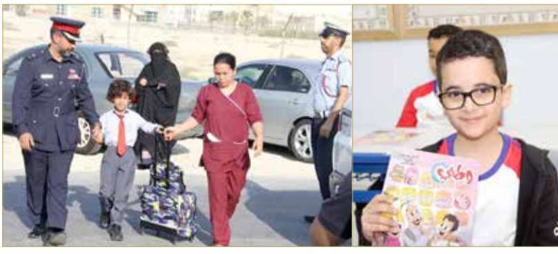
المنامة - وزارة الداخلية

تعزيزاً لمبدأ الشراكة المجتمعية الذي تنتهجه وزارة الداخلية وبمناسبة عودة الطلبة إلى المدارس، قامت شعبة شرطة خدمة المجتمع بمديرية شرطة المحافظة الجنوبية بزيارة إلى مدرسة حوار الدولية مع بداية اليوم الدراسي، شاركت خلالها في تنظيم الحركة المرورية بمحيط المدارس وتأمين انتقال الطلبة وأولياء الأمور وأعضاء الهيئتين الإدارية والتعليمية. كما تم خلال الزيارة، زيارة أحد الفصول الدراسية والالتقاء بالطلبة وتقديم بعض النصائح والإرشادات لهم والدور الذي تقوم به شرطة خدمة المجتمع من أجل تهيئة الأجواء الإيجابية بالمدارس لاستقبال الطلبة بدءاً من اليوم الدراسي الأول، كما تم توزيع مجلة "وطني" على جميع الطلبة، متمنين لجميع الأمن والسلامة والتفويق في العام الدراسي الجديد.