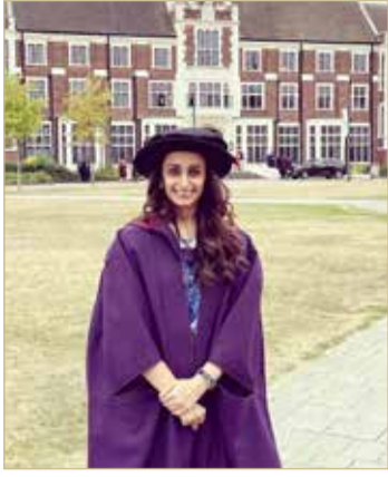
الشيخة حصة بنت خالد