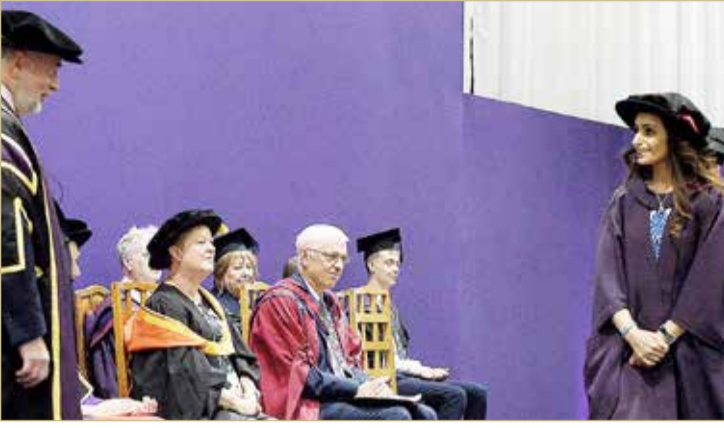
الشيخة حصة بنت خالد خلال الحفل

مجتمعاتنا. وتأتي هذه الدراسة في وقت مناسب، لاسيما مع تزايد اهتمام المملكة ودول المنطقة بالأهداف الإنمائية للألفية الجديدة 2030 التابعة للأمم المتحدة، والتي تدعو إلى توظيف الرياضة لتحقيق الأهداف الاجتماعية، الأمر الذي يكسب هذه الدراسة أهمية بالنسبة لصناع القرار وواضعي السياسات والهيئات المختصة لدعم الجهود الوطنية الرامية إلى تنفيذ أهداف التنمية المستدامة على المدى البعيد.