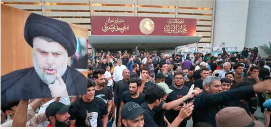
سبق للتيار الصدري أن رفض ترشيح السوداني

يبدو أن الإطار التنسيقي، الذي يضم نوري المالكي، وتحالف الفتح، بالإضافة إلى فصائل وأحزاب موالية لإيران، لن يتخلى عن مرشحه لرئاسة الحكومة في العراق، على الرغم من الاشتباكات التي حصلت الأسبوع الماضي، مع أنصار التيار الصدري، في قلب العاصمة بغداد، مباشرة بتصاعد عنيف للأزمة السياسية المستمرة في البلاد منذ أشهر.