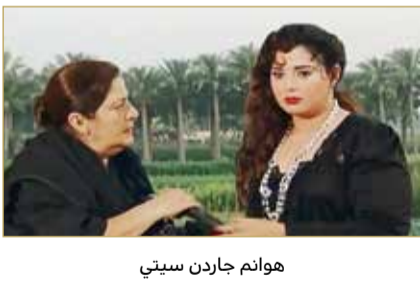
هوانم جاردن سيتي