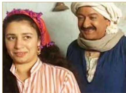
لن أعيش في جلباب أبي