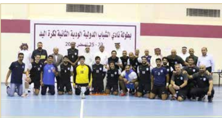
جانب من ختام البطولة