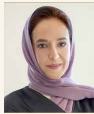
سمو الشيخة حصة بنت خليفة

لاستضافة المخيم الأول لرواد المستقبل، والذي يأتي ليؤكد توافق أهداف الحوكمة البيئية والاجتماعية وحوكمة الشركات (ESG) للبنك مع رؤية إنجاز البحرين والتمثلة في تطوير المواهب. ونحن نتطلع لتوسيع نطاق شراكاتنا لتشمل مختلف مؤسسات الدولة وعقد المزيد من الفعاليات المماثلة مستقبلاً.