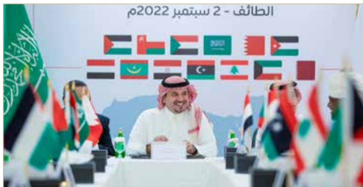
الأمير فهد بن جلوي