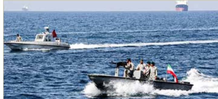
واشنطن تقول إنها تمتلك حق الرد على أي توتر تحدته إيران

البحرية الأميركية اعترضت سفينة حربية إيرانية، احتجزت واعتقلت سفينتين أميركيتين يدون طاقم يديرهما الأسطول الخامس في البحر الأحمر، في الأول من سبتمبر، بعد يومين من فشل بحرية الحرس الثوري الإيراني من الاستيلاء على سفينة ماثلة في مياه الخليج العربي.