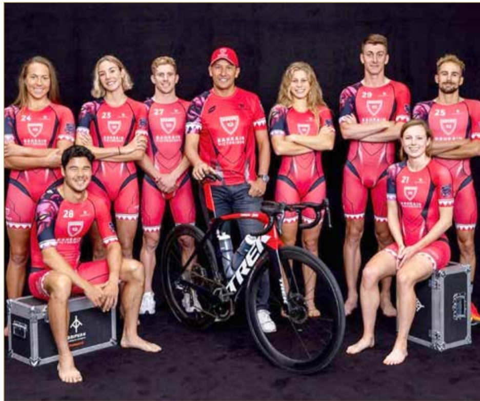
صورة جماعية للفريق