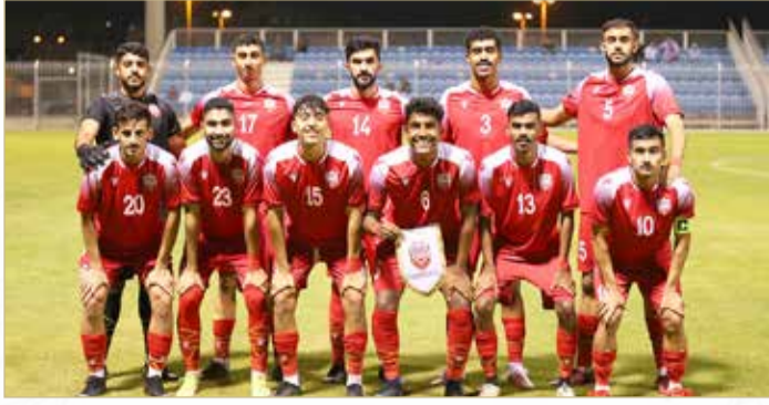
منتخب الشباب لكرة القدم