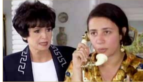
امرأة من زمان الحب