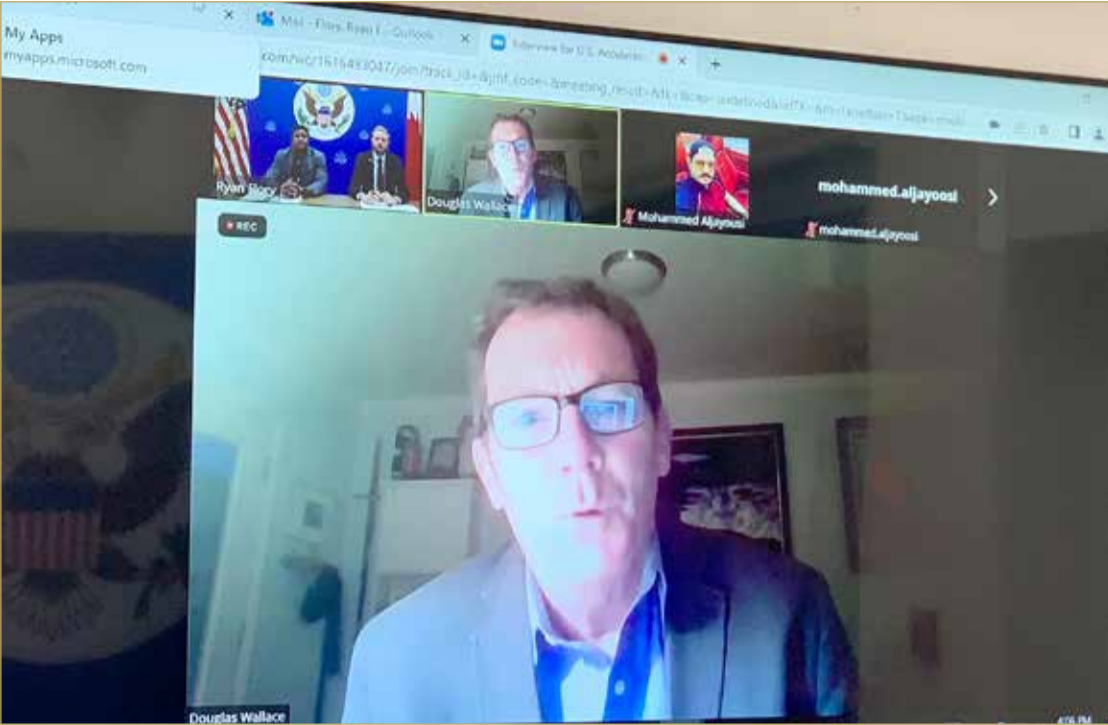
ممثل وزارة التجارة الأمريكية مدير مركز الصادرات الأمريكي في سان فرانسيسكو

أعلنت إدارة التجارة الدولية (ITA)، الوكالة التابعة لوزارة التجارة بالولايات المتحدة الأمريكية وسفارة الولايات المتحدة لدى مملكة البحرين عن دعوة مجموعة من الشركات الناشئة في مملكة البحرين للمشاركة في برنامج U.S. Accelerator Connector عبر لقاء افتراضي Webinar مساء يوم الأربعاء الموافق 7 سبتمبر الجاري وذلك للتعرف على برامج الحاضنات ومسرع الأعمال من الدرجة الأولى في الولايات المتحدة الأمريكية. كما ستتم دعوة شركات ناشئة من الإمارات العربية المتحدة وإسرائيل إلى جانب الشركات البحرينية للمشاركة في اللقاء.