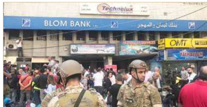
حوادث اقتحام المصارف تزايدت في لبنان