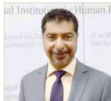
رئيس المؤسسة الوطنية لحقوق الإنسان

المدينة والسياسية؛ وذلك تحقيقاً للهدف السادس عشر من أهداف التنمية المستدامة الذي يُعنى بنشر السلام والعدل والديمقراطية.