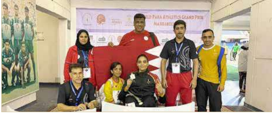
لقطة من التتويج