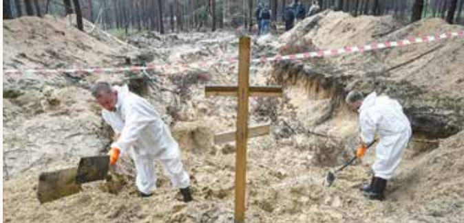
مقبرة جماعية في منطقة إيزيوم

شديدة، وهي تتجه بشكل متزايد إلى آسيا للحصول على الدعم الاقتصادي والدبلوماسي.