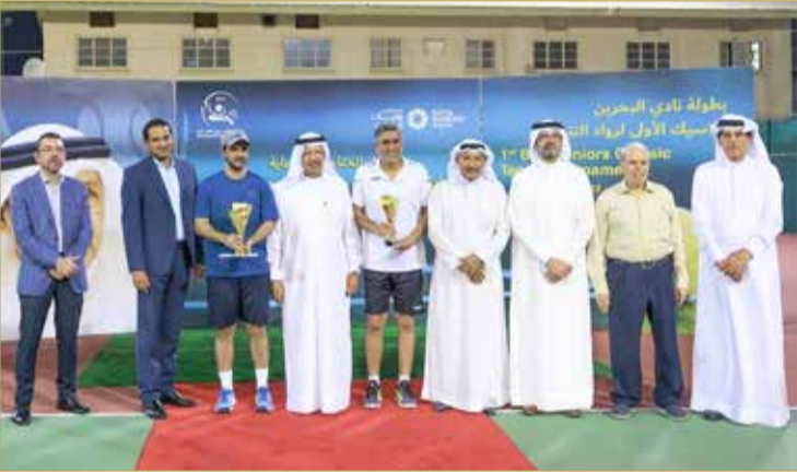
لقطات من التتويج