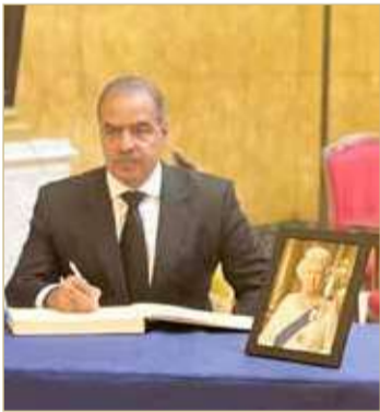
الشيخ فوزان بن محمد آل خليفة

علاقات الصداقة الراسخة بين مملكة البحرين والمملكة المتحدة في العديد من المجالات. كما قدم سفير مملكة البحرين لدى المملكة المتحدة وحرمة واجب العزاء في قاعة ويستمينيستر التاريخية في مقر البرلمان البريطاني، والتي تحتضن نعش جلالتها لـ 4 أيام حتى موعد الجنازة في 19 سبتمبر المقبل.