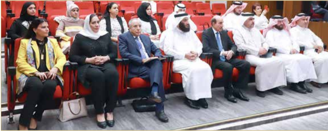
أمانتا الشورى والنواب تنظمان ندوة برلمانية بمناسبة اليوم الدولي للديمقراطية

الاقتصادية والاجتماعية والثقافية أسهمت وتسهم في حماية حقوق الإنسان وحيواته الأساسية، وبناء مجتمع يقوم على الديمقراطية، فمملكة البحرين تؤمن بأنه متى احترقت حقوق الإنسان عم الأمن والسلام واستدامت التنمية والازدهار. وأشار فرج إلى أن مملكة البحرين تولي دعماً بالغاً للدور المحوري الذي تقوم عليه الصحافة والإعلام لبقائها التام بأن حرية التعبير والرأي من الحريات الأساسية.