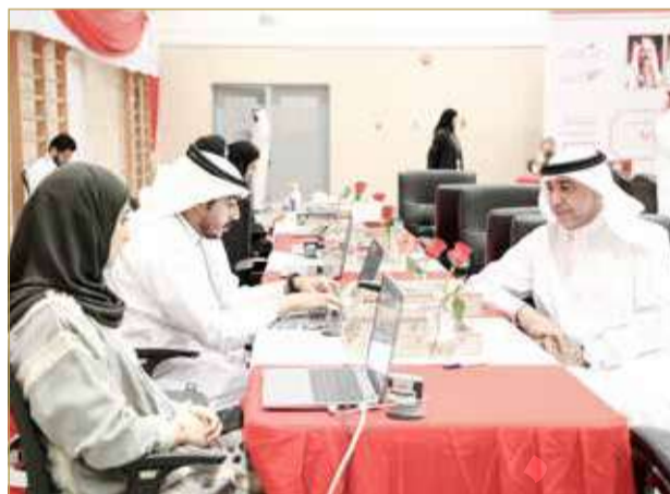
أكثر من 124 ألف مواطن راجع فيه خلال يومين