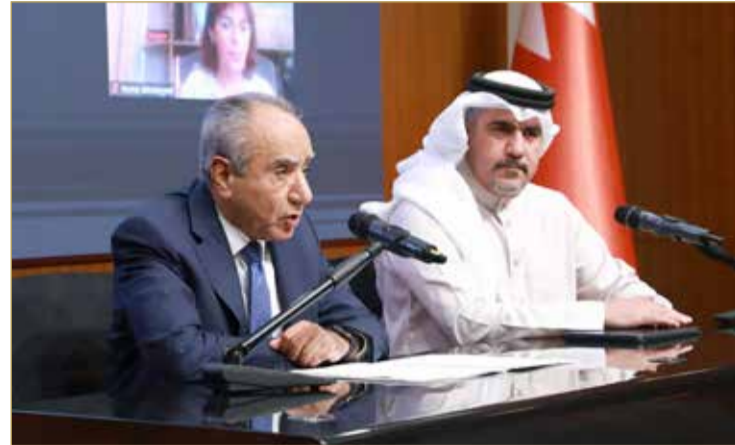
البناء وفرج خلال الندوة

حققت مملكة البحرين من إنجازات على الصعيد الديمقراطي، هي ثمرة الرؤية الملكية السامية لعاهل البلاد المعظم، وجهود صاحب السمو الملكي ولي العهد رئيس مجلس الوزراء، التي أرست دعائم الممارسة الديمقراطية النزيهة في إطار دولة القانون والمؤسسات، واحترام حقوق الإنسان والحريات العامة. وبمناسبة قرب الانتخابات النيابية والبلدية لمملكة البحرين، استذكر فرج نزاهة وشفافية الانتخابات عبر خمس