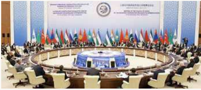
من قمة منظمة شنغهاي

وتعكس تصريحات شي وبوتين الاضطرابات التي تشهدها العلاقات الدولية منذ عدة أشهر، لاسيما منذ بدء الغزو الروسي لأوكرانيا في نهاية فبراير. فمنذ ذلك الحين، استهدفت روسيا عقوبات اقتصادية غربية