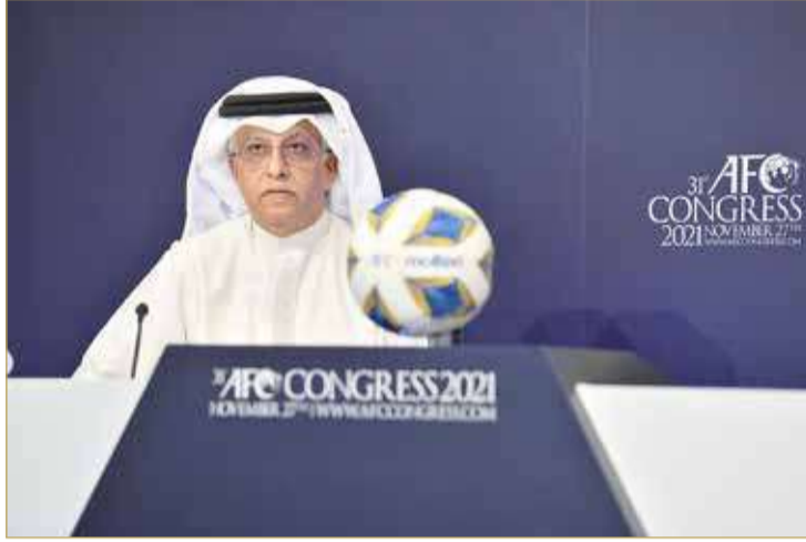
سلمان بن إبراهيم

جاء ذلك خلال اجتماع الجمعية العمومية الثاني عشر لاتحاد غرب آسيا الذي عقد في العاصمة الأردنية عمان يوم أمس (الخميس) برئاسة الأمير علي بن الحسين وحضور ممثلي الاتحادات الوطنية الأعضاء. وأكد الأمير علي بن الحسين رئيس اتحاد غرب آسيا على ضرورة دعم الاتحادات الاثني عشر المنضوية تحت مظلة الاتحاد لترشح الشيخ سلمان بن إبراهيم وذلك ترسيخاً لمفهوم توحيد الصفوف، وبدورها انفتحت الجمعية العمومية مع الأمير علي بن الحسين وأكدت تأييدها ودعمها للشيخ سلمان