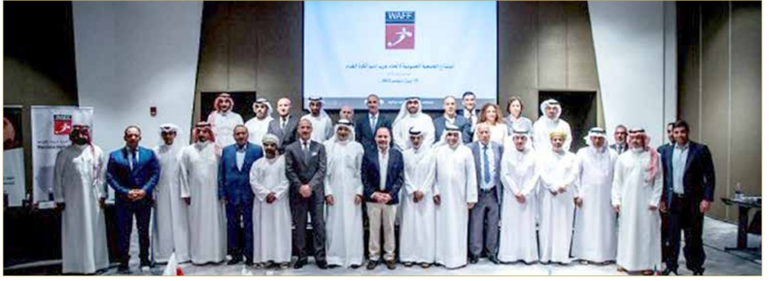
جانب من اجتماع الجمعية العمومية لاتحاد غرب آسيا