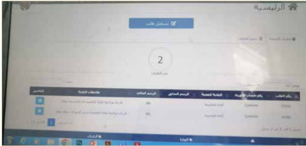
صورة من مراجعات المواطن لأمانة العاصمة

البلاد أتقدم بشكواي ضد أمانة العاصمة بخصوص موضوع تخفيض رسوم الأسر البحرينية، حيث إنني تقدمت بطلبي منذ أشهر بطلب تخفيض رسوم البلدية؛ لكوني مستأجراً من الأوقاف الجعفرية ولست مالكا، حيث إنني شهرياً أدفع رسوماً للبلدية 6 دنانير بدلا من دينارين، ولا يمكنني صرف أكياس القمامة بحجة أنني ليس لدي دعم. الجدير بالذكر بأنني في مسكني السابق كنت مستأجراً أيضاً من الأوقاف، وكانت الرسوم دينارين وعند انتقالي للسكن الحالي صدمت برسوم 6 دنانير للبلدية، أي الضعف وعدم استطاعتي صرف أكياس القمامة. تقدمت بالطلب إلكترونياً في الموقع مرتين، وفي المرتين يتم رفض طلبي وإخباري بأنني مالك والمالك لا يحصلون على تخفيض، ولكنني لست مالكا أنا مستأجراً من الأوقاف الجعفرية، ويوجد لدى عقد الإيجار وقد تم تزويد موظفي البلدية بجميع الإثباتات التي تثبت أحقيتي في الحصول