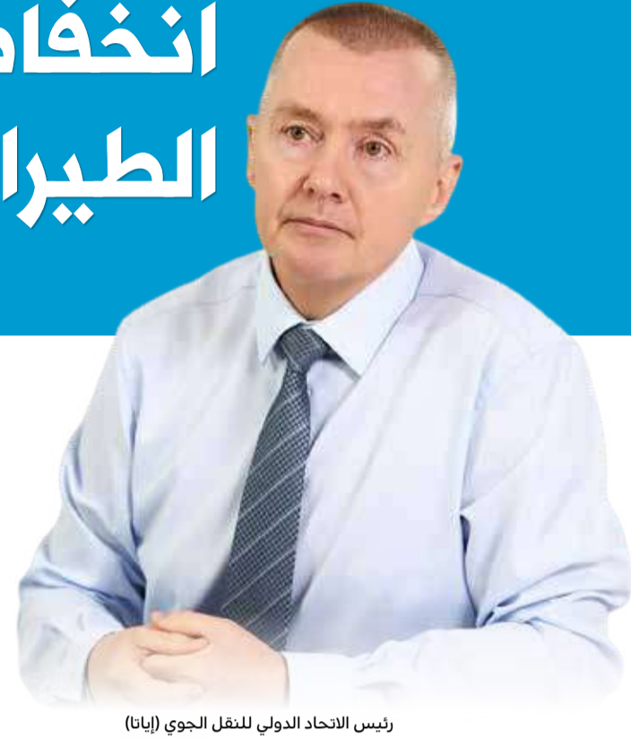
رئيس الاتحاد الدولي للنقل الجوي (إياتا)

قال رئيس الاتحاد الدولي للنقل الجوي (إياتا)، ويلي والش إن هناك انتعاشاً في سفر الركاب بصورة مستمرة، مدفوعاً بالنمو في الرحلات المحلية والدولية، لكن ارتفاع أسعار الطائرات سيظل يمثل تحدياً لصناعة الطيران. وبلغ إجمالي حركة المسافرين العالمية في يوليو 75% من مستويات ما قبل الجائحة في عام 2019، مع السفر الداخلي بنسبة 86.9% من مستوى يوليو 2019، حيث أظهر الطلب الصيني تحسناً قوياً، حسبما ذكرت أكبر هيئة تجارية في صناعة الطيران مؤخراً. وبلغت حركة المرور الدولية 67.9% من مستويات يوليو 2019، مع تخلف منطقة آسيا والمحيط الهادئ بشكل كبير عن الأسواق الأخرى. كما قال ويلي والش المدير العام لـ IATA خلال مؤتمر صحفي عبر الإنترنت "الصناعة تحقق انتعاشاً قوياً بينما نمر بموسم الصيف في نصف الكرة الأرضية، والأسواق المحلية تتعافى الآن بشكل جيد مع زيادة النشاط في السوق الصينية، ونتوقع أن يستمر هذا في أرقام أغسطس وسبتمبر، بالنظر إلى الاتجاهات الإيجابية التي نراها في الحجوزات الآجلة" بحسب موقع thenationalnews.