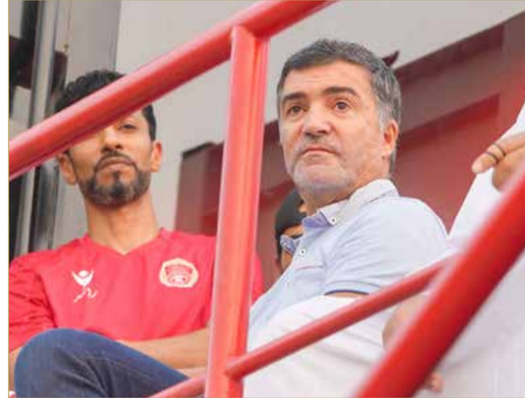
حضور مدرب المنتخب لمراقبة المباريات

يذكر أن الدور قبل النهائي سيقام بنظام المقص عندما يلتقي أول المجموعة (أ) مع ثاني المجموعة (ب) ويلتقي ثاني المجموعة (أ) مع أول المجموعة (ب).