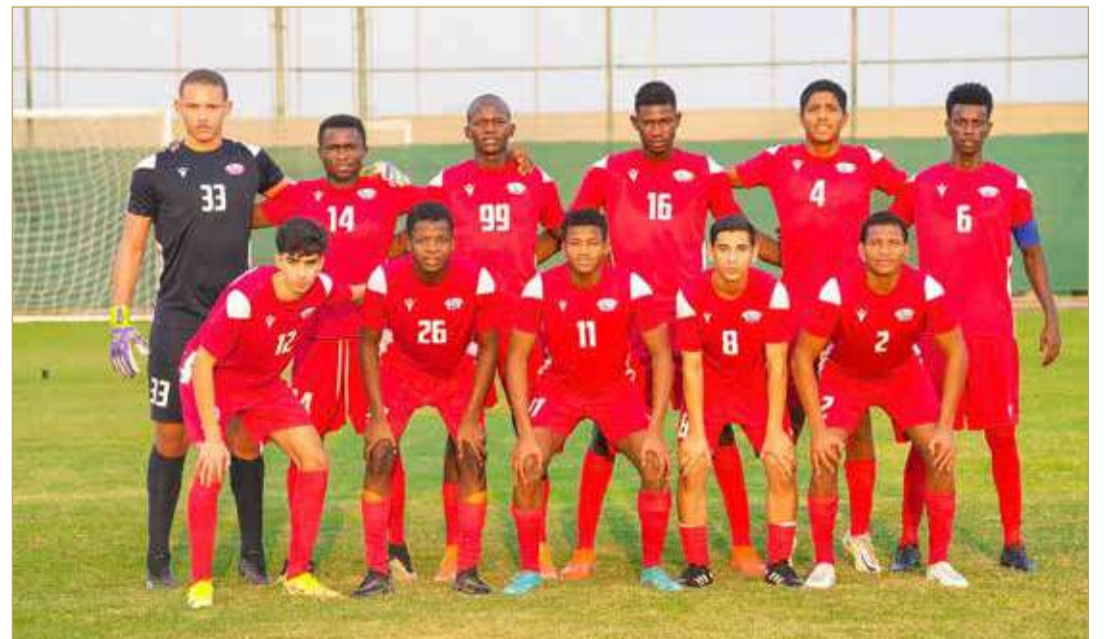
فريق طموح لكرة القدم