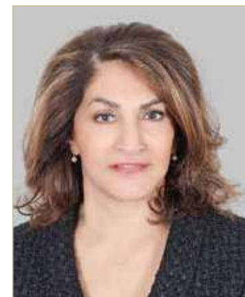
الشبيخة هند بنت سلمان

يونيو 2016، الاجتماع الاقليمي السادس عشر لدول آسيا والمحيط الهادي في منظمة العمل الدولية بالي / إندونيسيا من 6 _ 9 نوفمبر 2016، الدورة (106) لمؤتمر العمل الدولي، جنيف من 5 _ 16 يونيو 2017، والدورة (46) لمؤتمر العمل العربي القاهرة من 14 _ 21 ابريل 2018. وجاء هذا التكريم للشبيخة هند بنت سلمان ال خليفة لدورها البارز ولجهودها المخلصة في دعم مسيرة المنظمة، فقد كانت من أبرز الذين ساهموا وبادروا وقدموا الكثير من المبادرات والأفكار والإنجازات للمنطقة العربية مركزاً على أصحاب الأعمال والعمال، وتقديم الحلول المثل في تحقيق الأهداف التي تسعى من أجل تحقيقها المنظمة العربية والغرف التجارية أصحاب الأعمال واتحاد العمال، حماية لهم وضماناً لحقوقهم.