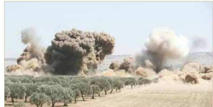
تشهد الحدود التركية السورية اشتباكات بشكل متقطع

وأضاف أن القصف أدى لسقوط قتلى وجرحى في صفوف القوات الحكومية، حيث أكد مقتل 3 أشخاص عسكريين من الموجودين في الموقع، وعدد القتلى مرشح للارتفاع لوجود معلومات عن قتلى آخرين، إضافة لوجود جرحى بعضهم في حالة خطيرة. لكن دمشق لم تؤكد النباء حتى الآن.