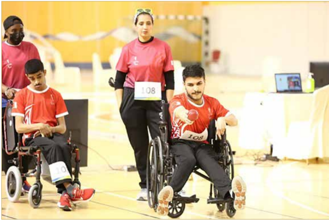
جانب من منافسات لعبة البولتنشيا

الرفاع - المكتب الإعلامي لسمو الشيخ خالد بن حمد بن عيسى آل خليفة: