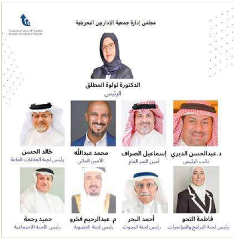
مجلس إدارة جمعية الإداريين البحرينية