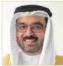
النائب أحمد السلام