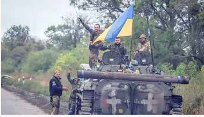
القوات الأوكرانية تحقق تقدماً منملاً في منطقة خاركيف

بعد الهجوم المضاد الأوكراني الناجح في شمال شرق البلاد، وصلت الحرب الفوضوية التي بدأها الرئيس الروسي فلاديمير بوتين الآن مباشرة إلى عتبة بابه، حيث أصاب القصف بالمدفعية أهدافاً عسكرية في روسيا، وأمر المسؤولون الروس في المدن والبلدات على طول الحدود بالإجلاء العاجل، وفقاً لصحيفة "واشنطن بوست".