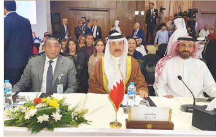
حميدان مترسدا وفد البحرين في مؤتمر العمل العربي الـ 48 في القاهرة

ترأس وزير العمل جميل حميدان، أمس الأحد، وفد مملكة البحرين المشارك في أعمال الدورة الـ (48) لمؤتمر العمل العربي، الذي يعقد في القاهرة بجمهورية مصر العربية الشقيقة، خلال الفترة من 26-18 سبتمبر الجاري، وذلك تحت رعاية رئيس جمهورية مصر العربية، عبد الفتاح السيسي، وبحضور وزراء العمل إلى جانب رؤساء منظمات أصحاب العمل وممثلي الاتحادات والنقابات العمالية في الدول العربية. ويتضمن وفد مملكة البحرين، برئاسة وزير العمل، من ممثلين عن الحكومة وأصحاب العمل (غرفة تجارة وصناعة البحرين)، والعمال (الاتحاد العام لنقابات عمال البحرين، والاتحاد الحر لنقابات عمال البحرين)، حيث