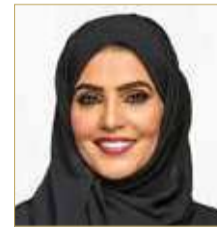
النائب الثاني لرئيس المجلس الوطني الاتحادي الإماراتي ناعمة الشرحان