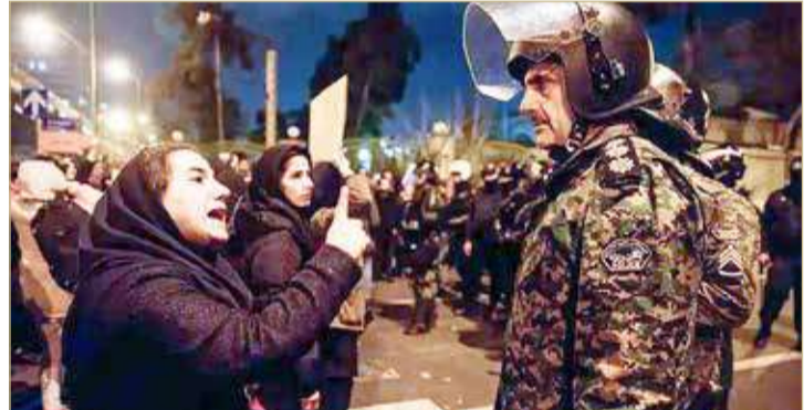
من تظاهرات سابقة في إيران

أقدم شبان غاضبون أثناء تشييع جثمان الفتاة البالغة من العمر 22 عاماً والتي قضت جراء التعذيب على أيدي الأمن، في مسقط رأسها بمدينة سقز في كردستان إيران، على تمزيق صور المرشد الإيراني علي خامنئي، ورميها بالحجارة ثم حرقها.