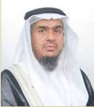
رئيس جهاز الخدمة المدنية

أصدر رئيس جهاز الخدمة المدنية أحمد الزايد توجيهات الخدمة المدنية رقم (6) للعام 2022 بشأن الموظفين المترشحين لعضوية مجلس النواب أو المجالس البلدية، والتي تهدف إلى بيان الأحكام والأسس المنصوص عليها بالمرسوم بقانون رقم (15) لسنة 2002 بشأن مجلسي الشورى والنواب وتعديلاته، والمرسوم بقانون رقم (35) لسنة 2001 بشأن إصدار قانون البلديات وتعديلاته، والتي يلزم تطبيقها في شأن الموظفين بالجهات الحكومية المختلفة الخاضعين لقانون الخدمة المدنية الصادر بالمرسوم بقانون رقم (48) لسنة 2010 وتعديلاته، الذين يرشحون أنفسهم لعضوية مجلس النواب أو المجالس البلدية. وأوضح الزايد أنه يمنح الموظفون