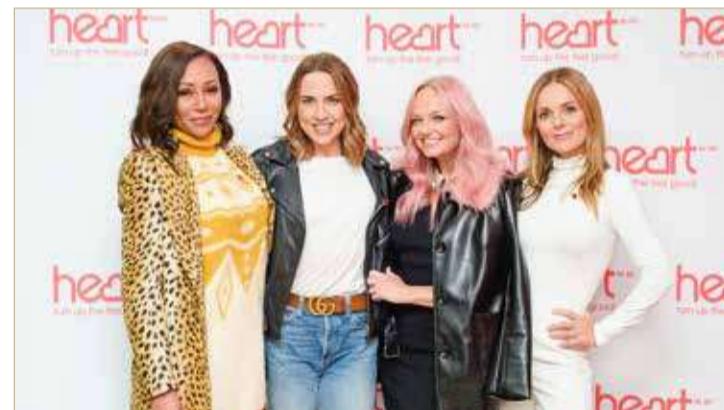
البلاد | طارق البهار

تتحدث ميلاني "ميل سي" تشيشولم عما تسميه "الأجزاء الصعبة" من ماضيها، في محاولة لمساعدة الشباب على الاستعداد بشكل أفضل لدخول عالم الشهرة الخفي والصعب، فهو بحسب النجمة البريطانية مجال صعب جداً عانت فيه الكثير. وأطلقت أخيراً نجمة سبايس جيرلز المعروفة لدى المعجبين باسم "سبورتري" الشهيرة، سيرتها الذاتية بعنوان "من أنا"، وشرحت بعض صراعاتها المبكرة في مقابلة جديدة مع صحيفة "ديلي ميل" وقالت: "عندما كانت جزءاً من واحدة من أكبر المجموعات مبيعاً في التسعينات كنت أتعامل مع كل من الاكتئاب السريري واضطراب الأكل، وانظر إلى الوقت الذي أعيشه على أنه "حقيبة مختلطة من العواطف"، وأضاف: "كنت على ما يرام لبضع سنوات، وعندما أنظر إلى الوراء، لا أعرف جسدياً كيف فعلت ذلك، وأفكر في مدى قلة ما عشت عليه ومقدار التمرين الذي كنت أقوم به إلى جانب جدول زمني وحشي!"