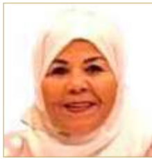
عضو مجلس النواب المصري شادية الجميل