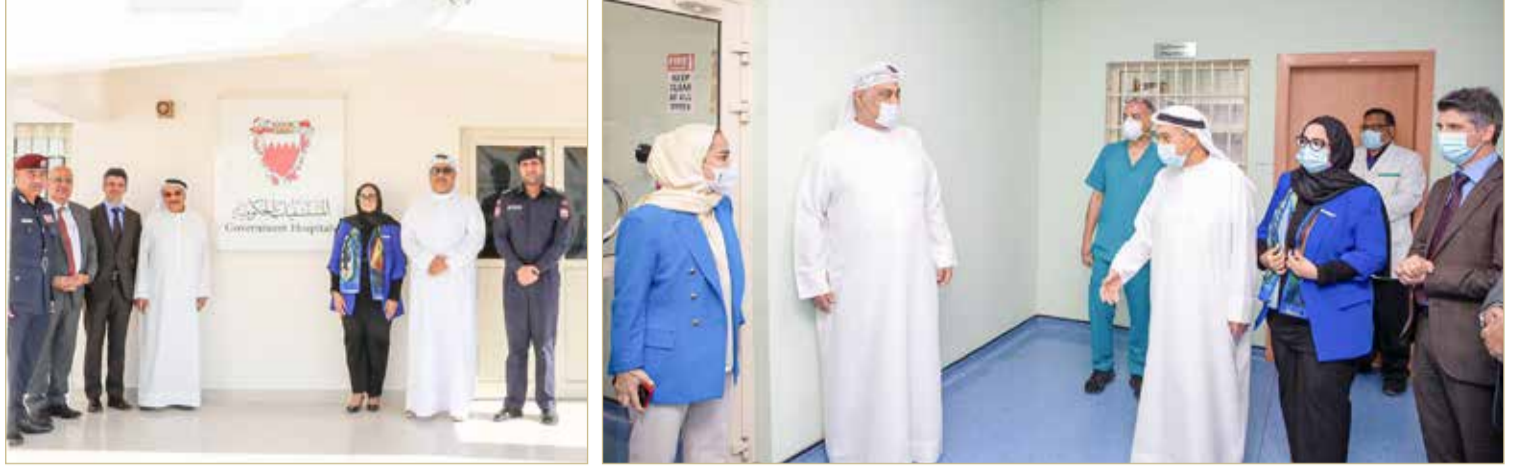
المنامة - وزارة الصحة

في إطار مواصلة الجهود لتوفير أفضل خدمات الرعاية الصحية والوقائية والعلاجية اللازمة لنزلاء مراكز الإصلاح والتأهيل، افتتح رئيس المجلس الأعلى للصحة الفريق طبيب الشيخ محمد بن عبدالله آل خليفة ووزيرة الصحة جلييلة بنت السيد جواد حسن، صباح أمس، العيادة الطبية لصالح تقديم خدمات الرعاية الصحية لنزلاء مراكز الإصلاح