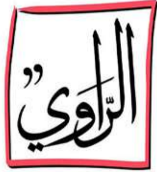
ملتقى الشارقة الدولي للراوي Sharjah International Narrator Forum

وقدم نجم في الاحتفالية ورقة بعنوان "القلوب مجتمعة" استعرض فيها العلاقات التاريخية والعميقة بين مملكة البحرين والمملكة العربية السعودية من خلال الزيارات التي قام بها الملك عبدالعزيز مؤسس الدولة السعودية للبحرين خلال فترة حكمه. من جانب آخر، يشارك راشد نجم في فعاليات النسخة الثانية والعشرين من ملتقى الراوي والذي ينظمه سنوياً معهد الشارقة للتراث في الفترة من 21 - 23 سبتمبر الجاري، في مركز إكسبو الشارقة ويحمل في دورته الحالية شعار "حكايات البحر" ومن المؤتمر أن يستقطب الملتقى هذا العام أكثر من 160 مشاركاً ومشاركة يشكلون نخبة من الخبراء والباحثين والحكواتيين والإعلاميين من 46 دولة، هي دول الخليج العربي والعراق والأردن وفلسطين وسوريا ومصر وتونس والجزائر والمغرب وموريتانا والسودان وليبيا وجزر القمر، كما يشارك من إفريقيا كل من كينيا والسنغال، ومن الدول الآسيوية المشاركة الهند وباكستان والصين وكوريا وسنغافورة والفلبين وأستراليا، وأما من أوروبا فتشارك