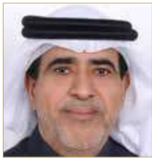
النائب خالد بوعنق