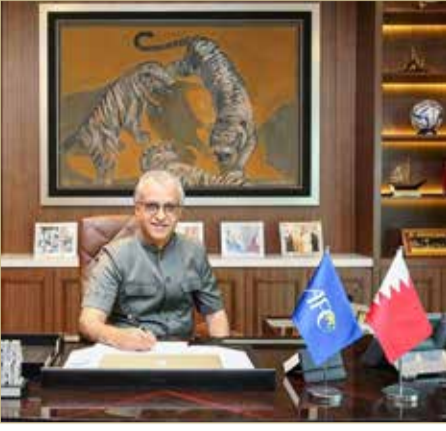
الشيخ سلمان بن إبراهيم

الآسيوية عبرت في خطاباتها الرسمية عن كامل الدعم والمساندة للشيخ سلمان بن إبراهيم آل خليفة "لمواصلة مسيرة البناء والتحديث في بيت الكرة الآسيوية، وتعزيز قيم الوحدة والتضامن بين أفراد المنظومة القارية، وتأكيداً على أهمية الاستقرار في قيادة الاتحاد القاري من أجل تحقيق المزيد من المنجزات على مختلف الأصعدة".