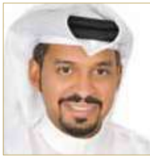
النائب إبراهيم النفيجي