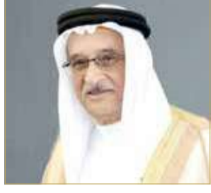
الشيخ محمد بن عبدالله