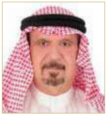
كاتب ومحلل سياسي (بحريني) موفق الخطاب