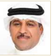
المحلل السياسي والخبير الإستراتيجي السعودي محمد الحبابي