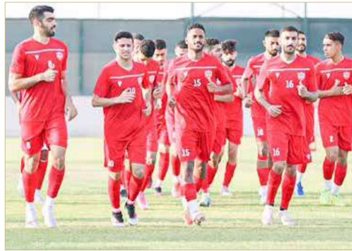
تدريبات منتخبنا الأولمبي