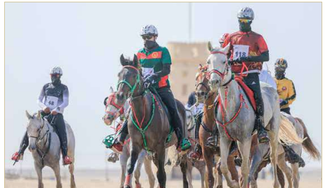
من سباقات القدرة في البحرين

ويأتي التعميم في إطار حرص الاتحاد على تحديث كافة التفاصيل المتعلقة بالملك وسباقات القدرة المشاركين في المسابقات التي ينظمها الاتحاد، وذلك لمراجعة الاتحاد من أجل تسجيل الجياد والفرسان تهيئاً لانطلاق الموسم الجديد 2022/2023. وطلب الاتحاد في التعميم ضرورة تسجيل الأسطبلات والمدربين والملك والمدرين والفرسان خلال الموسم الجديد، إضافة إلى اعتماد مدرب الأسطبل والفريق ونقل ملكية الجياد، إضافة إلى تحديث أرقام التواصل والتعرف على صلاحية جوازات الجياد.