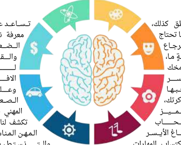
البلاد | شيماء عبدالكريم