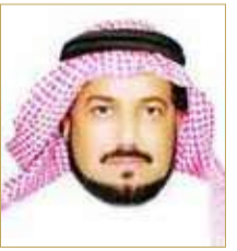
كاتب وإعلامي سعودي عبدالمطلوب البدراني