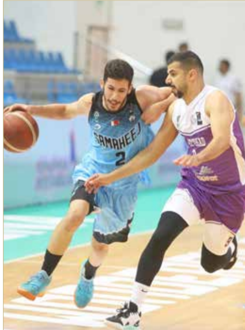
لقاء الاتحاد وسماهيج