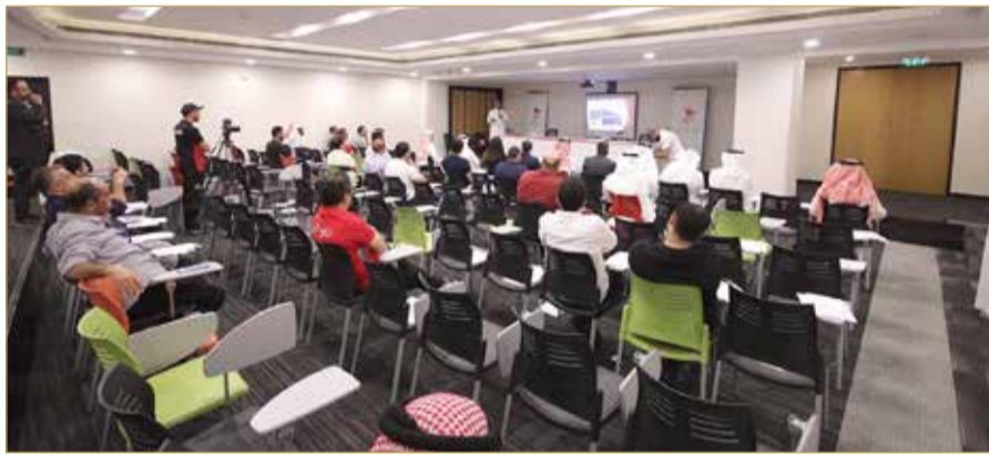
جانب من دورة المنسقين الإعلاميين في الأندية والاتحادات