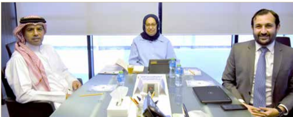
لجنة الحقوق والحريات العامة التابعة للمؤسسة الوطنية لحقوق الإنسان

ضاحية السيف - المؤسسة الوطنية لحقوق الإنسان