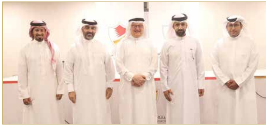
عسكر يتوسط أعضاء لجنة الإعلام الرياضي

مشيراً إلى أن الدورة التدريبية الخاصة بالمنسقين الإعلاميين في الأندية والاتحادات تمثل بداية لسلسلة من البرامج المشتركة بين الجانبين على سبيل تحقيق الأهداف والتطلعات، مقدماً شكره للمحاضرين والمتحدثين على تعاونهم وعلى المعلومات الثرية التي قدموها، مشمئاً كذلك الحضور المميز من المشاركين وتفاعلهم الكبير مع محاور الدورة التدريبية.