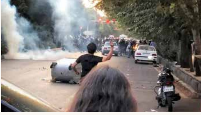
صورة متداوله للتظاهرات على مواقع التواصل

وجامعة يزد وسط البلاد. وأظهرت مقاطع فيديو تداولها ناشطون على مواقع التواصل الاجتماعي، تظاهر العشرات وسط تعالي الهتافات تنديداً بمقتل الفتاة العشرينية. أتى ذلك بعد تظاهرات عفت جامعات "طهران"، و"بهشتي"، و"تربيت مدرس"، و"طباطبائي"، و"أمير كبير"، في العاصمة أمس (الاثنين)، للتنديد بمقتل أميني. كما شهدت مشهد (مدينة مهمة تعتبر ذات أهمية دينية في شمال شرق البلاد) تجمعا مماثلاً، بحسب ما ذكرت وكالة "تسنيم".