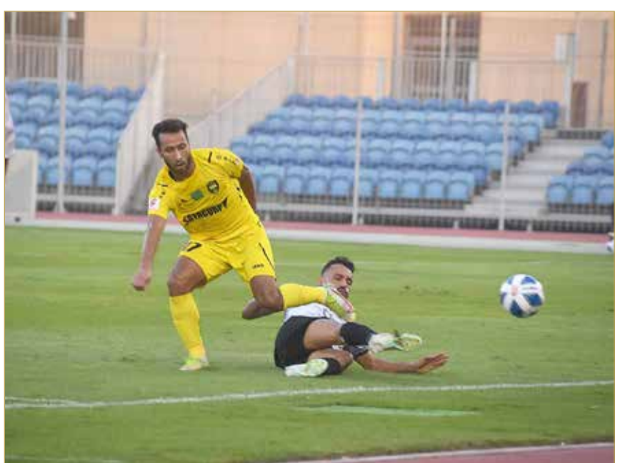
جانب من مباريات دوري ناصر

وجاءت القرارات كما يلي: 1. إنذار نادي مدينة عيسى لتأخير انطلاقة المباراة أمام أم الحصم في دوري الدرجة الثانية لمدة 5 دقائق؛ بسبب تعديل معدات اللاعبين. 2. إنذار النادي الأهلي لتأخير انطلاقة المباراة أمام الخالدية ضمن دوري ناصر بن حمد الممتاز لمدة 3 دقائق؛ بسبب تعديل معدات اللاعبين. 3. إنذار نادي الخالدية لتأخير انطلاقة المباراة 3 دقائق أمام الأهلي ضمن دوري ناصر بن حمد الممتاز؛ بسبب تعديل معدات اللاعبين، وتأخير بداية الشوط الثاني 4