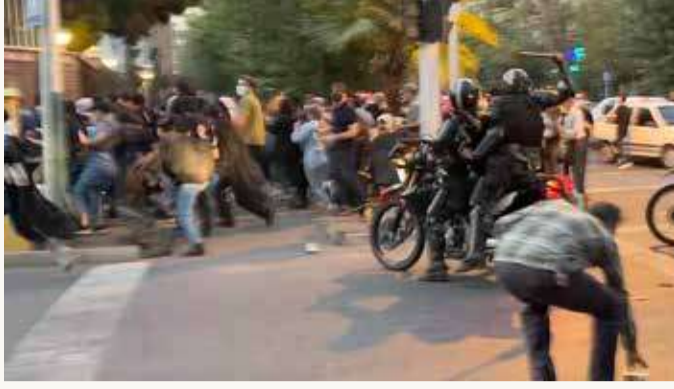
شرطي يرفع هراوة خلال تظاهرة في طهران

وقالت منظمة "هيومن رايتس ووتش" في بيان إن "وفاة امرأة بعد اعتقالها بسبب طريقة لبسها دليل على انحطاط فظيح" مؤكدة أنه "من الضروري للغاية إجراء تحقيق