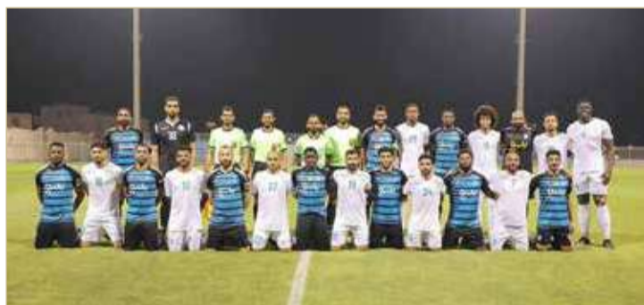
فريق البحرين والنهضة السعودي