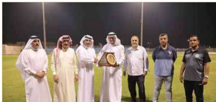
مسؤولو الناديين بعد توقيع الاتفاقية