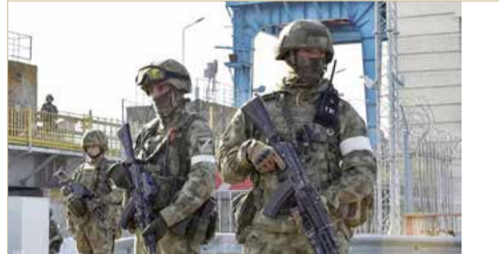
عناصر من الجيش الروسي في خيرسون

أوكرانيا والخاضعة لسيطرة القوات الروسية، استفتاء بشأن الانضمام إلى موسكو من 23 سبتمبر الجاري وحتى 27 منه. كذلك أعلنت الأراضي الانفصالية الموالية لروسيا في منطقة دونباس أنها ستنظم استفتاء مماثلاً في الفترة نفسها.