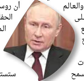
الرئيس الروسي فلاديمير بوتين