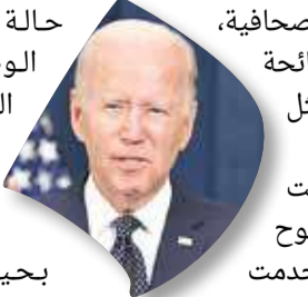
أمين عام الأمم المتحدة

يذكر أن إسرائيل وحزب الله خاضا حرباً استمرت شهراً عام 2006، قصفت إسرائيل خلالها أهدافاً في لبنان بينما أطلق "حزب الله" آلاف الصواريخ على مدن وبلدات شمال إسرائيل. وقال ستيفن تيسينيوني، قاضي المحكمة الفيدرالية الأميركية في بروكلين بولاية نيويورك في حكم صدر الجمعة إن المدعين نجحوا في إثبات انتهاك "حزب الله" لقانون مكافحة الإرهاب وحملوا الحزب المسؤولية.