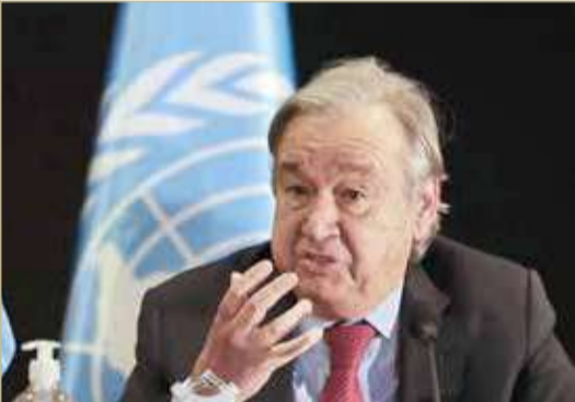
أمين عام الأمم المتحدة

الانقسامات الجيوسياسية للخطر. وأضاف: "إن يكون هناك تزيين للكلمات في تصريحاته، لكنه سيوضح الأسباب التي تحذروننا للأمل". وفي وقت سابق، دعا غوتيريش إلى اتخاذ إجراءات في خمسة مجالات لإحداث تحول في التعليم، وشدد على الحاجة إلى حماية الحق في التعليم الجيد للجميع، وخاصة الفتيات، في كل مكان، كما "يجب أن تكون المدارس مفتوحة للجميع، دون تمييز".