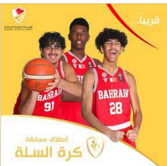
الصورة الترويجية لدوري خالد بن حمد لجيل الذهب لكرة السلة