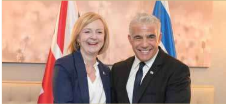
لابيد مصافحا ليز تراس في نيويورك

المكتب السياسي للحركة محمود الزهار خلال مؤتمر صحفي عقده في المسجد العمري الكبير وسط مدينة غزة. وقال الزهار إن "استمرار عدوان الصهاينة ووحشيتهم بحق القدس والمقدسات سيكون سببا في معركة كبرى نهايتها زوال الاحتلال". مؤكدا أن تلك "الانتهاكات لن تمر".