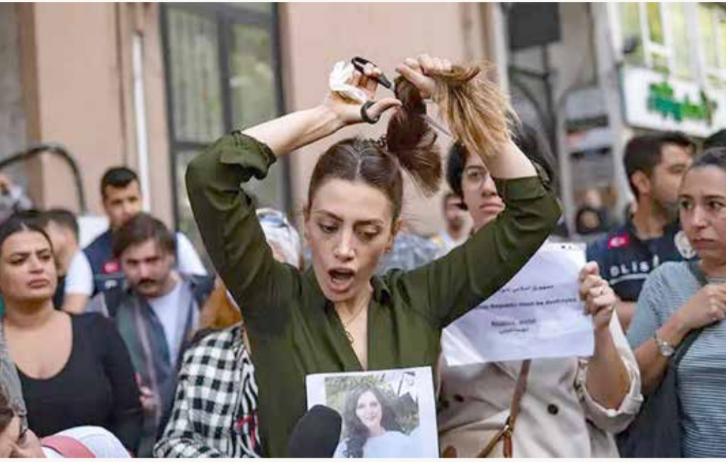
هتافات وشعارات مناهضة للنظام

فيديو تعود كما يبدو الى الأربعاء متظاهرين يحرقون صورة كبرى للواء قاسم سليماني الذي قتل بضربة أميركية في العراق في يناير 2020. في أماكن أخرى في البلاد، أحرق متظاهرون آليات للشرطة ورددوا هتافات معادية للسلطة بحسب ما أوردت وكالة الأنباء الإيرانية الرسمية. ردت الشرطة بإطلاق الغاز المسيل للدموع وقامت بالعديد من الاعتقالات. وأظهرت صور أخرى متظاهرين يتصدون لقوات الأمن. الصورة الأكثر انتشارا على شبكات التواصل الاجتماعي كانت لنساء يضرمن النار في حجابهن. وردد متظاهرون في طهران "لا للحجاب، لا للعامة، نعم للحرية والمساواة"، ولاققت هذه الهتافات صدى في نيويورك وإسطنبول.