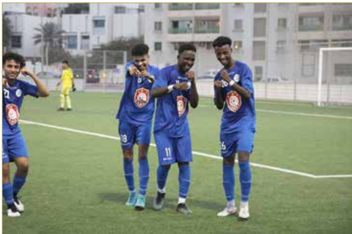
فريق أكاديمية مستقبل المحرق يحتفل بالانتصار

وسيحصل صاحب المركز الأول على 3 آلاف دينار وكأس البطولة مع الميداليات الذهبية، فيما سيحصل الثاني على 1500 دينار والميداليات الفضية وسيحصل الثالث على 1000 دينار والميداليات البرونزية، فيما خصصت جوائز لأفضل لاعب في كل مباراة بقيمة 20 ديناراً.