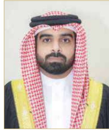
سمو الشيخ سلمان بن محمد آل خليفة

من جهته، قال رئيس الاتحاد البحريني للملاكمة عمر السليس "بداية، نتقدم بجزيل الشكر وعظيم الامتنان إلى سمو الشيخ سلمان بن محمد آل خليفة، على تفضله سموه برعاية البطولة، والتي تأتي ضمن خطط وبرامج الاتحاد الرامية لتطوير رياضة الملاكمة". وتابع "إن إقامة هذه البطولة تأتي متوافقة مع سياسات المجلس