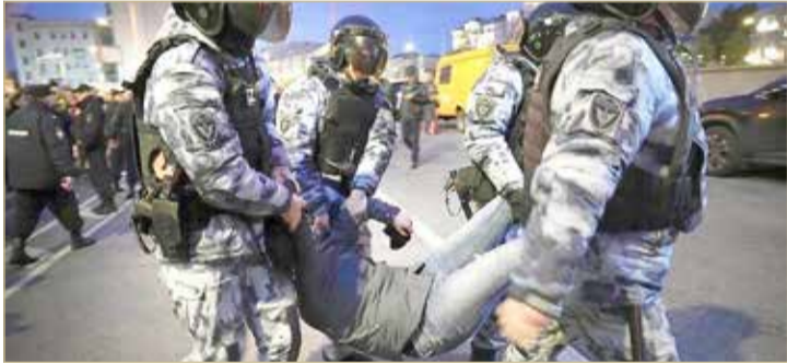
اعتقالات بالمتات في تظاهرات تندد بتعبئة جنود الاحتياط في روسيا

الدمار الشامل، أعلن نظيره الأوكراني عن 5 شروط غير قابلة للتفاوض لإرساء السلام. ودعا زيلينسكي في كلمة للجمعية العامة إلى فرض عقاب عادل ضد روسيا، وفق تعبيره. كما ناشد الأمم المتحدة لحرمان موسكو من حق الفيتو، وتشكيل محكمة خاصة بشأن روسيا وصدوق للتعويضات.