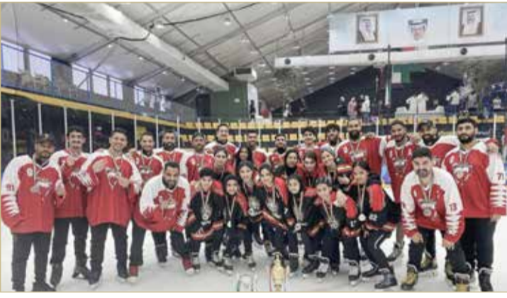
منتخب هوكي الجليد للرجال والسيدات