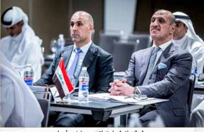
وفد العراق في اجتماع عمومية غرب آسيا

واضحاً من الاتحاد العراقي، من خلال احتضانه عدداً من بطولات اتحاد غرب آسيا وسط تنظيم ناجح ومميز لها وإشادات رسمية دولية وقارية وإقليمية حظيت بها. وأشار اتحاد غرب آسيا إلى مساعيه الدائمة والمتواصلة لدعم كرة القدم في العراق، وأكد وقوفه إلى جانب حق الجماهير العراقية الشغوفة والمميزة بمتابعة منتخب بلادها وبقيّة المنتخبات على ملاعب العراق وبمختلف محافظات ومدنه، باعتبار ما تشكله هذه الجماهير دائماً من إضافة نوعية للمباريات والبطولات التي تقام في العراق.