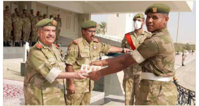
مدير أركان الحرس الوطني يرعى حفل تخريج دورة للمستجدين العسكريين

رعى مدير أركان الحرس الوطني الفريق الركن الشيخ عبدالعزيز بن سعود آل خليفة، حفل تخريج دورة للمستجدين العسكريين، والتي انعقدت تحت إشراف مدرسة التدريب بالحرس الوطني، أمس (22 سبتمبر) بمعسكر الصخير، وبحضور كبار ضباط الحرس الوطني. وبعد وصول مدير أركان الحرس الوطني، جرى عزف سلام الفريق، ثم تفقد الخريجين المستجدين، ليبدأ الحفل بعد ذلك بتلاوة آيات من الذكر الحكيم، تلتها كلمة ترحيبية ألقاها أمر مدرسة التدريب رحب من خلالها براعي الحفل والحضور، وأكد على الدعم والاهتمام الكبير الذي تحظى به المنظومة التدريبية