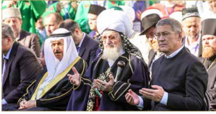
احتفالات باشكورتوستان بمناسبة مرور أكثر من ألف ومائة عام على دخول الإسلام

ولفت إلى أن "الرسالات والشرايع التي بعث الله عز وجل بها الأنبياء والرسل قد وضعت منهجاً لإصلاح البشرية وتقويم سلوكها؛ يقوم على البر والتقوى ومكارم الأخلاق والوسطية، وينهى نهياً قاطعاً عن الكراهية والتطرف والإرهاب لكي يعيش الجميع في تعاون وسلام". ودعا إلى إعلاء الحوار الثقافي باعتباره ضرورةً ووسيلةً للتفاهم تؤكدتها الرسالات الربانية، ومطلباً إنسانياً وأسلوباً حضارياً يصل الإنسان من خلاله إلى النضج الفكري والنفسي. مجدداً تأكيد مملكة البحرين على أهمية الحوار بين أصحاب الأديان والثقافات بما يعزز أسس التعايش والتعاون والتفاهم. وفي سياق متصل، شارك الشيخ عبدالرحمن بن محمد في حفل افتتاح المبنى الجديد للجامعة الإسلامية الروسية التابعة للظاهرة الدينية المركزية لمسلمي روسيا، معرباً عن تهنائه العميقة بهذه المناسبة، سائلاً الله تعالى أن يوفق القائمين على هذه الجامعة العريقة لخدمة الدين والعلم والقيم، بحيث تكون منارة للخير والمعرفة والسماحة. كما التقى رئيس المجلس مساء الأربعاء الماضي المفتي العام ورئيس النظرة الدينية المركزية لمسلمي روسيا في المقر التاريخي لإدارة الدينية. وخلال اللقاء بحث الجانبان العلاقات الودية الطيبة التي تجمع البلدين الصديقين وشبھهما، وسبل تطوير التعاون المشترك بين المجلس الأعلى للشؤون الإسلامية في مملكة البحرين وإدارة الدينية المركزية لمسلمي روسيا بما يخدم القضايا المشتركة.