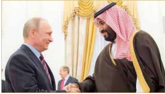
الأمير محمد بن سلمان مع الرئيس الروسي فلاديمير بوتين

الرياض - وكالات أكد ولي العهد السعودي الأمير محمد بن سلمان بن عبدالعزيز آل سعود خلال اتصال هاتفي، بإدارة به مساء الخميس مع الرئيس الروسي فلاديمير بوتين "استعداد المملكة لبذل المساعي الرامية للوصول لحل سياسي للأزمة مع أوكرانيا". وذكرت وكالة الأنباء السعودية (واس) مساء الخميس "أن الرئيس بوتين قدم في بداية الاتصال شكره لولي العهد على مساهمته الفاعلة والمتميزة في إنجاح عملية تبادل الأسرى". وأكد ولي العهد السعودي استعداد المملكة لبذل كل المساعي الحميدة ودعم جميع الجهود الرامية للوصول لحل سياسي للأزمة. ونوه بوتين بانضمام المملكة لمنظمة شنغهاي للتعاون بصفة شريك حوار، مؤكداً تطلع الأعضاء لمساهمة المملكة الفاعلة في أعمال المنظمة وفقاً لـ"واس". (16)