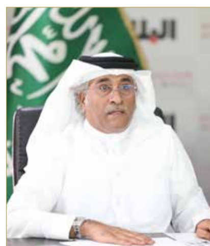
رئيس التحرير ملقياً كلمته بالمنتدى

القائد التاريخي عبدالعزيز آل سعود من أعظم زعماء القرن العشرين عندما استطاع توحيد العرب في شبه الجزيرة العربية ويحولهم إلى دولة واحدة وصاعدة بقيم العدالة والأمن والاستقرار. وتابع: عندما أتحدث عن العلاقة التاريخية بين التامة والسعودية، فإنني أتحدث عن علاقة أخوية مع بعضها البعض، وتلخص جملة جلالة الملك المعظم إن القلوب مجتمعة عمق العلاقات الوطيدة بين القيادتين والشعبين الشقيقين. وشكر المردي رئيس مجلس الشورى على رعايته لمنتدى "البلاد" للعام الثاني على التوالي والذي يبين مستوى زخم العلاقات المشتركة بين البلدين.