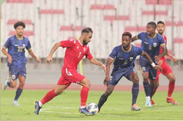
من لقاء منتخبنا والرأس الأخضر ودياً