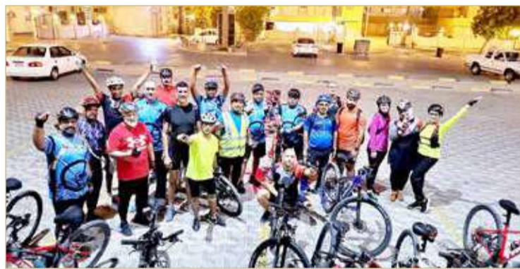
فريق دلمونيا للدراجات الهوائية

كورونا واستمرت، حيث ينشد جميع هواة ومحبو ولاعبو الدراجات الجهات المسؤولة في الدولة والاتحاد الرياضي للدراجات على اتخاذ كافة الإجراءات اللازمة التي تحرص على سلامة وأمن الدراج في الطريق وخصوصاً أن هذه الرياضة لم تعد مخصصة فقط للرياضيين