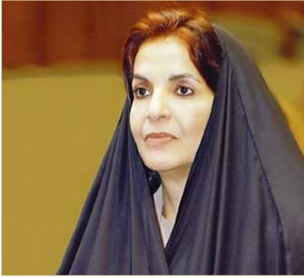
سمو الأميرة سبيكة بنت إبراهيم