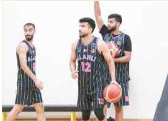
تدريبات سلة الأهلي