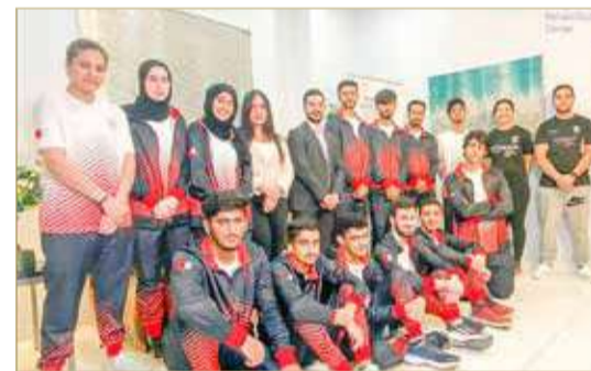
اللاعبون في صورة جماعية بعد إجراء الفحوصات بالعيادة

تماشياً مع توجهيات النائب الأول لرئيس المجلس الأعلى للشباب والرياضة رئيس الهيئة العامة للرياضة رئيس اللجنة الأولمبية البحرينية سمو الشيخ خالد بن حمد آل خليفة، تم إجراء عدد من الفحوصات الطبية والتمارين اللازمة للاعبين المنتخب الوطني للرياضات الإلكترونية في عيادة Intouch Clinic. ويأتي إجراء هذه الفحوصات الطبية تماشياً مع توجهيات سموه بإلزامية إجراء الفحص الطبي لجميع اللاعبين والحكام والطواقم الفنية قبل وبعد جميع الدوريات بما يتماشى مع توجهيات سمو الشيخ ناصر بن حمد آل خليفة ممثل جلاله الملك للأعمال الإنسانية وشؤون الشباب، رئيس المجلس الأعلى للشباب والرياضة للاعتناء بصحة الرياضيين، وأن الاهتمام والعناية بصحة ولياقة ممارسي الرياضة عنصر جوهري يتكامل مع برامج واستراتيجيات القطاع الرياضي في مملكة البحرين.