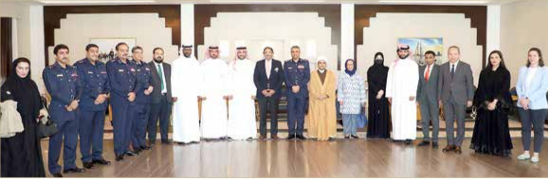
المنامة - وزارة الداخلية

ترأس العميد فواز حسن الحسن آمر الأكاديمية الملكية للشرطة اجتماعين تنسيقيين للخطة الوطنية لحقوق الإنسان بمملكة البحرين 2022-2026 بحضور ممثلي الجهات المعنية. وفي مستهل الاجتماعين، أكد آمر الأكاديمية الملكية للشرطة أن عقد هذين الاجتماعين يأتي بناءً على المحور الأول من البرنامج التنفيذي الخاص بالخطة الوطنية لحقوق الإنسان، حيث تضمن الهدف الأول تكليف الأكاديمية الملكية للشرطة كجهة رئيسية بإعداد برنامج تدريبي لبناء القدرات الخاصة بإنفاذ القانون والعدالة الإصلاحية، وجاء الهدف الثاني بتكليف الأكاديمية كجهة رئيسية، بإعداد مشروعات لتعزيز الأمن في مكافحة الإرهاب في إطار احترام حقوق الإنسان على أن تكون المؤشرات من خلال برامج التدريب والمساهمة في جهود التعاون الدولي للتصدي للجريمة الإرهابية.