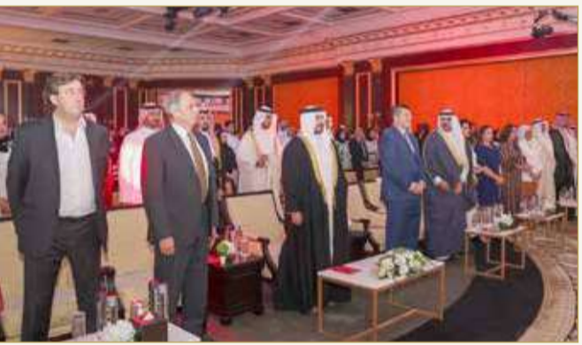
احتفال الجامعة البريطانية بتخريج 94 خريجاً وخريجة (03)

الجامعة البريطانية في البحرين... توظيف 80% من خريجي الفوج الثاني في مختلف المجالات