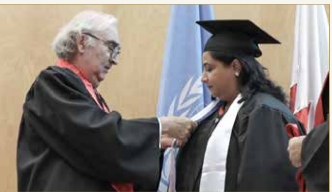
تكريم الشخة رنا بنت عيسى في حفل بمقر الأمم المتحدة في جنيف (07)

جامعة السلام تمنح درجة الدكتوراه الفخرية للشيخة رنا بنت عيسى