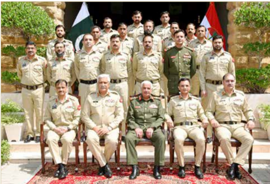
سمو رئيس الحرس الوطني يلتقي قائد الفيلق الخامس بالجيش الباكستاني بمدينة كراتشي