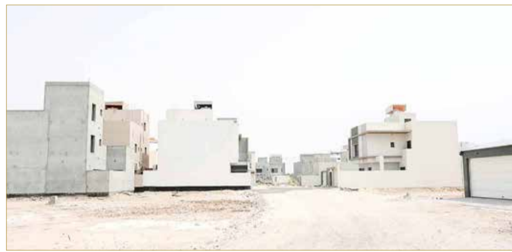
أحد المخططات السكنية الحديثة بقرية كركزان

الجامعة البريطانية في البحرين... توظيف 80% من خريجي الفوج الثاني في مختلف المجالات