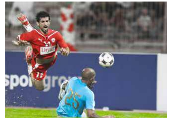
"البلاد" تفوز بأفضل صور في مسابقة كأس الملك للعام 2009