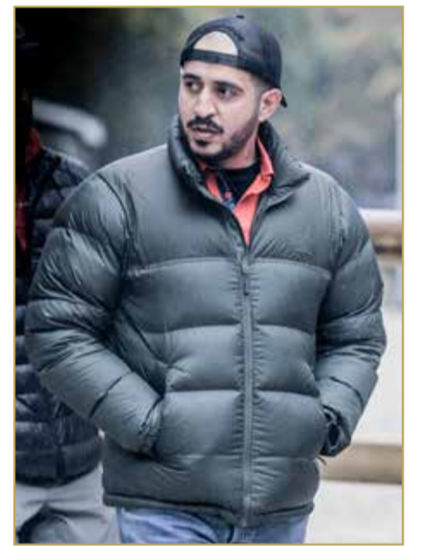
فونتين بلو (فرنسا) - المكتب الإعلامي:

شهد عاهل البلاد المعظم صاحب الجلالة الملك حمد بن عيسى آل خليفة بطولة فونتين بلو الدولية لسباقات القدرة بجمهورية فرنسا بمشاركة ممثل جلالة الملك للأعمال الإنسانية وشؤون الشباب قائد الفريق الملكي للقدرة سمو الشيخ ناصر بن حمد آل خليفة ومتابعة النائب الأول لرئيس المجلس الأعلى للشباب والرياضة رئيس الهيئة العامة للرياضة رئيس اللجنة الأولمبية البحرينية سمو الشيخ خالد بن حمد آل خليفة، حيث حقق الفريق الملكي مراكز متقدمة في سباق 160 كم وسباق 127 كم جاءت بعد إنجاز سمو الشيخ ناصر بن حمد آل خليفة في بطولة العالم للجياد ذات 8 سنوات التي أقيمت في إسبانيا.