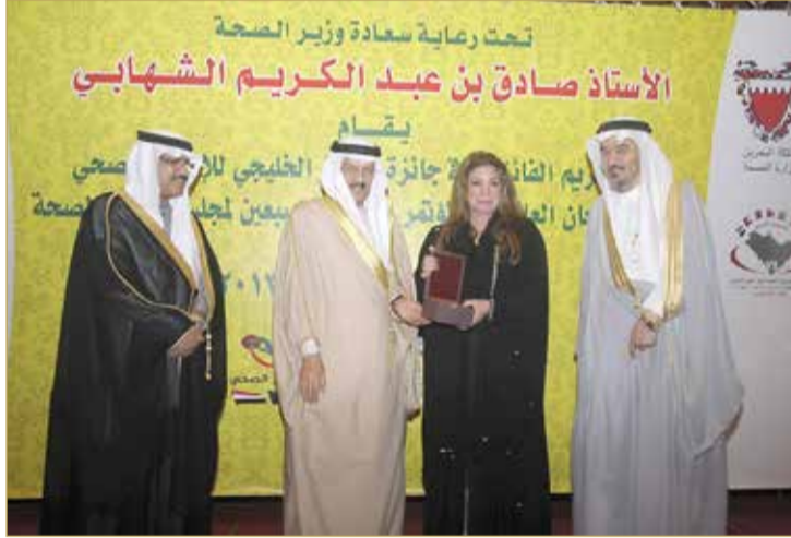
"البلاد" تفوز بجائزة التميز للإعلام الصحي 2013