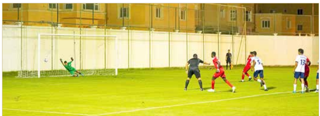
جانب من لقاء "طموح" و"النجمة"

حقق فريق أكاديمية طموح لكرة القدم تحت (17 سنة) انتصارًا مستحقًا بفوزه المثير في لقاءه الودي السابع وهذه المرة على حساب منافسه فريق النجمة (تحت 21 سنة)، ليواصل بذلك سلسلة ذهبية خالية من أي تعثر في التجارب التحضيرية مع الأندية المحلية، وبنيتيجة ثلاثة أهداف مقابل هدف واحد، وذلك في اللقاء الذي أقيم بينهما على ملعب نادي الحد. ولم يمهل لاعبو أكاديمية طموح لاعبي الفريق المنافس وقتًا للدخول في أجواء المباراة، وسيطروا على منطقة المناورات بصورة كاملة، بأسطرين أفضليتهم على النجمة بطريقة شبه كلية. وسبق لفريق أكاديمية طموح الفوز في أول مباراة تحضيرية محلية على حساب فريق الحد بسداسية