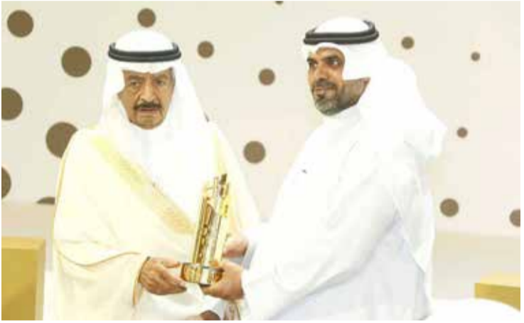
"البلاد" تفوز بجائزة أفضل صورة في جائزة خليفة بن سلمان للصحافة