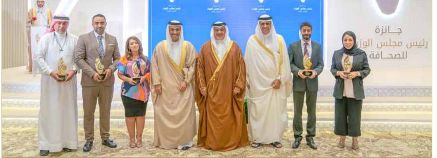
سمو ولي العهد رئيس الوزراء مكرما الفائزين بجائزة سموه للصحافة