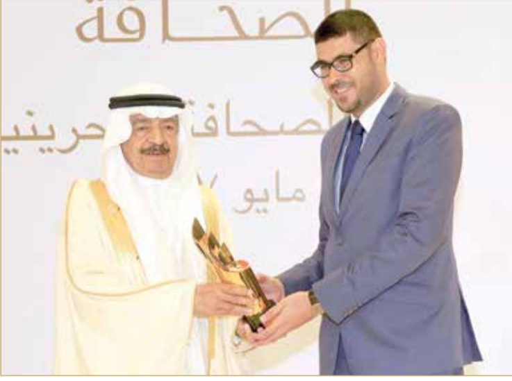
فوز خليل إبراهيم بجائزة أفضل صورة في جائزة خليفة بن سلمان للصحافة