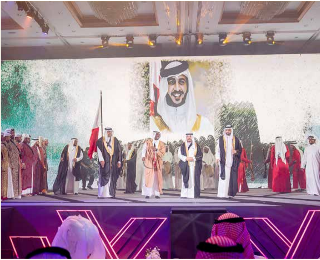
جانب من حفل الافتتاح

وتقام اليوم "السبت" منافسات اليوم الثامن من البطولة على 3 فترات، والتي تشهد مشاركة بحرينية متمثلة باللاعب