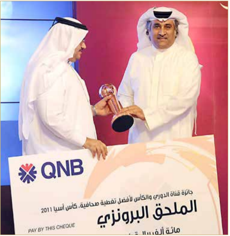
تتويج "البلاد سيورت" بجائزتي الملحق البرونزي في كأس الخليج 24 وكأس آسيا 2011