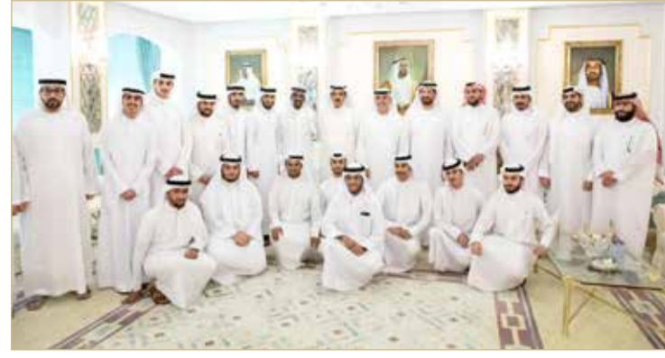
وزير التربية مع البحرينيين الدارسين بجامعة محمد بن زايد

وأعرب الوزير عن شكره لما يحظى به الطلبة البحرينيون الدارسون في هذه الجامعة من رعاية واهتمام، وكذلك مساواتهم بأشقائهم الطلبة من أبناء دولة الإمارات العربية المتحدة الشقيقة، مشيداً بالمستوى المتطور والمتقدم الذي وصلت إليه الجامعة التي تعتبر صرحاً علمياً، والبرامج الأكاديمية والبحثية والتدريبية التي تقدمها، والتي تعبر عن مستوى التعليم العالي في هذا البلد الشقيق. كما أشاد المزورعي بالمستوى المشرف للطلبة البحرينيين الدارسين في الجامعة، وما يبذلونه من جهود طيبة أثناء دراستهم، متمنياً لهم دوام التوفيق والنجاح.