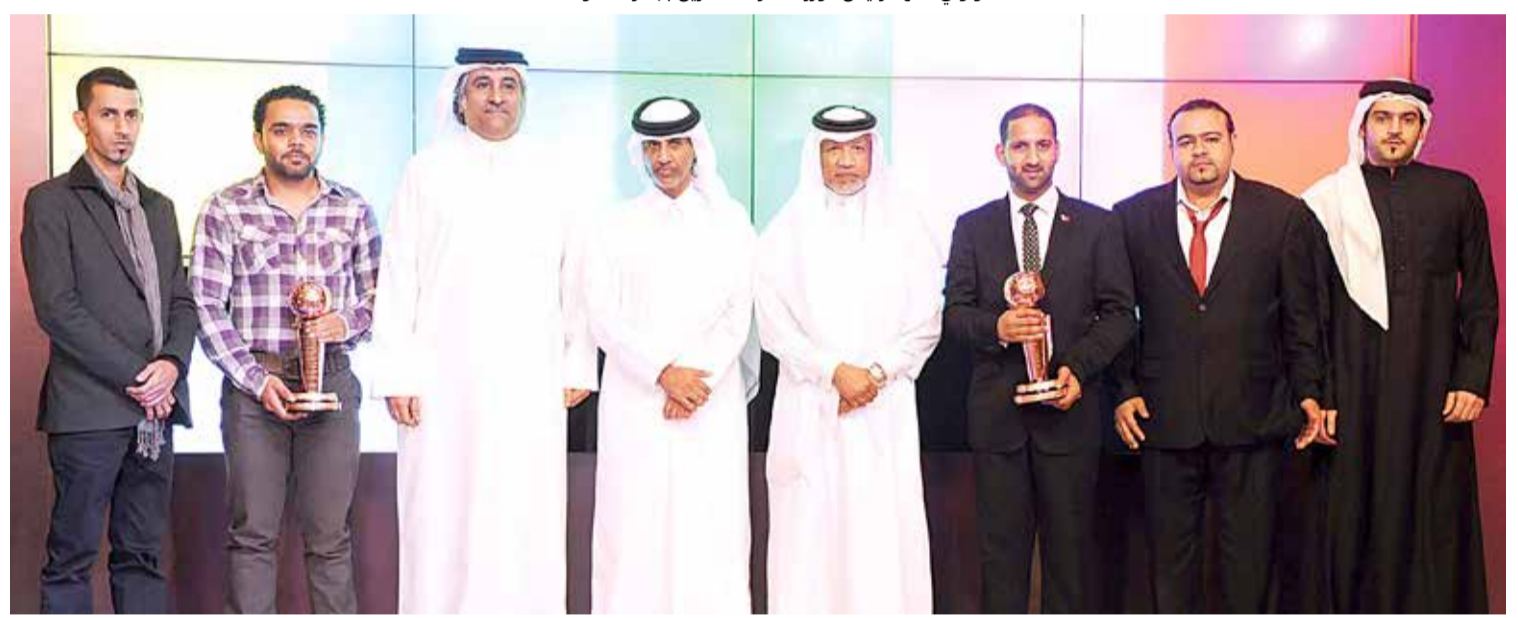
تتويج "البلاد سيورت" بجائزتي الملحق البرونزي في كأس الخليج وكأس آسيا 2011