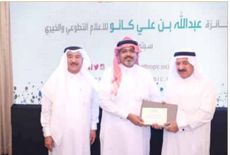
فوز "البلاد" بجائزة عبدالله بن علي كاتو للإعلام