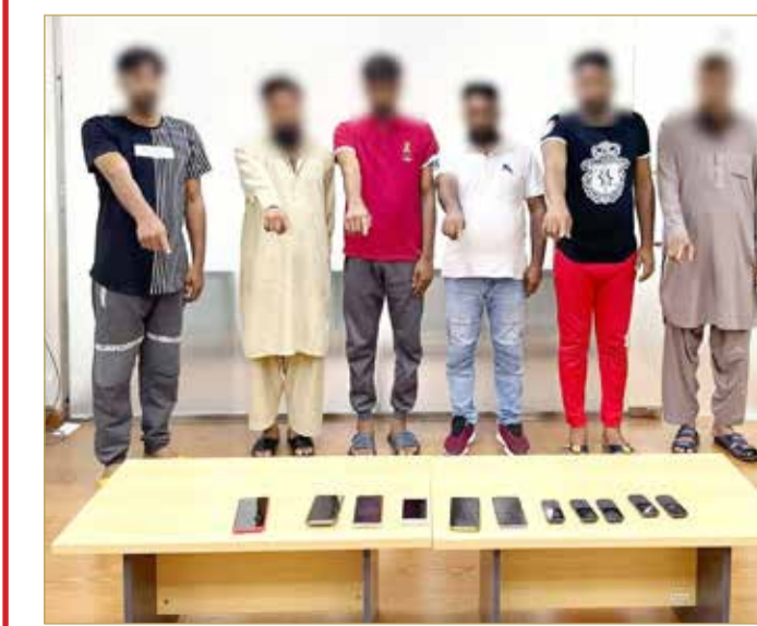
اختراق الحساب البنكي والاستيلاء على المبالغ المالية الموجودة فيه. وأهاب مدير عام الإدارة العامة لمكافحة الفساد والأمن الاقتصادي والإلكتروني بالمواطنين والمقيمين عدم التجاوب مع تلك الاتصالات، حيث إن البنوك لن تطلب البيانات الشخصية أو المصرفية عبر الهاتف أو أي وسيلة أخرى، وفي حال التعرض للنصب أو الاحتيال، فإنه يجب الاتصال فوراً بالبنك الذي يتم التعامل معه لإيقاف الحساب وتقديم بلاغ لدى إدارة مكافحة الجرائم الاقتصادية عبر الاتصال على الخط الساخن 992 لاتخاذ الإجراءات اللازمة حياله.

التنسيق مع جميع البنوك لوقف عمليات التحويلات البنكية كما تم التحفظ على مبالغ مالية تقدر قيمتها بـ 42 ألف دينار، مشيراً إلى أنه جاري اتخاذ الإجراءات القانونية المقررة تمهيداً لإحالة القضية إلى النيابة العامة. وأكد أن الأساليب الإجرامية الإلكترونية تتطور بشكل يومي ومستمر، حيث يقوم المحتالون بالنصب على ضحاياهم من خلال إرسال روابط إلكترونية تتضمن رسالة وهمية من بعض الجهات الرسمية، كبريد البحرين ورسالة نصية تتضمن تحديث برنامج البنفت أو تحديث الحساب البنكي والبطاقات البنكية، وعند فتح تلك الروابط يتم