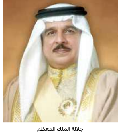
جلالة الملك المعظم