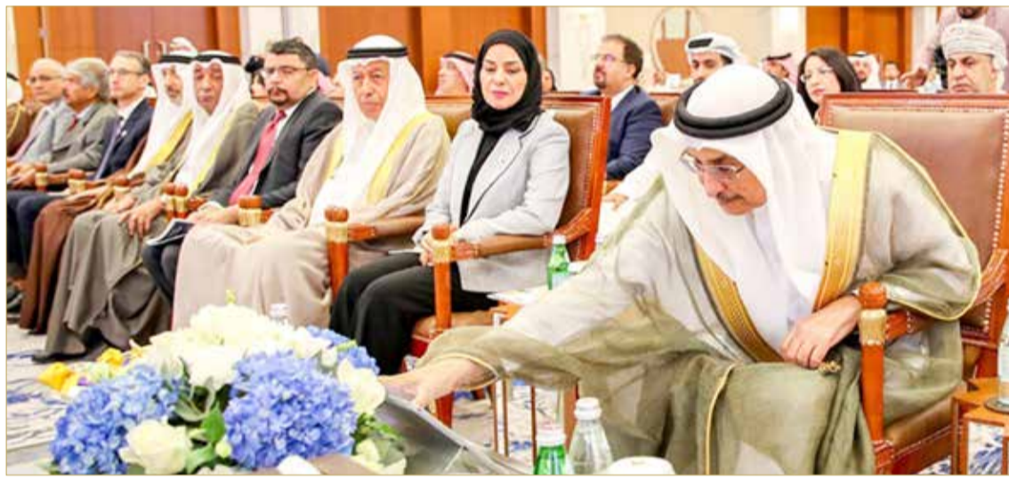
درع البلاد للمسؤولية الاجتماعية للشركات أحد أبرز مشروعات صحيفة البلاد في العام 2022