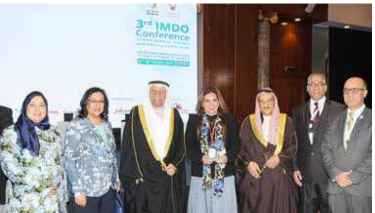
"البلاد" تحصد جائزة التميز الإعلامي الصحي للعام 2020